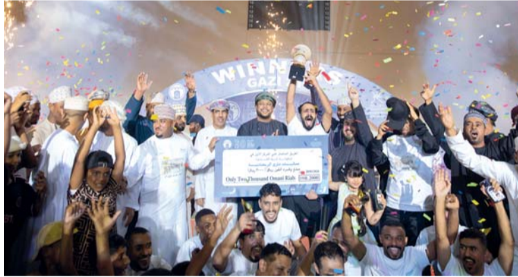
تتويج فريق أوميفكو بكأس البطولة

صوّر من عبدالله بن محمد باعلوي: اختتمت بالصالة المغلقة بالمجمع الرياضي بصور الفعاليات الرمضانية الرياضية غازي ٢١ والتي نظمتها إدارة الثقافة والرياضة والشباب بمحافظة جنوب الشرقية، وبدعم ورعاية من المؤسسة التنموية للشركة العمانية للغاز الطبيعي المسال وبمشاركة واسعة من مختلف المؤسسات الحكومية والخاصة والأندية، واشتملت على مسابقات في القدم والطائرة الشاطئية والشطرنج. رعى ختام الفعاليات سعادة يوسف بن سالم بن ناصر المخيني عضو مجلس الشورى ممثل ولاية صور وبحضور المكرم الدكتور عامر بن ناصر المطاعني عضو مجلس الدولة ورئيس التنفيذي للمؤسسة التنموية للشركة العمانية للغاز الطبيعي المسال