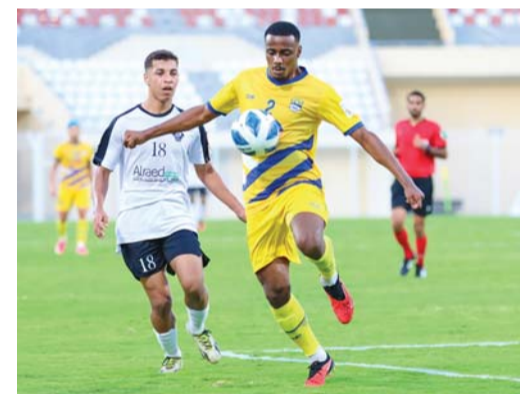
■ من مباريات دوري عمانتل

الشباب يسعى للهروب من السقوط والعودة الأولى، فيما صحار هدفه أمام ظفار الاستمرار في المنافسة على مركز متقدم، حيث يحل رابعاً في الوقت الحالي متخلفاً عن النهضة ونادي عمان بأربع نقاط كاملة بقي أن تعرف بأن جميع المباريات تقام في تمام الساعة العاشرة مساءً اليوم.