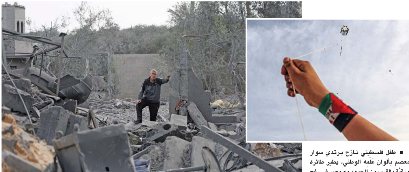
فلسطيني يتفقد أنقاض مبنى هدمه القصف الإسرائيلي في مخيم المغازي للاجئين الفلسطينيين وسط قطاع غزة. فلسطيني ينادي بالسلام في غزة.

مكسيكو. أ.ف.ب: عُثر على جثث ثمانية أشخاص يرجح أنهم مهاجرون، ويعتقد أنهم قُضوا في حادث على متن مركب على شاطئ في ولاية واخاكا في جنوب المكسيك، وفق بيان مكتب المدعي العام. وجاء في البيان «يعتقد أنهم ضحايا حادث أثناء سفرهم على متن مركب قبالة سواحل واخاكا». ونجا رجل وفق البيان. وقال البيان إن «المعلومات الأولية تشير إلى أن الجثث التي عُثر عليها قد تكون لمهاجرين» مضيفاً أنه يُعتقد أن الضحايا «من أصول أسبوعية، وعثر على