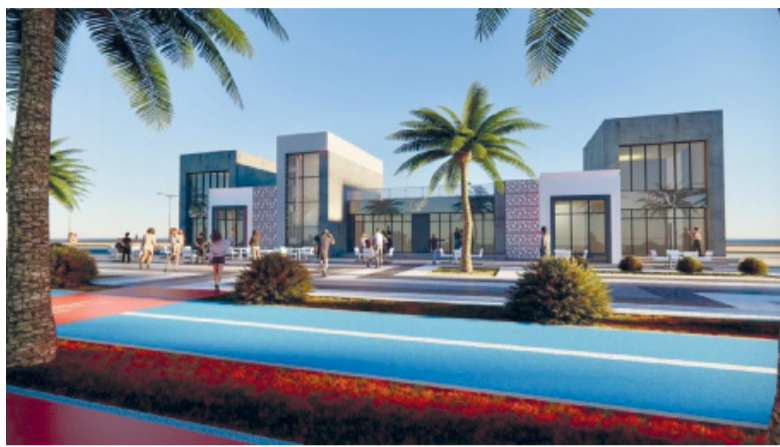
المشروع يهدف لتوفير خدمات تلبي احتياجات أفراد المجتمع

الباطنة في تطوير المرافق العامة التي تمتاز بها المحافظة، وسعيًا لإيجاد واجهات ترفيهية وسياحية تساهم في دعم خطط التنوع الاقتصادي والتنمية الشاملة، بما يتماشى مع رؤية عمان ٢٠٤٠. أما فقال سعادة المهندس محافظ جنوب الباطنة بأنها ستشتمل تطوير وتجميل بوابة الرستاق، إنشاء الواجهة البحرية بولاية المصنعة، إنشاء الواجهة البحرية بولاية بركاء، مشروع «رمال بارك» بولاية نخل في المرحلة الأولى، والخدمات الاستشارية لمشروع تطوير «بوليفارد الخور» بولاية بركاء، والخدمات الاستشارية لمشروع «سبتي ووك» بولاية الرستاق، بالإضافة إلى مشروع «الواجهة مول» بولاية الرستاق وغيرها من المشاريع التي سوف يعين عنها خلال الفترة المقبلة.