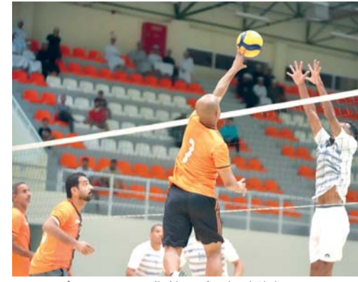
من مباراة اتحاد دغمر والمعالي - تصوير: أنس الغداني