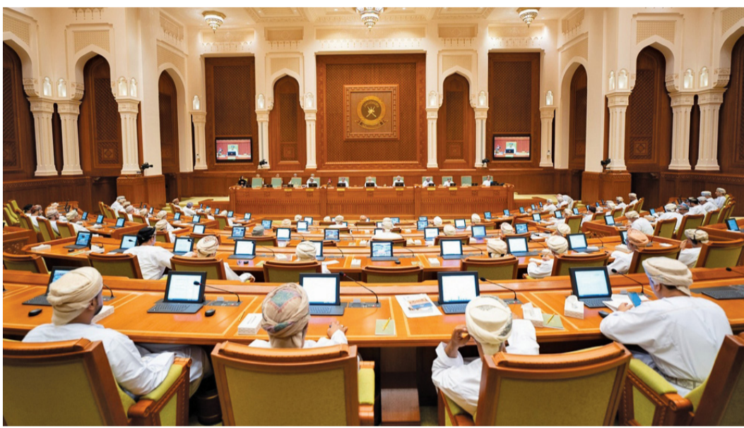
مجلس الشورى أثناء استضافته وزير الثروة الزراعية والسمكية وموارد المياه

وتهدف رؤية مجلس التعاون للأمن الإقليمي إلى الحفاظ على الأمن الإقليمي واستقرار المنطقة وازدهار شعوبها ومعالجة التحديات التي تواجهها وتحولها إلى فرص للتنمية والازدهار، وتعزيز الأمن والسلم الدوليين من خلال تسوية الخلافات بالطرق السلمية.