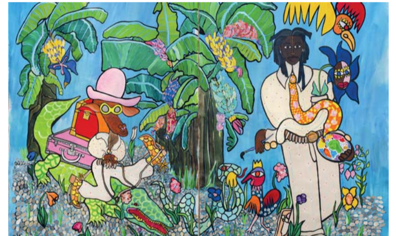
اللوحات التصويرية تحمل ألواناً متنوعة تبرز بين الحلم والواقع

باريس. الغمانية: تحتضن دار «عروض ١٩٣» في العاصمة الفرنسية باريس معرضاً يعرض لأول مرة للفنان التشكيلي الكاميروني (فرانسيس أسوا كالو) المعروف بلقبه في الأوساط الفنية (الطفل المبكر)، والذي يستخدم الألوان بكل أريحية للتغني بالحياة في تاليف وفرح وحرورية للأجساد. وتحمل اللوحات التصويرية للفنان ألواناً متنوعة تبرز بين الحلم والواقع، في المعرض المستمر لغاية ٢٧ بريل القادم، حيث يقود (الطفل المبكر) زوار الحدث إلى «واحة الوفرة» الخاصة به ليحدثهم عن الهجرة والحياة اليومية للأفارقة في باريس، ويحرص الفنان الكاميروني على إبراز أشخاصه الذين يتفنسون فرح الحياة رغم