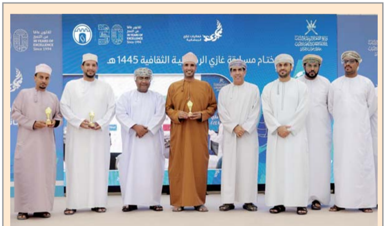
فريق إدارة حماية المستهلك الحائز على المركز الأول

ويطرّق الباحث لتعريف الفساد الإداري ومظاهره، وكيف أنه تحوّل إلى ظاهرة عالمية لا تخلو منه أيّة دولة، ولكن ربّما هناك تفاوت في مدى انتشاره وتفتيشه وطرق مواجهته، لذلك ظهرت الحاجة لمكافحة الفساد في الدول العربية، من خلال إنشاء جمعيات ومنظمات وطنية تعنى بالشفافية ومكافحة الفساد، كما تم تحليل أوضاع الفساد من خلال تقارير قطرية أعدت عن ثمان دول عربية خلال الأعوام السبعة الأخيرة في التقرير العالمي عن الفساد الذي يصدر من قبل منظمة الشفافية الدولية. وجرائم الفساد هي أعمال غير نزيهة يقوم بها شخص أو عدة أشخاص يُشغلون مراكز وظيفية عامة. ويتناول