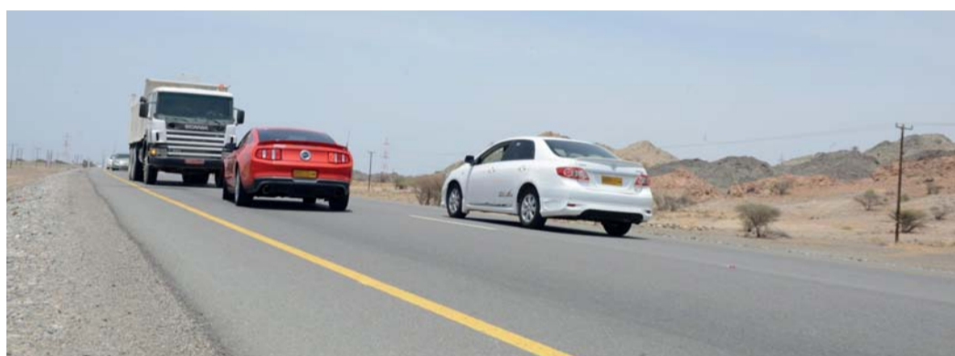
الشرطة تؤكد أهمية التركيز أثناء القيادة والتخلي بالتسامح

والنارية والهوائية تُشكل خطورة كبيرة على سلامة سائقيها وتقع بسببها حوادث خطيرة ومميتة بسبب الاستخدام الخاطئ لهذه الدراجات وقلة الوعي وقوانين تستوجب الالتزام