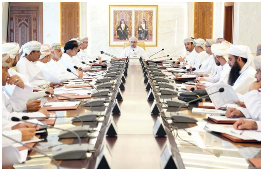
الاجتماع استعرض عدداً من الموضوعات الخدمية

حديقة عامة بمنطقة وادي قريات بولاية بهلاء، كما أطلع المجلس على الإحصائية الشهرية لشهر فبراير الصادرة من المديرية العامة للعمل بالمحافظة، وناقش المجلس إعادة مدير دائرة البلدية في سمان بشان تحديد مسارات الطرق وتمهيدتها في المخططات السكنية. وفي ختام الجلسة قام سعادة الشيخ المحافظ بالرد على تساؤلات واستفسارات أعضاء المجلس بكل شفافية ووضوح، وخرج الاجتماع بعدد من التوصيات والرؤى والتطلعات التي من شأنها تطوير المحافظة في مختلف الجوانب.