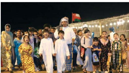
إحدى فعاليات الأطفال