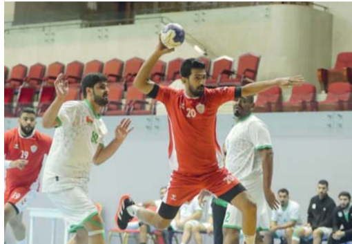
من مباراة نادي عمان وخصب

ودع نادي خصب منافسات دوري الدرجة الأولى لكرة اليد وهبط إلى مصاف دوري الدرجة الثانية في الموسم الرياضي ٢٠٢٤/٢٠٢٥ برفقة نادي البشائر الذي اعتذر عن المشاركة قبل انطلاق الدوري وضمن ناديا نزوى وصلالة البقاء في دوري الدرجة الأولى، ولكن لم يتأهلا إلى منافسات الدور الثاني لدوري عام السلطنة للدرجة الأولى لكرة اليد للموسم الرياضي ٢٠٢٣/٢٠٢٤م حيث تأهلت اندية اهلي سداب ونادي عمان ومسقط والسيب إلى منافسات الدور الثاني الذي سينطلق يوم ١٣ ابريل القادم ويلعب دوري من دورين «ذهاب واياب» تجميع نقاط. وقد اختتم نادي خصب مشواره امس الاول في اخر مباراة له بالدور الاول بتعرضه الى خسارة أمام نادي عمان بنتيجة ٣٦/٢٠ في المباراة التي جرت أحداثها على ملعب الصالة الرئيسية بمجمع السلطان قابوس الرياضي ببوشير ليودع المنافسات مبكرا. وتبقي ٤ مباريات في الدور الأول، حيث تقام يوم الجمعة القادم مباراة واحدة تجمع نادي عمان مع نزوى في الساعة العاشرة مساء على ملعب الصالة الرئيسية بمجمع السلطان قابوس الرياضي