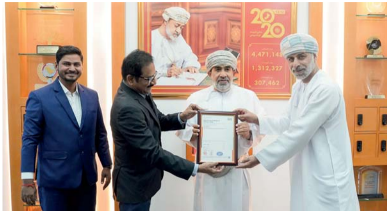
الشهادة ستتيح للمركز إمكانية تحقيق أعلى الدرجات الأمنية

مسقط، العُمانية: حصل المركز الوطني للإحصاء والمعلومات على شهادة الأيزو في نظام إدارة أمن المعلومات التي تمنحها المنظمة الدولية للمعايير ISO نظير تطبيقه أعلى مستويات التميز في مجال حماية وأمن المعلومات. ووضح سعادة الدكتور خليفة بن عبد الله بن حمد البرواني، الرئيس التنفيذي للمركز الوطني للإحصاء والمعلومات، أن حصول المركز على شهادة الأيزو 27001، جاء نتيجة الجهود الحثيثة التي يبذلها في سبيل توفير بيئة إحصائية ومعلوماتية آمنة في جميع المهام والأعمال المناطة به وتحديثه لخدماته الإلكترونية والتزامه بواباته الإلكترونية ومنصاته الرقمية بتطبيق أعلى المعايير الأمنية الدولية، واعتماده على معايير الضوابط الأمنية لحماية المعلومات ضد الأخطار الأمنية. وبيّن سعادته أن منح المركز شهادة الأيزو 27001 جاء بعد نجاحه في اجتياز جميع جولات التقييم والتدقيق للتحقق من الالتزام بمتطلبات هذا المعيار، مما يعكس مدى كامل برنامج أمن المعلومات وحماية البيانات المطبق في المركز الوطني للإحصاء والمعلومات. وقال سعادة الرئيس التنفيذي للمركز الوطني للإحصاء والمعلومات أن هذا الإنجاز جزء من برنامج