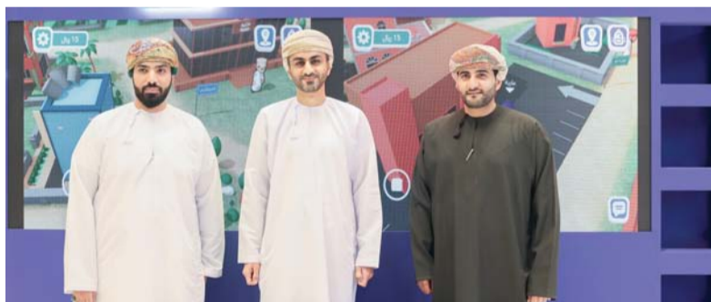
اللعبة تساهم في جعل الأطفال يخوضون رحلة ريادة الأعمال