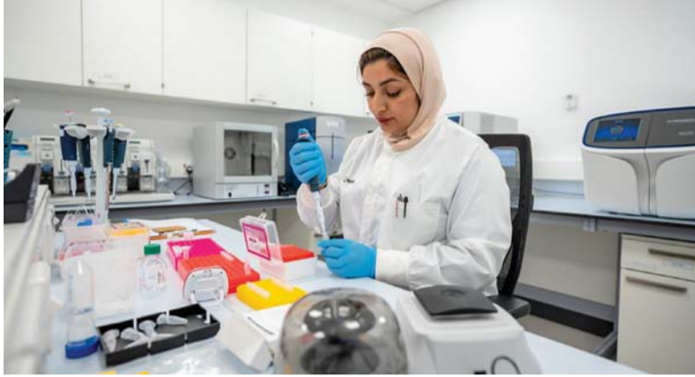
الدراسة شملت ٥٣ مصاباً بالسرطانات الهضمية

احتمالية ارتباط وجود تغييرات في جين DPYD لدى بعض الحالات بزيادة شدة الأعراض الجانبية المصاحبة للعلاج الكيماوي. فضلاً عن ذلك، فإن مستوى المضاعفات الجانبية الملاحظة لدى العمانيين الذين شملتهم الدراسة يعد مرتفعاً مقارنة بالمستويات المرصودة عالمياً خاصة الانخفاض في عدد خلايا الدم البيضاء، مما يتطلب تقليل جرعة العلاج بشكل أكثر تكراراً.