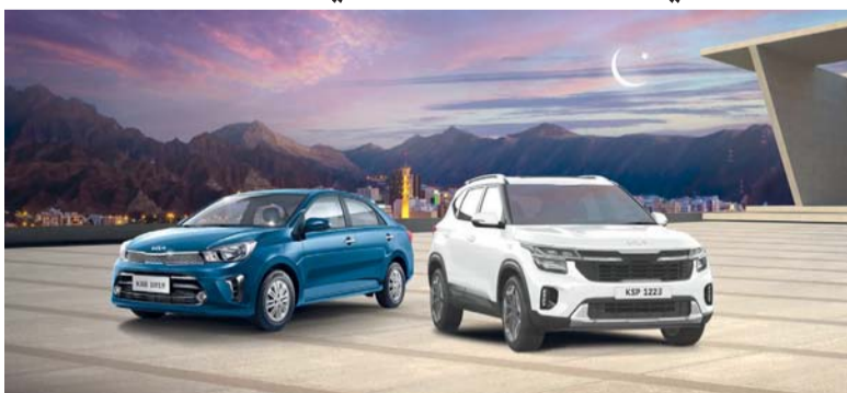
بيجاس مجهزة بمجموعة من الميزات والتكنولوجيا

الله عز وجل على تحقيق أمنيته، وإلى شركة كيا بسلطنة عمان لتقديم هذه الفرصة الرائعة لنا لتكون احد الفائزين مع كيا. لقد كانت عائلتي دائماً من عملاء كيا، ولهذا السبب أتحت لي الفرصة للقيادة والشعور وتجربة كل ما تشتهر به كيا. وسيتم إجراء السحب الكبير في ٦ مايو المقبل حيث يمكن لعميل واحد محظوظ أن يفوز بسيارة سيلتوس. لذا سارع بالحجز اليوم لتحصل على مكافآت ضخمة من كيا في شهر رمضان المبارك. تعتبر سيارة كيا بيجاس بحجمها الصغير ومساحة التخزين الرائعة ومساحة الأرجل المريحة خياراً مثالياً لأولئك الذين يبحثون عن سيارة فائقة، وسيارة مثالية للتنقل عبر شوارع المدينة المزبحة أو حتى تتناسب مع أضيق أماكن وقوف السيارات. وتم تجهيز بيجاس بمجموعة من الميزات والتكنولوجيا ومساحة واسعة لرحلات ممتعة. *