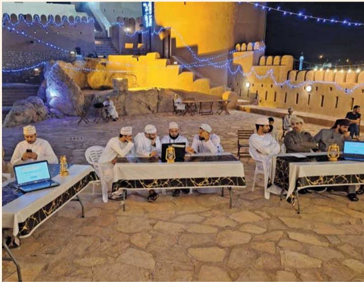
المسابقة تهدف إلى نشر الثقافة والوعي بين الشباب

على أرض الواقع. ويشترك في المسابقة مجموعتان تضم المجموعة الأولى كلا من فريق شباب نخل وفريق السير وفريق اتحاد نخل وفريق المجد وفريق وادي الأبيض. فيما تضم المجموعة الثانية فريق نسور العروبة وفريق الأبيض وفريق الكرامة وفريق النور. وسوف تقام تصفيات المجموعة الأولى مساء يوم الخميس المقبل. أما تصفيات المجموعة الثانية فسوف تقام مساء يوم الجمعة. حيث ستقابل أوائل المجموعتين في المسابقة الختامية التي ستقام غدا الخميس بقلعة نخل.