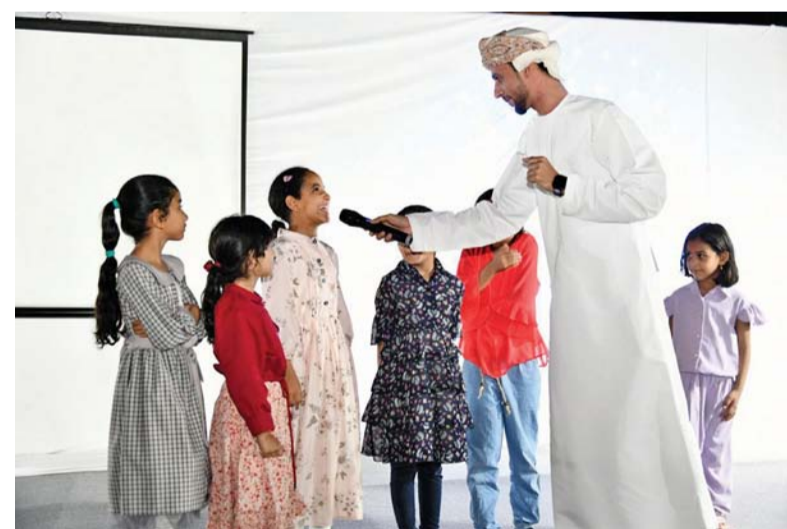
أثناء إحدى فعاليات الأطفال