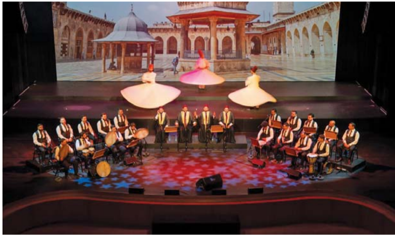
فرقة (المولويين والأنشيد الشامية)