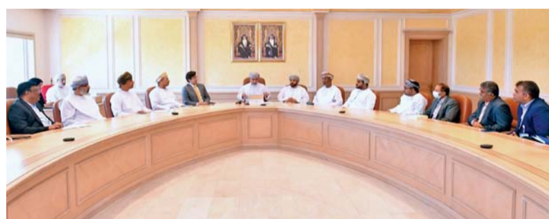
الاجتماع بحث تحديات الاستثمار في القطاع الصحي

التّحدّيات في مجال الاستثمار الصحي والتأمين الصحي وكذلك الفئات البشرية الطبية والطبية المساعدة، وعُرج إلى دور المديرية العامة للمؤسسات الصحية الخاصة البارز في تسهيل منظومة عمل القطاع الصحي الخاص وتفعيلها للأدوار الرقابية والإشرافية المنوطة لها. الجدير بالذكر أنه ستعقد اجتماعات دورية كل ثلاثة أشهر مع إشراك القطاعات الحكومية الأخرى ذات الصلة بالقطاع الصحي والموارد البشرية الطبية والصحية والتأمين الصحي والاستثمار فيه للمساهمة في التنمية وفق رؤية عُمان ٢٠٤٠.