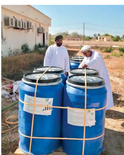
أثناء سحب المواد الكيميائية التالفة بإحدى المدارس

لتنفيذ المبادرة، والتأكد من خلو جميع مختبرات العلوم في المدارس الحكومية من المواد الكيميائية التالفة أو عديمة الصلاحية وفق النماذج المعدة للمبادرة وتوقيع جميع المدارس بالتسليم، بالإضافة إلى التي لا تتوافر فيها مواد (بخلوها تماماً من المواد الكيميائية التالفة أو المنتهية الصلاحية). وبعد التأكد من خلو جميع المدارس من المواد قام الفريق بفرز وتصنيف المواد الكيميائية التالفة وعديمة الصلاحية المستلمة من المدارس وفق التصنيف العلمي والبروتوكولات العالمية المعتمد عالمياً للتعامل مع نفايات المواد الكيميائية التالفة إلى أن تم تسليم شركة بيئة المتعاونة معها الوزارة باستلام جميع المواد الكيميائية التالفة وعديمة الصلاحية وتوزيعها في حاويات مخصصة للشحن والإجراءات الآمنة. وبذلك تكون تعليمية ظفار قد أنهت المهمة بنجاح امتثالاً للقرار الوزاري بعد تنفيذ جميع الإجراءات الإدارية والفنية المعتمدة في المبادرة، وتسليم شركة بيئة جمع المواد التالفة وعديمة الصلاحية المسحوبة.