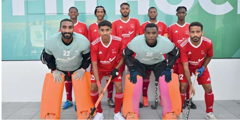
منتخبنا الوطني لخماسيات الهوكي