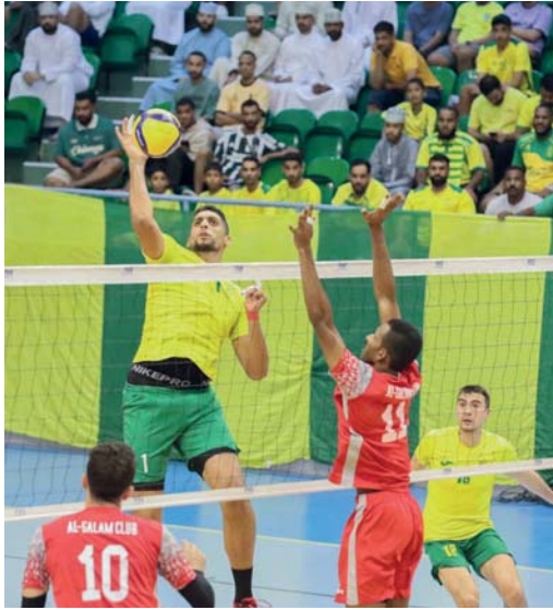
من لقاء الفريقين في نهائي الدوري