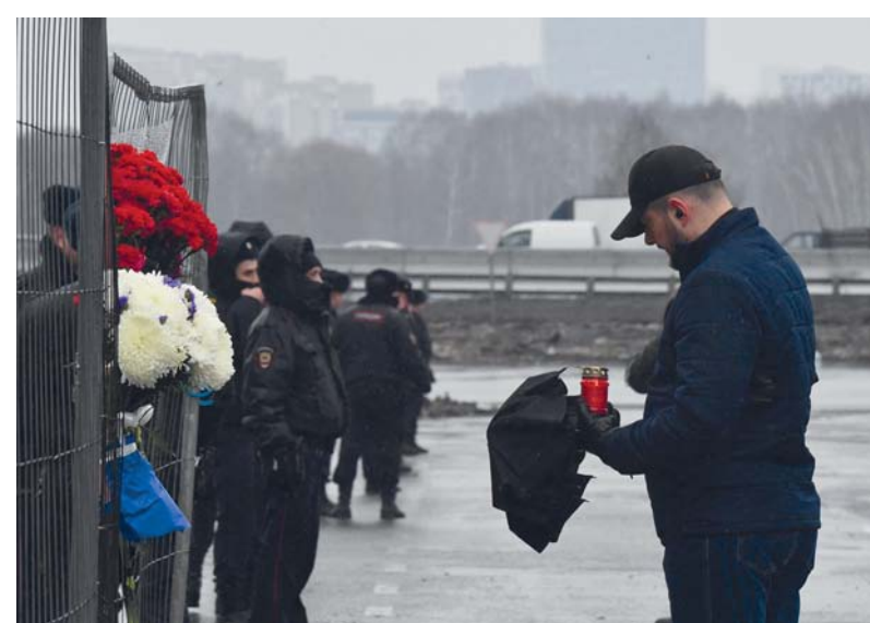
روسي يضيء شمعة أمام نصب تذكاري مؤقت بقاعة مدينة كروكوس، بعد يوم من هجوم مسلح في كراسنوجورسك، خارج موسكو. ا.ف.ب.

موسكو. ا.ف.ب: أعلنت روسيا توقيف ١١ شخصاً، بينهم أربعة مهاجمين ضالعين في هجوم كروكوس الذي نفذ في صالة للحفلات الموسيقية في ضاحية موسكو، ميلغة عن ارتفاع حصيلة القتلى إلى ٩٣ في ظل مخاوف من ازديادها أكثر. ويعد هذا الهجوم الذي تبناه تنظيم داعش الأكثر حصداً للأرواح في موسكو منذ عشر سنوات على الأقل. وأفاد الكرملين في بيان نقلته وكالات الأنباء الروسية إن مدير جهاز الأمن الفدرالي (إف إس بي) أبلغ الرئيس فلاديمير بوتين بتوقيف ١١ شخصاً، بينهم أربعة إرهابيين ضالعين مباشرة في الهجوم. وجاء في البيان أن «مدير جهاز الأمن الفدرالي ألكسندر بورتنيكوف أبلغ الرئيس بتوقيف ١١ شخصاً، من بينهم أربعة إرهابيين متورطين في الهجوم الإرهابي على صالة كروكوس». وأعلنت لجنة التحقيق الروسية التي تتولى مسؤولية التحقيق في الجرائم الكبرى السبت مقتل ٩٣ شخصاً على الأقل في الهجوم. وكشفت لجنة التحقيق عبر «تلغرام»، أن «الحصيلة ارتفعت إلى ٩٣ قتيلاً راهناً. ومن المتوقع أن يستمر عدد القتلى في الارتفاع». وأضافت أن هناك أشخاصاً توفوا متأثرين بإصاباتهم بأعيرة نارية ومن استنشاق الدخان بعدما اشتعلت النيران في المبنى الواقع في ضاحية كراسنوغورسك شمال موسكو. كما أكدت أجهزة الأمن الروسية أن المشتبه بهم في الهجوم كانت لديهم «جهات اتصال» في أوكرانيا إلى حيث كانوا يعتزمون الفرار. وأوردت وكالة «تاس» للأخبار نقلاً عن أجهزة الأمن الروسية قولها «بعد تنفيذ الهجوم الإرهابي، كان المجرمون يعتزمون عبور الحدود الروسية الأوكرانية وكانت لديهم جهات اتصال مناسبة على الجانب الأوكراني».