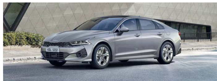
كيا كيه ٥ مزودة بمجموعة من المزايا

إل إي دي. كما أن كيه 5 تتميز بترك بصمة رائعة من خلال احتوائها على محرك ٢,٥ لتر جي دي أي بقوة ١٩١ حصاناً، وعزم دوران أقصى ٢٥,١ كجم، ويقترن بناقل حركة الي ٨ سرعات. كما تم تزويد سيارة كيه 5 بمجموعة من الميزات من أجل تعزيز كل تجربة، حيث تشمل على ميزة تحديد وضع القيادة والتحكم التلقائي في السرعة وتحكم كهربائي لمقعد السائق، ومكيف هواء آلي، وتحكم كهربائي لمقعد الراكب الأمامي ونظام