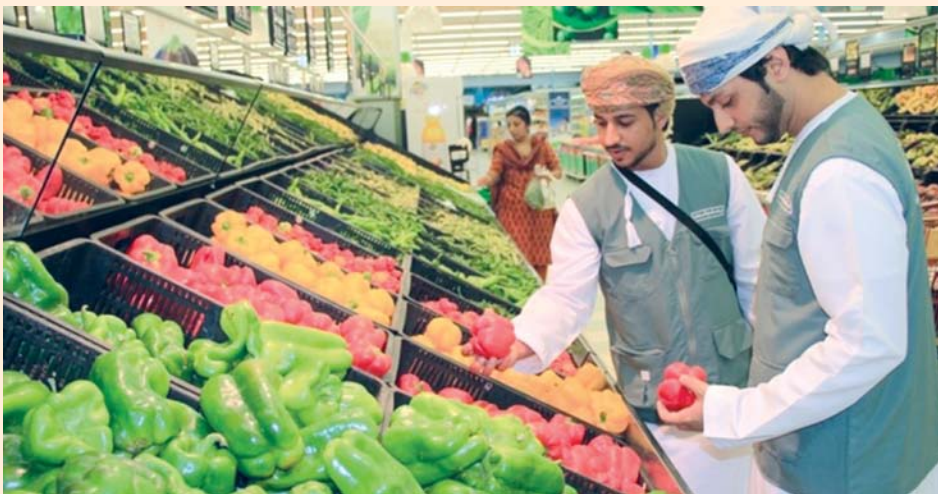
ارتفاع أسعار الفواكه والخضراوات خلال شهر فبرابر الماضي

وسجلت محافظة مسقط أعلى نسبة انخفاض بالتصخم بنهاية شهر فبرابر ٢٠٢٤ مقارنة بالفترة المماثلة من العام السابق، حيث انخفض المؤشر بنسبة ٠,٣ بالمائة وانخفض أيضاً بنسبة ٠,٢ بالمائة في محافظة الداخلية في مقابل ارتفاع بـ ٠,٩ بالمائة في محافظة شمال الشرقية. وارتفع المعدل بـ ٠,٥ بالمائة بمحافظة الوسطى وبـ ٠,٤ بالمائة في كل من محافظتي ظفار والبريمي وبـ ٠,٣ بالمائة بكل من محافظة الظاهرة ومحافظة مسندم وبـ ٠,٢ بالمائة في كل من محافظتي جنوب الباطنة وشمال الباطنة وبـ ٠,١ بالمائة في محافظة جنوب الشرقية.