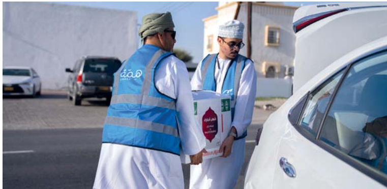
خلال توزيع السلّة الرمضانية للأسر المحتاجة

للوطنية للتمويل، حيث قدموا الدعم لأكثر من ٨٠ أسرة من خلال توفير المؤن والمستلزمات الضرورية، وتم تجهيز كل صندوق بسلّة الرمضانية الأساسية ومختلف المنتجات وغيرها من المستلزمات الأساسية.