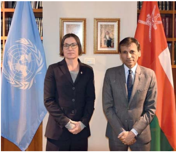
رئيسة اللجنة تُثمن مواقف سلطنة عُمان الدائمة للجهود الإنسانية الدولية

تم خلال الجلسة التي ترأسها كلٌّ من سعادة السفير الدكتور محمد بن عوض الحسان، مندوب سلطنة عُمان الدائم، وسعادة ميريانا سبولياريتش إيجر، رئيسة اللجنة الدولية للصليب الأحمر مناقشة عدد من القضايا الراهنة في منطقة الشرق الأوسط. حيث شدّد الجانبان على أهمية احترام جميع الأطراف قواعد ومرتكزات القانون الإنساني الدولي، خصوصاً في الأراضي الفلسطينية المحتلة وقطاع غزة تحديداً. من جانبها، ثمّنت سعادة رئيسة اللجنة