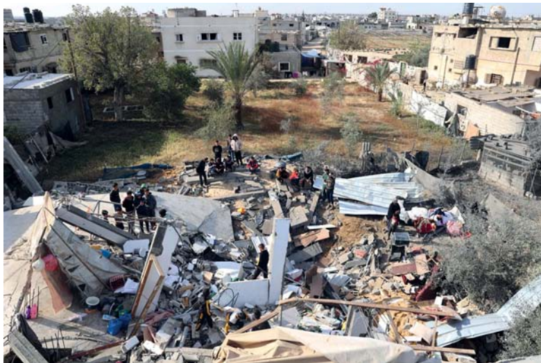
فلسطينيون يعابنون الدمار الذي لحق بمنزل استهدف بقصف إسرائيلي في الجزء الشمالي من رفح جنوب قطاع غزة.