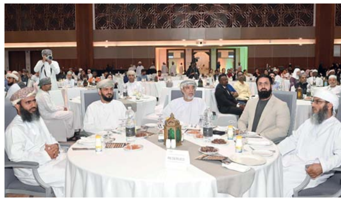
الحضور أثناء الفعاليّة

في العالم وقيم التعايش من خلال تجربة العيش في سلطنة عمان. وسعت الدائرة المنظمة للفعالية أن يكون الإفطار وأداء الصلاة أمام الجميع عبر شاشات نقل مباشرة، لكي يرى غير المسلمين كيف يؤدي المسلمون الصلاة في صفوف منتظمة مما يكون له الأثر لغير المسلم، وتضمنت كذلك مسابقة ثقافية لغير المسلمين عبارة عن معلومات عامة عن الدين الإسلامي شارك فيها الحضور من الرجال والنساء، كما كانت الفعالية فرصة لغير المسلمين لمن لديهم تساؤلات عن الإسلام فكانت النقاشات محوراً أساسياً لكشف ما هو غامض وغير واضح لغير المسلمين والمسلمين الجدد، كما شهدت الفعالية دخول عدد كبير من غير المسلمين في الدين الإسلامي.