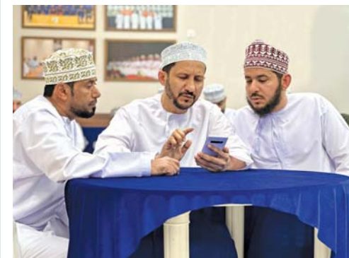
■ المسابقة شهدت مشاركة ١٦٠ فريقاً