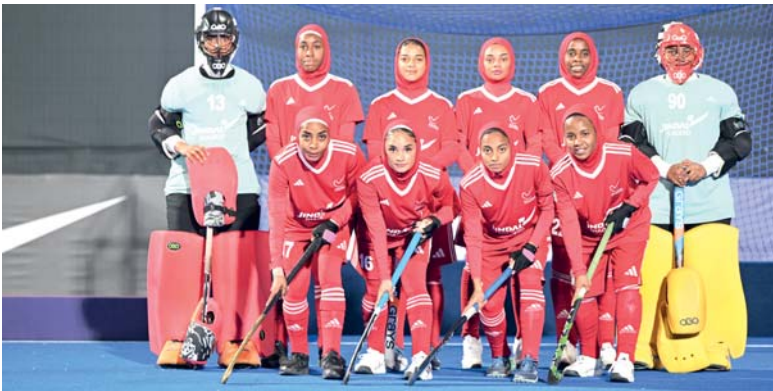
المنتخب النسائي للهوكي

بولندا الحاصلة على الميدالية البرونزية في كأس العالم لخماسيات الهوكي في المركز الثالث وحصلت على 1450 نقطة، وتتعادل الأوروغواي 1350 نقطة، وجنوب أفريقيا 1300 نقطة في المركز الرابع والخامس على التوالي في التصنيف العالمي بعد أن أظهر الفريقان قوة هجومية مذهلة في نفس البطولة، وتحلت ماليزيا