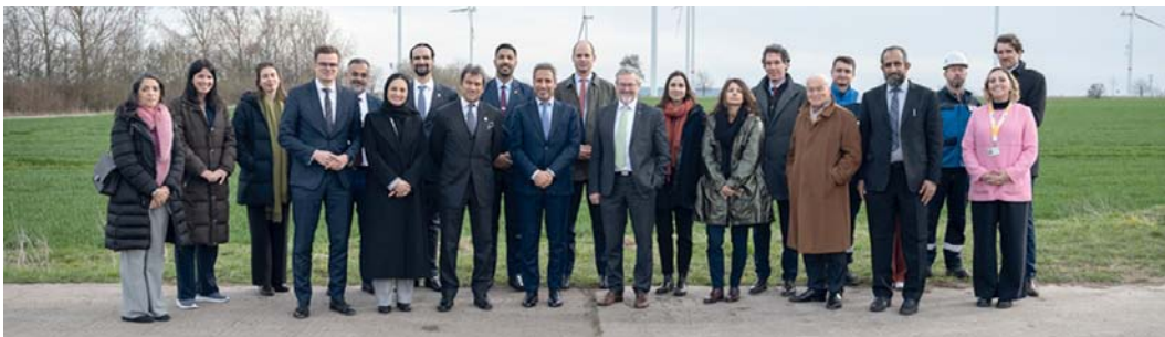
الزيارة تمثل فرصة لتعزيز التعاون الثنائي وتبادل الخبرات في قطاع الطاقة

برلين، العُمانية: التقى معالي المهندس سالم بن ناصر العوفي وزير الطاقة والمعادن في العاصمة الألمانية برلين، معالي الدكتور روبرت هايبك نائب المستشار الألماني والوزير الاتحادي للشؤون الاقتصادية وحماية المناخ بجمهورية ألمانيا الاتحادية.