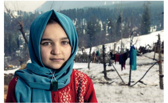
■ العمل بعدسة حمد الغنبوصي