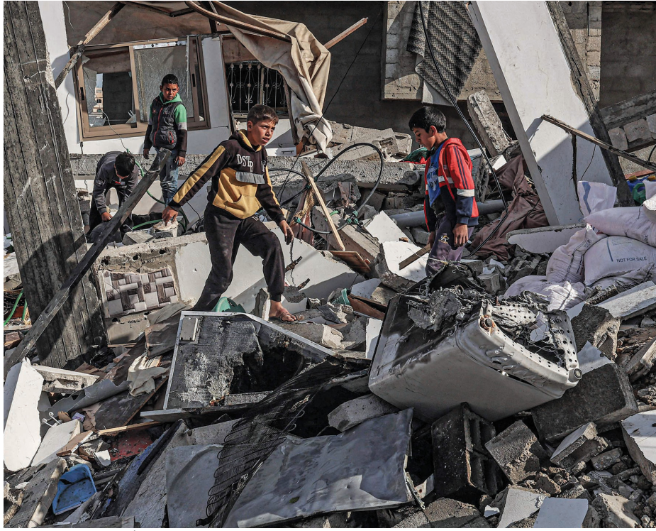
صية فلسطينيون يسرون فوق أنقاض منزل دمره القصف الإسرائيلي في الجزء الشمالي من رفح جنوب قطاع غزة.