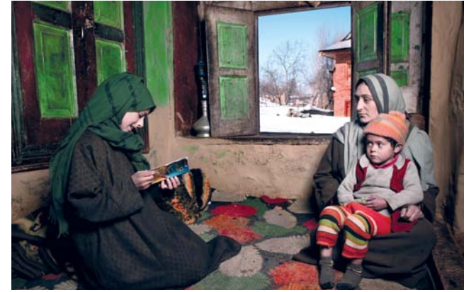
■ العمل بعدسة محمود الجابري