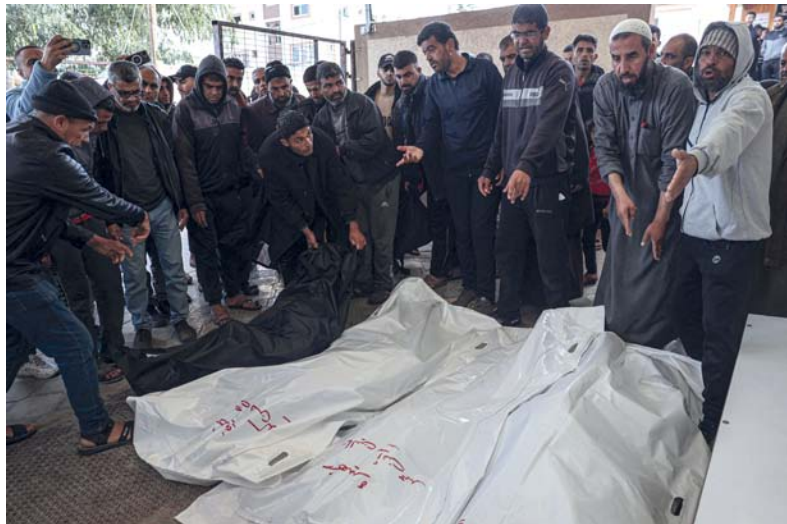
فلسطينيون يحيطون بجثث أقاربهم الذين استشهدوا في قصف إسرائيلي، وذلك في مشرحة المستشفى الأوروبي بخان يونس جنوب قطاع غزة.