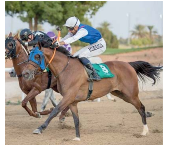
الجواد فاريتر أوباي خلال مشاركته في السباق

فقد عكس هذا التصنيف المنافسة الشديدة والمهارة العالمية التي أبدتها الدول المشاركة في تلك البطولة العالمية. واحتلت نيوزلاند المركز الأول في التصنيف العالمي من أصل 44 دولة شملها التصنيف العالمي، وذلك بعد فوز نيوزلاند بلقب بطولة كأس العالم لخماسيات الهوكي وحصدتها على 1750 نقطة، بينما تقاسمت سلطنة عُمان المركز الثاني مع ماليزيا والهند بحصولهم على 1400 نقطة، وهو دليل على الأداء المتميز الذي قدمه منتخبنا الوطني بقيادة المدرب النيوزلاندي سيجفريد أيكمان، وفي أول ظهور على المسرح العالمي للعبة وحصول منتخبنا الوطني للرجال على المركز الثالث والميدالية البرونزية في البطولة، كما حصلت ماليزيا على 1400 نقطة أيضا وذلك بعد تحسن مستواها في العديد من