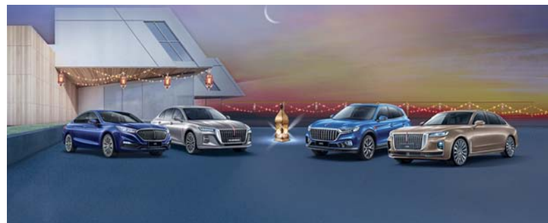
هونشي ملتزمة بتقديم تجارب استثنائية لعملائها

خدمة لمدة ٧ سنوات / مسافة ١٥٥,٠٠٠ كم، ٧ سنوات خدمة المساعدة على الطريق، ٧ سنوات ضمان غير محدود المسافة، تأمين وتسجيل مجاني للسنة الأولى، قسيمة هدية بقيمة ٢٥٠ ريالاً عمانياً، بطاقة وقود بقيمة ١٠٠ ريال عمانياً وصندوق هدايا