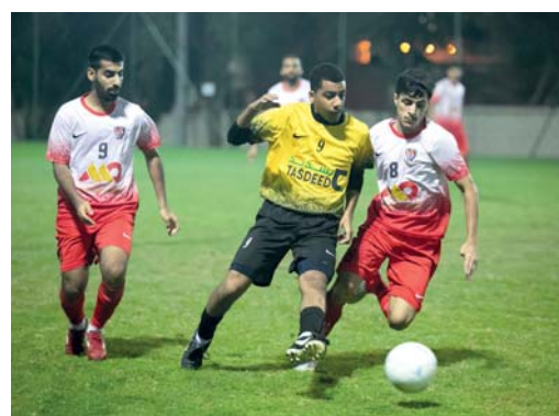
من مباريات بطولة أوكيو