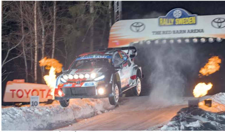
السويد أسرع مراحل موسم بطولة العالم للراليات

الثلوج بكثافة، وجرت المرحلتان الأخيرتان في الظلام، وقد تمكن إيفانز من التغلب على التحديات التي واجهته خصوصاً بعد أن كان أول المنطلقين على الطرقات المغطاة بالثلوج. وخلال مراحل الرالي، تقدم إيفانز من المركز السادس ليحتل المركز الثاني مع بداية منافسات اليوم الأخير من السباق، بفارق ضئيل في مرحلة «ياور» الأخيرة. وشاركت شركة تويوتا على مدى السنوات الماضية في العديد من رياضات سباقات السيارات، ومن ذلك سباق الفورمولا ١، وبطولة العالم للتحمل، وسباق نوربورجرينج للتحمل ٢٤ ساعة. وكانت مشاركة تويوتا في هذه الفعاليات تقام عبر فرق وكيانات منفصلة داخل الشركة حتى أبريل ٢٠١٥، حين أسست شركة تويوتا قسم «تويوتا جازو للسباقات»، وذلك بهدف توحيد جميع أنشطتها في مجال رياضات سباقات السيارات تحت سقف واحد. وانطلاقاً من قناعة شركة تويوتا، وشعارها: «نكتسب الخبرة على الطرقات؛ لنصنع أفضل المركبات»، يبسط قسم «تويوتا جازو للسباقات» الضوء على نؤز رياضات سباقات السيارات؛ بوصفها ركيزة أساسية لالتزام الشركة بتطوير أفضل المركبات على الإطلاق.