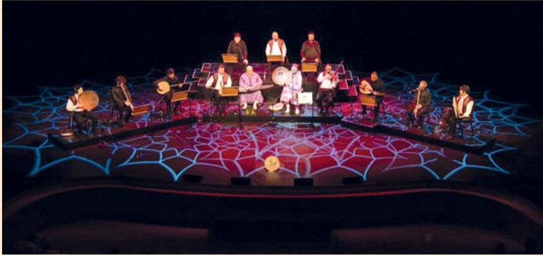
«ابن عربي» سماع تشربه الأرواح بكؤوس الأذان على معاني الأناض