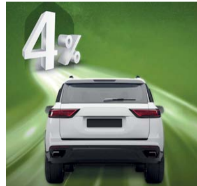
■ العرض يقدم نسبة فائدة تبدأ من ٤٪ خلال شهر رمضان

التي من شأنها أن تلبى احتياجات زبائننا المتنوعة. ويتوفر عرض قرض السيارات من بنك ظفار لشراء السيارات الجديدة والمستعملة، مع عدد من المزايا بما في ذلك: الحصول على عملية موافقة سريعة وخيارات سداد مرنة تصل إلى ١٠ سنوات. كما أن عرض قرض