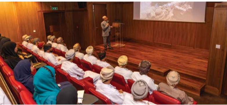
■ المحاضرة تناولت التراث المائي بين سلطنة عُمان واليمن والمغرب

في بداية الأمسية قدمت فرقة (الزاوية للسماع العرفاني) مجموعة من الوصائل الإنشادية ومنها (قلبي يحدثني) كلمات عمر الفارض، جاءت على مقام (نهاوند) (وإيا من تجلي للعوالم مسفراً) وهي من كلمات علي بن وفا، على مقام (نهاوند) وقدمت الفرقة أيضاً على مقام (كرد) أنشودة (الله يانور النور) لمحمد المدني، وأختتمت الفرقة العمانية مشاركتها بتقديم (موال مع ذكر) على مقام (متنوع المقامات)