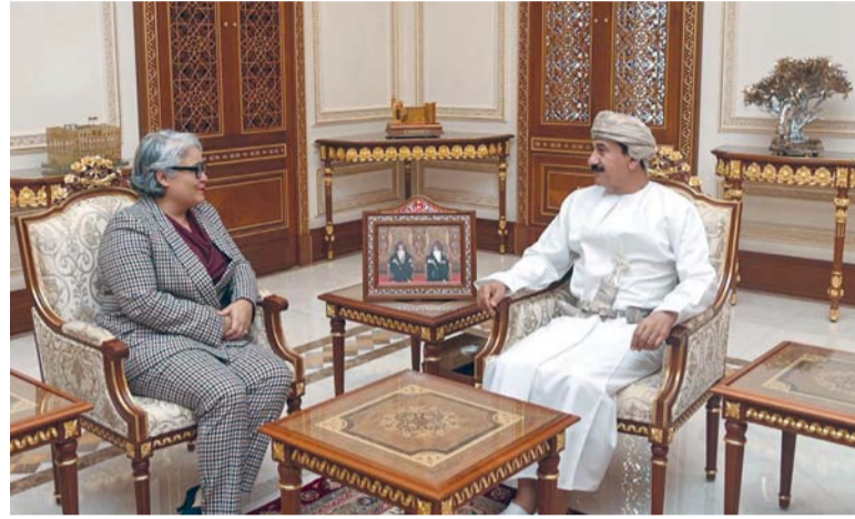
سلطان العُماني أثناء استقباله أنا إسكروهيما

مسقط. العُمانيّة: استقبل معالي الفريق أول سلطان بن محمد العُماني وزير المكتب السلطاني بمكتبه صباح أمس سعادة أنا إسكروهيما سفيرة الولايات المتحدة الأمريكية المعتمدة لدى سلطنة عُمان. جرى خلال المقابلة استعراض العلاقات بين البلدين الصديقين ومجالات التعاون الثنائية، كما تم التطرق إلى الموضوعات الإقليمية ذات الاهتمام المشترك، من جانبها أشادت سعادة السفيرة بمتانة العلاقات التي تربط سلطنة عُمان بالولايات المتحدة الأمريكية.