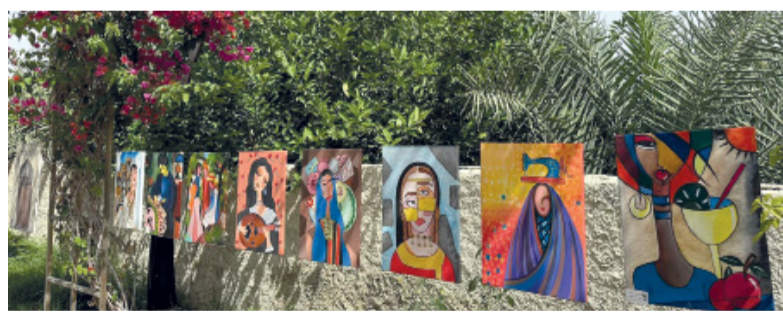
■ أعمال المعرض تنوعت في الفكرة والمضمون