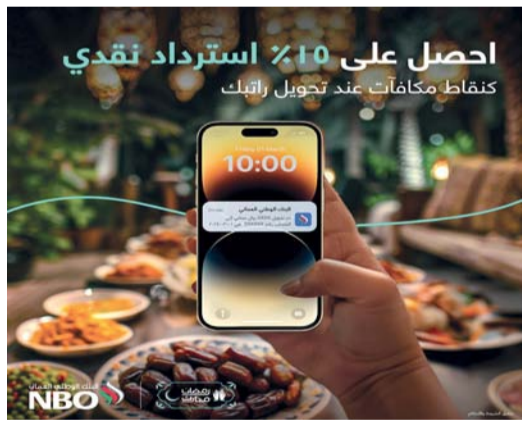
مسقط . الوطن : حصل على 15 ٪ استرداد نقدي كمنافاة عند تحويل راتبك