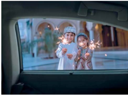
■ عرض مميز تقدمه الوطنية للتمويل

احتفل البنك الأهلي مؤخراً بتخريج الدفعة السابعة من خريجي برنامج «هم»، البرنامج الرائد لتنمية الكوادر الوطنية. وشهد حضور عدد من الموظفين وأعضاء الإدارة العليا. ويعكس برنامج هم الرائد جهود البنك الأهلي الحثيثة لتمكين الشباب وتطوير مهاراتهم العملية، وبالتالي المساهمة بشكل فعال في دعم جهود السلطنة لتوظيف وتأهيل الكوادر العمانية، وذلك عبر تطبيق أعلى المعايير لتطوير الكفاءات والخبرات العملية لمنسوبي البرنامج. وساهم برنامج هم الذي اطلق عام ٢٠١٥م، في نجاح مسيرة العديد من الشباب والشابات العمانيين، ويهدف البرنامج في جوهره إلى