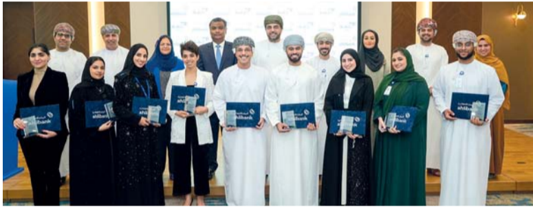
■ صورة جماعية لخريجي برنامج «هم»

تعزيز مهارات الكوادر الشابة وتنمية قدراتهم، وتزويدهم بالمعرفة والأدوات اللازمة للتفوق في القطاع المصرفي. وبعد انضمام المنتسبين لمدة عامين، يتقلد عدد كبير من خريجيهم وظائف مرموقة في البنك، مما يساهم في دفع عجلة النمو الاقتصادي والاجتماعي في السلطنة. هذا وتم الإعلان عن انضمام الدفعة التاسعة من برنامج هم خلال الحفل.