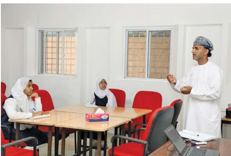
اكتشاف المواهب الطلابية وصلها

للمعلومات والمعارف العامة، واكتشاف مواهبهم وتوجيهها للتوجه الصحيح عبر العديد من المسابقات والبرامج. وتأتي جائزة الإبداع الأدبي لطلبة المدارس لتحقيق التعاون المطلوب. ونظراً لما تهدف إليه هذه الجائزة كمشروع وطني رائد في محتواها ومستوياتها من ترسيخ لقيم الجمال الأدبي وتنمية لدى الطلبة الموهوبين والمبدعين في المجال الأدبي، ورغبة في حث الطلبة ومعلميهم وأسرهم على الأخذ بيد هذه المواهب وتحفيزها لمزيد من التجويد والارتقاء.