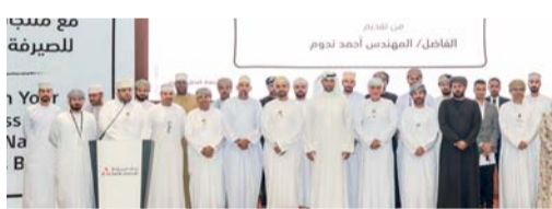
■ صورة جماعية للمشاركين في الندوة

ويدرك بنك مسقط الأهمية الكبيرة التي يشكّلها قطاع المؤسسات الصغيرة والمتوسطة ويعمل على تعزيز دوره في هذا الجانب بداية من إطلاق وحدة «نجاحي» للصيرفة التجارية في عام ٢٠١٤م بهدف دعم المؤسسات الصغيرة والمتوسطة والناشئة من خلال توفير خيارات للخدمات والتسهيلات المصرفية الموائمة لاحتياجات هذه المؤسسات ومساعدتها على تحقيق النمو والتقدم في أعمالها ومشاريعها المختلفة وبالتالي المساهمة من خلال سبل التعاون المختلفة على إحداث تأثير إيجابي في المجتمع.