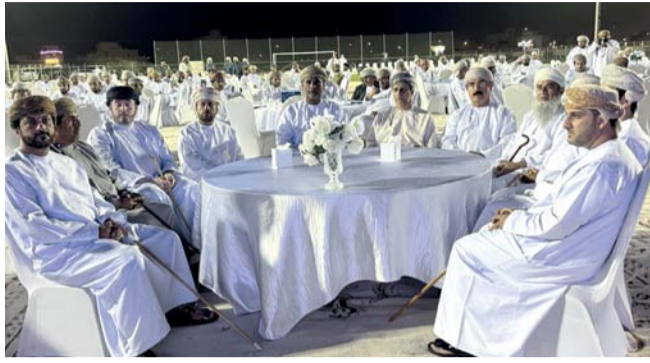
■ اللقاء تطرق إلى الحلول المطروحة في دعم منظومة القطاع الخاص

وطُرح خلال اللقاء عدد من المواضيع التي تخص مجالات القطاع الخاص واستعراض سبل تسهيل الإجراءات الحكومية من أجل تسريع وتيرة تلبية مختلف المعاملات التنظيمية، إلى جانب الاستماع إلى استفسارات أصحاب الأعمال والتطرق إلى المقترحات التي تسعى إلى تعزيز مجالات قطاع أصحاب الأعمال والمؤسسات الصغيرة والمتوسطة.