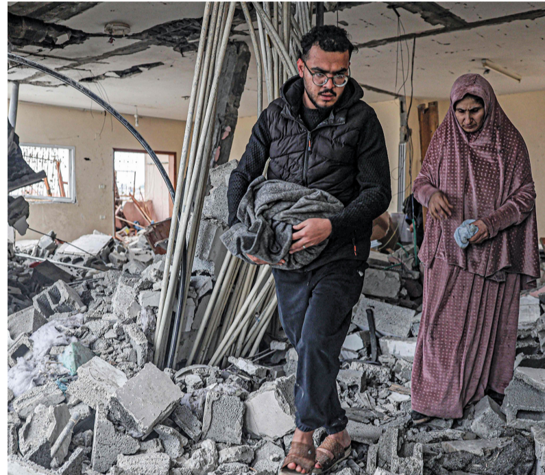
فلسطينيان يتفقدان حطام مبنى تعرض لقصف إسرائيلي في رفح جنوب قطاع غزة.

استشهد وأصيب عشرات الفلسطينيين في قصف صاروخي ومدفعي للاحتلال الإسرائيلي على مناطق من قطاع غزة. يأتي ذلك فيما أكدت وزارة الخارجية الفلسطينية أن القصف العنيف الذي يشهده الاحتلال الإسرائيلي على مدينة رفح، يُعد بداية جديدة لتوسيع جرائمه فيها، بالرغم من وجود أكثر من مليون نازح فيها، دون إعطاء أي اعتبار لحياثهم. وأوضحت الخارجية في بيان صادر عنها أمس أن إسرائيل بدأت بدمير رفح بشكل يومي وبطريقة منهجية عُثِرَ الاعتداءات المتكررة على المنازل، وقصفها، وسقوط عشرات الشهداء والجرحى، فإسرائيل بدأت عدوانها على مدينة رفح، ولم تنتظر إننا من أحد، ولم تعلن ذلك تجنباً لردود الفعل الدولية. تفاصيل .. ص ٥