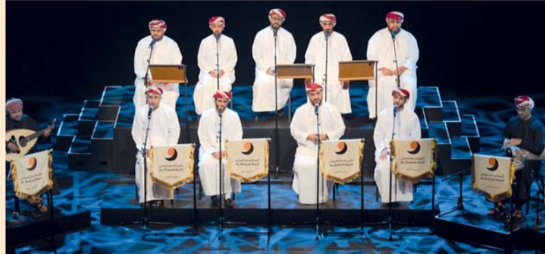
«الزاوية» قدمت تجربة سماعية عانقت الروح والوجدان