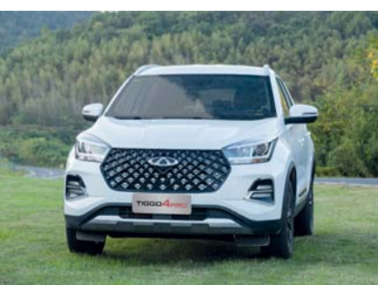
■ سيارة تيجو 4 برو مجهزة بقوة تفوق مزدوجة حصرياً في فئتها

إلى جانب منطقتي تحكم مركزية مدمجة بسيطة تتميز بشاشة إل سي دي عاتمة فائقة الوضوح بمقاس ١٠,٢٥ بوصة وشاشة عرض إل سي دي كاملة للعدادات بمقاس ٧ بوصة، بالإضافة إلى تمكين وظائف الوسائط المتعددة والاتصالات والتحديث من القيادة. كما تم تجهيز سيارة تيجو 4 برو بقوة تفوق مزدوجة حصرياً في فئتها، حيث تتضمن تقنيات متقدمة مثل دورة ميلر، ومشعب السحب بالحقن المزدوج، ومشعب العادم المتكامل وذلك من أجل تحقيق التوازن في أداء الطاقة، والكفاءة في استهلاك الوقود. من بيننا، يوفر مزيج القوة المتصاعدة 1.5TCI وناقل حركة ذو تعشيق مستمر ٩ سرعات بقوة قصوى تبلغ ١١٥ كيلووات وعزم دوران يبلغ ٢٣٠ نيوتن متر، من استهلاك وقود يبلغ ٧,١ لترًا لكل ١٠٠ كيلومتر، يوفر محرك ١,٥ لتر، وناقل حركة ذو تعشيق مستمر عالي الكفاءة ٩ سرعات بقوة قصوى تبلغ ٨٨ كيلووات وعزم دوران يبلغ ١٤٨ نيوتن متر، مع استهلاك وقود يبلغ ٦,٩ لترًا لكل ١٠٠ كيلومتر.