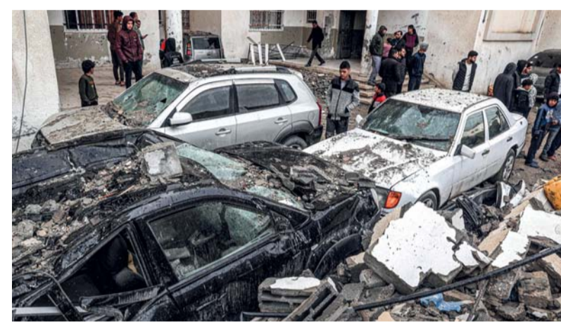
شنت غارات على أحياء الرمال والزيوتين والسرحد والشيخ رضوان في مدينة غزة، كما قصفت مدفعية شرق مخيم البريج وشمال مخيم النصيرات

يأتي ذلك فيما قالت المقررة الأممية المعنية بحالة حقوق الإنسان في الأراضي الفلسطينية فرانيسكا البانين، إن الاحتلال الإسرائيلي لا يريد شهوداً على الإبادة الجماعية في قطاع غزة. وأضافت على منصة (إكس) تعليقاً على منع سلطات الاحتلال للمفوض العام لوكالة (الأونروا) فيليب لازاريني، من دخول قطاع غزة، «إن الظروف التي هي من صنع الإنسان وتنتسب بالجماعة والقتل الجماعي والأذى المستمر وإيجاد الظروف التي تدمر حياة الإنسانية، لها اسم هو الإبادة الجماعية». من جهته، قال لازاريني، في وقت متأخر الإثنين، إن سلطات الاحتلال الإسرائيلي رفضت دخوله قطاع غزة. العاملين فيها. وأنشأت الأنباء إلى استشهاد ستة جراء استهداف طائرات الاحتلال منزل عائلة العمودي بمنطقة أبو الأمين في حي الشيخ رضوان شمال مدينة غزة، كما قصفت مدفعية الاحتلال منازل بحي تل الهوا والشيخ جليلين غرب المدينة. وفي السباق ذاته، يواصل جيش الاحتلال لليوم الثاني على التوالي حصار مستشفى الشفاء في حي الرمال غرب مدينة غزة، وسط سماع دوي انفجارات ضخمة ناجمة عن قصف صاروخي ومدفعي. وأفادت الأنباء أن قوات الاحتلال تواصل منع مركبات الإسعاف من الوصول إلى حي الرمال لانتشال الشهداء والمصابين.