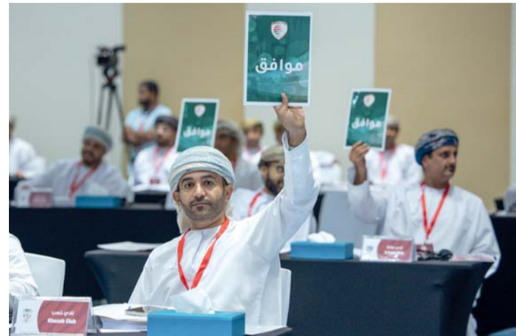
أعضاء الجمعية أثناء موافقتهم على أحد القرارات