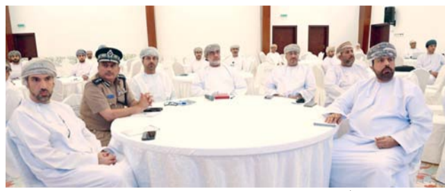
■ أثناء اللقاء التنموي الأول للمؤسسات الحكومية بشمال الشرقية

إبراء . العُماني: نطّم مكتب محافظ شمال الشرقية أمس اللقاء التنموي الأول للمؤسسات الحكومية بمحافظة شمال الشرقية لعام ٢٠٢٤. بهدف مناقشة الجانب التنموي في المحافظة واستعراض خطط العمل، وقراءة المؤشرات والإحصاءات التطويرية خلال المرحلة الماضية في إطار برنامج تنمية المحافظات في سلطنة عُمان. وأوضح سعادة محمود بن يحيى الذهلي محافظ شمال الشرقية الذي ترأس اللقاء بحضور أصحاب السعادة الولاة ومسؤولي المؤسسات بالقطاعات العام والخاص بالمحافظة، بأن اللقاء يأتي في إطار التكامل المؤسسي بين المؤسسات الحكومية بالمحافظة، مؤكداً أن منهجية