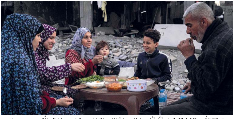
عائلة الناجي تتناول الإفطار في أول أيام رمضان وسط انقراض منزلها في دير البلح وسط قطاع غزة.