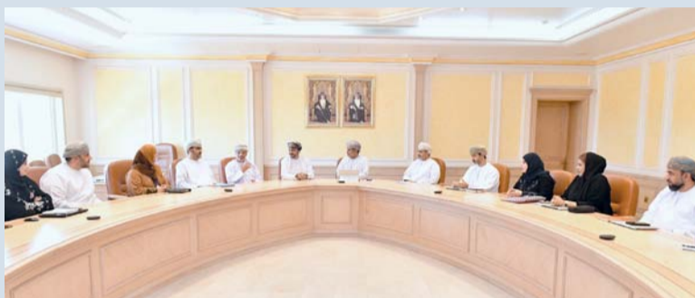
مناقشة منهجيات الوحدة في متابعة جهود تحقيق رؤية عمان ٢٠٤٠

الزمني مرحلة إعداد الرؤية، ومكونات وثيقة رؤية عمان ٢٠٤٠، وإختصاصات الوحدة، وأبرز الأسس التي تعتمد عليها الوحدة لمتابعة تنفيذ الرؤية، وطبيعة تعامل المؤسسة الحكومية مع أولويات الرؤية. كذلك سطر العرض الضوء على: منهجيات الوحدة في متابعة جهود تحقيق رؤية عمان ٢٠٤٠ ودعمها، المنظومة الشاملة لتحقيق الرؤية، مكاتب متابعة تنفيذ الرؤية، أولوية الصحة في الرؤية ومستهدفاتها، آليات الدعم والتعاون المشتركة للمضي قدماً بالقطاع الصحي لتحقيق رؤية عمان ٢٠٤٠.