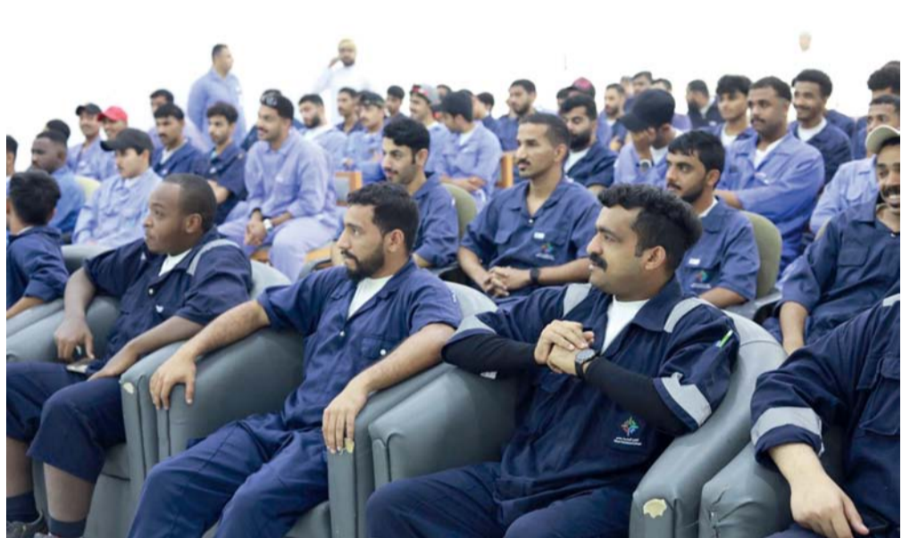
استعراض المعارف والمهارات الإيجابية التي يحتاجها المقبلون على الزواج