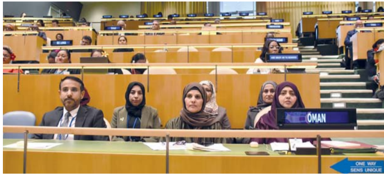
وفد سلطنة عُمان المشارك في أعمال الدُورة

كما تحدثت رئيسة وفد سلطنة عمان عن حرص سلطنة عمان لدعم دور المرأة