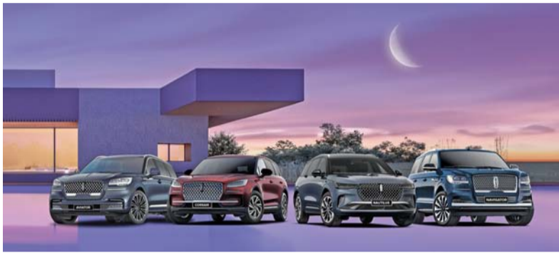
عرض لينكون يتضمن تشكيلة رائعة من السيارات