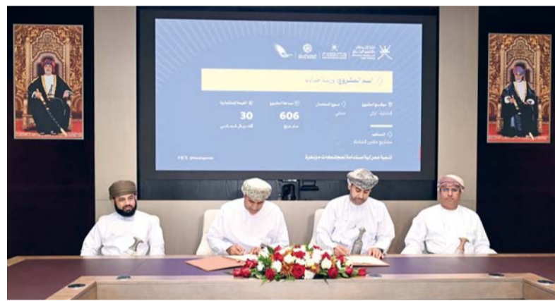
حمد النزواني أثناء توقيع العقود مع ممثلي الشركات والمؤسسات المستفيدة. كما تمثلت في ٦ عقود انتفاع للمؤسسات الصغيرة والمتوسطة بقيمة استثمارية تجاوزت ٧٣٨ ألف ريال عماني وبمساحة إجمالية بلغت ٣٦١١ متراً مربعاً في المجال الصناعي موزعة على محافظات

الداخلية وشمال الشرقية وشمال الباطنة وجنوب الباطنة. وقع العقود سعادة المهندس حمد بن علي النزواني وكيل وزارة الإسكان والتخطيط العمراني للإسكان، وممثلو الشركات والمؤسسات المستفيدة في المشاريع، بحضور سعادة الدكتور أحمد بن ناصر البكري وكيل وزارة الثروة الزراعية والسمكية وموارد المياه للزراعة، ومدير دائرة القيمة المحلية المضافة بهيئة تنمية المؤسسات الصغيرة والمتوسطة. وقال المهندس أحمد بن سعود الكمياني مدير عام الأراضي بوزارة الإسكان والتخطيط العمراني إن توقيع عقود الانتفاع يأتي ضمن خطة الوزارة لتوفير الأراضي وشمال الباطنة وجنوب الباطنة. وقع العقود سعادة المهندس حمد بن علي النزواني وكيل وزارة الإسكان والتخطيط العمراني للإسكان، وممثلو الشركات والمؤسسات المستفيدة في المشاريع، بحضور سعادة الدكتور أحمد بن ناصر البكري وكيل وزارة الثروة الزراعية والسمكية وموارد المياه للزراعة، ومدير دائرة القيمة المحلية المضافة بهيئة تنمية المؤسسات الصغيرة والمتوسطة. وقال المهندس أحمد بن سعود الكمياني مدير عام الأراضي بوزارة الإسكان والتخطيط العمراني إن توقيع عقود الانتفاع يأتي ضمن خطة الوزارة لتوفير الأراضي