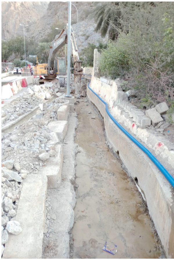
أثناء صيانة أحد الأفلاج بالولاية

وقال المُعدُّ الرئيس للدراسة الباحث أوستن شوماخر، «كان لكوفيد تأثير على البالغين في مختلف أنحاء العالم، لم يُسجل منذ نصف قرن حتى خلال الحروب والكوارث الطبيعية». لكن هذا النوع من الدراسات يجعل من الصُّعب التمييز بين الوفيات المرتبطة مباشرة بكوفيد وتلك الناجمة عن آثار القيود الصحية المفروضة لاحتمال الجائحة.