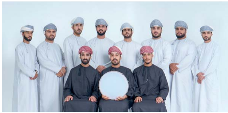
أعضاء فرقة الزاوية العمانية

درست الشيبيني عالم السيدة غالية الروائي دراسة ثقافية من جوانب متعددة، إذ يشتمل الكتاب الصادر عن (الآن ناشرون وموزعون) بالأردن على ثلاثة فصول، مهدت لها الباحثة بإطلالة على رواية المرأة في عُمان، وتعريف بالسيدة الدكتورة غالية آل سعيد. ويكشف الكتاب ما قدمته السيدة الدكتورة غالية آل سعيد من رؤية واضحة المعالم تجاه الذات والأخر، وكيف عبرت عن قضايا ورؤى وخيال خاص بالنص ذاته، حيث أنتجت الكاتبة رؤية عامة من خلال نصوصها مجتمعة، فكل نص يكمل الآخر، ويكشف عن خصوصية الكتابة لديها، وتميزها عن غيرها من الكتاب. ✎