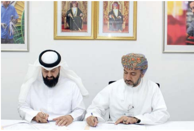
المصنع يهدف إلى دمج الحرف التقليدية مع التكنولوجيا الحديثة

مسقط - الوطن: وقعت مدينة البريمي الصناعية، التابعة للمؤسسة العامة للمناطق الصناعية «مدائن» عقد استثمار مع شركة القصور الذهبية للتجارة والاستثمار، وذلك لإنشاء مشروع مصنع لإنتاج الأثاث في المدينة الصناعية وسيقام على قطعة أرض تبلغ مساحتها الإجمالية ١٧٠٠٠ متر مربع، وبحجم استثمار يقدر بحوالي ٧ مليون ريال عماني. ويهدف المصنع إلى دمج الحرفة التقليدية مع التكنولوجيا الحديثة، واستخدام أخشاب مستدامة ومواد صديقة للبيئة، وتقديم تصاميم أثاث راقية وعصرية تتميز بجودة عالية وتفاصيل دقيقة لتلبية لاحتياجات السوق المحلية بنسبة ١٠٪، وتصدير ٩٠٪ من منتجاته للأسواق الأوروبية والأمريكية والشرق الأوسط، وابداء فرص عمل جديدة ورفد الإقتصاد الوطني.