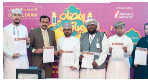
انتهاء اعلان السحب الأول والثاني لعرض حملة «تسوق واربج الترويجية»