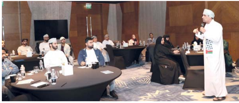
البرنامج يتضمن حلقات عمل تفاعلية تهدف إلى تعزيز مهارات الاتصال

الكهرباء بالتوربينات الغازية التي تلبي احتياجات المنطقة الاقتصادية الخاصة بالدقم من الكهرباء، كما تدير شركة مرفق قطاع مياه الشرب في المنطقة. مشيراً إلى أن الشركة تعتبر من خلال ما تقدمه من خدمات في قطاعات الكهرباء والمياه داعماً أساسياً للاستثمارات في المنطقة الاقتصادية الخاصة بالدقم ولهذا فإن تأهيل الشباب العماني يعزز من قدرات الشركة في التغلب على التحديات ويحافظ على مستويات النمو التي تشهدها، ويمكن الشباب العماني من مواكبة مراحل النمو بالشركة والاستفادة من الخبرات الأجنبية العاملة فيها.