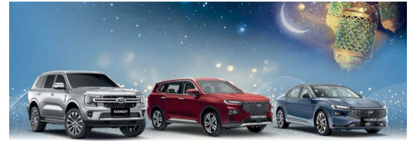
فورد توفر تشكيلة رائعة من المركبات في سلطنة عمان

تقدم فورد بسلطنة عمان لعملائها الميزة المثالية في شهر رمضان المبارك حيث يمكن امتلاك سيارة فورد جديدة والحصول على خدمة لمدة ٥ سنوات، وضمان لمدة ٥ سنوات من الشركة المصنعة، وخدمة المساعدة على الطريق لمدة ٥ سنوات/١٠٠,٠٠٠ كم، وتسجيل