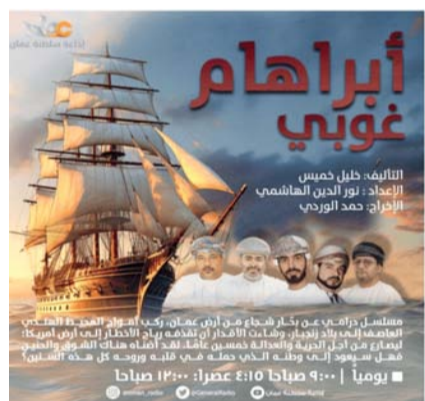
ملصق مسلسل «أبراهام غوبي»

القرآنية العطرة من كتاب الله الحكيم بمختلف الروايات التي يتلى بها المصحف بالإضافة إلى برامج منتقاة وهادفة خاصة بالقرآن الكريم وبقيم الدين الإسلامي.