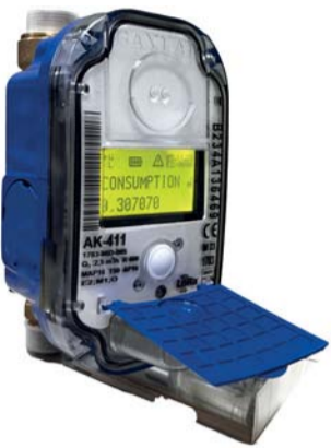
■ العداد مسبق الدفع

العدادات تسهل تنظيم استهلاك المياه وتتوافر بدون رسوم