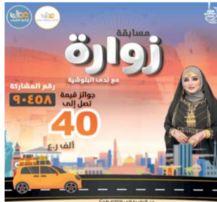
ملصق مسابقة «زواره»