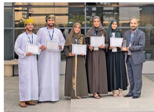
■ الفريق الطلابي المشارك في المسابقة

والتحديات التي تواجهها الشركة في هذا القطاع الحيوي.