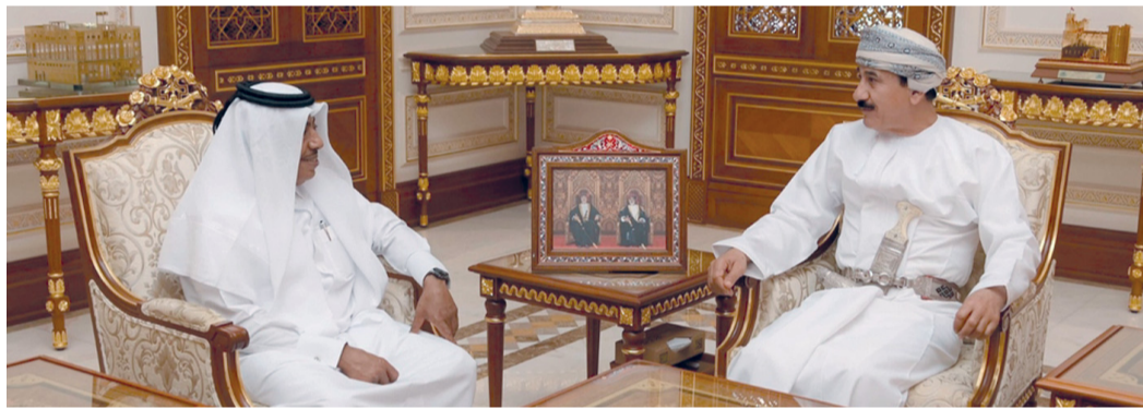
سلطان العُماني أثناء استقباله مبارك آل ثاني

مسقط . العُمانية: استقبل معالي الفريق أول سلطان بن محمد العُماني وزير المكتب السلطاني بمكتبه صباح أمس سعادة الشيخ مبارك بن فهد بن جاسم آل ثاني سفير دولة قطر المعتمد لدى سلطنة عُمان. جرى خلال المقابلة استعراض العلاقات الأخوية الوطيدة بين البلدين الشقيقين ومجالات التعاون المشتركة، كما تم التطرق إلى المواضيع الإقليمية ذات الاهتمام المشترك. من جانبه أشاد الضيف بمتانة العلاقات التي تربط سلطنة عُمان بدولة قطر الشقيقة.