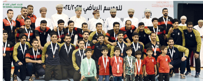
صورة جماعية لنادي مسقط الحاصل على المركز الثالث

قال سعادة خالد بن أحمد بن سعيد السعدي أمين عام مجلس الدولة سعدنا بهذا اللقاء الرائع بين نادبي عمان والسيب والذي جمع بين شباب الوطن والحقيقة الكل فائز بما انهم وصلوا الى المباراة النهائية للمسابقة ولكن دائما المباريات النهائية لا بد بان يكون هناك فائز واحد مضيفا بان أداء الفريقين كان جيدا من قبل الفريقين وهذا يدل على الاهتمام والمتابعة التي يحظى بها الطرفان من قبل مجالس ادارة النادي ولقد لمسنا من لاعبي نادي عمان امكانيات عالية نتيجة تألق معظم لاعبيهم في جميع المراكز وهذا الأمر يعود إلى الخبرة التي يتمتعون بها في المقابل بذل نادي السيب مجهودا رائعا في اللقاء ولكن الحظ لم يحالفه وتتمنى له التوفيق والنجاح في الاستحقاقات القادمة.