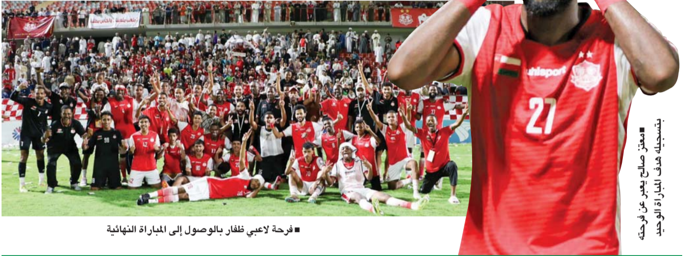
فرحة لاعبي ظفار بالوصول إلى المباراة النهائية