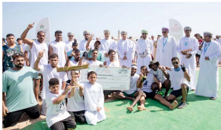
فريق فخر البحار الحاصل على المركز الأول