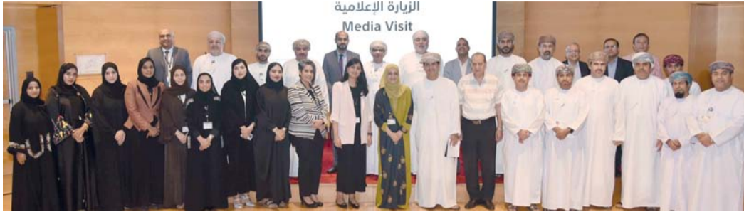
صورة جماعية لعدد من المشاركين في اللقاء الإعلامي

هذا المجال موضحه اننا خلال الفترة الماضية عززنا من تواصلنا مع هذه المؤسسات من خلال الفعاليات واللقاءات المشتركة بهدف التعرف على احتياجات هذه المؤسسات وطرح خدمات ومنتجات وتسهيلات تلبى احتياجاتهم وتساهم في تنمية وتطوير المؤسسات وتساهم ايضا في انجاز معاملاتها المالية بشكل سريع ومنظم ومساندتهم في ادوارهم المهمة لتحقيق اهداف رؤية عمان ٢٠٤٠