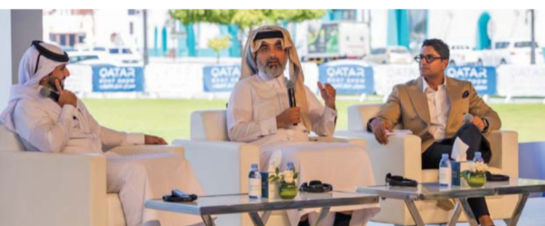
إحدى جلسات النقاشية