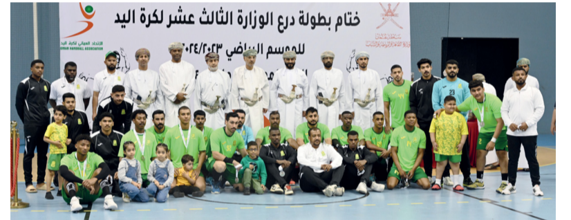
صورة جماعية لنادي السيب المتوج بالمركز الثاني