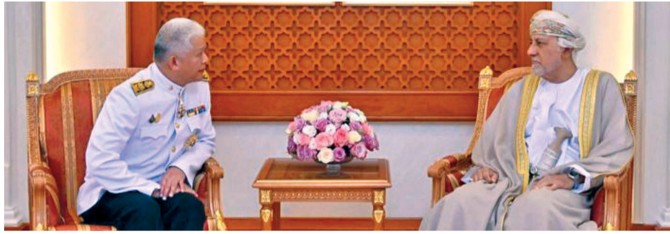
شهاب بن طارق لدى استقباله سوات كاوسوك

مسقط . العُمانية: بتكليف سام من حضرة صاحب الجلالة السلطان هيثم بن طارق المعظم . حفظه الله ورعاه . استقبل صاحب السمو السيد شهاب بن طارق آل سعيد نائب رئيس الوزراء لشؤون الدفاع بمكتبه بمعسكر المرتفعة أمس، سعادة سوات كاوسوك سفير مملكة تايلند المعتمد لدى سلطنة عُمان؛ وذلك للتوديع بمناسبة انتهاء مهام عمله سفيراً لبلاده لدى