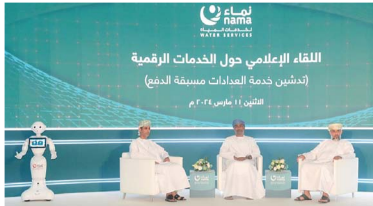
■ المتحدثون في اللقاء

وإيجاد الحلول الملائمة التي قد تواجهها، مؤكداً أن تطبيق