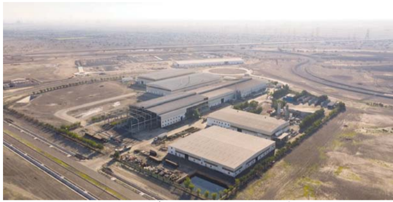
■ المشروع سيعزز مكانة ميناء صحار والمنطقة الحرة من خلال زيادة حجم المناولة

جديدة. وأوضح سعادته أن الاستراتيجية الصناعية ٢٠٤٠ تستهدف مجموعة من الصناعات أبرزها الصناعات القائمة على المعرفة التي تعتمد على البحث والتطوير والتكنولوجيا المتقدمة، وتسعى إلى تعزيز تكامل التقنيات الحديثة وتخزين الابتكار في إطار اقتصاد معرفي لإيجاد صناعات قائمة على المعرفة وتعزيز دور سلطنة عُمان بصفتها إحدى الدول الرائدة في المجال الصناعي والتكنولوجي. وأشار سعادته إلى أن المشروع سيعزز مكانة ميناء صحار والمنطقة الحرة من خلال زيادة حجم المناولة