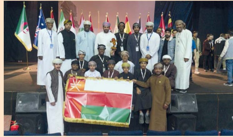
الوفد المسرحي المشارك بالمهرجان

توجت فرقة مسرح الدن للثقافة والفن بجائزة أفضل عرض متكامل عن مسرحية (أصابع جميل) وذلك ضمن مشاركتها في مهرجان الحسيني الصغير لمسرح الطفل بالجمهورية العراقية في نسخته الثامنة والتي تحكي قصة (جميل) الطفل الذي وُلد مختلفاً عن أصحابه، حيث إنه ولد بأصابع مختلفة عن المألوفة. الأمر الذي سبب له إخراجاً بين أقرانه في مدرسته ومجتمعه، مما تسبب بأزمة نفسية