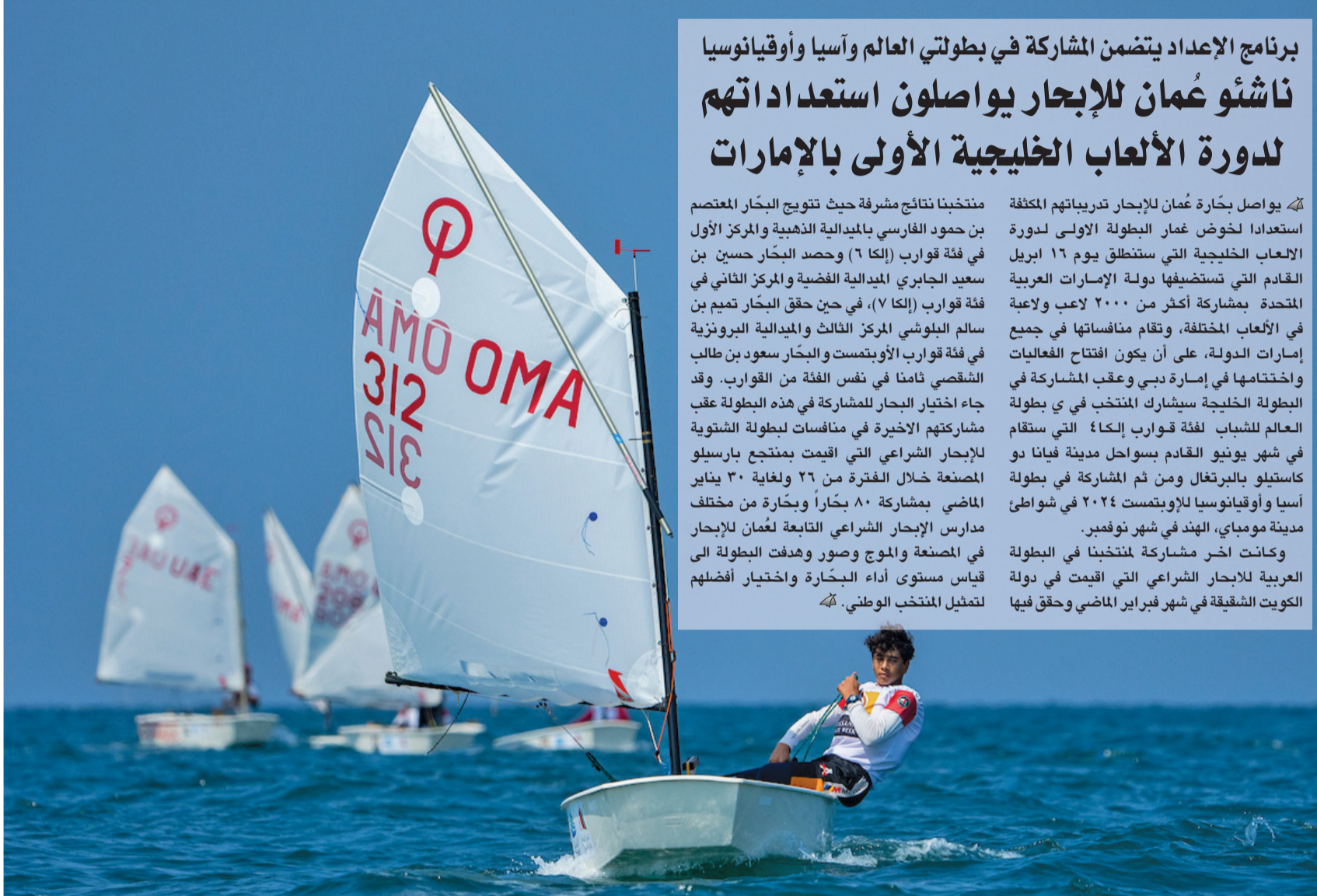
من تدريبات بحارة عمان للإبحار

جاءت نتائج القرعة على النحو التالي: المجموعة الأولى وتضم فرق الشاطئ، النجوم، اتحاد الشرس، حبراء، وادي المعاول المجموعة الثانية تضم القريم، الأخوة، الاتحاد، بركاء، وأبو النخيل بركاء والمجموعة الثالثة تضم سور، المغسر، شباب المريجات، بركاء، برج ال خميس، المراغة، والمجموعة الرابعة فتضم القريجات، الطريف، جبل الصاعد السد، وستنتقل البطولة مع مطلع شهر رمضان المبارك.