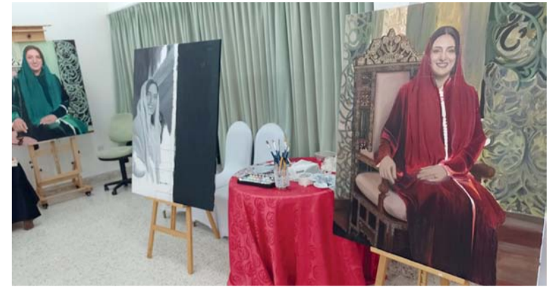
شارك بالمعرض ثمانية فنانين تشكيليين