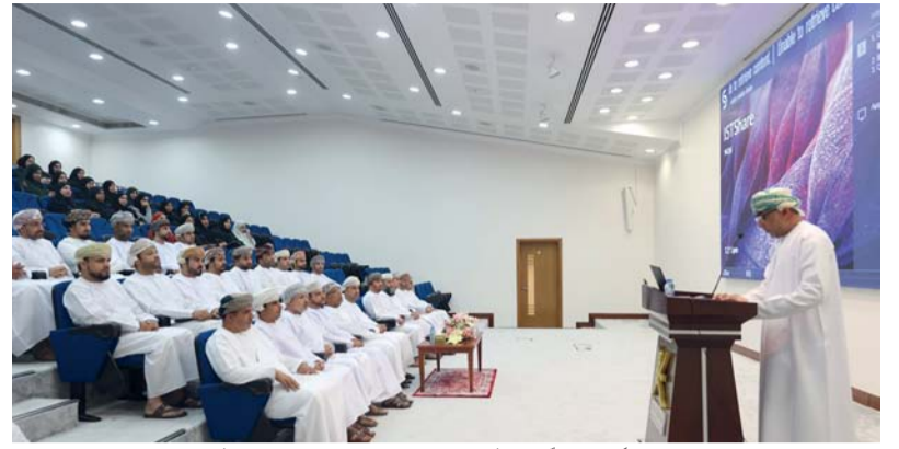
الموقع يسهل عمليات البحث عن المعلومات القانونية

وتنص الاتفاقية على أن تتولى وزارة التربية والتعليم تحديد عدد وسائل النقل المدرسية المراد إحلالها سنوياً وفقاً للاعتمادات المالية المتاحة بدءاً بالأقدم صنفاً، كما تقوم وزارة التربية والتعليم بإبرام عقود واللوائح المعتمدة مع المستهدفين بإحلال حافلاتهم المدرسية بعد