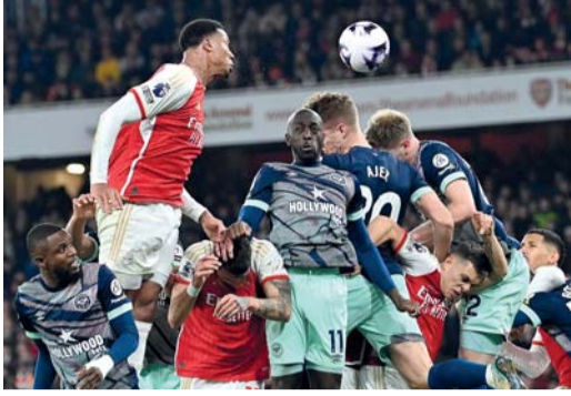
■ لاعب أرسنال جابرييل ماجالهايس (يسار) يرتقي أمام لاعبي برينتفورد.