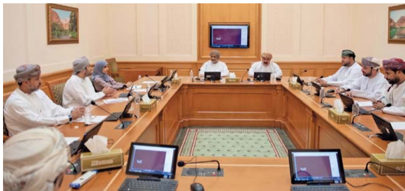
اللقاء استعرض تجربة الأكاديمية السلطانية في مجال الإدارة

مسقط - «الوطن» استضافت لجنة الخدمات والمرافق العامة بمجلس الشورى صباح أمس، عدداً من المختصين من الأكاديمية السلطانية للإدارة؛ وذلك في إطار دراستها المقترح مشروع قانون الإدارة المحلية والذي يأتي ضمن خطة اللجنة لدور الانعقاد السنوي الحالي. حيث جرى خلال اللقاء استعراض تجربة الأكاديمية الإدارية المحلية والتي توفرها الأكاديمية لتطوير الكفاءات المحافظين والولاة والقيادات الحكومية في سلطنة عمان. كما تم التعرف على أبرز التوجهات العالمية في مجال الإدارة المحلية التي تواجههم في مجال البرنامج. وتطرق اللقاء كذلك إلى بعض التجارب في مجال الإدارة المحلية سواء على النطاق الإقليمي والدولي. ويهدف مركز الإدارة المحلية في الأكاديمية السلطانية للإدارة إلى تعزيز الإدارة المحلية بكفاءة وفعالية من خلال عمل بحوث ودراسات وتقديم الخدمات الاستشارية وتطوير وتنفيذ البرامج التعليمية. كما تقوم المبادرة على دعم القيادات المحلية في المحافظات على إحداث تنمية محلية متوازنة لتحقيق رؤية