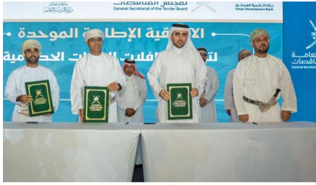
أثناء التوقيع على الاتفاقية

وقال سعادة ماجد بن سعيد البحري وكيل وزارة التربية والتعليم للشؤون الإدارية والمالية حول هذه الاتفاقية: في إطار سعي وزارة التربية والتعليم والبحث نحو تطوير، وتجويد عملية النقل المدرسي، وحرصاً منها على إيجاد الحلول اللازمة، ومعالجة التحديات التي قد تؤثر على سير العملية التعليمية، ولوجود عدد من وسائل النقل المدرسية قديمة الصنع التي بحاجة إلى تغيير بما يحقق رضا أبنائنا الطلبة، وامتثالاً للتوجهات السامية التي قضت بالتركيز على المشاريع النوعية التي يتوقع منها تقديم قيمة مضافة للاقتصاد الوطني وإيجاد فرص استثمارية للمؤسسات الصغيرة والمتوسطة.