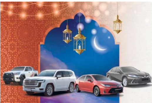
تويوتا تمتلك تشكيلة مشوقة من السيارات

مجهزة بمزيج مثالي من ميزات القوة والكفاءة في استهلاك الوقود والمساحة الرحبة، وميزات السلامة المتقدمة ليتيح للمالكين الاستمتاع من كل رحلة. وتأتي كامري مع ثلاثة خيارات من مجموعة ناقل الحركة. وهي تشمل على محرك بقوة لتر سداسي الأسطوانات على شكل ٧ المزود بشاحن تيربو مزود، أداء رائد في فئته يفوق أداء محركات الثنائي أسطوانات التقليدية، وينتج قوة ٤٠٩ حصنة وعزم دوران يصل إلى ٦٥٠ نيوتن-متر.