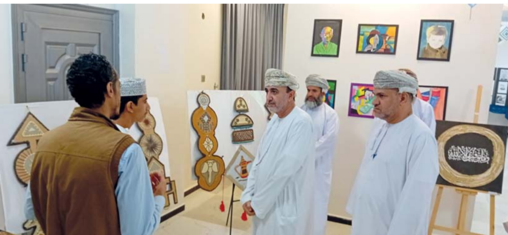
المعرض ضم ١٣٠ عملاً فنياً