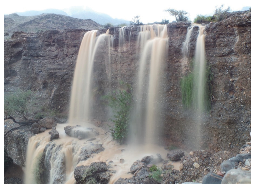
■ تدفق الشلالات بالرسحاق

معظم مناطق وأودية الولاية وقد نزلت من أعالي الجبال سيول وأودية وشعاب أسهمت في جريانها الأراضي المتشعبة بمياه الأمطار التي شهدتها المنطقة خلال الفترة الماضية. وقد استبشر المواطنون بهذه الأمطار التي بسببها لبست الجبال والصحاري اللون الأخضر من الأشجار وامتدت المراعي الخضراء على مد البصر مما تبشر هذه الأمطار بزيادة المياه الجوفية واتساع الرقعة الزراعية في مختلف مناطق وأودية الولاية. من جانب آخر قالت اللجنة الوطنية لإدارة الحالات الطارئة إنها تعاملت خلال 24 ساعة مع 22 بلاغا جرى على أساسها إنقاذ 39 شخصا.