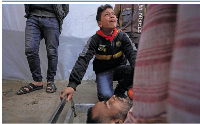
طفل فلسطيني أمام جثمان أحد أسرته في باحة مستشفى شهداء الأقصى في دير البلح وسط قطاع غزة، بعد استشهاده في غارات إسرائيلية استهدفت النازحين غرب خان يونس.

صحار. العُمانية: تحتفل المنطقة الحرة بصحار بمحافظة شمال الباطنة اليوم بوضع حجر الأساس لمشروع مصنع البولي سيليكون باستثمار يفوق (٥٢٠) مليون ريال عماني، ويتوقع افتتاحه خلال عام ٢٠٢٥ م. ويقام المشروع على مساحة تبلغ (١٦٠) ألف متر مربع لإنتاج سيليكون معدني عالي الجودة بسعة تبلغ (١٠٠) ألف طن سنوياً، حيث تجري عملية الإنتاج عن طريق صب السيليكون المعدني السائل من الفرن إلى القوالب، ثم يتم تبريده عن طريق القوالب أو الصب المستمر، وبعد التبريد يتم طحن السيليكون المعدني وتعبئته للتصدير العالمي.