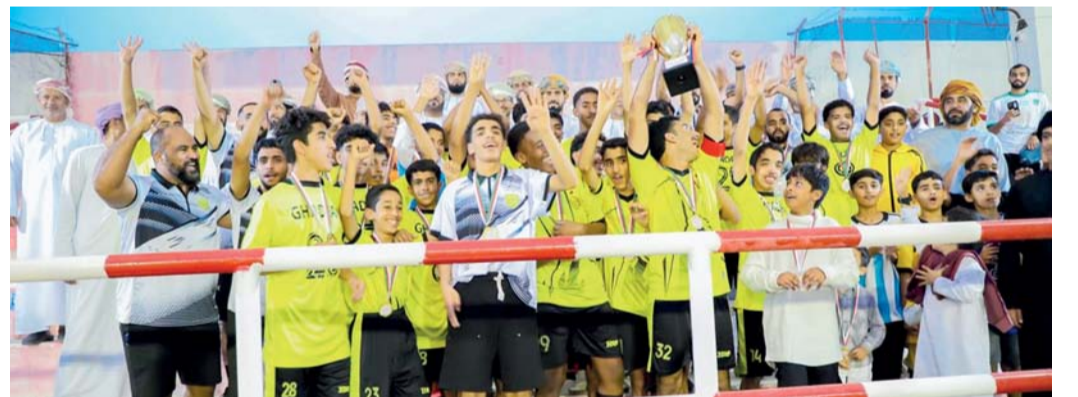
تتويج فريق غضفان بكأس بطولة المراحل السنية

عدل الاتحاد العماني لكرة القدم عبر رابطة الدوري العماني برنامج مباريات الدور النهائي لمسابقة دوري الشباب تحت سن ١٩ سنة للموسم الحالي بعد أن كان مقرراً أن يقام يوم الجمعة الماضي بسبب الأنواء المناخية ليكون الموعد الجديد يومي الأربعاء والقادم بإقامة مباراة تحديد المركزين الثالث والرابع بين فريقين سمانل والخابورة ويوم الخميس القادم المباراة الختامية للمسابقة والتي ستجمع فريق السويق وصحم بمجمع الرستاق وتقام المباراتان في الساعة الثامنة مساءً، وكانت لجنة الإنضباط قد أصدرت قراراً الأسبوع الماضي بحرمان فريق الخابورة من النقاط الثلاثة التي اكتسبتها من فريق صحم في لقاء النصف النهائي بمخالفته بإخال لاعب حصل على ثلاث بطاقات صفراء لتقرر لجنة الانضباط اعتبار الخابورة خاسراً وتصعيد صحم إلى المباراة النهائية.