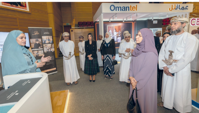
تعريف قطاعات العمل ببرامج الجامعة الأكاديمية

خبراء مختصين في الموارد البشرية لمراجعة السير الذاتية للطلبة وخريجي الجامعة وإرشادهم إلى أفضل الطرق لإعدادها وتطويرها، وإجراء اختبارات ومقابلات توظيف لشركة ظفار للتأمين لمدة يومين، وهناك ركن خدمات ودعم خاص بالمؤسسات الراغبة في إجراء مقابلات توظيف خال أيام المعرض، ويتوافر ركن توعوي يُعنى بمساعدة الطلبة والخريجين للتخطيط لمستقبل مهني ناجح.