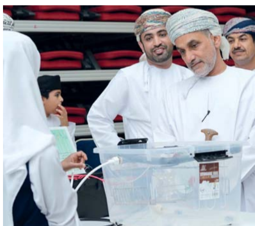
أثناء الأطلاع على معرض الابتكارات العلمية

التبعتات على معرض الابتكارات العلمية. وتضمن لوحات عن التحوير والحياد الكربوني والسيارات الكهربائية الصديقة للبيئة من الرحلات العلمية منها زيارة لدراسة ظاهرة تآكل الشواطئ وزراعة شتلات القرم. كما يحتوي على معرض ختامي