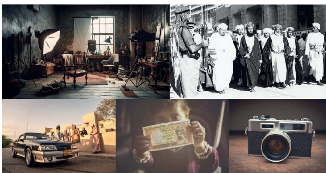
المعرض يضم صورا قديمة للسلطان الراحل وكاميرات كلاسيكية ومقتنيات خاصة