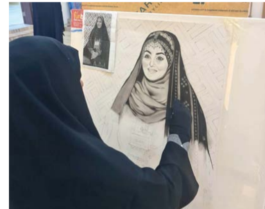
إحدى الفنانات تعكف لإنجاز إحدى لوحاتها الفنية

واسع بمختلف محافظات سلطنة عمان، إظهار المواهب الواعدة في هذا المجال. حيث قامت الجمعية بتهيئة الموقع ليكون هادئ والإضاءة كافية للمشاركين وتوفير كافة الإحتياجات والمستلزمات الخاصة بتلك المسابقة، كما قامت الجمعية من خلال الأعمال الفعالة وتقديم أعمال مميزة وأعضائها بتوعية وأهمية تلك المسابقة في ورعاية تعكس إبداع المرأة العمانية.