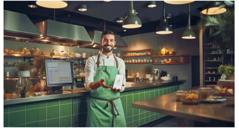
مزايا خاصة يقدمها بنك ظفار للمؤسسات الصغيرة والمتوسطة

مسقط. «الوطن»: أعلن بنك ظفار مؤخرا عن إطلاق الحساب المصرفي للمؤسسات الصغيرة والمتوسطة حيث يقدم مجموعة متنوعة من الحلول المصرفية لقطاع المؤسسات الصغيرة والمتوسطة في سلطنة عمان والتي تتناسب مع الاحتياجات اليومية للزبائن كما يوفر مميزات تساعد على تحسين أعمالهم مع شبكة الفروع الموسعة والحلول الرقمية المتطورة والتكامل التكنولوجي الاستراتيجي. وتأتي المميزات الأساسية لحساب المؤسسات الصغيرة والمتوسطة في فتح حساب ميسر لما يسهل على الشركات بدء رحلتها المصرفية ويمكن للزبائن زيارة أي من الفروع الـ 115 المنتشرة في جميع أنحاء السلطنة ودعم الاتصال مع نقاط البيع من خلال الاستفادة من نظام نقاط البيع عبر الأجهزة الذكية (SoftPOS) وأنظمة نقاط البيع العادية وحل نظام حماية الأجور (WPS) حيث يقدم حلا فريدا لنظام حماية الأجور (WPS) الذي يعمل على تبسيط عملية دفع الرواتب، ويوفر طريقة مرحة وفعالة لإدارة رواتب الموظفين حيث