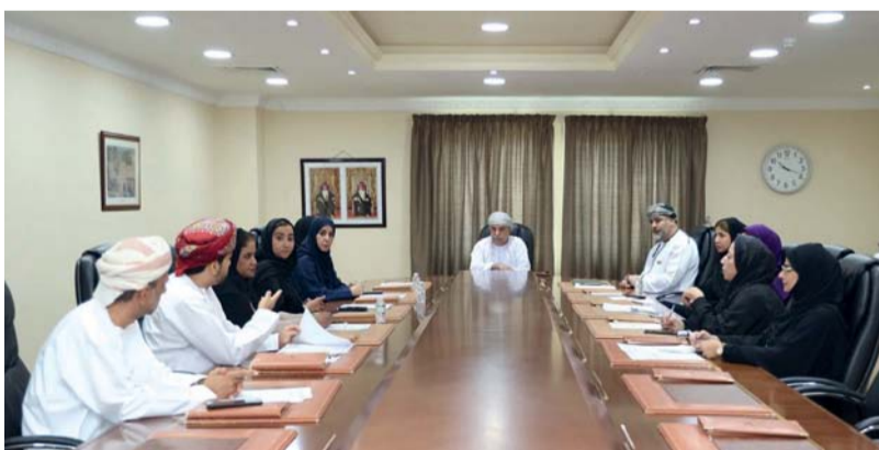
اللقاء استعرض المهام الموكلة للجهات المعنية

عقد فريق التعاون المشترك بين هيئة حماية المستهلك والجمعية العمانية لحماية المستهلك، بدووان عام الهيئة أمس الاجتماع الأول بحضور رئيس الفريق والأعضاء، وذلك إيماناً بالدور التكاملي والعمل المشترك بين المؤسسات والوحدات الحكومية والأهلية في سلطنة عمان. تم التطرق خلال الاجتماع لعدد من المحاور أهمها مناقشة خطة عمل فريق التعاون المشترك، والتأكيد على أهمية مواكبتها مع خطة جمعية حماية المستهلك للعام الجاري، واستعراض أبرز المهام المتعلقة بكل الطرفين، كما تم خلال الاجتماع مناقشة ما تم إنجازه فيما يتعلق بفتح مكاتب للجمعية بالمحافظات، الأمر الذي سيمكنها من تنفيذ أنشطتها المختلفة لمختلف شرائح المجتمع في محافظات سلطنة عمان.