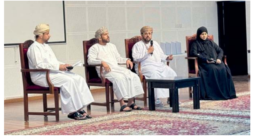
الملتقى استعرض أهم المبادرات في ريادة الأعمال