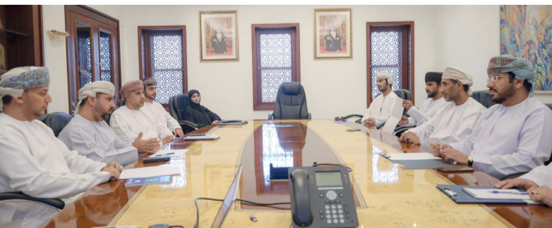
أثناء اللقاء المشترك بين بلدية مسقط وبلدية ظفار

العمل البلدي. وفي الجانب الآخر أشاد وفد بلدية ظفار بما تم تقديمه خلال اللقاء التعريفي والجهود المبذولة من قبل بلدية مسقط في مختلف قطاعات العمل البلدي.