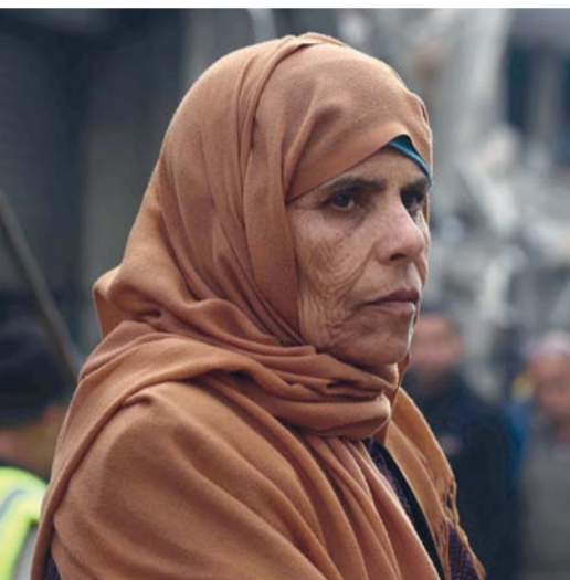
فلسطينية تنتظر إلى انقضاء منزل دمره القصف الإسرائيلي في رفح.