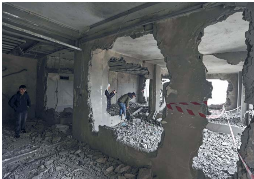
فلسطينيون يتفقدون انقاض منزل معاد المصري بعد أن فجرت القوات الإسرائيلية في نابلس بالضفة الغربية المحتلة.

واشنطن. أ.ف.ب. أعلن زعماء الكونجرس الأمريكي التوصل إلى اتفاق لتمويل جزء كبير من الميزانية الفدرالية، سيسعى مجلس النواب والشيوخ لإقراره قبل مهلة تنتهي خلال الأسبوع الحالي. وقال زعيم الديموقراطيين في مجلس الشيوخ تشاك شومر «يشكل توصل الكونجرس إلى اتفاق بين الحزبين حول القوانين الست الأولى للتمويل الحكومي التي تسمح للحكومة بالاستمرار بالعمل، نبأ ساراً». واتفق قادة الكونجرس على حزمة تدابير بقيمة ٤٦٠ مليار دولار يجب أن تقر في مجلسي الشيوخ والنواب في البرلمان الأمريكي. وحذر شومر من أن «الوقت يدهم لأن تمويل الحكومة ينفذ الجمعة. يجب على مجلس النواب أن يسرع في إقرار هذا الاتفاق وإرساله إلى مجلس الشيوخ».