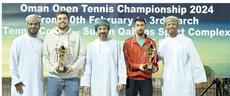
تتويج الفائزين بالمركز الأول في فئة الزوجي رجال