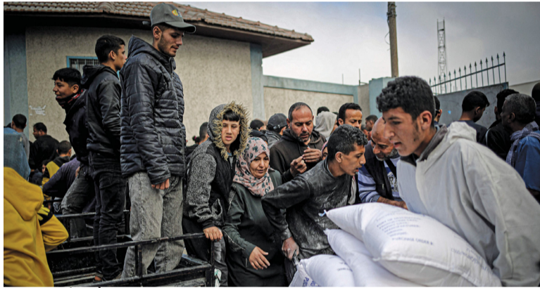
فلسطيني ينقل أكياس المساعدات الإنسانية في مركز التوزيع التابع لوكالة الأمم المتحدة لإغاثة وتشغيل اللاجئين الفلسطينيين (الأونروا)، في رفح جنوب قطاع غزة.

كشفت تحقيق أجرته وكالة (الأونروا) أن قوات الاحتلال الإسرائيلي استخدمت وسائل تعذيب وتنكيل وحشية بحق مئات المعتقلين من سكان قطاع غزة، الذين تم أسرهم منذ بداية العدوان وسط جرائم ارتكبتها الاحتلال بحق النظام الصحي، حيث استشهد (٣٦٤) من الكوادر الصحية واعتقل (٢٦٩) بينهم مديرو مستشفيات، مع تدمير (١٥٥) مؤسسة صحية، في حين أن عدد الشهداء من الأطفال ارتفع إلى (١٣,٤٣٠)، والنساء إلى (٨٩٠٠). وواصل الاحتلال ارتكاب المجازر والتي منها استشهاد (١٩) على الأقل في سلسلة غارات نفذتها طائرات الاحتلال الإسرائيلي على مدينة رفح جنوب قطاع غزة، ومخيم النصيرات وسطه. وانتشلت طواقم الإسعاف جثامين (١١) شهيداً من مناطق متفرقة في خان يونس جنوب قطاع غزة منذ صباح أمس.