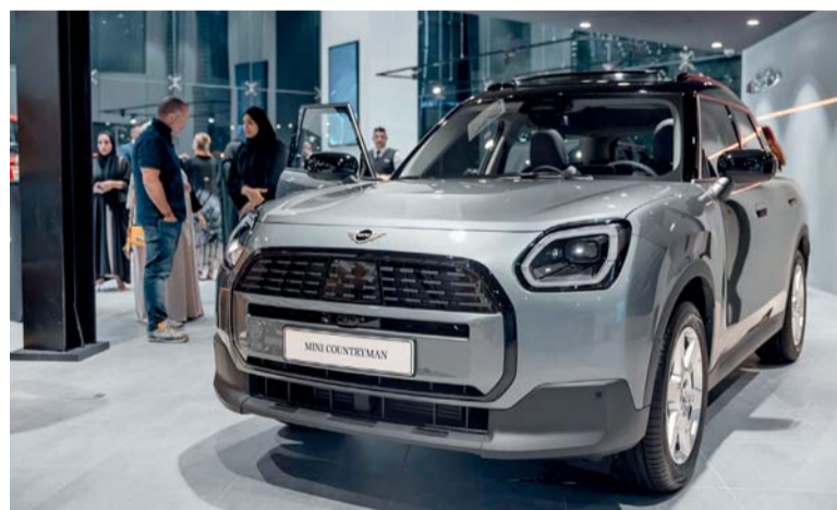
سيارة MINI Countryman الجديدة كلياً