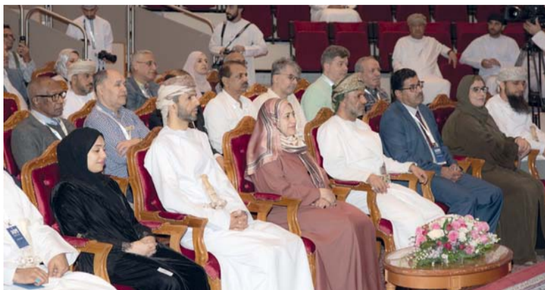
المؤتمر يعزّز إمكانيات التواصل بين الباحثين

العناية بالرياضيات في هذا المؤتمر احتفالاً باليوم العلمي للرياضيات Pi day والذي يصادف ١٤ مارس من كل عام. وتأسست اللجنة العُمانية للرياضيات عام ٢٠١١ كمرجعية للنشاطات الرياضية؛ سواء كانت على مستوى مؤسسات التعليم العالي أو مدارس وزارة التربية والتعليم أو نشاطات المجتمع المحلي. كما أضفت أن اللجنة شاركت في العديد من النشاطات مثل عقد المؤتمر الدولي «يوم الرياضيات العمانية» سنوياً، حيث سيعقد يوم ١٠ أكتوبر القادم وعقد العديد من الحلقات التدريبية مع وزارة التربية، وإطلاق أول مخيم صيفي للأطفال عن تطبيقات الهاتف الخليوي في الرياضيات وبرنامج ست. ويهدف المؤتمر إلى تعزيز مكانة جامعة السلطان قابوس على المستوى الإقليمي والدولي كمرکز بحثي مرموق، كما يهدف إلى توفير فرصة لعلماء الرياضيات والباحثين والأكاديميين والطلبة من الجامعة والمؤسسات البحثية الإقليمية والدولية لعرض أعمالهم وتبادل الخبرات والأفكار في أحدث التطورات الناشئة.