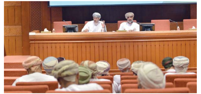
أعضاء لجنة الشباب والموارد البشرية خلال اللقاء مع رؤساء الأندية

وقعت وزارة الثقافة والرياضة والشباب صباح أمس بقاعة لبانة بحدائق معاني اتفاقية مع مركز عمان للحوكمة والاستدامة، وذلك تحت رعاية سعادة باسل بن أحمد الرواس وكيل وزارة الثقافة والرياضة والشباب للرياضة والشباب بحضور ممثلي المركز والوزارة، حيث تسعى الوزارة إلى توقيع هذه الاتفاقية من أجل إعداد حوكمة ممنهجة من الناحية العلمية والعملية لتأطير وتنظيم عمل اللجنة الأولمبية العمانية والاتحادات الرياضية العمانية. وقع الاتفاقية من جهة الوزارة سعادة باسل بن أحمد الرواس وكيل الوزارة للرياضة والشباب، ومن جهة المركز السيد حامد بن سلطان البوسعيدي المدير التنفيذي لمركز عمان للحوكمة والاستدامة. وقال السيد حامد بن سلطان البوسعيدي مدير مركز عمان للحوكمة: هذه الاتفاقية في غاية الأهمية، حيث إنها تعكس حرص واهتمام وزارة الثقافة والرياضة والشباب بالرياضة على إرساء مبادئ الحوكمة، ولا يخفى ذلك إلا من خلال أنظمة واضحة وبيئة