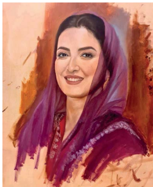
أحد الأعمال التي أبدعتها فنانات جمعية المرأة العمانية بصلالة

ضمن مبادرة جمعية المرأة العمانية بمسقط لرسم صورة السيدة الجليلة، والتي شاركت فيها كافة جمعيات المرأة العمانية على مستوى سلطنة عمان، تم اكتشاف العديد من المواهب العمانية الطموحة في فن الرسم بمختلف أنواعه.