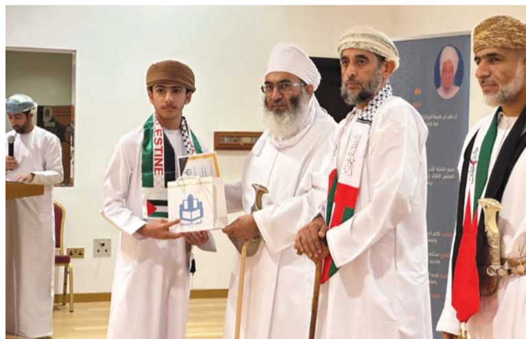
تكريم أحد الطلبة المُجيدین

علي الكندي، ونقدّم الشكر لكل من له بصمة وضّحوا بوقتهم وجهدهم في سبيل أداء رسالتهم، فهذه المراكز المنتشرة في مختلف ولايات السلطنة، فهي النور الذي يعم كافة القرى وكم من أناس بذلوا من جهدهم ومالهم الكثير لمثل هذه المراكز. وفي ختام الحفل قام راعي المناسبة بتكريم الطلبة والطالبات المجيدين في حفظ القرآن الكريم وإن كان هدفاً سامياً، فإنه ليس الغاية، وإنما الغاية هي تدبر القرآن وتطبيقه واقعاً في الحياة، وحفظ القرآن ما هو إلا وسيلة لتحقيق ذلك. كما ألقى الشيخ الدكتور عبدالله بن راشد السيابي راعي الحفل كلمة أشار فيها إلى أنها مناسبة سعيدة وليلة زاهرة ونحن نحتمي بطلبة القرآن الكريم بمرکز نخل، والطلبات المجيدين في حفظ القرآن العلامة سليمان بن