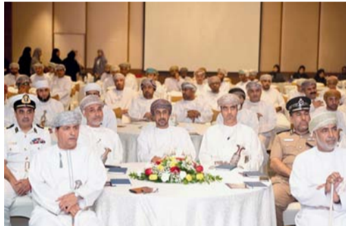
الملتقى يسلط الضوء على الجهود التنفيذية والإنجازات

لمديرية العامة للإسكان والتخطيط العمراني بمحافظة جنوب الباطنة. وجاء الملتقى ليلسط الضوء على الجهود التنفيذية والإنجازات المحققة التي تفخر بها المديرية في تنفيذ خطة الوزارة خلال عام ٢٠٢٣، ورقة عمل عن مشروع تكوير وأخرى عن مشروع تحويل نظام الخرائط إلى النظام العالمي 84WGS، ومجموعة من مقاطع الفيديو وأسكتش مسرحي مناظرة طلابية، حيث استعرض الملتقى