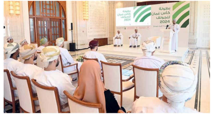
المشاركين في المؤتمر الصحفي