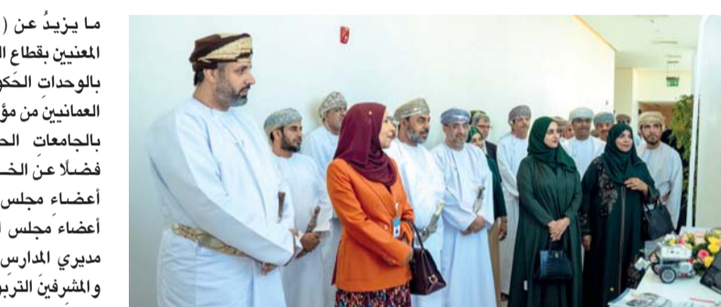
الندوة تطرقت إلى أهمية تعزيز جودة التعليم ورفع مستوى الخريجين في مجال التربية

ما يزيد عن (٣٥٠) مشاركاً من المعنيين بقطاع التعليم وإعداد المعلم بالوحدات الحكومية، والأكاديميين العامين من مؤسسات إعداد المعلم بالجامعات الحكومية والخاصة، فضلاً عن الخبراء من المكمّرين أعضاء مجلس الدولة والسعادة أعضاء مجلس الشورى وعدد من مديري المدارس والمعتمدين الأوائل والمشرفين التربويين لمناقشة خمس عشرة ورقة عمل في خمسة محاور رئيسية. وتضمن اليوم الأول للندوة عقد جلسات عمل، حيث ترأس سعادة الدكتور عبدالله بن خميس أميوسعدي وكيل وزارة التربية والتعليم للتعلم الجلسة الرئيسية