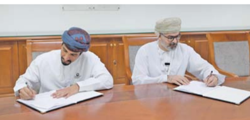
الاتفاقية تُعزِّز ثقافة السُّلَامة والصحة المهنية