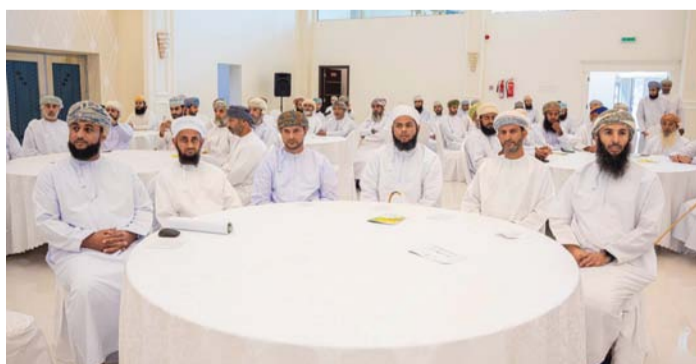
الملتقى جاء تشجيعاً على المزيد من الإسهام في الأعمال الخيرية التطوعية

المزيد من العطاء لخدمة الأسر المتعففة بسمد الشأن، وتنظيم الفعاليات المجتمعية، والإسهام في الأعمال الخيرية التطوعية. كما أنه تعبير عن جميل الإحسان