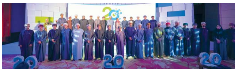
صورة جماعية لعدد من المشاركين في الاحتفالية

الانبعاثات الكربونية. وللمساهمة بدور أساسي في تحقيق ذلك، أبرمت الشركة اتفاقية تعاون مع شركة سينرجي للاستثمار وذلك لتأسيس شركة الأولى للسيارات الكهربائية (إيفو). وستولى هذه الشركة مهمة تطوير البنية الأساسية للسيارات الكهربائية في عُمان ودعم مبادرات النقل الأخضر بشكل عام.