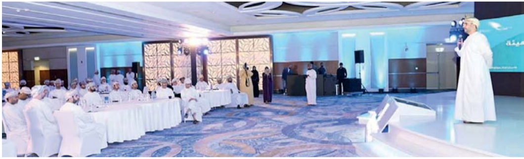
اللقاء تطرق إلى أعمال التدقيق التي قامت بها الهيئة مع الشركات المرخصة

وأوضح أن إجمالي الأعمال المسندة للمؤسسات الصغيرة والمتوسطة في قطاع الكهرباء بلغ ٢٢ مليون ريال عُمانى، و ٤٠ مليون ريال عُمانى في قطاع المياه والصرف الصحي، و ١١ مليون ريال عُمانى في قطاع نقل الغاز الطبيعي. مشيراً إلى أن الهيئة تعمل بالتوازي مع الجهات المعنية للمساهمة في الوصول للحياة الصغرى في عام ٢٠٥٠، حيث قامت في العام الماضي بمنح موافقتها لشركة نساء لشراء الطاقة