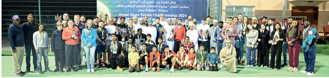
صورة جماعية للمشاركين في البطولة

اختتمت يوم أمس الأول منافسات بطولة عمان المفتوحة للتنس التي نظمتها الاتحاد العماني للتنس على مدار ثلاثة اسابيع، وشهدت مشاركة قياسية في عدد اللاعبين واللاعبات ومن مختلف الجنسيات وصلت الى ١٦٠ لاعبا ولاعبا في مختلف الأعمار، وهي بطولة أعاد الاتحاد تنظيمها بعد توقف طويل لها خلال السنوات الماضية وشهدت منافسة مثيرة في مختلف الفئات العمرية، وأقيمت على ملاعب التنس بمجمع السلطان قابوس الرياضي بوشهر. وجاء ختام البطولة تحت رعاية معتمد بن حمود الزنجالي رئيس الاتحاد العماني للتنس، بحضور أعضاء مجلس إدارة الاتحاد وجمهور جيد من عائلات اللاعبين المشاركين في البطولة.