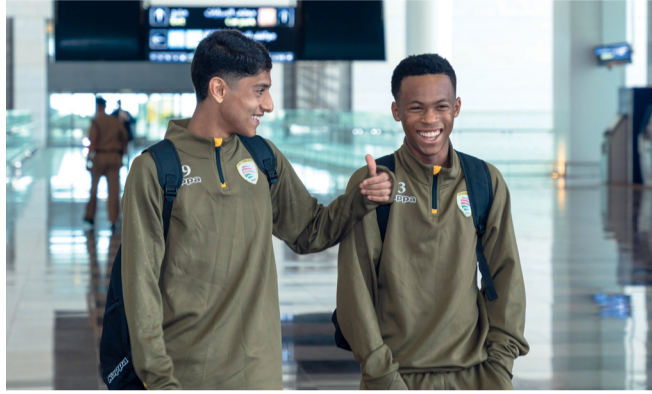
أحد أبناء منتخبنا في مطار مسقط

غادرت أمس بعثة منتخبنا الوطني لناشئ كرة القدم متوجهة إلى العاصمة القطرية الدوحة لإقامة معسكر خارجي هناك يستمر حتى الـ٧ من الشهر الجاري، يخوض خلاله مباراتين تجريبيتين أمام المنتخب القطري يومي ٦ و٤ مارس الجاري. وتأتي هاتان المبارتان في إطار برنامج إعداد للمشاركة في التصفيات الآسيوية المؤهلة لنهائيات كأس أمم آسيا التي ستقام خلال الفترة من الـ١٩ إلى الـ٢٧ من أكتوبر القادم، حيث ستقام النهائيات منتصف