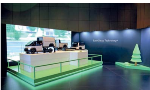
مركبات كيا الجديدة تلبى الاحتياجات المتنوعة للشركات والأفراد