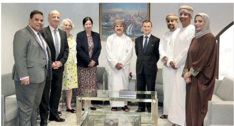
الوفد تعرّف على أدوار اللجنة في تعزيز وحماية حقوق الإنسان

والاعتماد لدى التحالف العالمي للمؤسسات الوطنية لحقوق الإنسان في المستوى (أ)، والتي تقوم برصد التجاوزات في مجال حقوق الإنسان، وتتعاون معها، وتنسق لهاها وتسويتها، وأبدى استعداده لتعزيز التعاون مع اللجنة في الموضوعات المتعلقة بحقوق