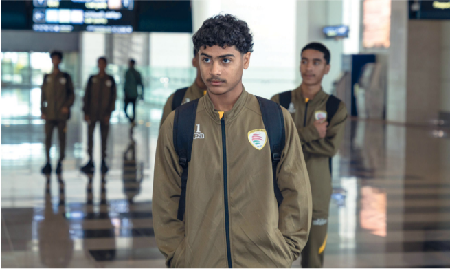
لاعبو منتخبنا في مطار مسقط قبل التوجه إلى الدوحة