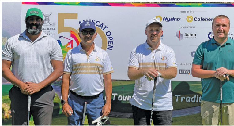
لقطة جماعية لعدد من اللاعبين المشاركين في البطولة