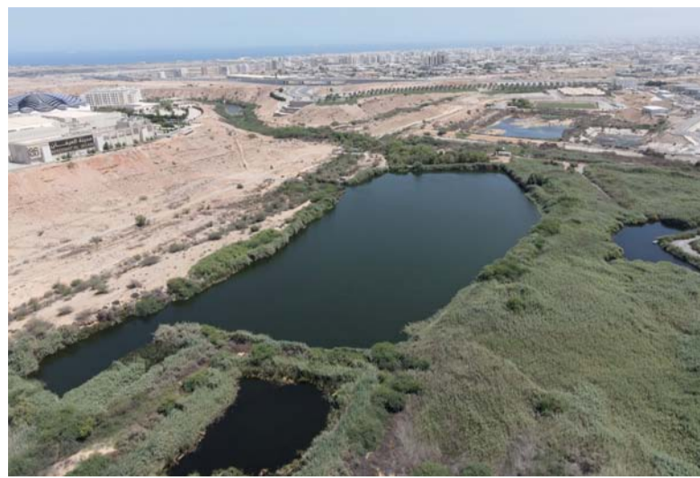
التوسع في استخدام الطاقة النظيفة وزيادة المساحات الخضراء

وقال: إنّه ولأهمية البعد البيئي في تحقيق التوازن المناخي، أولت نماء لخدمات المياه هذا الجانب اهتماماً ملحوظاً، وبما يتماشى مع المعايير الدولية، مما أهل الشركة للحصول على العديد من شهادات أنظمة إدارة الجودة العالمية ومنها: أنظمة الإدارة البيئية (الأيزو ١٤٠٠١).