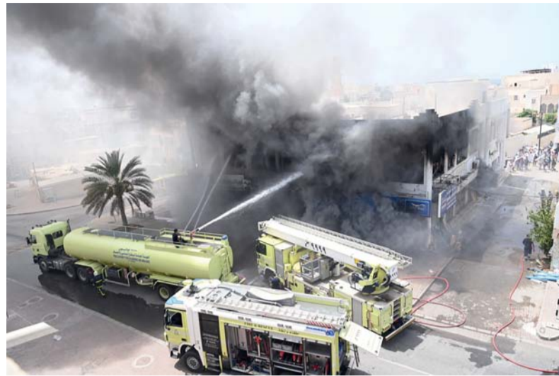
فرق الإطفاء أثناء التعامل مع أحد البلاغات