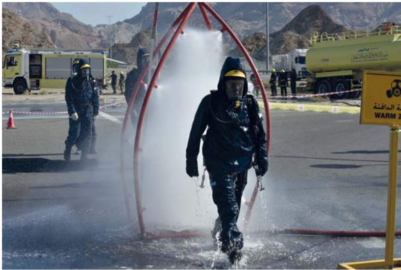
التعامل مع حوادث المواد الخطرة

جهود توعوية حصلت هيئة الدفاع المدني والإسعاف على المركز الثاني في المسابقة الدورية عن فئة الأعلام التوعوية والتثقيفية، وكذلك فئة المصاحبات التوعوية والتثقيفية المتعلقة بالحماية المدنية - الدفاع المدني - لعام ٢٠٢٣م التي تنظمها الأمانة العامة لمجلس وزراء الداخلية العرب. كما تولي هيئة الدفاع المدني والإسعاف اهتماماً كبيراً بتوعية منتسبيها (الجمهور الداخلي) وإرشادهم وإمدادهم بما يرقى بمستوى أدائهم وإنتاجهم واكتسابهم المهارات التدريبية اللازمة لضمان أفضل الأداء، كما تحرص على وضع القوانين والأنظمة للتقيد بالضبط والربط العسكري.