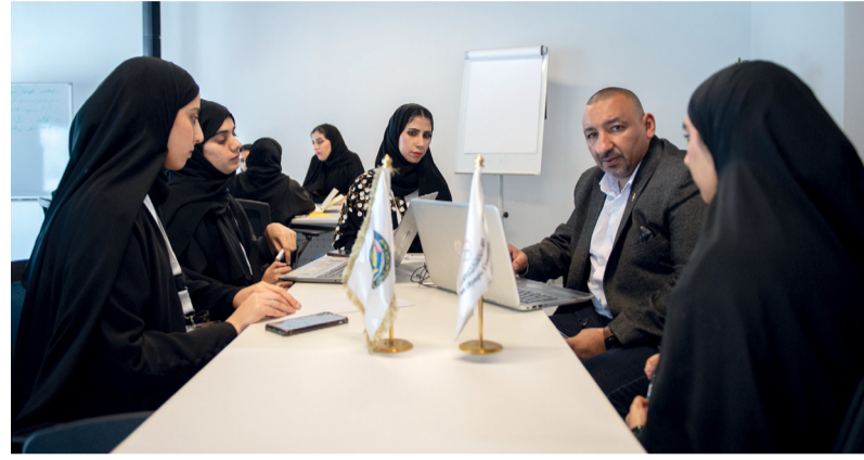
■ إحدى حلقات العمل

التي يتم استخدامها في تنظيم وإدارة العمل الرياضي، وأشارت إلى مساهمة الأدوات في تطوير منظومة الرياضة بشكل عام ورياضة المرأة على وجه الخصوص، وفي الجانب الإعلامي تحدثت عن تجربتها الشخصية الممتدة لسنوات في المجال الإعلامي بين الصحافة والتقديم التلفزيوني. وأوضحت أن المرأة الخليجية قادرة على أن تقدم القيمة المضافة في المجال الإعلامي وأن يكون لها الدور البارز في العمل الصحافي وإبراز كافة الجهود الرياضية وتطبيقاتها وتحليلها بطرق منهجية توازي التقدم الرياضي على المستوى العام وعلى المستوى الخليجي بشكل خاص. كما أشارت إلى أن المرأة الخليجية لها ميزة خاصة في المجال الإعلامي الرياضي كونها