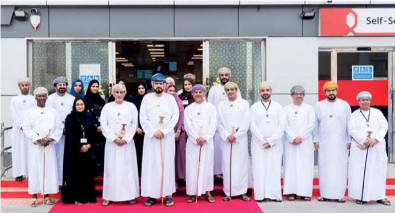
الحضور المشاركون في افتتاح فرع بنك مسقط الجديد بالمعبلة الجنوبية