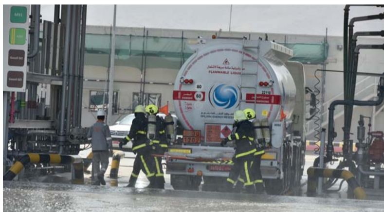
أحد التمارين العمليّة

والإسعاف في توظيف الكوادر الوطنية من الجنسين في مختلف التخصصات لتعزيم وتجويد الخدمات التي تقدمها وضمان استدامتها، وسعت إلى تأهيلهم وتدريبهم بمستوى عال على يد مختصين وخبراء دوليين، ليتمكنوا بالعمل وهم على أتم الجاهزية. وتماشياً مع توجهات رؤية «عمان ٢٠٤٠»، الرامية إلى تمكين القطاع الخاص وجذب الاستثمار الأجنبي فقد عملت الهيئة مع الجهات ذات الاختصاص على مراجعة الرسوم الخاصة بإصدار تراخيص وشهادات الحماية المدنية، فقد أفضت عملية مراجعة رسوم هيئة الدفاع المدني والإسعاف إلى تخفيض وإلغاء ودمج ١٥ رسماً، إذ تم تخفيض ودمج ١٤ رسماً وإلغاء رسم واحد من بينها تسببت عدد من الرسوم أهمها رسم ترخيص الحماية المدنية ليكون رسماً واحداً وتخفيض رسم دراسة المخططات (ترخيص الأمن والسلامة) ورسم ترخيص المكاتب الاستشارية والفنية والهندسية في مجال الحماية المدنية.