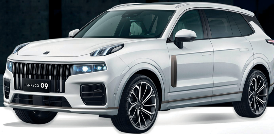
23 وظيفة مقدمة للمساعدة أثناء القيادة