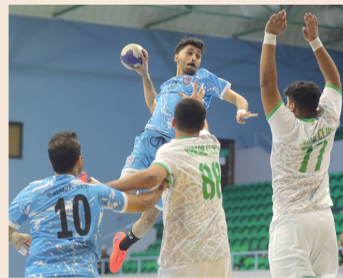
■ من مباراة صلالة وخصب في دوري الدرجة الأولى لكرة اليد

انطلاقة قوية شهدتها الجولة الأولى من الدور الأول لدوري عام سلطنة عمان للدرجة الأولى لكرة اليد للموسم الرياضي ٢٠٢٣/٢٠٢٤؛ حيث تفوق أهلي سداب على نزوى بنتيجة ٢٩/٢٧ في المباراة التي جرت أحداثها على ملعب الصالة الرئيسية بمجمع السلطان قابوس الرياضي ببوش. وفي المباراة الثانية حقق نادي السيب نتيجة كبيرة بفوزه على خصب بنتيجة ٤٢/١٤ حيث يدخل السيب منافسات الدوري بقوة بعد سلسلة التعاقبات الكبيرة التي قام بها مجلس إدارة النادي لتدعيم صفوف الفريق بمجموعة من اللاعبين المجدبين، وكان لهذا التعاقب وصول النادي إلى المباراة النهائية لمسابقة درع الوزارة لملاقات نادي عمان في النهائي الذي سيقام يوم ١٠ من الشهر الجاري، وفي المباراة الثالثة استهل نادي صلالة مشواره في الدوري بالفوز على نادي خصب بنتيجة ٢٣/٧.