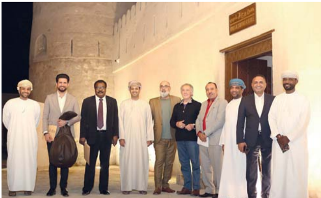
الشعراء المشاركون في الأمسية الشعرية