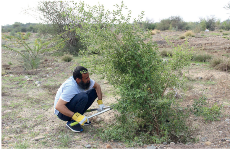
الاهتمام بالأشجار وتحسين الغطاء النباتي

هيئة البيئة جهودها نحو الاهتمام بالأشجار وتحسين الغطاء النباتي في المناطق الطبيعية في البلاد، ورفع الوعي بأهمية زيادة المساحة الخضراء وفوائدها على البيئة والمجتمع، ومساهمة جميع شرائح المجتمع في المحافظة على البيئة الطبيعية، بالإضافة إلى تفعيل مشاركة المجتمع في الحفاظ على النباتات البرية والحفاظ على التنوع النباتي، حيث إن بروز ظاهرة القطع العشوائي للأشجار والشجيرات والرعي الجائر، والتأثيرات المناخية المختلفة مثل الجفاف المتصاعد والتصحر، يسهم بشكل خطير في تراجع النباتات الطبيعية، مما يتوجب إكثار الأشجار البرية وإعادة زراعتها، والذي سوف يسهم في استعادة الغطاء النباتي والتقليل من التصحر في المناطق المتدهورة، كما أنها ستساهم في التقليل من تركيز ثاني أكسيد الكربون في الغلاف الجوي والآثار المترتبة على ظاهرة التغيرات المناخية في السلطنة.