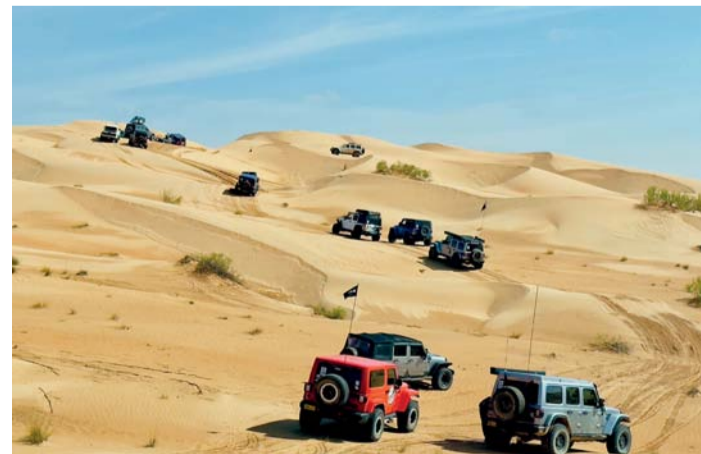
عودة مسابقات جيب جامبوري إلى سلطنة عمان

أقيمت مؤخرا في صحراء ولاية الكامل الوافي فعالية جيب جامبوري بسلطنة عمان بعد توقف دام خمس سنوات والتي تنظمها شركة محسن حيدر درويش للمركبات ش.م.م وذلك بمشاركة ما يقرب من ١٠٠ سيارة جيب رانجلر وأكثر من ٢٠٠ مشارك من عشاق المركبات لثلاثة أيام.