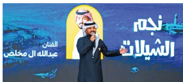
الأمسية شهدت فعاليات متنوعة

المصنعة . من خليفة الفارسي: نظمت شبكة المصنعة الثقافية بالتعاون مع قافلة عمان الثقافية أمسية أدبية بعنوان (عندما يتكلم الشعر تزهو الأشجار)، وذلك في (حصون كافيته) بولاية المصنعة، بمشاركة عدد من الشعراء منهم الشاعر العراقي بتفاعل كبير من قبل الجمهور.