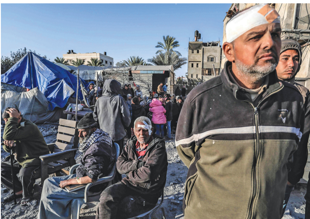
فلسطينيون مُصابون وسط أنقاض مسجد وملاجئ مؤقتة دُمّرتها الغارات الإسرائيلية على دير البلح بغزة.

مسقط - العُمانية: بعثت حضرة صاحب الجلالة السلطان هيثم بن طارق المعظم - حفظه الله ورعاه - برقية تهنئة إلى فخامة الرئيس الدكتور رومين راديف رئيس جمهورية بلغاريا، بمناسبة العيد الوطني لبلاده. أعرب جلالتة من خلالها عن أطيب تهانيه وأصدق تمنياته لفخامته ولشعب بلاده الصديق.