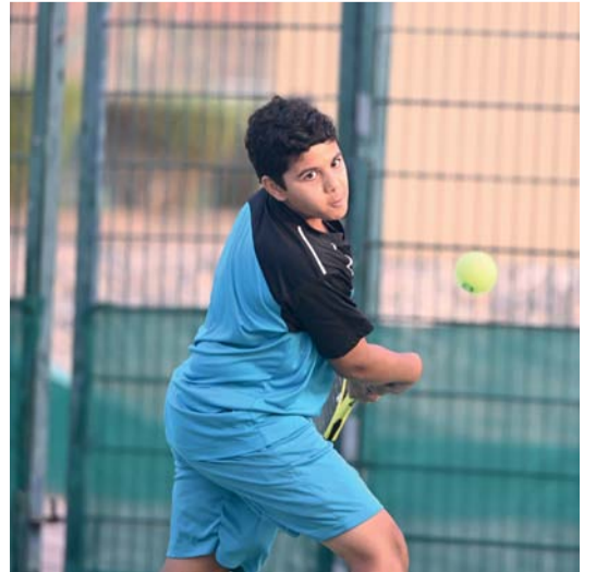
من منافسات البطولة المفتوحة للتنس