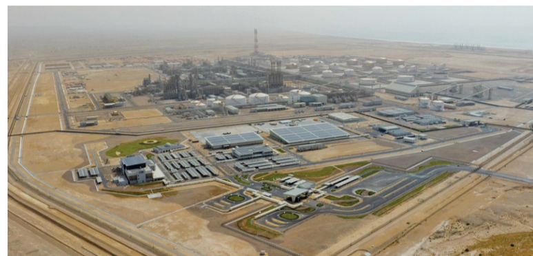
المناطق الصناعية تجذب الاستثمارات المحلية والأجنبية