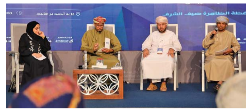
الشعراء المشاركون في الأمسية

ونظم شؤون البلاط السلطاني ممثلاً في الهجانة السلطانية ندوة عن (تاريخ الإبل) شاركت بها مجموعة من الباحثين والمختصين في شؤون الإبل في سلطنة عمان من خلال تناول ٣ محاور: المحور العلمي (دور المختبرات والبحوث الحيوانية في صحة الإبل) والمحور التاريخي