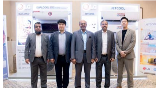
صورة جماعية لعدد من المشاركين في تدشين منتجات إل جي

عرضت مؤخرا إل جي إلكترونيكس الشركة الرائدة في مجال التكنولوجيا بمؤتمر معرض الوكلاء في سلطنة عمان تشكيلات منتجاتها لعام ٢٠٢٤ من حلول مكيفات الهواء السكنية الأكثر كفاءة واستدامة ونكاه لتحسين البيئة المحيطة بالمستخدم سواء في المنازل أو المكاتب. ويأتي مكيف LG DUALCOOL ذو السدورة العكسية حيث يضمن التبريد المستمر مع توفير الطاقة لبيئة أكثر خضرة وتقديم أداء أفضل كما يتوفر الضاغط العاكس في LG ARTCOOL, DUALCOOL و Big, DUALCOOL Smart و DualCOOL Pro، وهو السر وراء التبريد المذهل حيث أنه يحسن أداء التبريد ليكون أسرع بنسبة ٦٠٪ مع توفير ٦٥٪ من الطاقة ويمكن للسكان الحصول على تبريد أكثر بنسبة ١٥٪ مع الضاغط العاكس المزوج، حيث يمكنه العمل بسرعة المزوج، من الضاغط العاكس التقليدي ليضمن تبريدا دقيقا بالحفاظ على درجة الحرارة العدة حتى أثناء التشغيل بالمستوى الأدنى. وتتميز بتصميم بسيط وعصري عبر جميع المنتجات، ما يجعلها مثالية لكل مكان وتتضمن خيار تحريك الشفرات الرباعي لتوزيع تدفق الهواء لتبريد مثالي وتعيد تعريف التزامها تجاه جودة الهواء بدمج فلتر الحماية المزوج في حلولها للدفاع ضد الجزيئات الدقيقة والبكتيريا ويقوم الأيونيزر Plasmater بتعقيم أكثر من ٩٩٪ من البكتيريا المتصقة ويزيل الروائح من البيئة. وتتضمن LG DUALCOOL ذات السدورة العكسية و ARTCOOL ذو اللون الأسود الحديث الإعلان عنه بالإضافة إلى DUALCOOL Smart و Big, DUALCOOL Pro. وسيتم عرض حلول