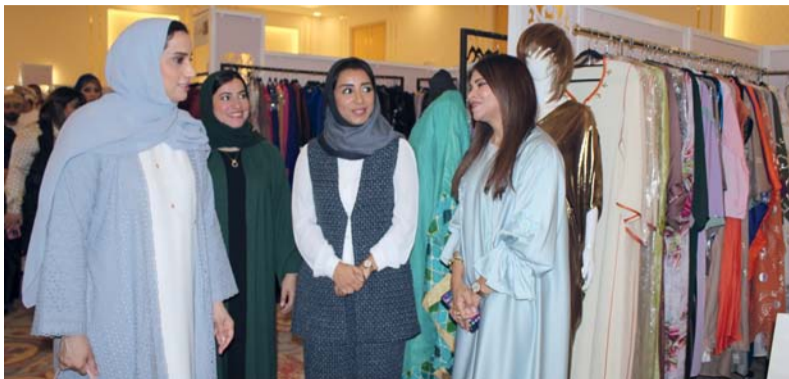
المعرض يهدف إلى الترويج للمؤسسات الصغيرة والمتوسطة ودعمها

بالقوة الشرائية بالسوق المحلي ومشاركتهم الشباب العماني لبعض الأفكار التطويرية في مجال ريادة الأعمال، ومن أهداف هذا المعرض أننا نسعى إلى إيجاد الشراكات وسبل التعاون مع المؤسسات ذات التوجهات أو المجالات المرتبطة من أجل تحقيق التأثير وصنع التغيير للمشاريع المشاركة.