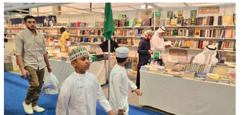
الركن السعودي شهد إقبالاً كبيراً

مسقط . العمانية: نظمت محافظة الظاهرة ضيف شرف معرض مسقط الدولي للكتاب ضمن الفعاليات الثقافية المصاحبة للمعرض في دورته الـ ٢٨ محاضرة بعنوان (الظاهرة بلاد السر من خلال المخطوطات العمانية) حيث تطرق أحمد بن علي الناصري الباحث في التاريخ العُماني إلى تعريف ببلاد السر كما ذكرها المؤرخون والعلماء في المخطوطات - وهي الأرض الكريمة الطيبة - وتعرف أيضاً بأنها جوف كل شيء ولبه، وهذا ما ذكره الزبيدي صاحب كتاب (تاج العروس). وتناول المتحدث تعريف بلاد السر من خلال النصوص الجغرافية مشيراً إلى تعريف عدد من المؤلفين كالمقدسي في كتابه (أحسن التقاسيم في معرفة الأقاليم) الذي ذكر أن السر يقصد به أصغر من نزوى والجامع في السوق، والمؤرخ محمد بن عامر المعولي في مخطوطه (التهديب) الذي أوضح فيه أن جميع الظاهرة كانت تسمى السر، وكما قال عنها الشيخ محمد بن عبد الله السالمي في كتابه (نهضة الأعيان): إن الظاهرة معروفة بأرض السر وهو يذكر الحدود الجغرافية لها ووقعها بين جبال الحجر وتتألف من قرى متشابهة على أرض مستوية. وذكر الباحث أن تسمية الظاهرة بهذا الاسم يحتمل أن يكون نسبة إلى الخيرات التي تحويها المنطقة في تلك الفترات الزمنية أو نظراً لهجرة بعض القبائل من نجد إلى عمان أو العكس حيث إنهم نقلوا هذا الاسم من بلادهم الأصل، مؤكداً