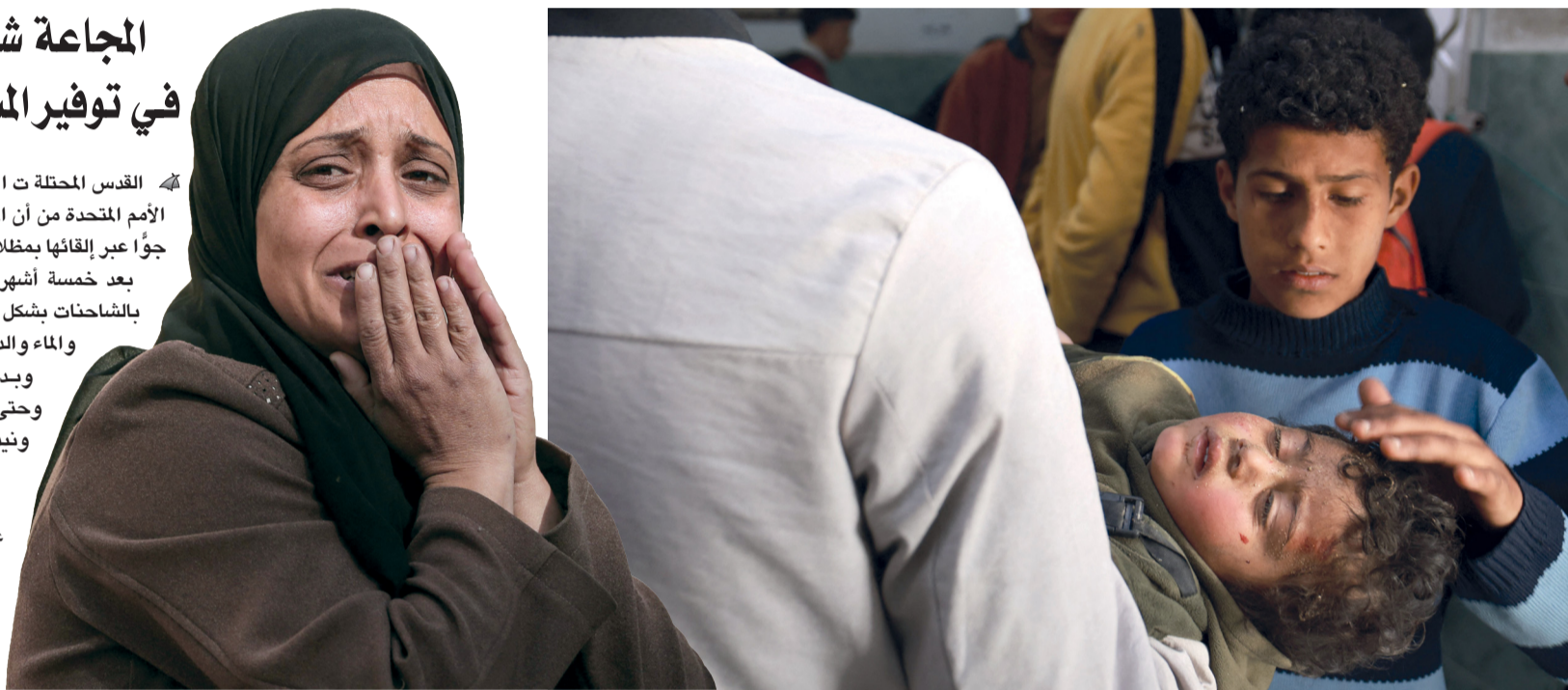
■ امرأة فلسطينية تبكي أحد أقاربها الذي استشهد خلال القصف الإسرائيلي على دير البلح وسط قطاع غزة، وذلك في مشرحة شهداء الأقصى أمس.

وأوضح «حصلت على لعب وأكياس فيها معكرونة ومياه من مساعدات المظلات، شاهدنا المظلات في السماء وتابعتها وذهبت أنا وثلاثة من أولاد عمي في النهاية أخذت أكياس معكرونة وجبن لكن أولاد عمي لم يتمكنوا من الحصول على شيء».