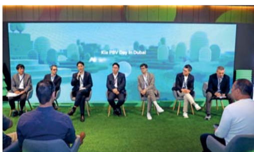
المسؤولون في كيا أثناء الكشف عن منصة حلول التنقل المستدام

تشكيلة السيارات المبنية حسب الطلب المخصصة مع تطور السيارات المبنية حسب الطلب إلى منصات تنقل الذكاء الاصطناعي يمكنها أن تتفاعل مع المستخدمين باستخدام البيانات، وبالتالي ضمان تحديث المركبات دائما وأخيرا ستشرف المرحلة الثالثة على تطور السيارات المبنية حسب الطلب من كيا لتصبح مركبات تنقل قابلة للتكيف للغاية ومخصصة حسب الطلب، تدمج النظام البيئي للتنقل في المستقبل، ما سيؤدي إلى رعاية وازدهار بيئة القيادة والتنقل الجوي المتقدم وما هو أبعد من ذلك.