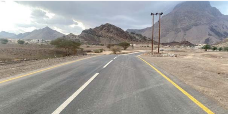
تعزيز منظومة شبكة الطرق ومواكبة متطلبات النمو السكاني

مساراته. جدير بالذكر أن المنطقة التي نفذ فيها هذه الطريق تشهد حاليًا حركة عمرانية نشطة؛ حيث تم توزيع عدد من المخططات الإسكانية والتجارية وبها عدد من المدارس الحكومية والخاصة التي تخدم معظم قرى وبلدات الولاية.