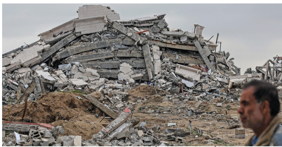
رجل فلسطيني يسير بالقرب من أنقاض مبنى في مخيم المغازي للاجئين الفلسطينيين بغزة أمس.

أعلنت وزارة الصحة في قطاع غزة ارتفاع حصيلة العدوان الإسرائيلي إلى (٢٩٩٥٤) شهيداً و (٧٠٣٢٥) مصاباً منذ السابع من أكتوبر الماضي. وأشارت الصحة إلى أنّ الاحتلال الإسرائيلي ارتكب (٨) مجازر ضد العائلات في قطاع غزة راح ضحيتها (٧٦) شهيداً و (١١٠) مصابين خلال (٢٤) ساعة. ولفتت أنه لا يزال عدد من الضحايا تحت الركام وفي الطرقات يمنع الاحتلال وصول طواقم الإسعاف والدفاع المدني الوصول إليهم. وواصلت الطائرات الإسرائيلية قصفها لمناطق مختلف قطاع غزة في اليوم (١٤٥) من الحرب مخلفة العشرات من الشهداء ومئات الجرحى. تفاصيل «صه»