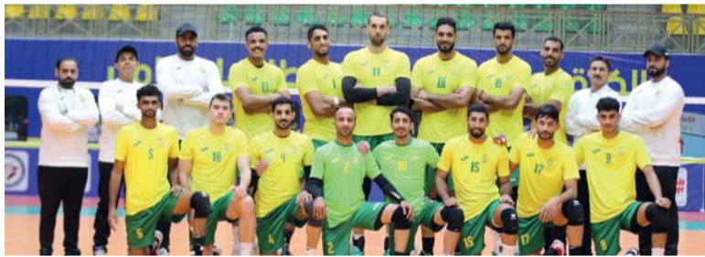
فريق السيب لكرة الطائرة

كتب بدر الزدجالي: أضع فريق طائرة السيب المركز الثالث بين يديه في ختام منافسات البطولة العربية لكرة الطائرة التي اختتمت منافساتها يوم أمس بالعاصمة الأردنية عمان، وذلك بعد أن خسر مباراة تحديد المركزين الثالث والرابع أمام فريق الشرطة القطري بنتيجة ٣/٠ صفر. وجاءت نتائج الأشواط الثلاثة ٢٣/٢٥ و ٢٥/٢٠ و ٢٥/١٩. وكان السيب قد خسر مباراته قبل الأخيرة أمام فريق قطر القطري بحلم الصعود إلى المباراة النهائية والتي أضع فيها لاعبو السيب ذلك الحلم رغم الفرص المواتية التي حصل عليها السيب في أشواط المباراة، في وقت لم يظهر قطر القطري بالصورة التي ظهر عليها في منافسات دور المجموعات. وانتهى اللقاء بنتيجة ١/٣ تقدم الفريق القطري في الشوط الأول بنتيجة ٢٢/٢٥ وعاد السيب وحصل على نتيجة الشوط الثاني ١٨/٢٥، وأضع بعدها