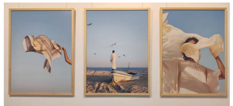
■ المعرض يضم ٢٠ صورة ضوئية نوعية عن ولاية الدقم

أطلقت دار الأوبرا السلطانية مسقط مبادرات تعليمية هادفة جديدة، تضمنت عدداً من الأنشطة طوال شهر فبراير، وذلك بهدف توسيع نطاق الأداء الموسيقي والتجارب الثقافية بما يتجاوز البرنامج الرئيسي لصالح المجتمع، وأبرزها مشروع (الأبواب المفتوحة) الذي يعد من بين المبادرات الرئيسية هذا الشهر، ويهدف إلى إيصال الأوبرا والموسيقى إلى جمهور أوسع في المجتمع من خلال عروض من البرنامج التعليمي بالتعاون مع مستشفى جامعة السلطان قابوس، ومركز الأطفال، ومركز التوحدي في مسقط. لقد عرفت دار الأوبرا السلطانية مسقط ببرنامجهما الاستثنائي للعروض ذات المستوى العالمي بما في ذلك الموسيقى الكلاسيكية والموسيقى العربية والأوبرا والباليه. ومنذ يناير ٢٠٢٤، تم حجز تذاكر جميع العروض التي أقيمت في دار الأوبرا السلطانية مسقط، مما يدل على