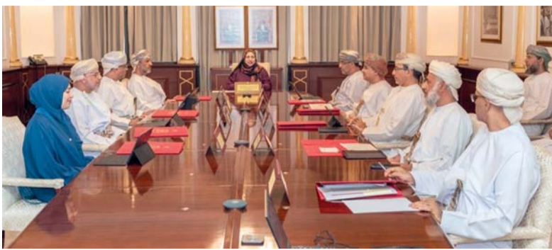
اجتماع مجلس جامعة السلطان قابوس أثناء اجتماعه

مسقط. العُمانية: تحتفل سلطنة عُمان - ممثلة بهيئة الدفاع المدني والإسعاف - في الأول من مارس من كل عام باليوم العالمي للدفاع المدني، وذلك تنفيذًا لقرارات المنظمة الدولية للحماية المدنية من أجل إحياء هذه المناسبة دوليًا وإقليميًا ومحليًا وتقديرًا منها للجهد الذي تبذره أجهزة الدفاع المدني بمختلف دول العالم. ويأتي احتفال هذا العام بشعار (دور الدفاع المدني في التنمية المستدامة) وذلك لأهمية دور أجهزة الدفاع المدني في حماية الأرواح والممتلكات وتحقيق السلامة العامة والحُد من المخاطر والتقليل من أثارها، والعمل على تطبيق التدابير والإجراءات ذات الصلة بأعمال الدفاع المدني والإسعاف. ويعد الاحتفال باليوم العالمي للدفاع المدني فرصة سانحة لنشر وتعزيز الوعي الوقائي لدى كافة شرائح المجتمع للحد من المخاطر المرتبطة بأمن وسلامة الأرواح والممتلكات، عبر البرامج التفريرية والإذاعية والمقالات الصحفية، وعقد الندوات والمحاضرات، بالإضافة إلى توزيع المطبوعات والملصقات التوعوية في الأماكن العامة والطرق. وقد أعدت هيئة الدفاع المدني والإسعاف هذا العام سلسلة من البرامج التوعوية التي تستهدف جميع شرائح المجتمع، منها فعاليات ومناشط والقيام بزيارات ميدانية إلى مراكز تأهيل المعوقين والمستشفيات والمطارات والموانئ ومحطات تقديم الخدمات في بعض المؤسسات الحكومية.