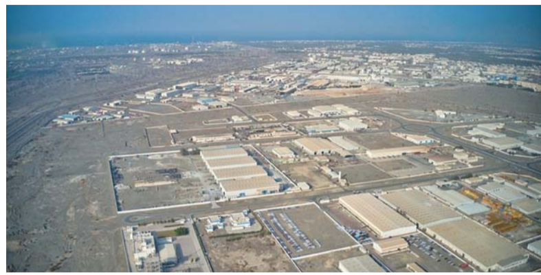
مدينة صحار الصناعية تواصل جهودها في تطوير الصناعة وتشجيع القطاع الخاص

في منطقة صحار الصناعية لإنشاء مجمع لإنتاج منتجات بلاستيكية ذات قيمة مضافة عالية، حيث ستوفر «مدائن» أراضي للمشروعات بأسعار تشجيعية ورسوم خدمات مخفضة. وأوضح أنه من المتوقع أن يوفر المجمع العديد من الفرص الاستثمارية، خاصة في مجال الصناعات التحويلية للبلاستيك، ومواد البناء، والصناعات الكيماوية، وتقنية المعلومات، والمخازن واللوجستيات، والملابس والأقمشة، والأدوية، وتصنيع المعادن، والأغذية، إضافة إلى الصناعات البلاستيكية.