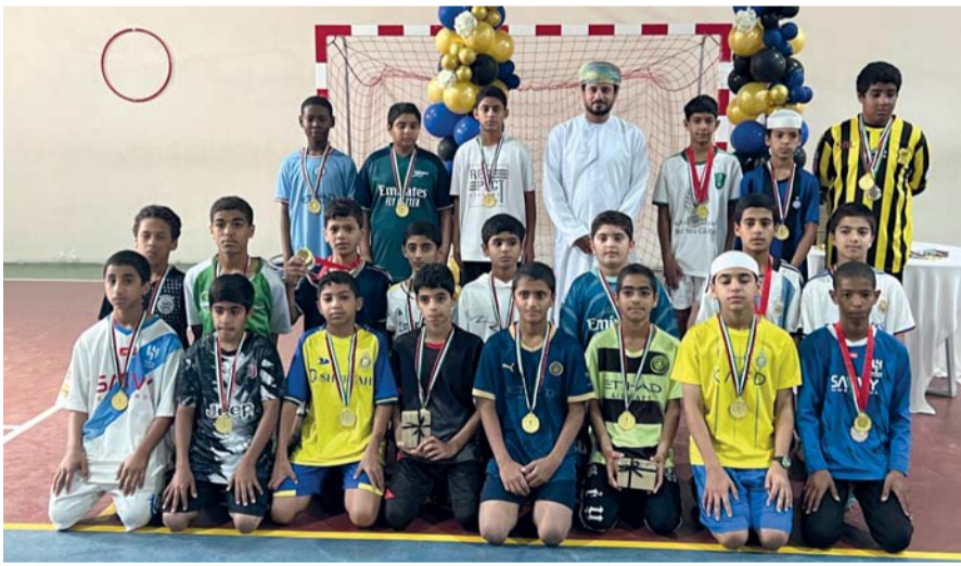
لقطة جماعية للمشاركين والمتوجين

نظمت المديرية العامة للتربية والتعليم بمحافظة البريمي صباح امس ملتقى للرياضة المدرسية بمرسة أجيال عمان للتعليم الأساسي بمشاركة مجموعة من المشرفين والمشرفات التربويات ومعلمي ومعلمات الرياضة المدرسية بالمحافظة. وأقيم الملتقى ضمن الزيارة التخصصية التي قام بها مشرفو الرياضة المدرسية بتعليمية البريمي وشمال الشرقية، والتي شملت برامجها تنفيذ عدد من الفعاليات. هدف الملتقى إلى إكساب المشاركات مهارات إعداد وتنظيم المنقبات والمهرجانات الرياضية التعليمية بالمدارس في الوحدات الدراسية المختلفة، بالإضافة لتنمية مهارات تنفيذ المناهج المطورة للرياضة المدرسية بشكل فاعل لتحقيق الأهداف المخطط لها. وتضمن الملتقى تنفيذ حلقة نقاشية ومواقف تدريبية، بالإضافة إلى تنفيذ مجموعة من نماذج التهيئة المتنوعة في الأدوات والتشكيلات الرياضية والعديد من الأنشطة التعليمية والتدريبية وتمارين الإحساس بهارات الألعاب الجماعية.