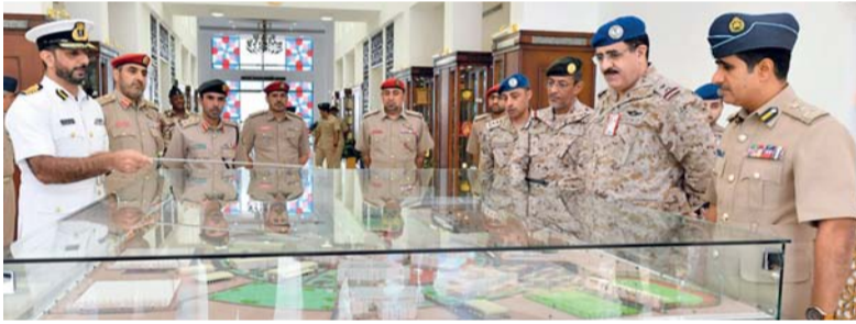
التعريف بالكلية وما زُوِّدت به من وسائل تعليمية مختلفة

مسقط. العُمانية: قام اللواء الركن طيار طلال سليمان الغامدي نائب قائد القوات الجوية بالملكة العربية السعودية والوفد المرافق له، يرافقه العميد الركن طيار زهران بن ناصر أموسعدي قائد سلاح الجو السلطاني العُماني بالإنابة بزيارة إلى الكلية العسكرية التقنية أمس. جرى خلال الزيارة الاستماع إلى إيجاز عن الكلية العسكرية التقنية وما زُوِّدت به من وسائل تعليمية مختلفة، كما اطلعوا على أقسامها وما تحتويه من مرافق دراسية وخدمية متنوعة. وكان في الاستقبال لدى وصول الضيف والوفد المرافق له مقر الكلية العميد الركن جوي (مهندس) محمد بن عزيز السيابي عميد الكلية العسكرية التقنية. كما زار العميد (مهندس) فريدريك دوديه رئيس الوفد الفرنسي بلجنة المعدادات الدفاعية العُمانية الفرنسية والوفد المرافق له، أمس الكلية العسكرية التقنية. وكان في استقباله لدى وصوله مقر الكلية، العميد الركن جوي (مهندس) محمد بن عزيز السيابي عميد الكلية العسكرية التقنية. وقد استمع رئيس الوفد الفرنسي بلجنة المعدادات الدفاعية العُمانية الفرنسية خلال الزيارة إلى إيجاز عن الكلية العسكرية التقنية وما زُوِّدت به من وسائل تعليمية مختلفة، كما اطلع على أقسام الكلية وما تحتويه من مرافق دراسية وخدمية متنوعة.