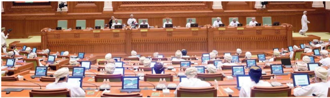
الجلسة تناولت تقييم مسيرة التنوع الاقتصادي حتى منتصف خطة التنمية الخمسية الحالية، وتقييم الأداء الاقتصادي الكلي

ومن المتوقع، أن يبلغ حجم الصرف الفعلي، على الموازنة الإنمائية في العام