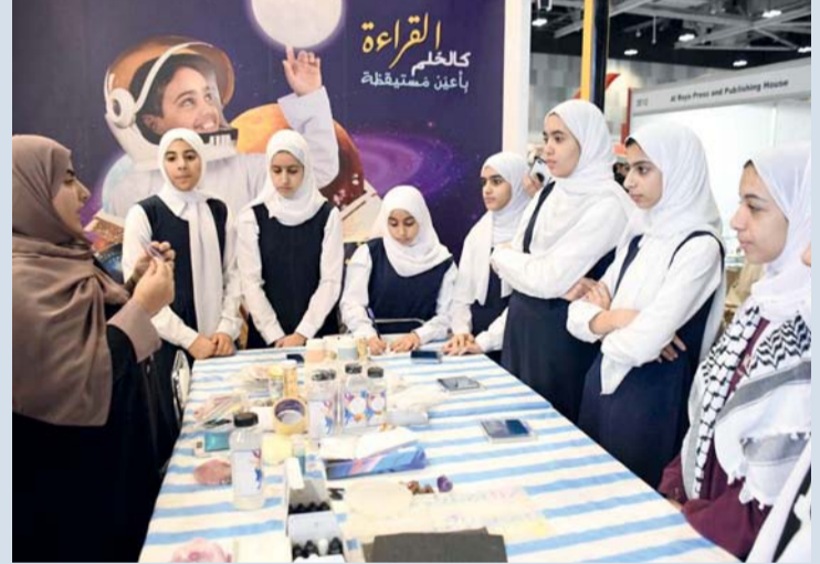
■ المشاركة تضمنت تقديم عدد من الفعاليات والمناشط المتنوعة

ممسقط. «الوطن»: تشارك وزارة التربية والتعليم من خلال عدد من مديرياتها في الدورة الثامنة والعشرين لمعرض مسقط الدولي للكتاب، حيث تضمنت هذه المشاركة عدداً من الفعاليات، والمناشط التي قدمت في الركن الخاص بالوزارة، وفي زوايا مختلفة من زوايا المعرض. وجاءت مشاركة الوزارة بعدد من المناشط، حيث قدمت المديرية العامة للتربية الخاصة والتعليم المستمر عدداً من الألعاب، والأنشطة التفاعلية، ومجموعة من الحلقات التدريبية على الحرف اليدوية، وإعادة التدوير، وعرضا للمواهب الفنية، والأدبية، والعلمية لطلبة مدارس التربية الخاصة، وعملت اللجنة الوطنية للتربية والثقافة والعلوم طوال أيام المعرض على تجسيد حي للشخصيات العمانية المدرجة في اليونسكو، وتمثلت مشاركة دائرة الأنشطة التربوية بعدد من الحلقات التدريبية، ومسابقات ثقافية للطلبة الزائرين للمعرض، وعرض عدد من المواهب الطلابية في الإلقاء، والإنشاء، والعزف، ومحاضرة في الثقافة المالية (مشروع خزنة)، وقدمت دائرة المواطنة عدداً من المسابقات كمسابقة لوطني أنتني، ومسابقة اقرأ عن