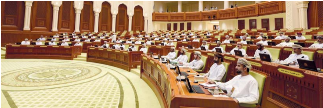
أعضاء مجلس الشورى تعرفوا على دور وزارة الاقتصاد في مواجهة المتغيرات الاقتصادية الإقليمية والدولية

الفترة المتبقية من الخطة الخمسية العاشرة. وقال معاليه إن الإجراءات الحكومية الاستباقية أسهمت في حماية الاقتصاد العماني من التضخم، والمحافظة عليه في حدود آمنة، بالرغم من الارتفاع الكبير الذي شهدته معدلات التضخم العالمية التي بلغت في المتوسط حوالي ٦ بالمائة في العام ٢٠٢٣، بينما لم يتجاوز معدل التضخم في سلطنة عمان ١ بالمائة خلال الفترة نفسها، وقد جاء ذلك نتيجة للسياسات المتخذة للحد من ارتفاع الأسعار، كتثبيت سعر الوقود، ليكون وفقاً لأسعار أكتوبر من العام ٢٠٢١م كحد أعلى، وتوسيع عدد السلع، المعفاة من ضريبة القيمة المضافة.