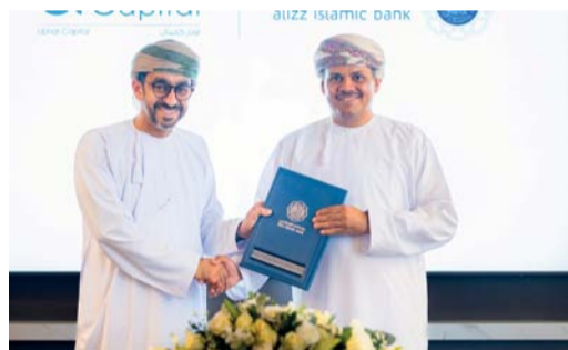
الجانبان عقب توقيع الاتفاقية

وتعد شركة أوبار كابيتال شركة استثمارية متكاملة الخدمات مرخصة من قبل الهيئة العامة لسوق المال حيث انها تقدم خدمات إدارة الثروات وإدارة الأصول والوساطة المالية وإضافة الشركات والاستشارات إضافة الى الحفظ الآمن والأبحاث وتعد أحد أكبر مقدمي الخدمات الاستثمارية.