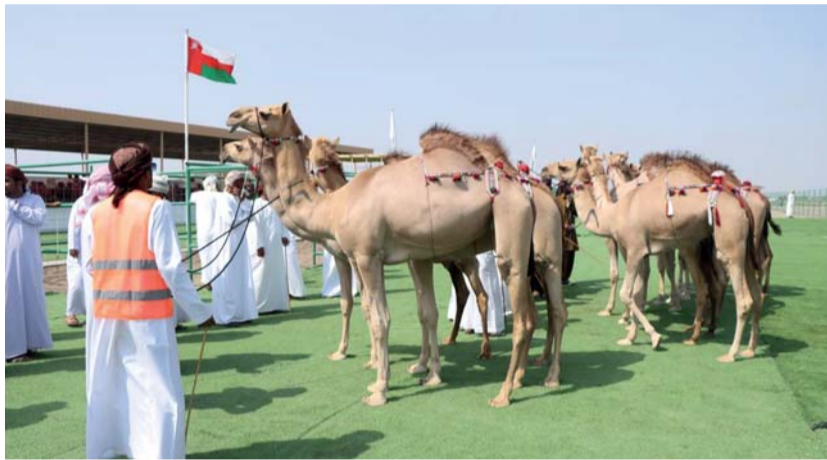
مشاركة كبيرة شهدها المهرجان

يختتم صباح اليوم بميدان طوي الشاوي لسباقات الهجن بولاية المصنعة منافسات مهرجان مزاينة الإبل على مستوى سلطنة عمان والذي ينظمه الاتحاد العماني لسباقات الهجن، ويرعي حفل الختام سعادة الشيخ أحمد بن علي بن سعود الحبسي والي المصنعة، وبحضور عدد من أصحاب السعادة الولاة وأعضاء مجلس الشورى وأعضاء المجلس البلدي والشيوخ والإعيان ومحبي سباقات الإبل، يشتمل حفل الختام إقامة شوطين لسن الفطاييم وسن الحول للجانحة السلطانية ومن يرغب من المواطنين، كما يشتمل حفل الختام تقديم عدد من الفقرات، وفي الختام سيتم تكريم الفائزين في جميع الأشتواط. فيما أقيمت صباح أمس خمسة أشواط شوط لسن