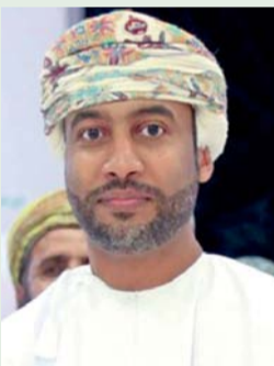
لؤي آل سعيد

يرعى سمو السيد لؤي بن غالب آل سعيد ختام موسم سباقات القدرة والتحمل والذي ينظمه الاتحاد العماني للفروسية والسباق، بقرية القدرة والتحمل بسيح المحامد بولاية