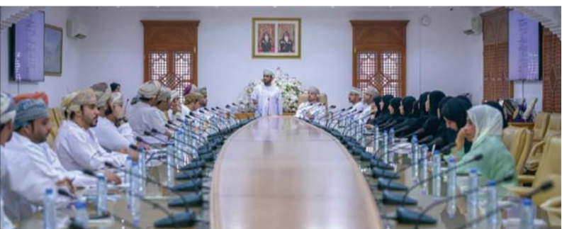
التعرف على استراتيجية إدارة الوثائق

ومكاتب اصحاب السعادة الولاة ودوائر البلدية بالمحافظة.