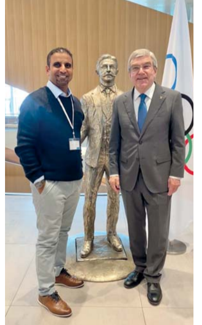
هشام العدواني وتوماس باخ رئيس اللجنة الأولمبية الدولية

تستضيف سلطنة عمان غدا الجمعة اجتماعات الاتحاد الدولي لالتقاط الأوتاد والذي يتخذ من العاصمة مسقط مقرا له برئاسة محمد عيسى الفيروز، يبدأ الاجتماع الأول باجتماع مشترك بين أعضاء مجلس إدارة الاتحاد الدولي لالتقاط الأوتاد ورؤساء اللجان بفندق هرمز جراند، ويعد هذا الاجتماع تحضيريا قبل الاجتماع الثاني الذي سيعقد بعد غد السبت، وسيكون لمجلس الإدارة بفندق هرمز جراند وسيشهد يوم الأحد القادم الاجتماع الثالث وخصص لأعضاء اللجنة العمومية للاتحاد الدولي لالتقاط الأوتاد وذلك بقاعة المرجان بنادي الطيران المدني، وسيتم خلال هذه الاجتماعات مناقشة العديد من المواضيع التي تخدم مستقبل رياضة التقاط الأوتاد بمختلف دول العالم.