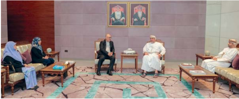
■ اللقاء تناول عدداً من الموضوعات التي تهم البلدين

باحثون: الذكاء الاصطناعي أحد الحلول لمشكلة التعاقدات مع المؤثرين الحقيقيين