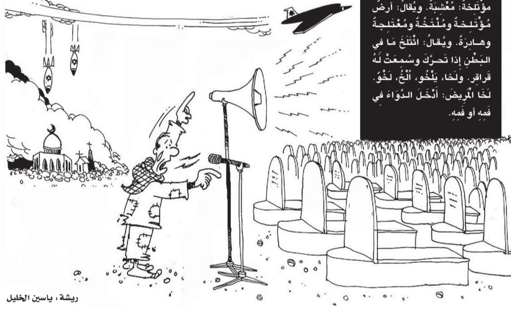
ريشة، ياسين الخليل