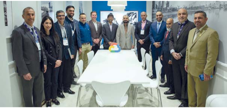
عمانتل تقدم خدمات تقنية تلبى متطلبات عملائها