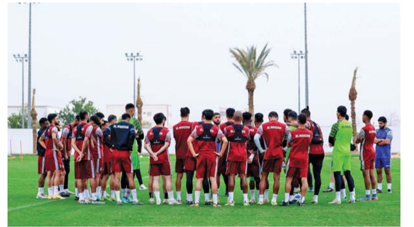
■ من تدريبات نادي النهضة

اليوم.. تبدأ الشرارة الأولى لذهاب نصف نهائي كأس جلالة السلطان المعظم لكرة القدم.. حيث لقاء الكبار بين النهضة والنصر بمجمع البريمي في تمام الساعة الخامسة والنصف مساءً.. فيما تلعب المباراة الثانية بين بهلاء وظفار على ساحة مجمع نزوى مساء الغد في تمام الساعة الخامسة وخمس وعشرين دقيقة.. فيما تقام مباراتنا الإياب مساء الأحد 10 مارس بملعب ظفار وبهلاء على ساحة مجمع السعادة في الخامسة وخمس وأربعين دقيقة.. فيما يتبارى النصر والنهضة على ساحة ذات الملعب يوم الإثنين 11 مارس القادم إن شاء الله تعالى في الخامسة وخمس وأربعين دقيقة.