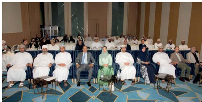
الملتقى يعرف بالجمعيات والاتحادات الزراعية ودورها في التنمية الزراعية

التي تصب في تعزيز رأس المال الاجتماعي في القطاع الزراعي من خلال الارتقاء بمنظومتنا وتطوير شبكتها على أعلى المستويات، الأمر الذي يزيد من قدرة المزارعين على العمل بدأ بيد بلوغ أهداف مشتركة وأهمها الأمن الغذائي وزيادة الدخل الفردي والجماعي. وأضاف أن رؤية الوزارة تتجلى في العمل على ضمان الأمن الغذائي والمائي المستدام؛ عن طريق إدارة وتنمية مستدامة للثروات الزراعية والسلمكية والمائية بكفاءة وضمان سلامة جودة الأغذية من خلال طرق مبتكرة ومنظومة تشريعية متطورة وشراكة مجتمعية ومساهمة فاعلة في القطاع الخاص لتعزيز الأمن الغذائي والمائي وتخليط العائد الاقتصادي.