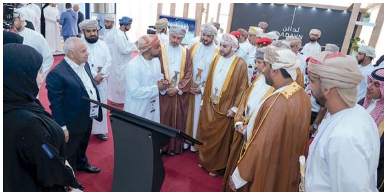
المعرض يعرف المشاركين بالفرص الاستثمارية المتاحة في محافظة شمال الباطنة

والاقتصاد الدائري والتعددية والامن الغذائي والسياحة وتقنية المعلومات وقطاع الرعاية الصحية، ومن المتوقع أن توفر نحو 9 آلاف فرصة وظيفية، كما شهد المنتدى توقيع عدد من الاتفاقيات ومذكرات التفاهم الاستثمارية في عدد من القطاعات الصناعية والتجارية بلغ عددها (14) اتفاقية، منها 6 اتفاقيات وقعتها «مدائن» في القطاع الصناعي مع عدد من المستثمرين بتكلفة إجمالية تجاوزت 17 مليوناً و 850 ألف ريال عماني، واتفاقية مع شركة سانسفير الكربون بـ (225) مليون دولار تتضمن إنشاء وحدة لتصنيع الأنود الجاهز في المنطقة الحرة بصحار بطاقة فعلية تبلغ (300,000) متر مكعب، إلى جانب 7 اتفاقيات وقعتها وزارة الإسكان والتخطيط العمراني لأراضي انتفاع بقيمة استثمارية تبلغ نحو مليون و 754 ألف ريال عماني، وتضمنت فعاليات المنتدى افتتاح المعرض المصاحب الذي ضم عدداً من المؤسسات الحكومية والخاصة المعنية بقطاع الاستثمار في سلطنة عمان.