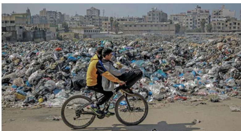
■ صبيان فلسطينيان يمران بمكبٍ ضخم للقمامة على طول طريق رئيسي بمدينة غزة.

استشهد وأصيب عشرات الفلسطينيين بينهم أطفال ونساء، في عدوان الاحتلال الإسرائيلي المتواصل على قطاع غزة، والذي شهد فجر أمس، غارات مكثفة وقصفاً مدفعياً عنيفاً؛ استهدف مناطق جنوب القطاع. وأفادت مصادر صحية بالقطاع، باستشهاد 2 وإصابة آخرين جراء استهداف منزل في محيط مستشفى غزة الأوروبي شرق خان يونس جنوبي قطاع غزة. ونسف جيش الاحتلال الإسرائيلي منازل غرب مدينة خان يونس التي شهدت اشتباكات ضارية في محيط مستشفى ناصر، بالتزامن مع قصف مدفعي استهدف حي الأمل غرباً. واستشهد 4 بينهم امرأة وطفل، وأصيب آخرون في قصف إسرائيلي استهدف منزلاً شمال رفح. وكان قد استشهد 15 على الأقل، وأصيب العشرات بجروح مختلفة، بينهم أطفال ونساء، في غارة إسرائيلية استهدفت منزلاً في حي الزيتون جنوب شرق مدينة غزة، الليلة قبل الماضية. وارتكب جيش الاحتلال الإسرائيلي 7 مجازر ضد العائلات في قطاع غزة راح ضحيتها 86 شهيداً و 131 إصابة خلال 24 ساعة، لترتفع حصيلة الشهداء إلى 29692، ونحو 699899 إصابة، معظمهم من الأطفال والنساء، إضافة إلى آلاف المفقودين تحت الأنقاض، بحسب بيانات صحية.