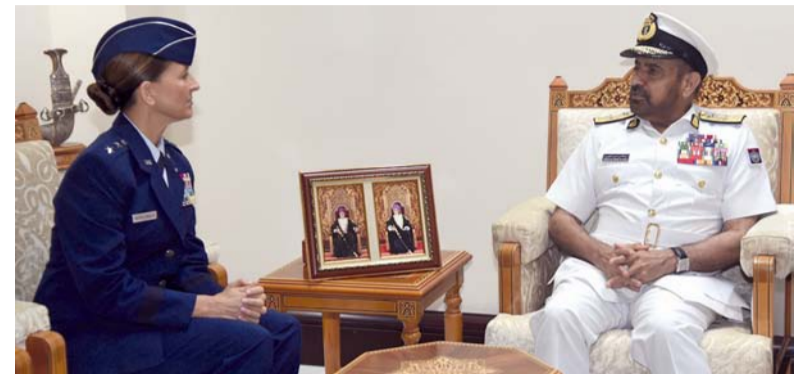
عبدالله الرئيسي أثناء استقباله كيري موهلنيك

مسقط . العُمانية: استقبل الفريق الركن بحري عبدالله بن خميس الرئيسي رئيس أركان قوات السلطان المسلحة بمكتبه بمعسكر المرتفعة أمس اللواء كيري موهلنيك القادة العامة للحرس الوطني بولاية أريزونا بالولايات المتحدة الأميركية والوفد المرافق لها. تم خلال المقابلة تبادل وجهات النظر، وبحث عدد من الموضوعات العسكرية ذات الاهتمام المشترك. حضر المقابلة العميد الركن بحري عيسى بن سالم العويسي مساعد رئيس الأركان للإدارة واللوازم، وسعادة سفيرة الولايات المتحدة الأميركية المعينة لدى سلطنة عُمان.