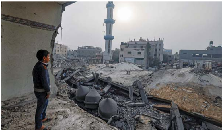
■ طفل يقف داخل مبنى متضرر، بينما يبدو مسجد الفاروق الذي دمّرهُ القصف الإسرائيلي في رفح جنوب قطاع غزة.