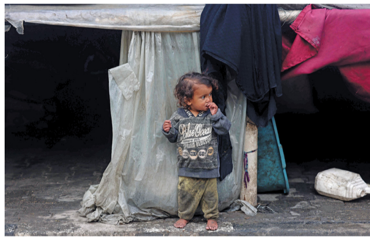
طفل فلسطيني نازح يقف خارج خيمة مؤقتة ملحقة بمدرسة تستضيف عائلات من أجزاء أخرى من قطاع غزة في مخيم رفح للاجئين.

استمر جيش الاحتلال الإسرائيلي بارتكاب مجازره بحق الشعب الفلسطيني في قطاع غزة التي خلفت عشرات الشهداء. في حين تخوض المقاومة الفلسطينية معارك ضارية معه شمال القطاع وجنوبه وسط غموض حول صفقة تبادل الأسرى والمحتجزين. وقال مصدر قيادي في حركة حماس إن أجواء التفاوض بقرب التوصل إلى اتفاق بشأن صفقة التبادل لا تعبر عن الحقيقة، مؤكداً أن قتل الشعب الفلسطيني جوفاً شمال قطاع غزة جريمة