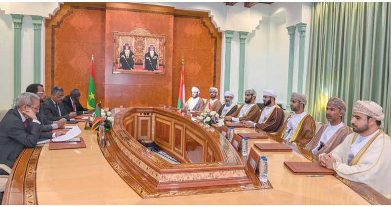
■ أثناء جلسة المباحثات الرسمية بين سلطنة عُمان وموريتانيا