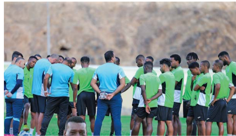
■ من تدريبات نادي النصر على ملعب أهلي سداب