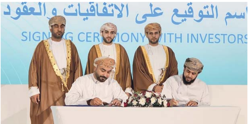
الاتفاقيات تساهم في استقطاب الاستثمارات ورؤوس الأموال المحلية والأجنبية

كما تحدث سعادته عن المشاريع التنموية الاستراتيجية القائمة في محافظة شمال الباطنة التي تعد رافداً للحركة الاقتصادية بها، فإن ميناء صحار والمنطقة الحرة التابعة له يعد أحد محركات الاقتصاد المحلي في المحافظة وسلطنة عمان ككل، حيث يربط الميناء سلطنة عمان بأكثر من 50 ميناء عالمياً بشكل مباشر وغير مباشر ويستقبل أكثر من 3000 سفينة سنوياً وقد تجاوز حجم الاستثمارات فيه 27 مليار دولار،