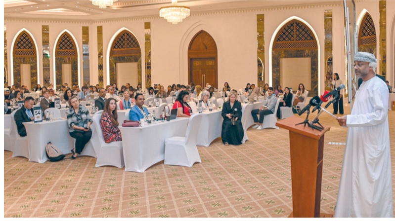
المؤتمر يتيح للشركات الالتقاء بنظيراتها المتخصصة في سياحة المغامرات والفاخرة والمؤتمرات

وقال سعادته: إن وزارة التراث والسياحة تعمل على كشف استراتيجيتها الوطنية للسياحة 2040 وتحقيق طموحات رؤية عمان 2040 تحت القيادة الحكيمة لحضرة صاحب الجلالة السلطان هيثم بن طارق المعظم. حفظه الله ورعاه. فإنها تركز بشدة على إيجاد بيئة يمكن أن تزدهر فيها السياحة وتنمو. وأضاف: إن الوزارة تحقق ذلك من خلال إدخال تشريعات صديقة للسياحة ومبادرات