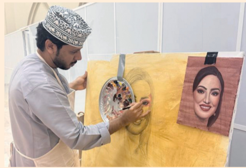
■ الملتقى شهد مشاركة واسعة