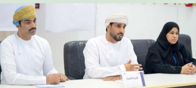
المحتدثون في المؤتمر الصحفي

تواصل منافسات البطولة الرياضية العشرين لطالبات جامعة التقنية بصحار، والتي تقام مبارياتها بالمجمع الرياضي بصحار وجامعة التقنية والعلوم التطبيقية بصحار. وقد أكد المنظمون للبطولة أن المستوى الفني والرياضي للطالبات المشاركات في البطولة مرتفع عن السنوات الماضية، حيث قدمن مستوى عاليًا من التكتيك والمهارة في الألعاب الجماعية ككرة القدم والطائرة، وقدمن مستويات فريدة متميزة في الألعاب الفردية والألعاب الإلكترونية.