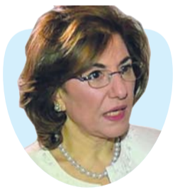
أ.د. بثينة شعبان كاتبة سورية

” هذه هي أكبر معركة تحرر تخوضها البشرية في القرن الحادي والعشرين، ولا شك أن نتاجها ستكون مهمة للجميع.“