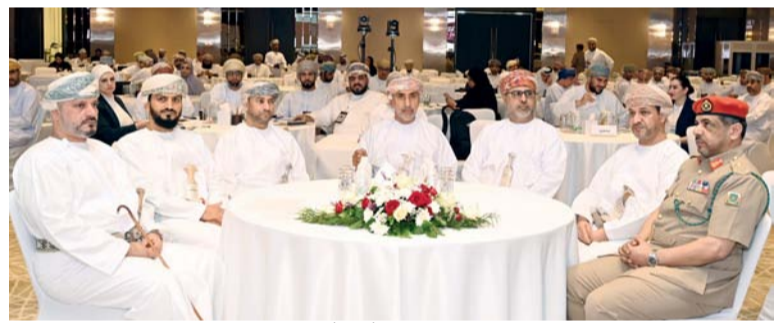
بناء القدرات البشرية يُعدّ عنصراً مهماً في تطوير وتعزيز الأعمال

الأعمال: ما يجب تعرفه اليوم). كما سيستمر برنامج اليوم الثاني للمؤتمر على عدد من جلسات العمل المنمطة في: تأثير تكنولوجيا المعلومات والذكاء الاصطناعي على رؤساء واختصاصيي الموارد البشرية والتدريب وقادة المستقبل والشباب المهووبين والمهتمين بتطوير مهاراتهم القيادية وإدارة الموارد البشرية. وستتناول أعمال مؤتمر عمان العاشر للاستثمار في الموارد البشرية اليوم في يومه الثاني ورقتي عمل الأولى بعنوان (أهمية قياس العائد على الاستثمار في مجالات العمل المختلفة) فيما تناقش الثانية (استشراف مستقبل