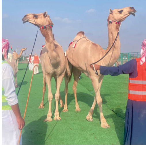
■ مشاركة واسعة يشهدها المهرجان