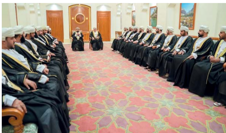
التأكيد على تبني أفضل الممارسات التي تعزز النزاهة والعدالة والاستقلالية