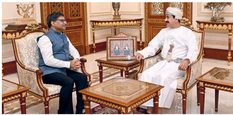
سلطان النعماني أثناء استقباله فيكرام مايسري

مسقط . العُمانية: استقبل معالي الفريق أول سلطان بن محمد النعماني وزير المكتب السلطاني في مكتبه أمس سعادة فيكرام مايسري نائب مستشار الأمن القومي بجمهورية الهند، والوفد المرافق له الذي يزور سلطنة عُمان حالياً في إطار الجولة التاسعة للحوار الاستراتيجي بين البلدين الصديقين. تم استعراض مجالات التعاون المشترك، والتأكيد على علاقات الصداقة التاريخية التي تجمع سلطنة عُمان وجمهورية الهند الصديقة. حضر المقابلة سعادة سفير جمهورية الهند المعتمد لدى سلطنة عُمان.