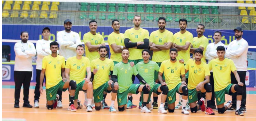
فريق طائرة نادي السيب

عبرت طائرة نادي السيب بنجاح أجواء البطولة العربية بالعاصمة الأردنية عمان بعد أن نجح الفريق في الوصول إلى المربع الذهبي للبطولة، ليكون ضمن الأربعة الكبار في البطولة، بعد أن تمكن بنجاح من تجاوز الفريق البحريني دار كليب في منافسات الدور ربع النهائي للبطولة يوم أمس بعد مستوى كبير قدمه لاعبو الفريق في ذلك اللقاء الذي انتهى بنتيجة ١/٣ برز خلاله الفريق بشكل مختلف عما كانت عليه في منافسات دور المجموعات والتي احتل فيها الفريق المركز الثالث في مجموعته. وجاءت نتائج الأضواط الثلاثة التي قدمها الفريق ١٨/٢٥ و ٢٢/٢٥ و ٢٥/٢٢.