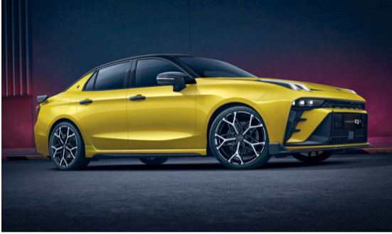
السيارة توفر تجربة قيادة متطورة