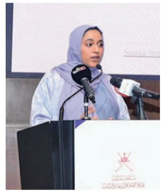
الحلقات ستستمر لمدة ١٠ أيام متواصلة

انطلقت صباح أمس حلقات العمل التطويرية للصناعات الثقافية والإبداعية والتي تنظمها وزارة الثقافة والرياضة والشباب بالتعاون مع البرنامج الوطني للاستثمار وتنمية الصادرات (نزهد)، وذلك بمركز عمان للمؤتمرات والمعارض برعاية معالي قيس بن محمد اليوسف وزير التجارة والصناعة وترويج الاستثمار. ويحضر عدد من أصحاب السعادة وبمشاركة عدد من الجهات الحكومية وجهات ذات العلاقة، وتشهد الحلقات حضوراً يقارب ١٠٠ مشاركاً ومشاركة سيعملون في الحلقات لمدة ١٠ أيام متواصلة. وقد ألقى سعادة السيد سعيد بن سلطان البوسعيدي وكيل وزارة الثقافة والرياضة والشباب للثقافة كلمة الوزارة أكد فيها أن هذه حلقات العمل تهدف إلى دمج وتعزيز القدرات الإبداعية، وتمكين الاستثمار في سلطنة عمان، وذلك تحقيقاً لرؤية عمان ٢٠٤٠ من خلال محور (مجتمع إنسانه مبدع) ومحور (اقتصاد بينته تنافسية)، والذين يدعمان دور المواهب والتنمية المتناصلة بالثقافة كأساس رئيسي لتحقيق اقتصاد تنافسي ومستدام، حيث حرصت الوزارة على جعل القطاع الثقافي من بين القطاعات الحيوية التي تساهم في التنوع الاقتصادي لسلطنة عمان خلال المرحلة القادمة، أنتت فكرة الشراكة مع البرنامج الوطني للاستثمار وتنمية الصادرات (نزهد)، التي من المؤمل بأن تخرج بالعديد من المشاريع والفرص والمكثات، من خلال طرح الأفكار الإبداعية وترجمتها لمشروعات استثمارية تحقق العديد من الأهداف الوطنية وسيشارك في هذه الحلقات العديد من المعنيين بالشأن الثقافي، مناقشة واقع الصناعات الإبداعية الثقافية ووضع السبل الكفيلة لجعلها من القطاعات المساهمة على الصعيد الاقتصادي بسلطنة عمان، حيث تم تقسيم حلقات العمل إلى ثلاثة مسارات، تمثل المسار