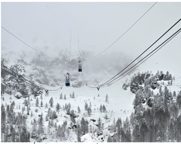
صورة تظهر تلفريك فال دي فاسا، حيث تم إلغاء فعاليات في كأس العالم للتزلج على جبال الألب بسبب الظروف الجوية.

مسيكو - أ.ف.ب: لقي ١٠ أشخاص على الأقل حتفهم في تصادم شاحنتين في ولاية سان لويس بوتوسي شمال وسط المكسيك، وفق ما أعلنت السلطات. وقال مكتب المدعي العام المحلي في بيان إن الحادث الذي وقع في الصباح الباكر في بلدة ريو فيردي أودي بحياة خمس نساء وأربعة قُصّر ورجل، مضيفاً أن عدداً غير محدد من الأشخاص أصيبوا. وذكر البيان أنه يجري التحقيق في سبب الحادث.