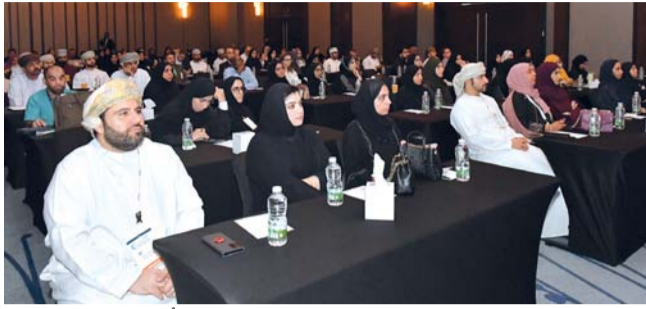
المؤتمر استعرض مستجدات الأمراض المعدية

أولى في الأمراض المعدية نائبة مدير دائرة الأمراض الباطنية، رئيسة التخصصات الدقيقة بالمستشفى السلطاني: إن المؤتمر الذي استمرت جلساته يومين ناقش عدداً من الموضوعات وأوراق العمل المهمة في مجال الأمراض المعدية، علم الأوبئة، أثر الصراعات وعدم الاستقرار في الأنظمة الصحية، كيفية مجابهة انتشار البكتيريا المقاومة للمضادات الحيوية، والأمراض المعدية الناشئة والمتجددة خاصة ما تواجهه سلطنة عمان مثل: حمى الضنك، الملاريا.. وغيرها من الأمراض المعدية الأخرى. وأضافت: إن المؤتمر هدف إلى حث الفئات الطبية على الدمج بين المعرفة