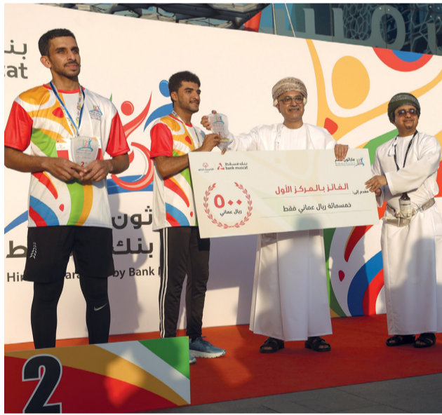
وليد الحشار يتوج الفائزين في الماراتون

احتفل بنك مسقط، المؤسسة المالية الرائدة في سلطنة عمان، بتنظيم «ماراتون همم من بنك مسقط» للأشخاص ذوي الإعاقة وذلك بالقر الرئيسي للبنك بمرتفات المطار بحضور الشيخ وليد بن خميس الحشار، الرئيس التنفيذي لبنك مسقط، وعدد من أعضاء الإدارة التنفيذية وممثلي الاولياد الخاص العماني بالإضافة إلى أكثر من 250 من المشاركين من ذوي الإعاقات الجسدية، والعقلية، والسمعية، بالإضافة إلى المصابين بطفح التوحد ومتلازمة داون، وبحضور عائلاتهم. ويأتي تنظيم هذه المبادرة المجتمعية ايماناً بالدور الكبير الذي تلعبه مثل هذه المبادرات في تعزيز عملية دمج هذه الفئة في المجتمع وإعطائهم الفرصة لإبراز قدراتهم ومواهبهم الرياضية حتى يتسنى لهم تحقيق طموحاتهم وأهدافهم.