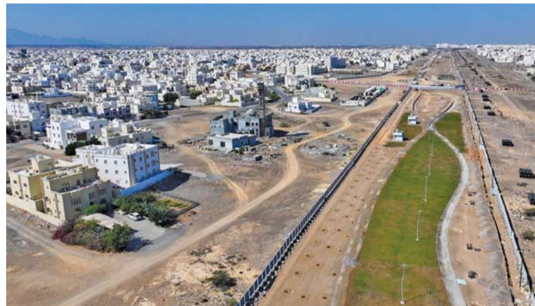
■ المتزه يتضمّن مرافق صُمّمت وفق أسس تراعي الجودة والاستدامة

السبب. المُعانة: تواصل الأعمال الإنشائية بمشروع متزه المعيلة الجنوبية في ولاية السبب بمحافظة مسقط الذي تنفذه إحدى الشركات الخاصة بسلطنة عُمان في إطار الشراكة والمسؤولية المجتمعية وتشرف عليه بلدية مسقط، ويعد من أكبر المتنزهات بمنطقة المعيلة الجنوبية على مساحة إجمالية تبلغ أكثر من ١٥٢ ألفاً و ٤٠٠ متر مربع وسط موقع يحتوي على العديد من المنشآت العمرانية والسكنية والمرافق التجارية.