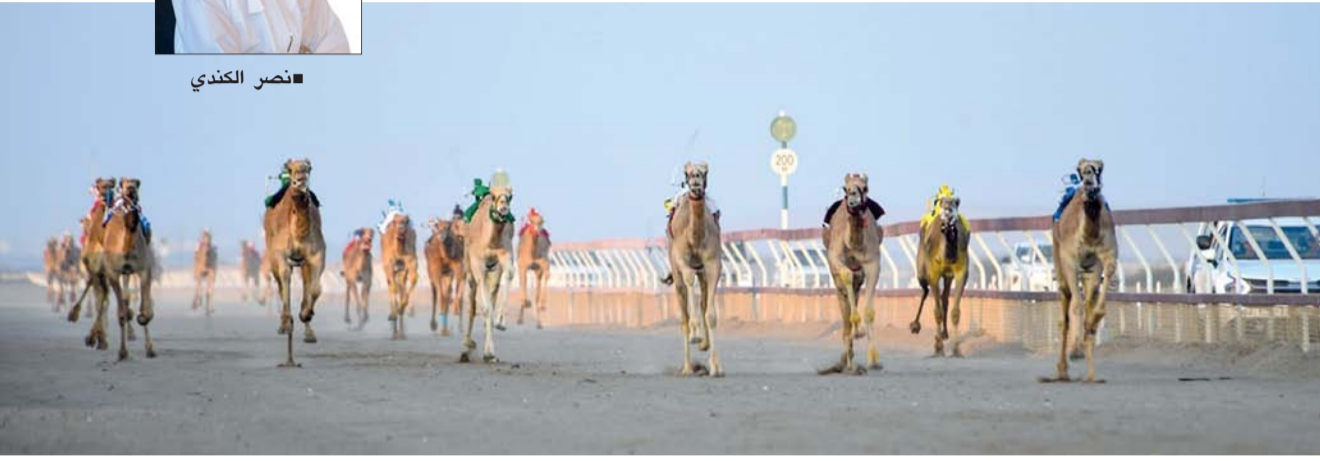
■ صورة أرشيفية من سباقات الهجن

الشوط الثالث فخصص لفئة «الجداع» لمسافة 6 كيلومترات، في حين سيخصص الشوط الرابع لفئة «الثنايا» لمسافة 8 كيلومترات، أما الشوط الأخير فسيخصص «للراكب البشري» لفئة «الحوال» لمسافة كيلومترين.