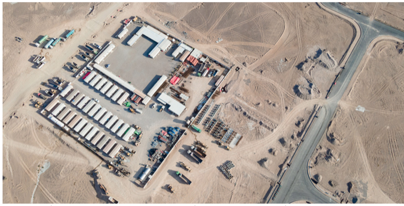
المساحة الإجمالية لمدينة عبري الصناعية تبلغ ما يقارب (١٠) ملايين متر مربع

التي تُشرف عليها الهيئة للخطط والحلول اللازمة للقطاعات الحالية والقطاعات المستقبلية ذات الأولوية. وأيضاً التنظيم والإشراف، لضمان إيجاد بيئة تنظيمية جاذبة للأعمال في المناطق التي تُشرف عليها الهيئة ومتابعة خطط وأداء المناطق، مضميناً أن الهيئة تعمل على التسهيل وتقديم رعاية ما بعد الخدمة من خلال تقديم نهج يركز على تسهيل الإجراءات للمستثمرين وتقديم العناية ما بعد الخدمة لضمان استمرار الأعمال وتطويرها، وكذلك التسويق وجذب الاستثمارات بالشراكة مع أصحاب المصلحة الرئيسيين لتطوير وتعزيز القيمة المضافة للقطاعات التي تجذب المستثمرين الرئيسيين المستهدفين إلى جانب التشغيل وتسريع الأعمال من خلال العمل مع الشركاء لبناء قوة اقتصادية جديدة في الدعم عبر