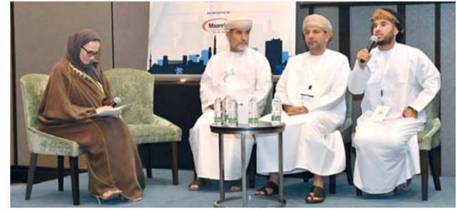
إحدى الجلسات النقاشية في المؤتمر

أولى في الأمراض المعدية نائبة مدير دائرة الأمراض الباطنية، رئيسة التخصصات الدقيقة بالمستشفى السلطاني: إن المؤتمر الذي استمرت جلساته يومين ناقش عدداً من الموضوعات وأوراق العمل المهمة في مجال الأمراض المعدية، علم الأوبئة، أثر الصراعات وعدم الاستقرار في الأنظمة الصحية، كيفية مجابهة انتشار البكتيريا المقاومة للمضادات الحيوية، والأمراض المعدية الناشئة والمتجددة خاصة ما تواجهه سلطنة عمان مثل: حمى الضنك، الملاريا.. وغيرها من الأمراض المعدية الأخرى. وأضافت: إن المؤتمر هدف إلى حث الفئات الطبية على الدمج بين المعرفة