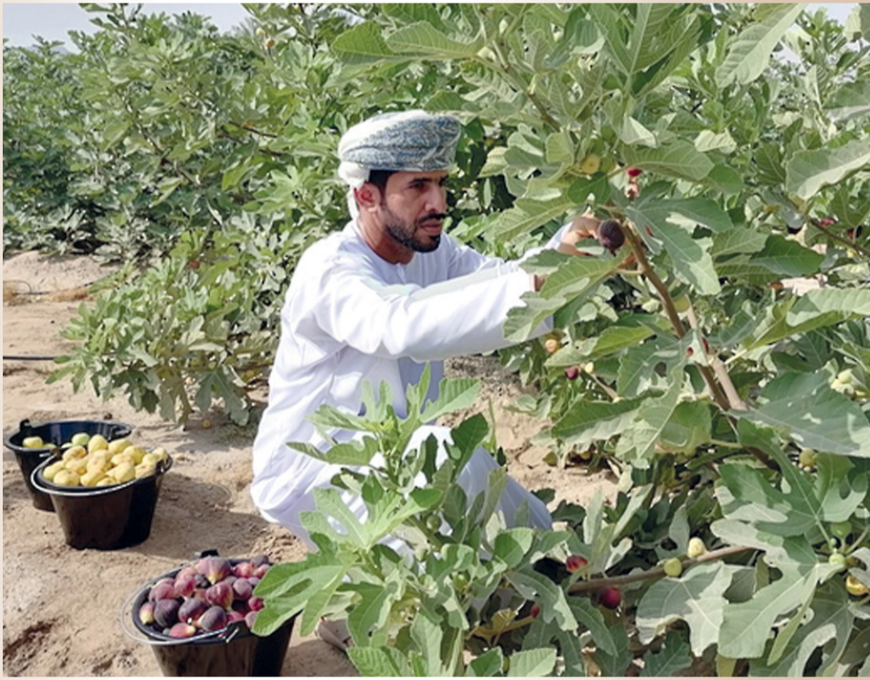
زراعة ٥٠٠ شتلة من أشجار التين تتضمّن ٢٥ صنفاً

لحق مشروع زراعة فاكهة التين في ولاية ينقل بمحافظة الظاهرة نجاحاً ملحوظاً، حيث يأتي هذا المشروع ضمن التوجه الزراعي للاستثمار في مجال المحاصيل الزراعية بكميات تجارية. وتقوم فكرة المشروع على إنتاج محصول التين لقلّة المعروف من فاكهة التين في السوق المحلي، وارتفاع الطلب عليه من قبل المستهلكين. وبعد دراسة المشروع من حيث تكاليف الشتلات والري والتسميد وتوفير المبيدات والإدارة وتسويق المنتجات تم استغلال قطعة أرض زراعية لزراعة ٥٠٠ شتلة من أشجار التين موزعة على حوالي ٢٥ صنفاً من أشجار التين مثل: الأصفر والأخضر والأسود والبني، وتتنوع مصادرها من دول مختلفة مثل التين السوري والأردني والإسباني والتركي، حيث أنبتت نجاحها في البيئة العُمانية مع إجراء التجارب على صنف التين الغربي والتين الغاني ومدى ملاءمته لزراعته في الفترة القادمة.