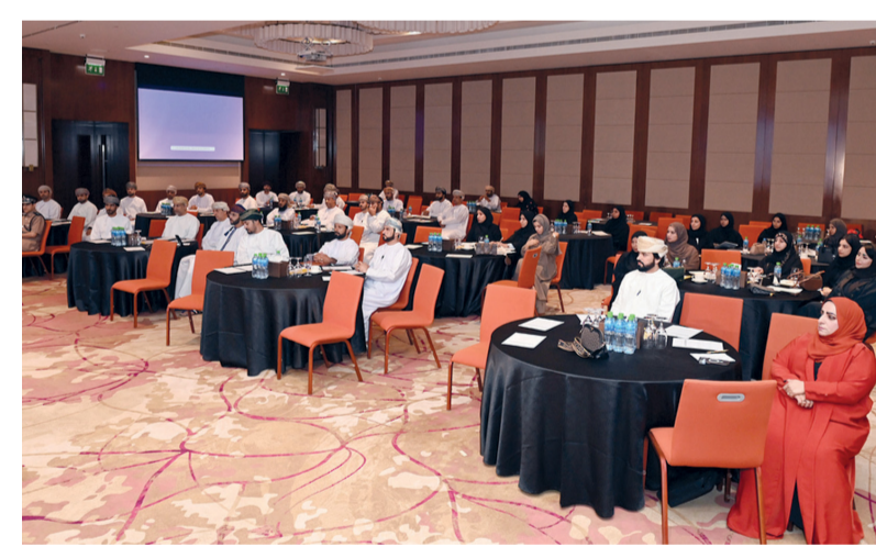
الاستطلاع يرصد آراء المواطنين وتقييمهم للخدمات الحكومية المقدمة

عشر نقاط ففي عام ٢٠٢٢ عبر ستة أشهر، كما تطرق اللقاء أيضاً استعراض الاستبانة وما تتضمنه من أسئلة والمنهجية المتبعة في تحليل النتائج.