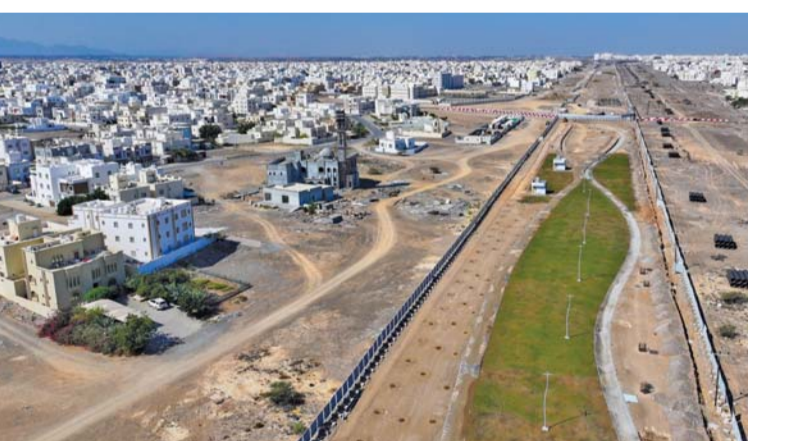
المنتزه يتضمّن مرافق صُمّمت وفق أسس تُراعي الجودة والاستدامة

احتفلت المؤسسة العامة للمناطق الصناعية «مدائن» بافتتاح مشروع المرحلة الأولى من مدينة عبري الصناعية ضمن برنامج الأمانة العامة للاحتفالات الوطنية لافتتاح المشروعات الوطنية. ويسهم وجود مدينة صناعية في محافظة الظاهرة في إحداث نقلة نوعية للجوانب الاقتصادية والصناعات التحويلية