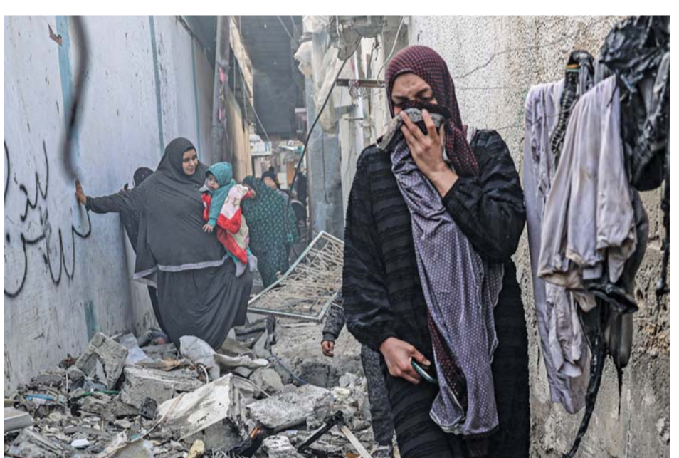
فلسطينيات يتخذن طريقهن عبر زقاق مغطى بالانقاض، في أعقاب القصف الإسرائيلي على رفح جنوب قطاع غزة.

القدس المحتلة . «الوطن» . وكالات: استشهد عشرات الفلسطينيين وأصيب آخرون في قصف متواصل لآلة الحرب الإسرائيلية على مناطق متفرقة من قطاع غزة، تركزت على أحياء مدينة غزة. وأفادت مصادر بأن مدفعية الاحتلال استهدفت