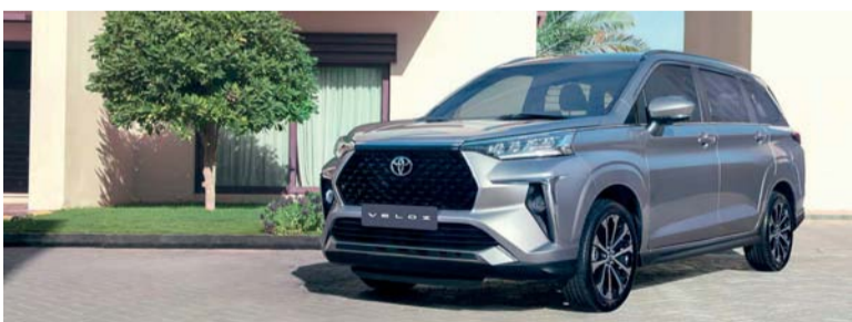
تويوتا فيلوز كروس الجديدة

وتأتي سيارة فيلوز كروس مع مجموعة من الميزات المتقدمة والعملية. وتشمل هذه المزايا شاشة ملونة تعرض المعلومات المتعددة مقاس ٧ بوصات في وسط لوحة العدادات، تكملها شاشة وسائط متعددة مقاس ٨ بوصات مزودة بنظامي أبل كار بلاي، أندرويد أوتو لرحلات متصلة بسلاسة. كما مجهزة بمجلات من الألمنيوم مقاس ١٧ بوصة مكونة من ١٠ شرائط مما يزيد من جاذبية السيارة وغيرها الكثير من المزايا.