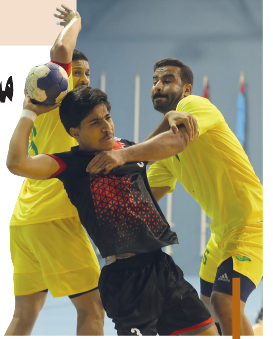
إحدى مباريات مسابقات كرة اليد

أعلنت لجنة المسابقات بالاتحاد العماني لكرة اليد عن جدول وقواعد وشروط دوري عام السلطنة للدرجة الأولى للموسم الرياضي ٢٠٢٣/٢٠٢٤ والذي سينطلق يوم الأربعاء القادم بمشاركة ٧ أندية هي: مسقط والسيب وأهلي سداب ونادي عمان وخصب وصلالة ونزوى، حيث سيلعب الدوري بنظام المرحلتين المرحلة الأولى تلعب الأندية السبعة دوري من دور واحد «جميع نقاط» أما المرحلة الثانية فستكون للأندية الحاصلة على المراكز من الأول إلى الرابع تلعب دوري من دورين «نهائياً وإياباً» جميع نقاط والنادي الحاصل على المركز السابع يهبط للدرجة الثانية. ويكون الترتيب النهائي في المسابقات على النحو الآتي: الفريق الذي يحصل على أكبر