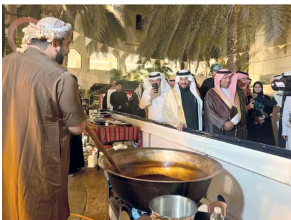
الحلوى العمانية تم إعدادها أمام الزوار والتعريف بمكوناتها

التي يعمل تحت مظلة وزارة الثقافة والرياضة والشباب في احتفالات الملكة العربية السعودية بيوم التأسيس، يأتي ذلك في إطار التبادل الثقافي بين سلطنة عمان والسعودية، ترأس الوفد صالح بن سعيد الحمداي رئيس مبادرة مجلس صحار الثقافي. وقد التقى وفد المجلس في الرياض صاحب السمو السيد فيصل بن تركي آل سعود سفير السلطنة بأعضاء الوفد في السفارة العمانية وتم خلال اللقاء الإطلاع على مشاركة المجلس، والفعاليات والمناشط الثقافية التي يقيمها، وبحث مجالات التعاون الممكنة. وشملت مشاركة مجلس صحار الثقافي تقديم مجموعة من