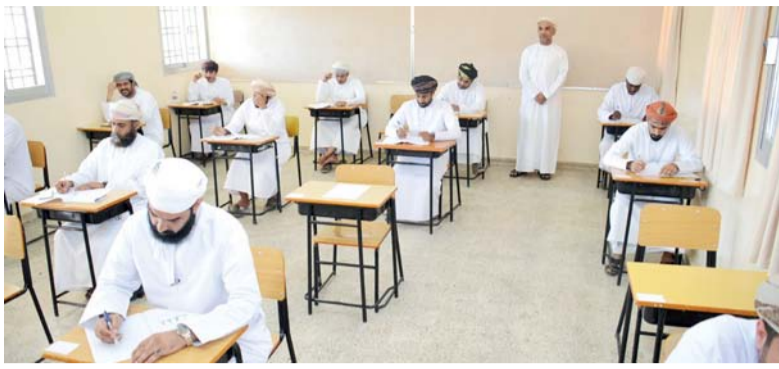
■ عدد المتقدمين للوظائف بلغ ٢٢٨، مترشحاً

المتزه مرافق متعددة صُمّمت وفق أسس تراعي معايير الجودة والاستدامة، وتخدم مختلف شرائح المجتمع بما فيها الأشخاص ذوو الإعاقة، ومنها مشفى رياضي، ومسار للدراجات الهوائية، وجسور علوية للمشاة لتفادي مخاطر عبور الشوارع العام، مع إنشاء مواقع لألعاب الأطفال، ومعدات خاصة للرياضة البدنية، واستراحات عامة، وعمل المسطحات الخضراء وأعمال التشجير، والإنارة لإضاءة الطابع الجمالي على المكان، كما يحتوي المشروع على ملاعب رياضية متعددة الاستخدام، وموقع رياضة التزلج على الألواح، ومقاه، ومواقع مهيأة للعربات المتحركة، وإنشاء مرافق خدمية عامة. وأضاف أن فكرة المشروع تتماشى مع إمكانية الاستفادة من بعض المواقع المفتوحة