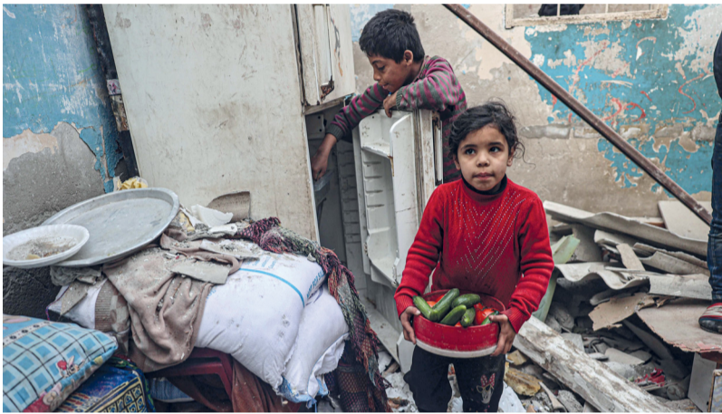
■ طفلة تحمل مواد غذائية، بينما يشير آخر لجوال طحين داخل منزل متضرر، في أعقاب القصف الإسرائيلي الليلي على رفح.