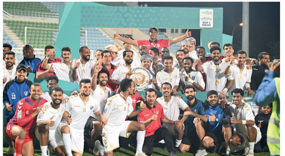
نتيجة صحم بلقب دوري تمكين عن جدارة واستحقاق