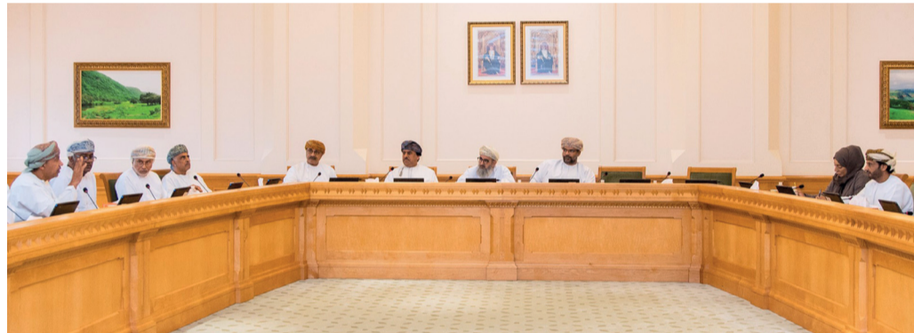
لجنة الإعلام والسياحة والثقافة أثناء استضافة عدد من الجهات الإعلامية

استضافت لجنة الإعلام والسياحة والثقافة بمجلس الشورى صباح أمس، عدداً من رؤساء التحرير والأكاديميين والإعلاميين؛ وذلك للاستئناس بأرائهم وملاحظاتهم حول فصول ومواد مشروع قانون الإعلام المحال من الحكومة والذي تعكف اللجنة على دراسته عبر سلسلة من الاجتماعات واللقاءات. تم خلال الاجتماع مناقشة كافة مواد مشروع القانون وبحث مدى موائمتها للمتغيرات المتسارعة في الإعلام الجديد، وتناول اللقاء كذلك الجوانب المتعلقة بإصدار تراخيص مزاولي الأنشطة الإعلامية، مؤكداً على أهمية أن يوفر مشروع قانون الإعلام الجديد بيئة مشجعة لمزاولي مختلف الأنشطة الإعلامية بما يعكس على أداء وجودة الإعلام في سلطنة عمان. وطرح الإعلاميين بعض النماذج لواقع ممارستهم في العمل الإعلامي في مختلف الوسائل الإعلامية المقروءة، والمرئية والمسموعة إلى جانب الإلكترونية منها، مشيرين إلى الضرورة الملحة لأن يتناول مشروع القانون تلك الجوانب.