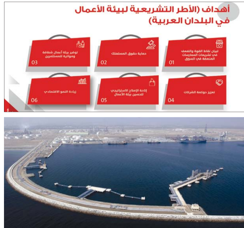
التقييم يُسهم في توفير بيئة أعمال شفافة للمستثمرين وتحسين بيئة الأعمال وزيادة النمو الاقتصادي

أما فيما يخص مؤشور حماية العمال فتظهر البيانات تحسناً في حماية العمال في سلطنة عمان، حيث ارتفع المؤشر من ٢,٣٣ في ٢٠٢٠ إلى ٣ في ٢٠٢٣، ما يظهر التفاعل مع تحسين ظروف العمل وحقوق العمال. حيث إن هذا المؤشر يقيم كيف تسنوع سياسات المنافسة تدابير الحماية للعاملين مع التركيز على شروط عدم المنافسة والسياسات المتعلقة بالعمل بهدف التأكد من الإنصاف في توزيع مكاسب المنافسة، حيث لا تزال المرتبة الإجمالية لكون العمال