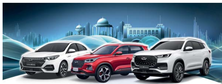
شيري تحافظ على مكانتها كأكثر مصدر لسيارات الركاب في الصين

مع التركيز على التوسع في السوق الإفريقية وأسواق المقود الأيمن في منطقة آسيا والمحيط الهادئ، وفيما يتعلق بإطلاق الطرازات، وستعمل الشركة على الترويج عالمياً لنماذج السيارات الكهربائية الهايبرد القابلة للشحن وطراز السيارات الكهربائية التي تعمل بالبطارية، AQ7، مما يوفر للمستخدمين العالميين مركبات فعالة وصديقة للبيئة وذكية.