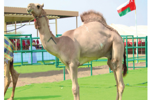
إحدى الهجن الفائزة في المسابقة