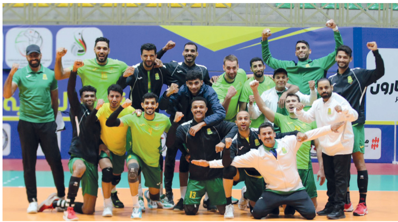
فريق طائرة السيب

وتقام اليوم مجموعة من اللقاءات الهامة في منافسات الدور ربع النهائي للبطولة بالإضافة الى لقاءات تحديد المراكز الاخرى للفرق التي خرجت من اجواء المنافسة، حيث يلتقي قطر القطري مع برقان الكويتي في الساعة العاشرة