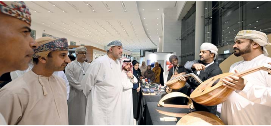
ردهة الفنون تشهد إقبالاً كبيراً من الزوار

وأوضح المشاركون في الجلسة أن للهوية أساساً تنطلق منها بما فيها الأسرة والمجتمع والمؤسسات التعليمية بكافة أشكالها وتنوعها، وهي مسؤولة عن النتائج المرتبة لها، باعتبار أنه يقع على عاتقها ترسيخ مفهوم الحصانة والانتفاء، وما يعزز ذلك من معرفة ووعي فكري. وتشارك الجمعية العمانية للملكية الفكرية في فعاليات معرض مسقط الدولي للكتاب بمركز عمان للمؤتمرات والمعارض وتهدف مشاركة الجمعية إلى تعزيز الوعي ونشر المعرفة المتعلقة بالملكية الفكرية، من خلال جناح يضم مجموعة مختلفة من الفعاليات والموجهة لزوار المعرض، من بينها الاستشارات المتخصصة والمحاضرات العلمية وعرض الإصدارات الجديدة.