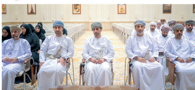
الحلقة تسهم في تحسين جودة الخدمات المقدمة

والتعريف الحكومي، والتعريف بالابتكار المؤسسي وأهميته، وشرح تفصيلي عن مشروع الدليل الاسترشادي والذي يوفر إطاراً شاملاً للجهات الحكومية من خلال تغطية العناصر الرئيسية للابتكار ونظام الابتكار المؤسسي للمؤسسات، وإدارة الابتكار والبرامج من خلال اتباع المبادئ المبينة في الدليل. وخرجت الحلقة بعدد من النتائج منها تعريف المشاركين بمشروع الدليل الاسترشادي للابتكار المؤسسي، وتوعية المشاركين بدورهم والمساهمات المتوقعة منهم في تنفيذ هذا المشروع، وتحفيز المعنيين للمشاركة الفعالة في المراحل المختلفة للمشروع، والإجابة عن أسئلة المعنيين والوقوف على التحديات التي قد يواجهونها في تطبيق المشروع وتزويدهم بالمعرفة اللازمة.