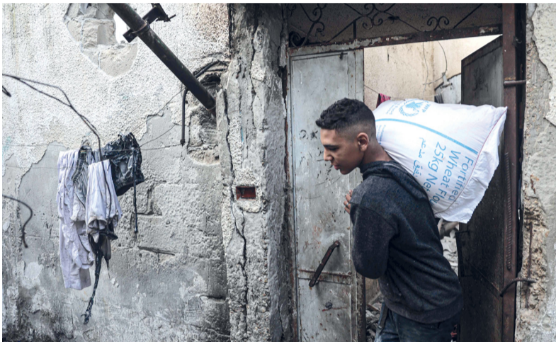
■ فلسطيني يخرج بكيس طحين من منزل طاله القصف الإسرائيلي على رفح.

كما أشار إلى أن مؤتمر الأمم المتحدة للتجارة والتنمية «أونكتاد» يقدر أن تأهيل اقتصاد غزة، بما في ذلك إعادة بناء نظام الرعاية الصحية الذي هو في وضع حرج، سيكلف عشرات مليارات الدولارات. وأكد يساريفيتش أن منظمة الصحة العالمية ستواصل تنفيذ خطتها التشغيلية لدعم المستشفيات في غزة، مع طلب دعم مالي بقيمة ١١٠ ملايين دولار.