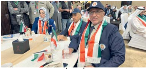
وفد المديرية العامة للكشافة والمرشدات المشارك في الملتقى

الكويت - العمانية: تشارك وزارة التربية والتعليم ممثلة في المديرية العامة للكشافة والمرشدات في أعمال ملتقى رواد ورائدات الوطن العربي في الحركة الكشفية والإرشادية، الذي تستضيفه دولة الكويت الشقيقة. تتضمن أعمال الملتقى مناقشة انضمام الرابطة العربية لمنظمة الصداقة الدولية ومقترحات تفعيل برامج الاحتفال بمرور ٤٠ عاماً على تأسيس الاتحاد العربي لرواد الكشافة والمرشدات ومواعيد الفعاليات (العمرة - المؤتمر الإعلامي - دورة القيادة). كما تناول أعمال الملتقى الذي شارك فيه ١٩ دولة، استضافة الرابطة العربية للبرامج والأنشطة واستضافة سلطنة عُمان لقاء خريف صلالة، بالإضافة إلى ملتقى مكافحة الإدمان المحاسب.