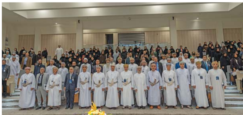
■ المؤتمر يهدف إلى تعزيز التعاون ومواءمة استراتيجيات الأعمال

نظمت جامعة السلطان قابوس ملتقى تعريفياً حول الإجراءات المتعلقة بالشؤون الأكاديمية وخدمة المجتمع، وذلك برعاية الأستاذ الدكتور سالم بن حمود الحارثي نائب الرئيس للشؤون الأكاديمية وخدمة المجتمع. يأتي الملتقى في إطار استعداد الجامعة لتجديد الاعتماد المؤسسي من الهيئة العمانية للاعتماد الأكاديمي وضمان جودة التعليم. يهدف الملتقى إلى تسليط الضوء على الإجراءات المتعلقة ببعض الجوانب الأكاديمية وخدمة المجتمع، توعية أعضاء هيئة التدريس والطلبة