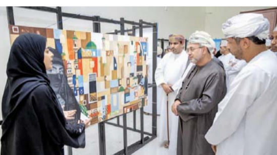
الملتقى يشارك فيه ٣٠ مشاركاً ومشاركة

إلى تشجيع المشاركين على تنمية مهاراتهم الفنية واستغلالها في الترويج السياحي والاقتصادي للولاية، ويتميز بتنوع المدارس الفنية التي ستسهم وعلى مدى ثلاثة أيام في نقل الجوانب الاقتصادية والاجتماعية والسياحية والتراثية في الولاية. ويتضمن الملتقى جولة للمشاركين لرسم معالم ولاية سناو على الطبيعة، والقيام بعدد من الزيارات للمكتبات العامة والأمان الأثرية بالولاية، بالإضافة إلى إقامة حلقة عمل تدريبية بمشاركة عدد من طلبة المدارس بالولاية.