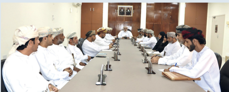
رئيس وأعضاء المجلس البلدي بشمال الشرقية أثناء الاجتماع

استضاف المجلس البلدي رئيس مجلس إدارة فرع غرفة تجارة وصناعة عمان بمحافظة شمال الشرقية الذي استعرض الجهود المبذولة في القطاعين الاقتصادي والتجاري ودعم برامج رواد الأعمال والمؤسسات الصغيرة والمتوسطة بالمحافظة. كما استضاف المجلس خلال اجتماعه مكتب متابعة وتنفيذ رؤية عمان ٢٠٤٠ بالمحافظة حيث استعرض خلالها المؤشرات في مختلف المشروعات التنموية والخدمية للعام ٢٠٢٣، وخطة المشروعات لعام ٢٠٢٤.