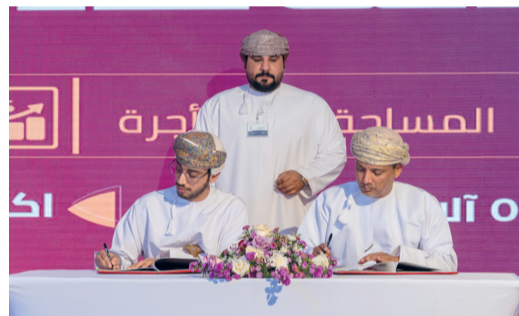
الافتتاحات سُسِّم في إيجاد صناعات تحويلية وقيمة مضافة بمدينة عبري الصناعية

في مكان واحد متكامل. وقال: تم منح حزمة من الحوافز للمستثمرين من ضمنها إعفاء من القيمة الإيجارية لمدة سنتين لكافة المشاريع الجديدة يليها تخفيض القيمة الإيجارية لمدة ثلاث سنوات تالية بنسبة ٥٠٪ للعقود المبرمة من عام ٢٠٢١ حتى ٢٠٢٤، وكذلك تخفيض كافة الرسوم الواردة بلائحة