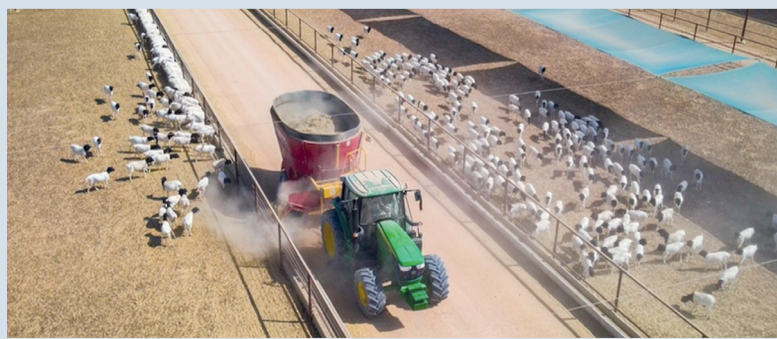
طرح ٤ فرص استثمارية لمشروعات حيوانية مختلفة خلال العام الماضي بالداخلية

والتخطيط العمراني ١٠ مواقع تحتوي على ٩٢٨ عذبة (تم توزيع ٨٢ عذبة) وجار استكمال التوزيع خلال العام الجاري، وتم مسح عدة مواقع إضافية وجار اعتمادها، كما تم توزيع عدد من الماعز والضأن المحسنة عن طريق مراكز بحوث الإنتاج الحيواني لمربي الثروة الحيوانية المتميزين للمحافظة على السلالات المحلية ونشر الجينات المنتقاة من خلال الانتخاب الوراثي على قطعان الثروة الحيوانية التي تتميز بأفضل السلالات المحلية على مستوى سلطنة عمان كسلالة ماعز الجبل الأخضر. وأشار إلى أنه جرى خلال العام الماضي التوقيع على اتفاقية مع القطاع الخاص لتشغيل مستشفى الإبل بالبشارف للنهوض بالخدمات البيطرية المقدمة للإبل وخاصة إبل السباق وتعزيز الشراكة بين القطاع الحكومي والقطاع الخاص لرفع جودة الخدمات المقدمة لهذا القطاع حيث من المتوقع بدء العمل بالمستشفى في الربع الثالث من العام الحالي.