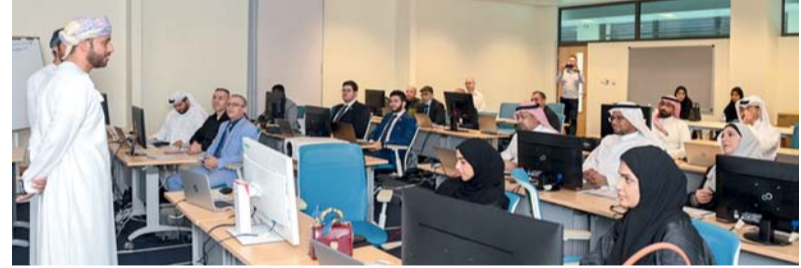
تمكين المتدربين من تحليل صور الأقمار الاصطناعية

مسقط - العمانية: استعرضت الحلقة الإقليمية الـ ١٩ لتطبيقات الأقمار الاصطناعية أمس بمسقط، تحليل مخرجات الأقمار الاصطناعية الخاصة بمراقبة الطقس وتطبيقاتها المختلفة، بمشاركة عدد من الخبراء المحليين والإقليميين وخبراء المنظمة الأوروبية لتطبيقات الأقمار الاصطناعية. وتهدف الحلقة التي يُنظمها مركز الامتياز لتطبيقات الأقمار الاصطناعية بهيئة الطيران المدني بالتعاون مع المنظمة الأوروبية لتطبيقات الأقمار الاصطناعية، إلى تدريب