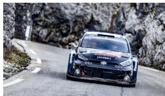
فريق تويوتا جازو للسباقات في إحدى مراحل السباق

شخص آخر، وأدى ذلك إلى صعوده إلى المركز الثاني ويفارق ١٠,٧ ثانية عن زميله في نهاية الحلقة الصباحية. كان ثنائي سائقي سيارة ياريس جي آر هايبرد والي امتقارين في أول مرحلتين من فترة ما بعد الظهر، قبل أن يسجل أوجيه فوزاً آخر في الاختبار النهائي المظلم لتقليص الفجوة بشكل أكبر. وتظل المنافسة ثلاثية على