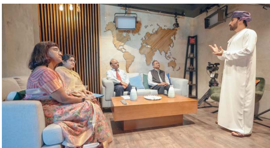
الوفد الهندي قام بزيارة عدد من الدوائر والأقسام الفنية بالهيئة