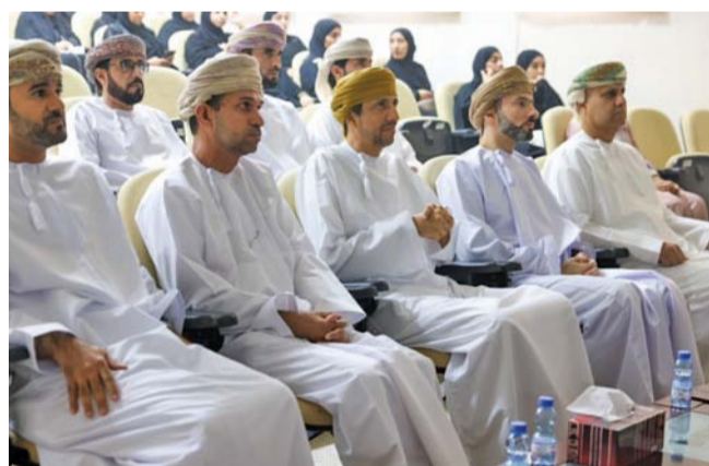
الحضور تعرفوا على أفضل الممارسات في الابتكار المؤسسي

الحكومية، وإدارة الابتكار والبرامج. يذكر أن الابتكار المؤسسي يعتبر عملية مستمرة تهدف إلى تطوير وتحسين الهياكل والعمليات الداخلية للمؤسسات بهدف تحقيق أهدافها بكفاءة أكبر، وهي ركيزة أساسية في بناء مؤسسات قوية ومستدامة، وضرورة لمواجهة التحديات والتغيرات في العصر الحديث.