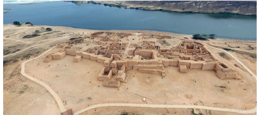
المحاضرة تناولت خريطة ظفار الأثرية ونتائج أعمال المسح والاستكشافات التاريخية