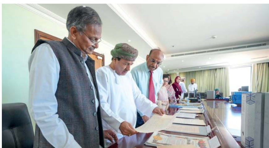
اطلع على عدد من الوثائق والمحفوظات

برلين. العُمانية: منح المخرج الأميركي مارتن سكورسيزي جائزة الذبي الفخري تقديراً لإنجازاته في مسيرته السينمائية وتأثيرها على الفن السابع. جاء تكريم المخرج وكاتب السيناريو الأميركي مارتن سكورسيزي، بجائزة الذبي الفخري خلال الدورة الرابعة والسبعين من مهرجان برلين السينمائي، الذي يُقام في العاصمة الألمانية بين ١٥ و ٢٥ فبراير بقصر برلين، وذلك تأكيداً على إنجازاته التي قدمها طوال حياته. وفي هذا الجانب قال مديراً الحدث السينمائي مارييت ريسنيك وكارلو شاتريان أن مارتن سكورسيزي يعد نموذجاً لا مثيل له لكل من يعتبر السينما فن ابتكار قصة شخصية وعالمية في آن. يشار إلى أن سكورسيزي الذي أنجز أكثر من ٧٠ فيلماً، قد حصل على العديد من الجوائز أهمها السعفة الذهبية لمهرجان كان السينمائي في العام ١٩٧٦ عن فيلم (تاكسي درايفر) وأوسكار في فئة أفضل مخرج عام ٢٠٠٧ (عن ذي ديبارتد).