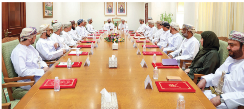
■ اللقاء أكد توفير خدمات إلكترونية لتسهيل الإجراءات

في إطار اللقاءات السنوية الهادفة بين رؤساء الوحدات الخدمية والمحافظة، التقى معالي السيد سعود بن هلال البوسعيدي محافظ مسقط بمعالي الدكتور محمد بن سعيد المعمرى وزير الأوقاف والشؤون الدينية أمس؛ وذلك لاستعراض جهود الوزارة ومجالات التعاون والشراكة مع محافظة مسقط. نُوقش خلال اللقاء عدد من البرامج التي تعمل الوزارة على تنفيذها بما يتواءم مع المحاور الأساسية الموجهة لرؤية عُمان ٢٠٤٠، وهي أولوية التعليم والتعلم والبحث العلمي والقرارات