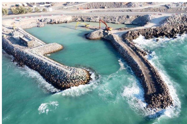
المشروع يوفر بيئة مناسبة وجاذبة للصيادين لمزاولة مهنة الصيد

أمتار، والكاسر الثانوي ٦٧ متراً، ومساحة حوض الميناء ١٢١٥٥ متراً مربعاً، أما في منطقة الجري، فيبلغ طول كاسر الأمواج الرئيسي البحري ١٢٤ متراً، والكاسر الثانوي ٤١ متراً، ومساحة حوض الميناء ٣١٧٣ متراً مربعاً.