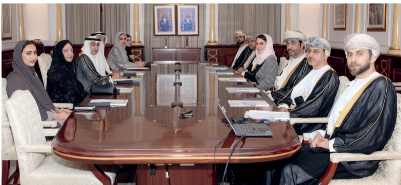
■ اللجنة المشتركة بين جامعة السلطان قابوس وجامعة الإمارات أثناء اجتماعها

السنوية للتعاون البحثي، بالإضافة إلى مناقشة التعاون في مجال التطبيق العملي لكليات الحقوق من خلال تفعيل دور المحاكم الصورية والعيادات القانونية، ومناقشة آلية تفعيل برنامج التبادل الطلابي للعام الأكاديمي ٢٠٢٤/٢٠٢٥.