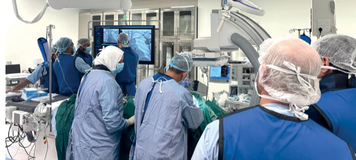
العمليات في إطار جودة الخدمات الصحية المقدمة للمرضى

بغداد. ا.ف.ب. يواجه العراق الذي يعاني من الجفاف إضافة إلى أزمات أخرى أنتجت عقود من صراعات برمت بناه الأساسية، تلوثاً «كارثياً» في مياه أنهاره لأسباب أبرزها تسرب مياه الصرف الصحي والنفايات الطبية. ويؤكد مسؤولون أن المؤسسات الحكومية نفسها تقف خلف جزء من هذا التلوث البيئي، فيما تكافح السلطات المختصة لمواجهة هذه الآفة التي تهدد الصحة العامة في العراق. ويحصل نحو نصف سكان العراق فقط، على خدمات مياه صالحة للشرب، وفقاً لإحصاءات الأمم المتحدة. ويبلغ عدد السكان ٤٣ مليوناً.