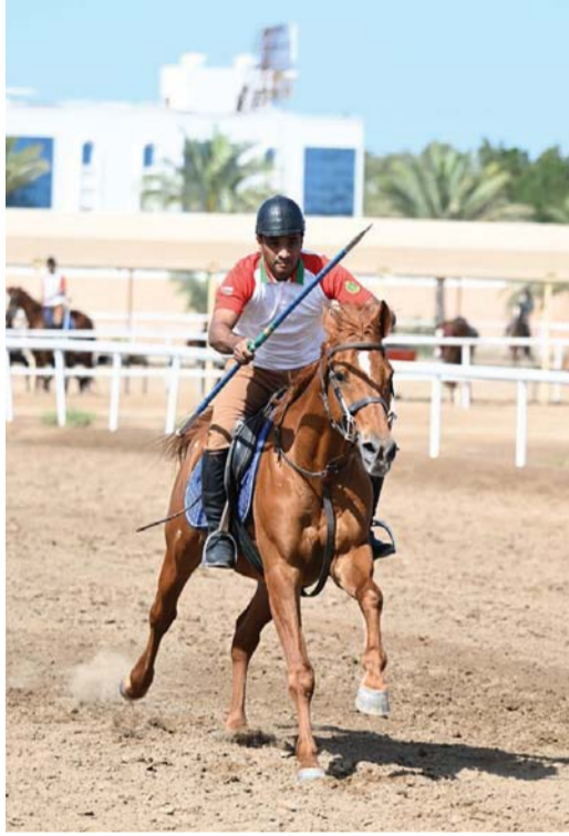
أحد الفرسان في محاولة لالتقاط وتد

كما تواجد في المنافسة مجموعة من المتسابقات، وقد تنافست المتسابقات على