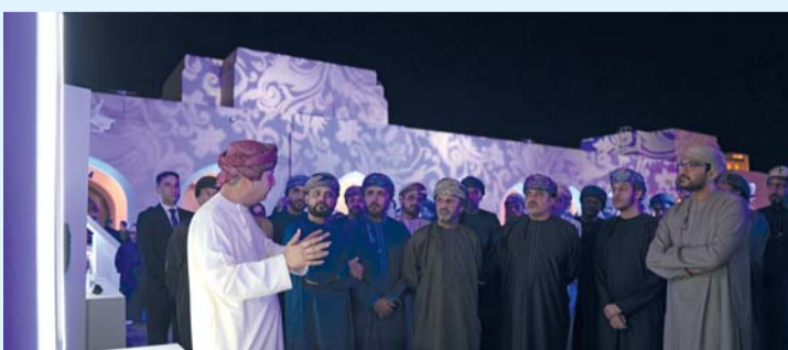
الحوسبة السحابية تساهم في حفظ وتأمين البيانات بسلطنة عمان