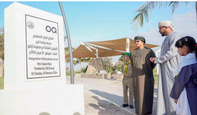
أثناء افتتاح حدائق واحة «إتين»

علمية للطلبة والطالبات من خلال اقتراح الجوانب التعليمية والترفيهية، كما اطلع على الجانب الآخر من حديقة المتعلق بالألعاب التفاعلية التي تقام على مساحة ١٤٠٠ متر مربع، واستمع لسعادته إلى شرح عن مكوناتها وفكرتها والأهداف المتوخاة