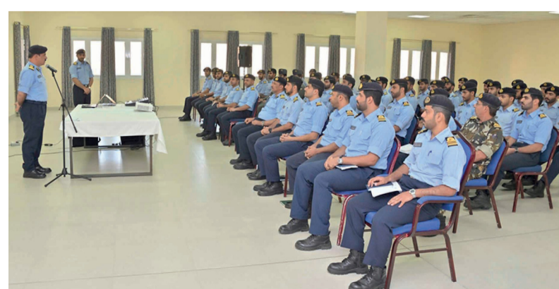
■ التمرين يأتي في إطار الخطط التدريبية السنوية

العُمانيّة، أكد فيه على أهداف التمرين وخطة العامة ومدى أهميته في رفع الكفاءة القتالية وبما يتضمنه برنامج التمرين من تدريبات متنوعة وأحداث مختلفة، الجدير بالذكر أن تنفيذ هذا التمرين يأتي في إطار الخطط التدريبية السنوية التي تنتهجها البحرية السلطانية العُمانيّة، لإدامة مستويات الجاهزية لأسطولها ومنسوبيها في مختلف التخصصات البحرية، وبما يتماشى والمهام الوطنية المنوطة بها.