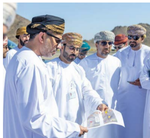
زيارة عبد من المشاريع السياحية بمحافظة شمال الشرقية

نظمت وحدة متابعة رؤية عمان ٢٠٤٠ بالتعاون مع مكتب محافظ مسندم، حلقة نقاشية بعنوان «الابتكار المؤسسي»، برعاية معالي السيد إبراهيم بن سعيد البوسعيد محافظ مسندم وبحضور أصحاب السعادة الولاة ومديري عموم الوحدات الحكومية في المحافظة. تطرقت الحلقة إلى أهمية الابتكار المؤسسي، وتقديم نظرة شاملة للمبادئ التوجيهية وتحديد أفضل الممارسات الحالية المتبعة في مختلف المؤسسات، بالإضافة إلى أبرز التحديات التي تواجه المؤسسات، وذلك بهدف الوصول إلى أفضل الحلول التي يمكن اتباعها للتغلب من هذه التحديات. علماً بأن مخرجات هذه الحلقة ستغذي مشروع الدليل الإرشادي للابتكار المؤسسي التي تعمل وحدة متابعة رؤية عمان ٢٠٤٠ على إعداده، والذي سيكون بمثابة الإطار الشامل للجهات الحكومية وأداة ممكنة لتطوير ثقافة الابتكار المؤسسي فيها، حيث من المؤمل أن يتطرق الدليل إلى العناصر الرئيسية للابتكار، بما في ذلك تعريف الابتكار المؤسسي، ونظام الابتكار المؤسسي للجهات