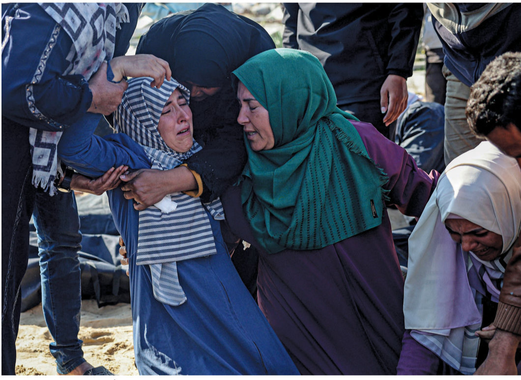
فلسطينيات يبدين الحزن خلال تشييع جثمان شهيد قبل دفنه في مقبرة في رفح أمس.

جلالة السلطان يهنئ خادم الحرمين وحاكم عام سانت لوسيا مسقط . العمانية: بعث حضرة صاحب الجلالة السلطان هيثم بن طارق المعظم - حفظه الله ورعاه - برفقة تهنئة إلى أخيه خادم الحرمين الشريفين الملك سلمان بن عبد العزيز آل سعود ملك المملكة العربية السعودية؛ بمناسبة يوم التأسيس. أعرب فيها جلالته عن تهنئه الخاصة لأخيه خادم الحرمين الشريفين، وتمنياته الصادقة له بموفق الصحة والسعادة والعمر المديد، مقرونة بالدعاء إلى الله تعالى أن يعيد عليه هذه المناسبة وأمثالها، وقد تحققت المزيد مما يصبو إليه الشعب السعودي الشقيق من تقدم ونماء ورخاء. كما بعث حضرة صاحب الجلالة السلطان هيثم بن طارق المعظم - حفظه الله ورعاه - برفقة تهنئة إلى فخامة سيريل إيرول تشارلز حاكم عام سانت لوسيا بمناسبة ذكرى استقلال بلاده. تضمنت تهنئتي وتمنياتي جلالته الطيبة لخدمته ولشعب بلاده الصديق بأطراف التقدم والنماء.