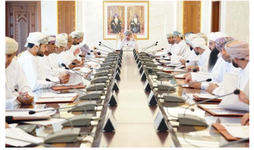
المجلس البلدي بمحافظة الداخلية أثناء اجتماعه أمس

انطلقت أمس أعمال الاجتماع التاسع لفريق الخبراء المعني بإصلاح نظم الحماية الاجتماعية في المنطقة العربية التابع للجنة الاقتصادية والاجتماعية لغربي آسيا بمنظمة الأمم المتحدة «الإسكوا»، والذي تستضيفه سلطنة عُمان ممثلة في وزارة التنمية الاجتماعية برعاية معالي الدكتورة ليلي بنت أحمد النجار وزيرة التنمية الاجتماعية. ويهدف الاجتماع إلى إطلاع الخبراء على أهم تشريعات وخدمات وبرامج الحماية الاجتماعية في سلطنة عُمان مختلف فئات المجتمع، والاستفادة من خبراء المنظمة في تأهيل وتدريب المختصين في وزارة التنمية الاجتماعية على كيفية إعداد التقارير الدولية التخصصية ورصد وتحليل البيانات، ورسم الخطط الاستراتيجية والتشريعات، والتعاون في إعداد منصة متكاملة لرصد جميع النقصات للخدمات الاجتماعية التي تقدمها سلطنة عُمان مختلف الفئات. وشهد الاجتماع تقديم أوراق عمل حول: خدمات الحماية المقدمة للطفل، وأهم خدمات الحماية