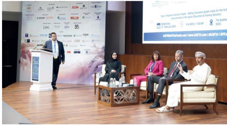
المؤتمر أوصى باستمرار العمل على دراسة منظومة البطاقة البرتقالية للتأمين

بالمملكة العربية، كما أوصى باستمرار العمل على دراسة منظومة البطاقة البرتقالية بما يضمن تحسين أداؤها وبما يتوافق مع المستجدات الحالية وتشجيع عمل جهات الرقابة على شركات التأمين العمق على حساب المعايير الدولية لضمان صحة شركات التأمين واعتماد النظام الأساسي واللائحة الداخلية للاتحاد. وناقش المؤتمر على مدى ثلاثة أيام الذي نظّمته الجمعية العُمانية للتأمين بالتعاون مع الاتحاد العام العربي للتأمين ويقام كل عامين ملتقى دوري لممثلي صناع سياسات