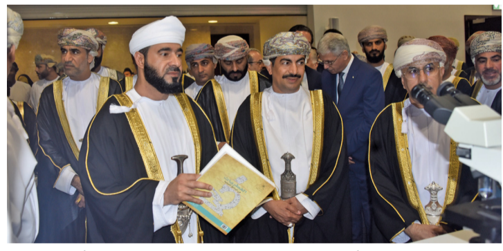
معالى الدكتور وزير الأوقاف والشؤون الدينية راعي الافتتاح يتعرف على أركان المعرض.

انطلقت أمس فعاليات المحفل الثقافي السنوي (معرض مسقط الدولي للكتاب) في دورته الـ (٢٨)، حيث يقدم الناشر المشاركون أكثر من نصف مليون عنوان في شتى مجالات العلوم والفنون والآداب، وقد بلغت الإصدارات العمانية أكثر من (١٩) ألف إصدار، وتجاوز مجمل الكتب العربية الـ (٢٦٨) ألفاً، فيما بلغت الكتب الأجنبية أكثر من (٢٠٤) آلاف، ويبلغ عدد الفعاليات الثقافية (١٢٤) فعالية، بالإضافة إلى (١٣١) نشاطاً للطفل. وتحتل محافظة الظاهرة ضيف شرف على الدورة الحالية من المعرض جرياً على العرف الذي يتبعه المعرض كل عام باختيار إحدى محافظات سلطنة عُمان؛ بهدف تسليط الضوء على تراثها وإنتاجها الثقافي ورموزها الإبداعية.