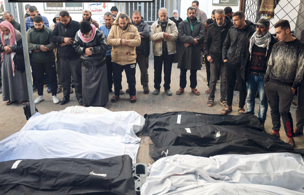
■ فلسطينيون يؤدون صلاة الجنازة على شهداء مستشفى النجار برفح، وفي الإطار فلسطيني يحمل جثمان طفله الشهيد جراء قصف الاحتلال على رفح.

و استهدفت مدفعية الاحتلال بعشرات القذائف منازل الفلسطينيين في حي الزيتون بالمتزامن مع إطلاق مسيرات الاحتلال النار على كل ما يتحرك في أرتقة الحي وشوارع. وشنت طائرات الاحتلال سلسلة غارات طالت عدة أحياء من مدينة غزة، خاصة تل الهوى والصبرة والشجاعية، ما أسفر عن ارتقاء عدد من الشهداء والجرحى، وجرى نقل معظمهم إلى مستشفى الشفاء.