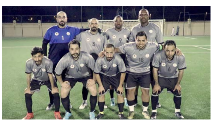
فريق المديرية العامة للشؤون العامة