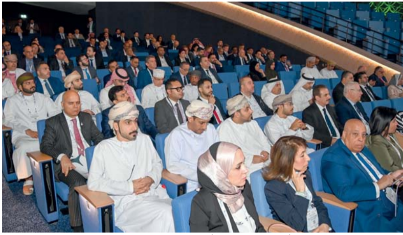
المؤتمر يناقش الابتكار والتطورات التكنولوجية والتحول الرقمي والموارد الطبيعية وتجربة العملاء وحوكمة قطاع التأمين

فهد آل سعيد الأمين العام في الأمانة العامة لمجلس الوزراء وبحضور عدد من أصحاب السمو والمعالي والسعادة والمسؤولين من القطاعين الحكومي والخاص وبمشاركة أكثر من ٢٢٠٠ مشارك منهم أكثر من ١٨٠٠ مشارك من مختلف دول العالم. ويأتي المؤتمر الذي بدأ أعماله أمس في مركز عُمان للمؤتمرات والمعارض ويستمر على مدى ثلاثة أيام بتنظيم من الجمعية العمانية للتأمين بالتعاون مع الاتحاد العام العربي للتأمين ويقام كل عامين ملتقى دوري لمخاليق صناعات التأمين وشركات التأمين وإعادة التأمين العربية والعالمية. كما تعقد على هامش المؤتمر اجتماعات ولقاءات تشاورية بين شركات التأمين ومعيدي التأمين من مختلف البلدان العربية والأجنبية لتعزيز التعاون بما يمهّد لقيام أعمال