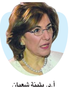
د. بثينة شعبان كاتبة سورية