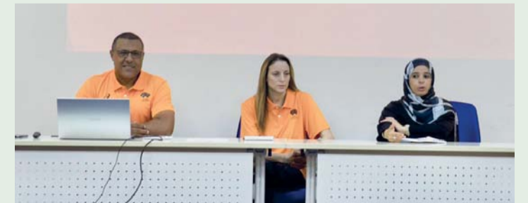
المحاضرون في الدورة

بدأت أمس فعاليات الدورة الدولية لتأهيل مدربي ألعاب القوى المستوى الأول التي ينظمها الاتحاد العماني لألعاب القوى بالتعاون مع الاتحاد الدولي لألعاب القوى بمشاركة ٢٤ دارساً خلال الفترة من ١٩ من الشهر الجاري وحتى الأول من مارس القادم يمثلون وزارة التربية والتعليم والجهات العسكرية المختلفة وشرطة عمان السلطانية وعدداً من الأندية ومدربي المنتخبات الوطنية. تشمل الدورة على مدار الأيام القادمة عدداً من الجلسات النظرية والعملية منها جلسات حول فلسفة التدريب ومبادئ التخطيط للتدريب الرياضي والجوانب الفنية لمسابقات ألعاب القوى المختلفة بالإضافة جوانب تطبيقات عملية. وتأتي هذه الدورة حرصاً من الاتحاد العماني لألعاب القوى ممثلاً في لجنة التطوير الفني على تطوير الكوادر الفنية بألعاب القوى وإكسابهم المهارات النظرية والعملية في مجال التدريب الرياضي وتنمية وتطوير قدراتهم التدريبية.