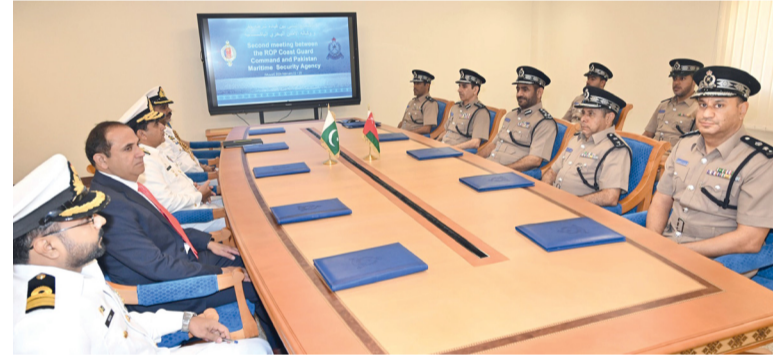
اللقاء تناول عدداً من الموضوعات المشتركة

مسقط - الوطن: مهندس علي بن سيف المقبالي قائد شرطة خفر السواحل، ومن جانب جمهورية باكستان الإسلامية اللواء بحري امتياز علي مدير عام وكالة الأمن البحري. استعرض الاجتماع الموضوعات ذات الاهتمام المشترك وسبل تعزيز التعاون القائم بين الجانبين في مجال الأمن البحري.