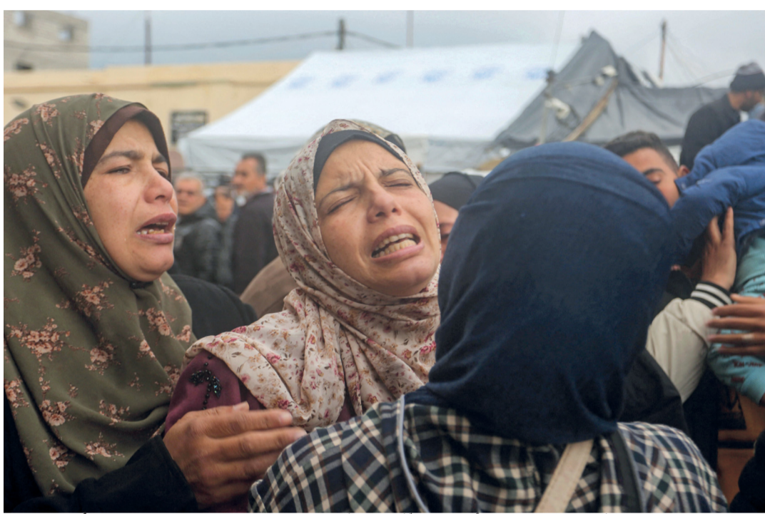
ردود فعل نساء فلسطينيات بعد استشهاد أقربهن في غارة جوية إسرائيلية استهدفت منزل عائلة بركة في دير البلح وسط غزة.

يُعد في ٢٦ وال ٢٧ من فبراير الجاري منتدى صحار للاستثمار، الذي ينظمه فرع غرفة تجارة وصناعة عُمان بمحافظة شمال الباطنة، حيث يتضمن برنامج المنتدى على مدار اليومين، العديد من المحاور