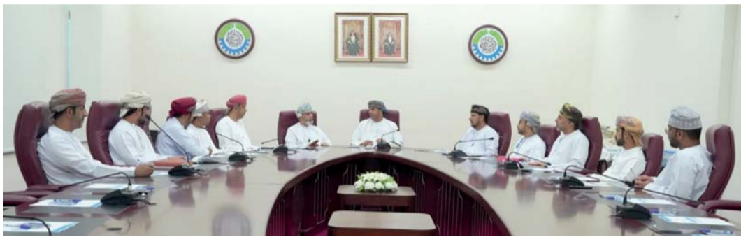
الاجتماع أكد ضرورة تكامل الأدوار بين المؤسسات ذات العلاقة بسوق العمل

وطرح الأعضاء خلال الاجتماع بعض المعوقات التي تواجه المؤسسات الصغيرة والمتوسطة في سوق العمل والحلول المناسبة لها والإجراءات التي تصحح مسارات العمل في بعض الأنشطة وتشغيل الكوادر الوطنية وتوطين الوظائف وضمان استدامة المؤسسات الصغيرة والمتوسطة وتعزيز إسهامها في الناتج المحلي.