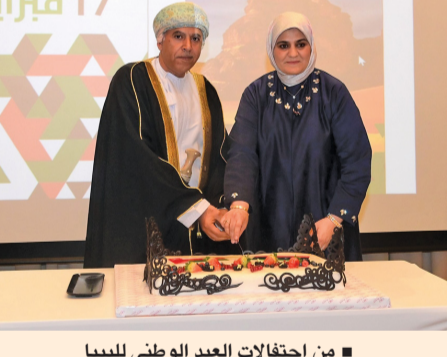
من احتفالات العيد الوطني الليبي

مسقط - العمانية: أقامت السفارة الليبية مساء أمس الأول حفل استقبال بمناسبة العيد الوطني الليبي بفندق كراون بلازا. بحضور عدد من المسؤولين بسلطنة عمان، وعدد من رؤساء البعثات الدبلوماسية المعتمدين لدى سلطنة عمان، وعدد من المسؤولين بوزارة الخارجية.