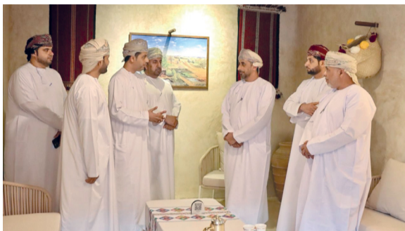
.. وأثناء زيارة أحد المشاريع السياحية