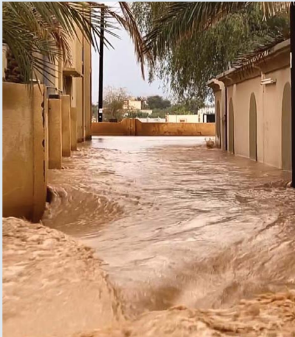
السد سيحمي الممتلكات العامة والخاصة من الأضرار