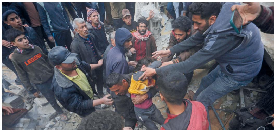
فلسطينيون يسحبون صبيًا من تحت أنقاض منزل عائلة بركة في دير البلح.

واشنطن تعلن استهداف صواريخ ومسيرات لـ «ناصر الله في اليمن واشنطن، ١٠ أ.ف.ب. أعلنت الولايات المتحدة أن قواتها في البحر الأحمر نفذت خمس ضربات بنجاح في إجراء للدفاع عن النفس لإحباط هجمات من المناطق التي تسيطر عليها جماعة انتصار الله في اليمن. وقال الجيش الأمريكي إن الضربات هي جزء من سلسلة إجراءات اتخذتها الولايات المتحدة وحلفاؤها بهدف وقف الهجمات المتكررة في الممرات الملاحية في البحر الأحمر.