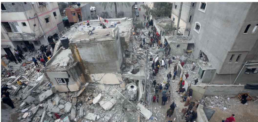
أشخاص يبحثون عن ضحايا تحت أنقاض المنازل المدمرة في غزة.