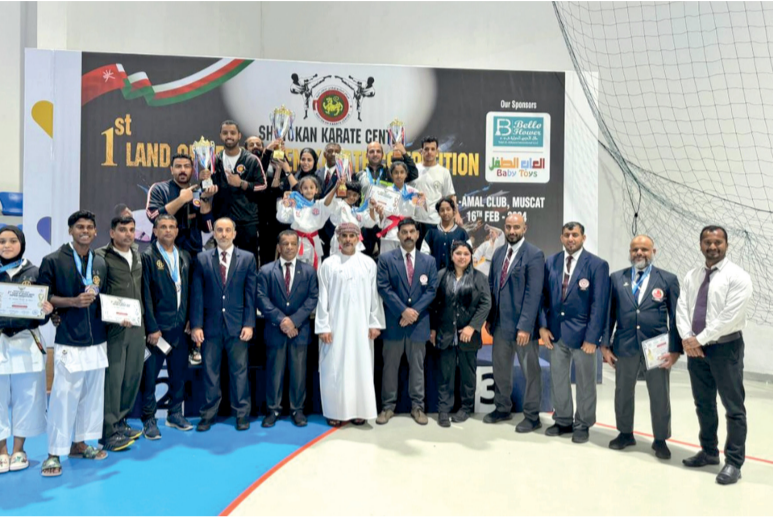
صورة جماعية لراعي الختام مع لاعبي الفرق المتوجة والحكام

وقال في التقرير «النتائج تشير، كما كان متوقعًا، إلى أن الإيجابيات لا تفوق السلبيات بالنسبة إلى معظم اللاعبين والأندية، ما يجعل النظام غير مستدام». واتهم «فيفيرو» الاتحاد الآسيوي للعبة بتبني «نهج من أعلى إلى أسفل». يستبعد أصوات اللاعبين والأندية من صنع القرار.