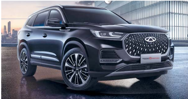
تيجوه ٨ رائدة وفخمة في عالم السيارات