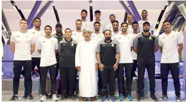
بعثة نادي السيب لكرة الطائرة