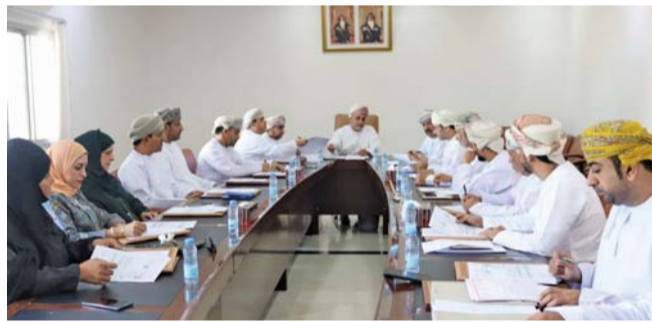
أثناء الاجتماع الأول لمجلس أولياء الأمور بالمصنعة

عقد بمتك سعادة الشيخ والي ولاية المصنعة الاجتماع الأول لمجلس أولياء الأمور بالولاية برئاسة سعادة الشيخ أحمد بن علي بن سعود الحبسي والي المصنعة رئيس المجلس، حيث رحب سعادته بالحضور ثمنا الدور الكبير الذي تقوم به مدارس الولاية متمنياً في أدوار إدارات المدارس والهيئات التدريسية والإدارية. بعد ذلك تم استعراض عدد من المواضيع منها محضر الاجتماع الأول واستعراض خطة المجلس العامة واللجان الفرعية. كما تم الاتفاق على تكريم الطلبة المشاركين في مسابقة القرآن الكريم في الحفظ والتلاوة على مستوى مدارس الولاية خلال الشهر الحالي. كما تم استعراض بعض التحديات والعادات الصحية السلبية