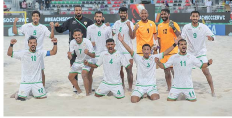
لاعبو منتخبنا للقدم الشاطئية يعبرون عن فرحتهم بالفوز على المكسيك

بدولة الإمارات العربية المتحدة. وقد أحيا منتخبنا آماله في التأهل إلى الدور ١٦ ضمن المجموعة الرابعة بعد أن نجح في تعويض الخسارة الافتتاحية أمام البرازيل ٣-٥ بالفوز أمس الأول على نظيره المكسيكي ٥/٢ ضمن مباريات الجولة