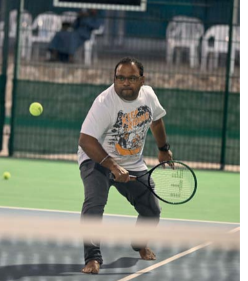
من منافسات البطولة