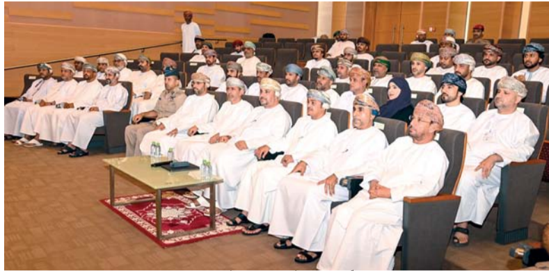
الحلقة ناقشت التحديات الحالية والمستقبلية لنظومة الأمن الإلكتروني

صلاة. العُمانيّة: نظّم مكتب محافظ ظفار بالتعاون مع مركز الدفاع الإلكتروني أمس حلقة توعوية بمجمع السلطان قابوس الشبابي للثقافة والترفيه بصلالة حول «الأمن الإلكتروني». رعى افتتاح الحلقة صاحب السمو السيد مروان بن تركي آل سعيد محافظ ظفار بحضور عدد من أصحاب السعادة والمسؤولين. تضمنت الحلقة التي قدّمها الدكتور مازن بن حمد الشيعلي مساعد رئيس مركز الدفاع الإلكتروني عدداً من المحاور من بينها التعريف بالمرکز، وأبرز الأعمال والتشريعات التي وضعها، إلى جانب استعراض الاستراتيجية الوطنية للدفاع الإلكتروني ٢٠٢٢-٢٠٢٥م، والتحديات الحالية والمستقبلية لنظومة الأمن الإلكتروني وطرق