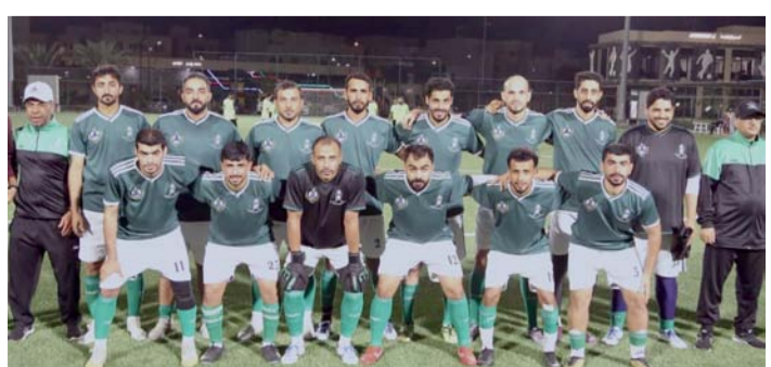
فريق المديرية العامة للخدمات الطبية (أ)