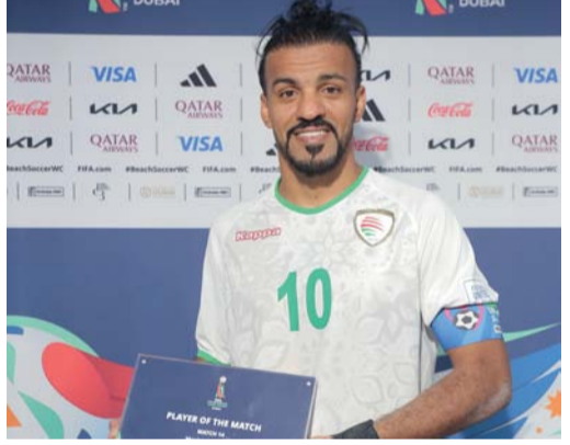
لاعبو منتخبنا للقدم الشاطئية يعبرون عن فرحتهم بالفوز على المكسيك

بدولة الإمارات العربية المتحدة. وقد أحيا منتخبنا آماله في التأهل إلى الدور ١٦ ضمن المجموعة الرابعة بعد أن نجح في تعويض الخسارة الافتتاحية أمام البرازيل ٣-٥ بالفوز أمس الأول على نظيره المكسيكي ٥/٢ ضمن مباريات الجولة