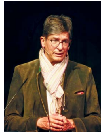
■ فريدريش كلوتشه مخرج الفيلم

تعزيزاً للقيم الرفيعة التي أسسها الأسلاف، وترسيخاً لدورها في بناء الهوية الوطنية العمانية الحديثة. مع أهمية نقله للأجيال القادمة في وسائط فنية وبصرية تتلاءم مع روح العصر، وتستثمر تحولاته التكنولوجية والثقافية في طرائق الإنتاج وأنماط التلقي.