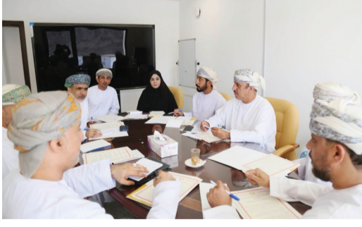
أعضاء المجلس البلدي أثناء الاجتماع أمس

صور - من عبدالله باعلوي: عقدت لجنة الشؤون الصحية والبيئية بالمجلس البلدي بمحافظة جنوب الشرقية اجتماعاً لها أمس بحضور أعضاء اللجنة والمختصين من إدارة البيئة بالمحافظة والمديرية العامة للثروة الزراعية والسمكية وموارد المياه وإدارة التراث والسياحة وبلدية جنوب الشرقية لمناقشة بعض توصيات المجلس البلدي بالمحافظة. تم خلال الاجتماع مناقشة موضوع إدارة الشواطئ والخروج بمرئيات بهدف حماية الأراضي المنخفضة من مخاطر الغمر بمياه البحر وأمواج المد العالي والحد من تلوث الشواطئ، إضافة إلى إمكانية دراسة استحداث أراض جديدة للاستثمار وخلق فرص عمل لأبناء المحافظة. كما ناقشت اللجنة مقترح محمية بحرية قد تكون الأولى في سلطنة عمان تهدف إلى حفظ الطبيعة وإيجاد محمية طبيعية لحماية الحوت الأحدب والسلاحف البحرية والأسماك والكائنات المائية الحية، ومنع عمليات الصيد التجاري في المحمية والسماح للصيد التقليدي الذي لا يؤثر على البيئة البحرية.