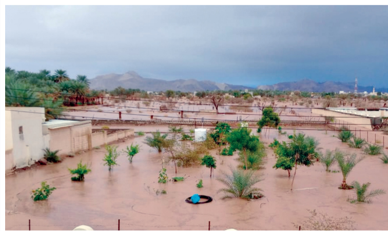
السد سيحمي الممتلكات العامة والخاصة من الأنواء المناخية

ناشد أهالي بلدة الدرزي بولاية عبري الجهات المختصة بوزارة الزراعة والسكنية وموارد المياه بسرعة تنفيذ مشروع سد التغذية الجوفية