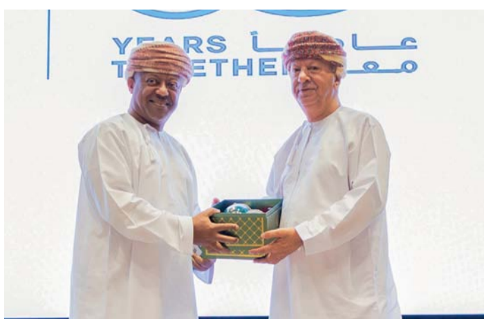
الحلقة شهدت تكريم عدد من موظفي بنك عُمان العربي

نظم بنك عُمان العربي مؤخراً حلقة حول تحول الخدمات المصرفية وذلك باستضافة سعادة حمود بن سنجور الزنجالي الرئيس التنفيذي السابق للبنك المركزي العماني وبحضور عدد من مسؤولي البنك والمشاركين في برنامج البنك التدريبي رؤاد العربي. وتعد هذه الحلقة خطوة مهمة لارتقاء القطاع المصرفي في سلطنة عمان وسلط الضوء على التكيف مع اقتصادات السوق المختلفة وتصور مستقبل الخدمات المصرفية.