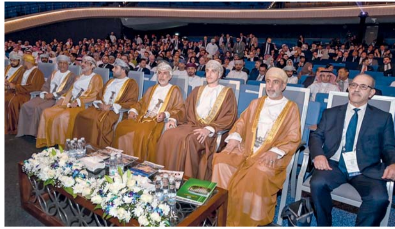
راعي المؤتمر والحضور