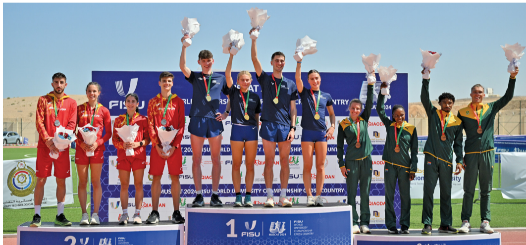
تتويج الفائزين بمسابقات اليوم الأول

وبشكل كبير لنمو الطالب وارتقائه بالمستوى العلمي والعلمي، متمنياً من كافة المشاركين الذين يحققون الإنجازات في هذه البطولة العالمية بأن يستمروا في مثابرتهم وتنمية قدراتهم الرياضية والأكاديمية. كما يجب على الطلبة الرياضيين الذين لم ينجحوا في الحصول على المراكز الأولى أن يستمروا في المثابرة وسيلجؤون يوماً ما إلى مبتغاهم.