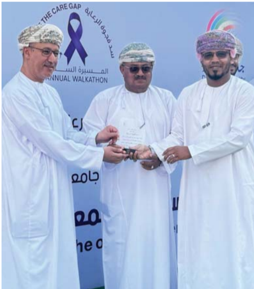
تكريم الداعمين للفعالية