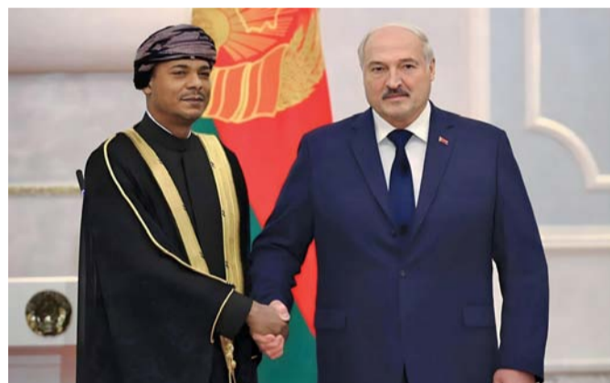
الرئيس البيلاروسي أثناء استقباله حمود آل تويه