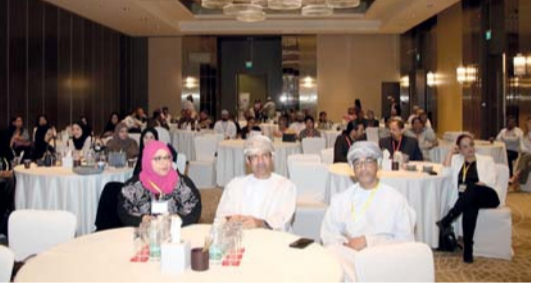
■ الحضور أثناء المؤتمر

العديد من الحملات التوعوية المجتمعية وذلك وللنهوض بخدمات التخدير والعناية الفائقة في السلطنة.