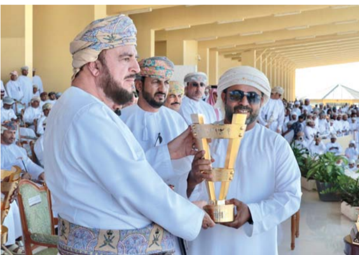
تكريم الفائز بكأس البشائر