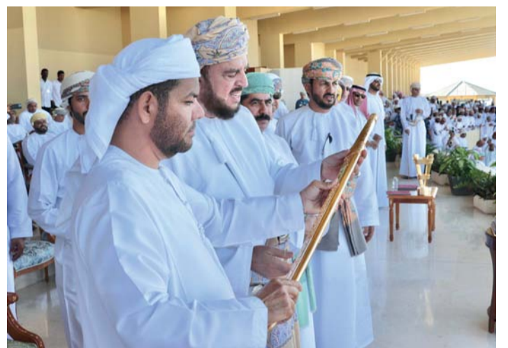
تكريم الفائز بالسيف الذهبي