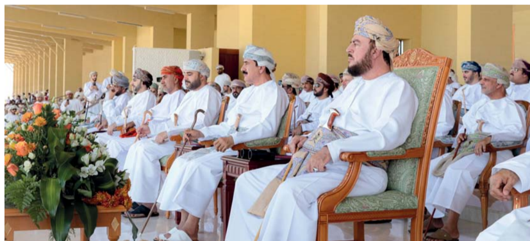
أسعد بن طارق والحضور في اليوم الختامي للمهرجان