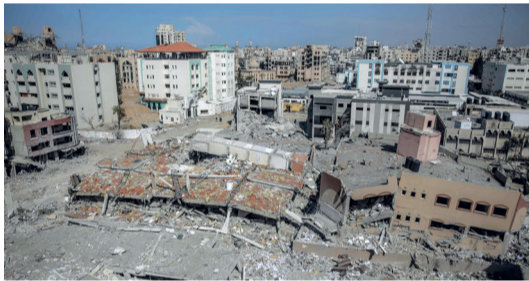
ما تبقى من جامعة الأقصى بغزة بعد القصف الإسرائيلي

الدولتين على الأجددة الدولية؛ تحقيقاً لإرادة المجتمع الدولي وتبنيًا للعدالة وقواعد الأمن والاستقرار لجميع الأطراف. وكان معاليه أكد بمحاضرة في مركز أكسفورد للدراسات الإسلامية بعنوان «التحدث مع الجمع من أجل مصلحة الجمع: الدبلوماسية في عالم متعدد الأقطاب على أن إنشاء دولة فلسطينية هو ضرورة وجودية. إلى ذلك ارتكب جيش الاحتلال الإسرائيلي (٩) مجازر بحق العائلات في قطاع غزة، أدت لاستشهاد (٨٣) فلسطينياً، وجرح (١٢٥) آخرين، خلال (٢٤) ساعة. تفاصيل: ص ٢ و٥