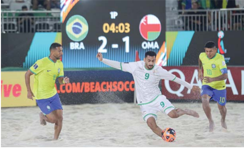
لاعب المنتخب في محاولة لتجاوز لاعبي البرازيل