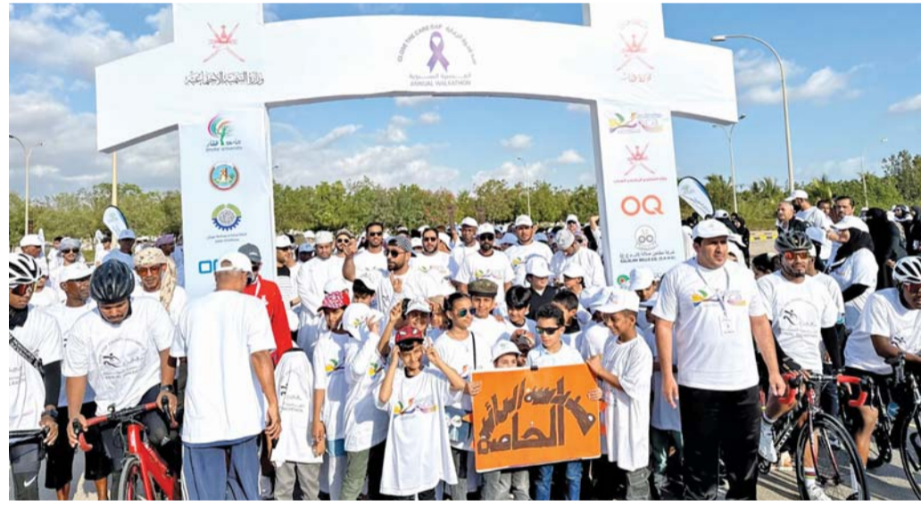
مشاركة كبيرة شهدت فعاليات المشى