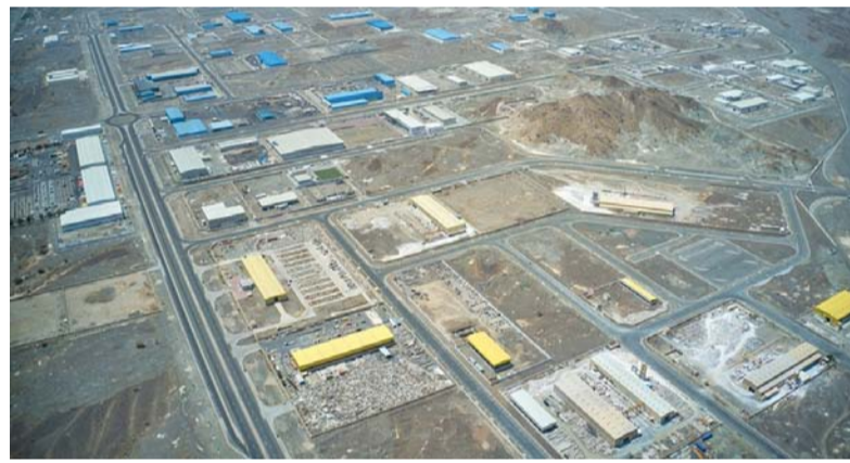
تطين ٢٤ مشروعاً في مدينة سماء الصناعية خلال عام ٢٠٢٣م

العجمي أنه من الفرص الاستثمارية المتاحة أيضاً تطوير وتشغيل وإدارة المدينة السكنية بالمدينة الصناعية، نظراً للنمو السنوي المتزايد في حجم الاستثمار في المدينة الصناعية، والذي يتطلب توفير مساحة مخصصة لإقامة مدينة سكنية متكاملة تخدم القوة العاملة في مصانع المدينة الصناعية، وسعت المدينة الصناعية إلى توفير قطعة أرض بمساحة ١٠٠ ألف متر مربع لطرحتها كقرصة استثمارية. ولفت إلى أن المؤسسة العامة للمناطق الصناعية «مدائن» قامت بتقسيم المدينة الصناعية إلى عدة قطاعات، من بينها قطاع المواد الغذائية الذي تتجاوز نسبة الإشغال فيه بالمائة والقطاع اللوجستي بنسبة إشغال تتجاوز ٢٦ بالمائة وقطاع الحديد والأخشاب بنسبة إشغال تتجاوز ٦٠ بالمائة وقطاع البلاستيك والورق بنسبة إشغال تتجاوز ٨٥ بالمائة وقطاع الرخام بنسبة إشغال تتجاوز ٧٨ بالمائة بالإضافة إلى قطاع «رود الأعمال» لأصحاب المؤسسات الصغيرة والمتوسطة، والذي تتجاوز نسبة الإشغال فيه حالياً ٣٤ بالمائة. وقال إن هناك عدداً من فرص الاستثمار التي تتوفر لها دراسات جدوى مبدئية في مدينة سماء الصناعية تتمثل في مختلف القطاعات المتعلقة بالمواد الغذائية والبناء والأجهزة والموصلات الكهربائية.