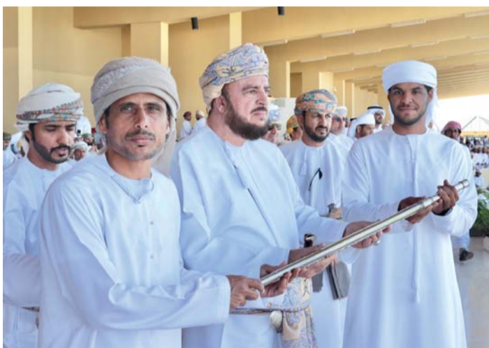
تكريم الفائز بالسيف الفضي