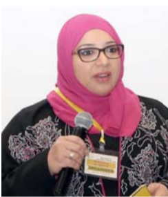
■ رملاء مال الله