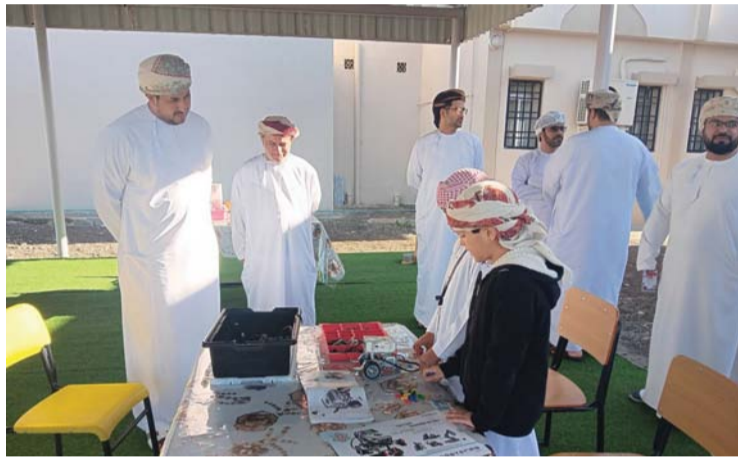
إحدى المبادرات المشاركة في الملتقى