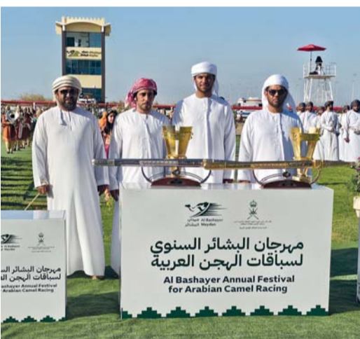
الفائزون في اليوم الختامي