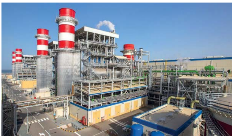
٦,٨٪ ارتفاعاً بإنتاج سلطنة عمان من الكهرباء بنهاية نوفمبر الماضي

٢٨,١ بالمائة حيث بلغ ١٨٧,٤ جيجاوات بالساعة وبمحافظة مسندم ارتفع إجمالي الإنتاج ب ٦,٢ بالمائة مسجلاً ٤٥٣,٩ جيجاوات في الساعة. وأشارت الإحصاءات إلى أن صافي إنتاج سلطنة عمان من الكهرباء حتى نهاية شهر نوفمبر الماضي ارتفع بنسبة ٦,٨ بالمائة ليبلغ ٤٠٣٤٤,٦ جيجاوات في الساعة. من جانب آخر أوضحت الإحصاءات أن إجمالي كمية المياه المنتجة في سلطنة عمان ارتفع بنسبة ١,٨ بالمائة ليبلغ ٤٧٨١٨٢,٩ متر مكعب مقارنة بالفترة ذاتها من عام ٢٠٢٢م.