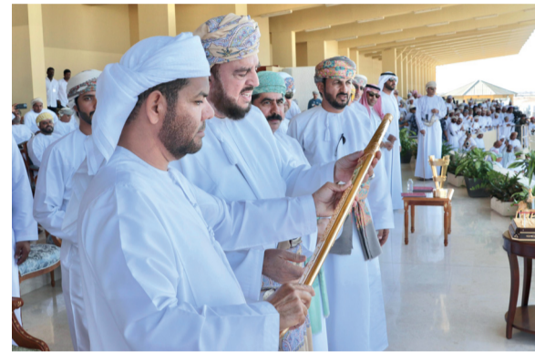
تكريم الفائز بالسيف الذهبي

رعى صاحب السمو السيد أسعد بن طارق آل سعيد نائب رئيس الوزراء لشؤون العلاقات والتعاون الدولي والممثل الخاص لجلالة السلطان منافسات اليوم الختامي لمهرجان البشائر السنوي السابع لسباقات الهجن العربية لعام ٢٠٢٤ م. تفاصيل: «القطر»