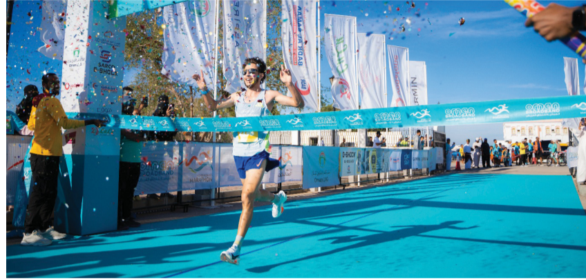
لحظة وصول بطل سباق ١٠ كلم