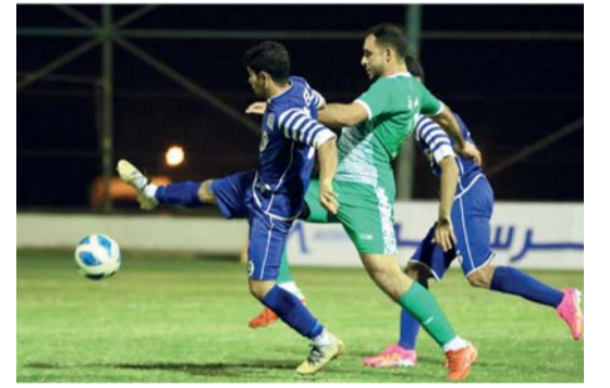
من اللقاء الذي جمع فريقى البصرة وهيل

نظمت الجمعية العمانية للسرطان بمحافظة ظفار يوم أمس الأول بجامعة ظفار سباق المشى السنوي تحت (شعرا سند فجوة الرعاية) بمشاركة أكثر من ٧٠٠ مشارك من جميع شرائح المجتمع والعديد من الجاليات تحت رعاية الدكتور عامر بن علي الرواس رئيس جامعة ظفار وبحضور سالم بن عوض النجار رئيس فرع الجمعية بظفار وعدد