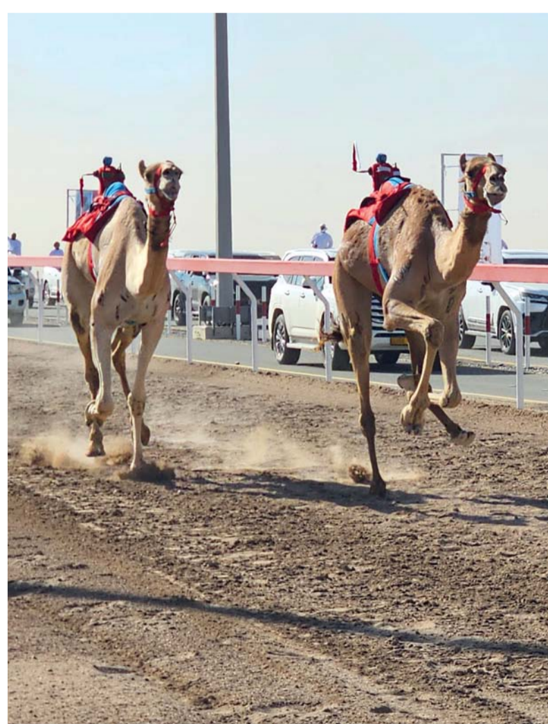
سمحة تعبر خط النهاية

الخاص لجلالة السلطان: الإبل منذ الحضارات الغابرة تجمع بين القبائل والشعوب، وتعد عند أهلها رمزا للتفاخر والاعتزاز، فهي من موروثهم وثقافتهم وهي من مصادر معيشتهم واستقرارهم، وهي ملهمة شعرائهم وأدبائهم ولازال ذلك الاهتمام متجذرا في معيشة وأدبيات الشعوب حكومات العربية أو افراد، فالحكومات العربية والخليجية بالأخص أعطت قطاع الإبل اهتماما واسعا وتولى ذلك في الحفاظ عليه كموروث وثقافة وفن، إضافة للمؤتمرات العلمية والندوات المتخصصة لدراسة أسرارها، علاوة على ما نراه من حضور كبير للمهرجانات والسباقات الموسمية التي تنظم على مستوى أبناء دول الخليج والتي تجمعهم للتنافس في إحياء أحد مفردات موروثهم الإبل وتشييع أبناء الخليج على التلاحم والتكاتف في الحفاظ على تراثهم وموروثهم، لذا رؤيتنا لهذا المهرجان أن يكون منارا لعلوم الابل وتراثها وأن يكون ميدانا للتنافس والتحدي الراقى وساحة لاستعراض المواهب في مختلف المجالات. والحمد لله نحن سعداء بما