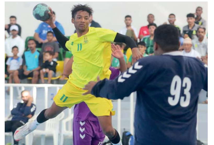
لاعب السيب في مواجهة حارس بديه

المسابقات بأن يتم ترتيب الاندية في المسابقات التي تتم بنظام خروج المغلوب «مباريات الكأس» وفقا لآتي: يحصل على المركز الاول الفريق الذي يفوز في جميع المباريات ويحصل على المركز الثاني الفريق الخاسر في المباراة النهائية وتقام مباراة بين الفريقين الخاسرين في الدور نصف النهائي لتحديد المركزين (الثالث والرابع) وفي حالة انتهاء المباراة بالتعادل خلال الوقت الاصلي للمباراة ولم يتم تحديد الفريق الفائز يطبق ما جاء في القاعدة (٢ - ٢) من قواعد اللعبة الدولية.