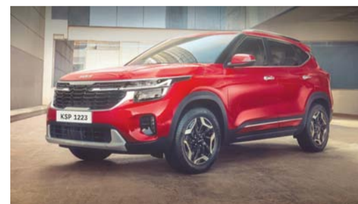
كيا سيلتوس خيار مثالي للرحلات

الطريق ويمكنهم الاختيار من بين الأوضاع العادية والاقتصادية والرياضية كما تم ضبط الوضع الاقتصادي لزيادة مدى السيارة إلى أقصى حد باستخدام تدابير توفير الوقود، بينما يزيد الرياضي من استجابات التوجيه والمحرك الكهربائي لتحقيق أقصى قدر من الشعور بالقيادة الديناميكية للسيارة يوفر الوضع العادي توازناً دقيقاً بين الاثنين. وتتمتع بتصميم داخلي مجهز بمجموعة من الميزات لتحقيق أقصى قدر من الراحة والاتصال وسهولة الاستخدام. وفيما يتعلق بالسلامة تشمل