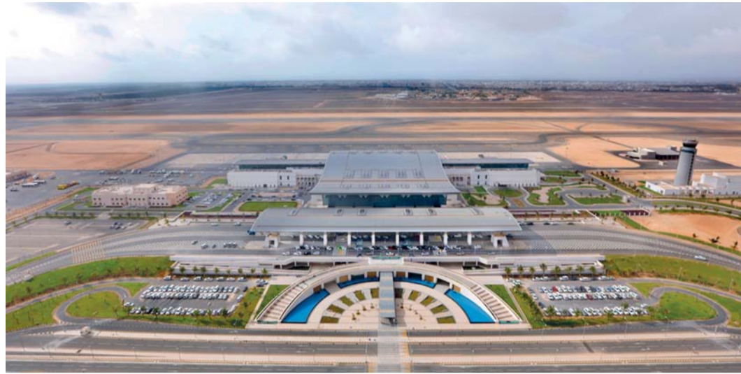
مبنى الشحن الجوي بمطار صلالة يستهل عام ٢٠٢٤ بإنجاز غير مسبوق

صلالة: أتت هذه الأرقام والنسبة العالية خلال الشهر الأول من العام الجاري ترجمة لتضافر هذه الجهود التي تقدمها مختلف الجهات مع الجهود التي تقوم بها وحدة العمليات التجارية في مطارات عمان، وذلك من أجل النهوض بقطاع الشحن الجوي في مطار صلالة عبر المبادرات التي تعنى بالترويج المبني للشحن الجوي وجذب وكلاء الشحن والمتعاملين في قطاع الشحن الجوي لاستخدامه كمنفذ جوي فعال للبضائع إلى الأسواق العالمية، بالإضافة إلى تقديم كل ما يلزم من دعم وتسهيلات لأصحاب الأعمال في السوق المحلي بمحافظة ظفار في الأنشطة المتعلقة بالشحن الجوي. الأمر الذي أسهم في الترويج المبني للشحن الجوي وكذلك الترويج لمطار صلالة كموقع استراتيجي فريد ومنفذ جوي حيوي يمتلك كافة الإمكانيات اللوجيستية للتعامل مع كافة أنواع الشحنات الجوية من وإلى سلطنة عمان. جدير بالذكر أن نجاح تدشين رحلة الربط البحري الجوي والتي تمت خلال شهر سبتمبر من العام الماضي أتت ثمارها وحققته أهدافها الاستراتيجية المنشودة بنجاح كونها أعطت دلالة واضحة لأسواق الشحن العالمية عن مدى تكامل النظام اللوجستي بين الموانئ والمطارات في سلطنة عمان.