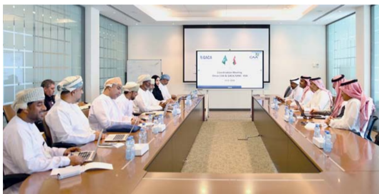
الجانبان العماني والسعودي أكدا على تفعيل الأمثل للمجالين الجويين

ووصل أقل سعر مقبول ٦٦٥ ٩٨ر لكل ١٠٠ ريال عماني، فيما بلغ متوسط سعر الخصم ٣٣٤١٣ر بالمائة، ومتوسط العائد ٤٠٦٠٢ر بالمائة. عقدت هيئة الطيران المدني بمسقط اجتماعا مع الهيئة العامة للطيران المدني بالملكة العربية السعودية؛ بهدف تفعيل العلاقات الثنائية بين البلدين، وتوثيق الصلات مع كافة الدول والمنظمات الإقليمية والدولية في مجال الطيران المدني. وتم خلال الاجتماع بحث واستعراض مجالات التعاون بين البلدين في مجال النقل الجوي، ومناقشة الفرص لزيادة حقوق النقل الجوي، كما تمت مناقشة التعاون في مجال الملاحة الجوية وسبل تفعيل الأمثل للمجالين الجويين العماني والسعودي لرفع كفاءتهما واستيعابهما بما يتوافق والنمو المطرد في الحركة الجوية إقليميا وعالميا.