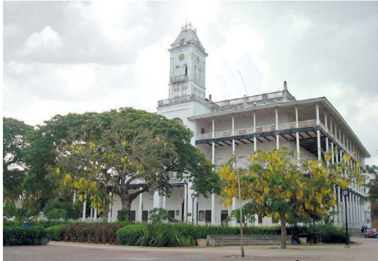
بيت العجائب يعد التهمة الأساسية للأفلام الثلاثة

وثقافية متصلة، وقد تم تصوير الأفلام في مواقع مختلفة حول العالم كزنجبار وعدد من الدول الأفريقية والآسيوية ومواقع في أوروبا وأميركا وسلطنة عمان.