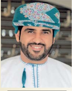
خالد بن خليفة السيابي شاعر عماني