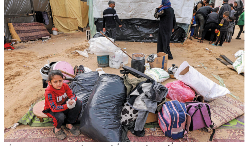
طفلة تجلس بجوار أمتعتها أسرتها المعبأة في أحد المخيمات استعداداً للفرار من رفح جنوب قطاع غزة.