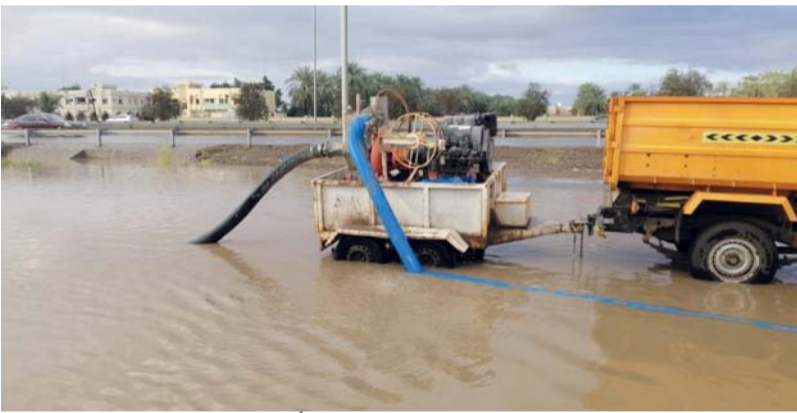
تنظيف وفتح الطرق بولاية نزوى