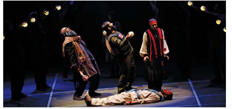
أحداث المسرحية تدور في قرية الهيل بولاية سمائل

شعر بحرقة تسري في داخله، تمنى لو يجد من يبوح له بألمه ووجعه، حتى أمه مشغولة عنه بالأفواه التي يحتفظ بها البيت، بالركض في حركة دائبة بين المطبخ والصالة التي يقضون فيها السواد الأعظم من وقتهم.