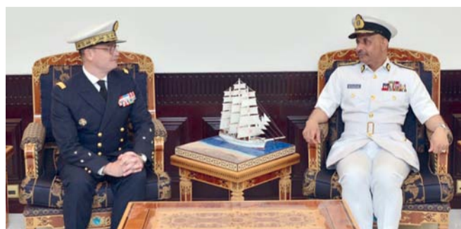
سيف الرحي أثناء استقباله إيمانويل سلازين

المشترك. عقب ذلك ألقى اللواء الركن بحري إيمانويل سلازين قائد القوات الفرنسية في المحيط الهندي محاضرة تطرق فيها إلى المسؤوليات والأدوار الإنسانية والعسكرية التي تضطلع بها القوات الفرنسية المشتركة في المحيط الهندي. حضر المحاضرة اللواء الركن بحري أمر كلية الدفاع الوطني، وهيئة التوجيه بكلية الدفاع الوطني، والمشاركين بدورة الدفاع الوطني الحادية عشرة، وعدد من كبار الضباط بقوات السلطان المسلحة والأجهزة العسكرية والأمنية الأخرى، والمحلق العسكري بالسفارة الفرنسية.