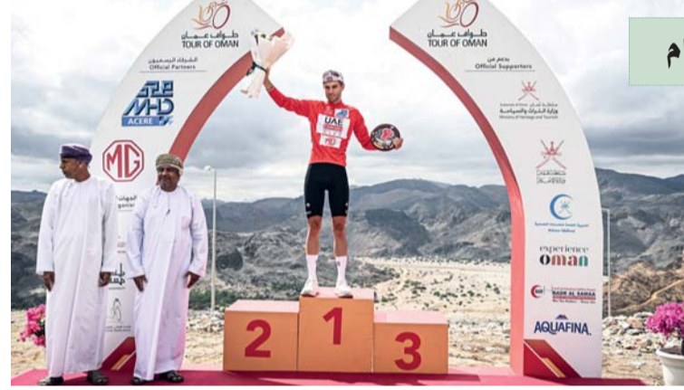
نتيجة الدراج البلجيكي أماوري كايو بلقب المرحلة الرابعة