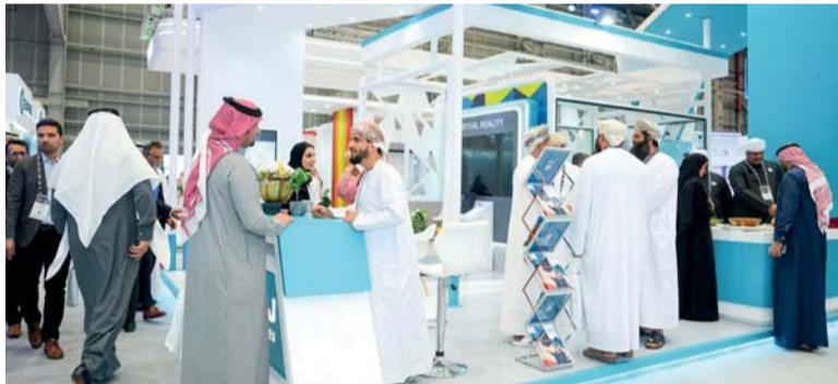
مشاركة «أبراج» في المؤتمر يساهم في التعريف بخدمايتها التنافسية في القطاع

كمشغل لأرامكو السعودية ودخولنا السوق السعودي خطوة استراتيجية هامة لأبراج، والتي من شأنها أن تعزز مكانتنا وميزتنا التنافسية في المنطقة. الجدير بالذكر أن أبراج انتهجت الابتكار في حلولها من خلال تبنيها لخدمات التكسير الهيدروليكي المتكاملة، وهي الأولى من نوعها في منطقة الشرق الأوسط وشمال إفريقيا كشركة محلية، بالإضافة إلى مشاركتها الفاعلة في البحث والتطوير من خلال تقديمها لعدد من أوراق العمل في مختلف المناسبات الإقليمية والعالمية التي تنظمها جمعية مهندسي البترول الدولية، وتعكس هذه الجهود الحثيثة التزام أبراج بتقديم حلول مستدامة ومبتكرة تلبي احتياجات العملاء وتطور الصناعة.