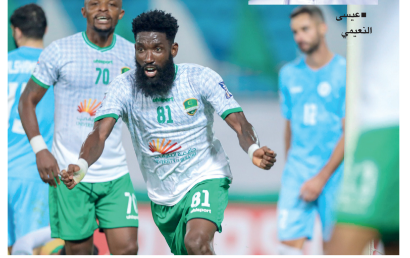
أنترس جي يحتفل بتسجيله هدف التعادل للنهضة في المباراة