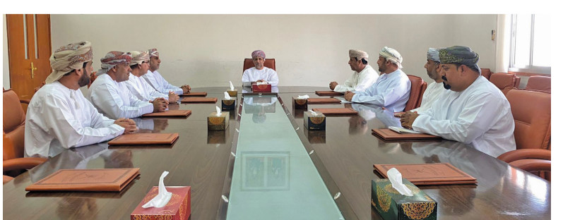
من اجتماع اللجنة الاستشارية بنادي ينقل

عقدت اللجنة الاستشارية لنادي ينقل بمكتب والي ينقل امس الاول اجتماعا برئاسة سعادة الشيخ علي بن محمد البوسعيدي والي ينقل رئيس اللجنة الاستشارية للنادي بحضور سعادة علي بن محمد العلوي ممثل ولاية ينقل في مجلس الشورى وممثل من ادارة الثقافة والرياضة والشباب ورئيس نادي ينقل والأعضاء، تم خلاله مناقشة عدد من المواضيع والتحديات التي تواجه النادي في مختلف الأنشطة والفعاليات الرياضية والثقافية والفنية، واستعراض البرامج والفعاليات التي نفذها النادي خلال