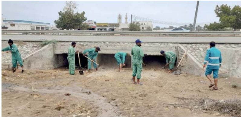
تنظيف مجاري الأودية في المصنعة

من جانب آخر باشرت بلدية البريمي ممثلة في دوائر البلدية بولايات المحافظة أعمالها الميدانية لفتح الطرق وإزالة الأتربة ومخلفات الأشجار وشفط التجمعات المائية. وقال الدكتور بدر بن سيف اليزيدي مدير دائرة البلدية بالبريمي إن بلدية البريمي استعدت للحالة الجوية من خلال تخصيص فرق عمل توزعت على مختلف المواقع في ولايات المحافظة للحد من الأضرار التي خلفتها الحالة الجوية، مؤكداً أن الفرق الميدانية بالبلدية تواصل عملها خلال فترتين صباحية ومسائية لفتح مختلف الطرق وتنظيفها لتسهيل الحركة المرورية أمام المركبات. يُذكر أن محافظة البريمي شهدت هطول أمطار متفاوت بين الغزيرة والمتوسطة مصحوبة بكميات كبيرة لحبات البرد سال على أثرها الأودية والشعاب أدى إلى تكوين تجمعات مائية وغلق عدد من الطرق الرئيسية والداخلية، ولا تزال الجهود مستمرة لفتح الطرق لضمان انسيابية الحركة المرورية.