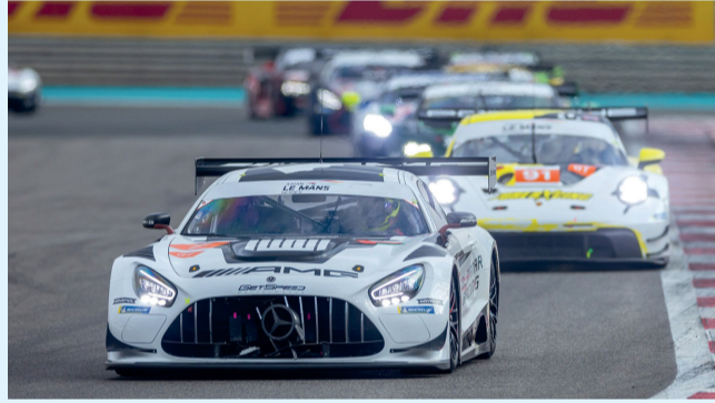
سيارة فريق المنار في سباق جولة أبو ظبي