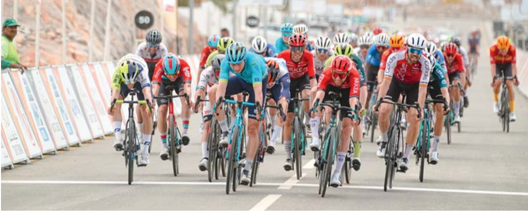
الدراجون خلال مشاركتهم في الجولة الرابعة للطواف