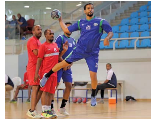
من مسابقة درع الوزارة الثالث عشر لكرة اليد