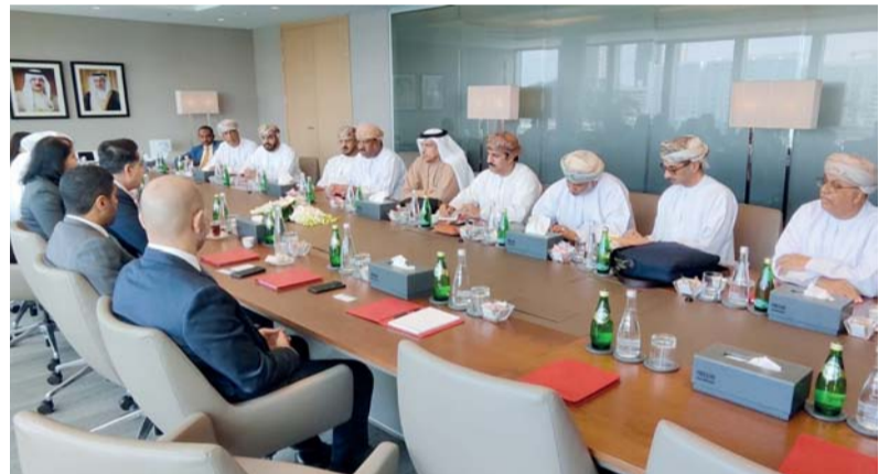
رجال الأعمال العمانيون ونظراؤهم البحرينيون يبحثون الفرص الاستثمارية الواعدة

في مملكة البحرين، حيث توفر حكومة البحرين كافة التسهيلات والامتيازات لاستقطاب رؤوس الأموال الخليجية والأجنبية من كافة أنحاء العالم وفي طبيعة هذه الامتيازات حرية تحويل رؤوس الأموال والأرباح علاوة على حرية تأسيس الشركات وعدم وجود ضرائب على الأرباح وكل هذه المزايا من شأنها الدفع بمزيد من الانفتاح الاقتصادي على مستوى