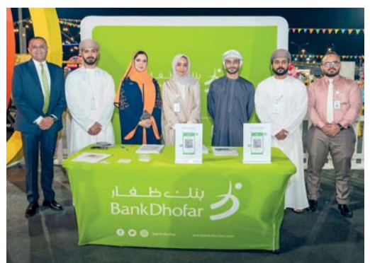
بنك ظفار يدعم المؤسسات الصغيرة والمتوسطة

المؤسسات الصغيرة والمتوسطة في تطوير وتنمية مؤسساتهم، حيث يعد هذا القطاع أحد أهم القطاعات التي نحرص على دعمها وتنميتها. وتأتي رعاية بنك ظفار لهذا الحدث ترجمة لرؤيته ودوره البارز كمساهم في تنمية الاقتصاد الوطني من خلال تقديم الدعم للمؤسسات الصغيرة والمتوسطة وإيجاد البيئة الملائمة لنمو هذا القطاع من خلال تبادل الخبرات.