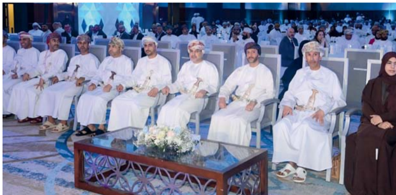
مؤتمر أوشرم يركز على تأثير الذكاء الاصطناعي على سوق العمل وأخلاقياته

نقاء الأعمال، وكيفية تحقيق الإسكانات الكاملة للثورة الرقمية. كما يتم خلال مؤتمر أوشرم السنوي في نسخته السابعة تقديم عددا من أوراق العمل والتي من بينها «الذكاء الاصطناعي ومستقبل العمل» و«مهارات التعامل مع الأشخاص الأساسية للمديرين المباشرين» و«وظائف المستقبل في عصر الذكاء الاصطناعي» و«ور الذكاء الاصطناعي في التجارة الدولية» وتأثير الذكاء الاصطناعي على