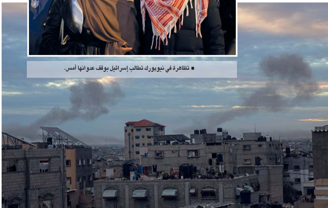
الدخان يتصاعد جراء القصف الإسرائيلي على رفح.