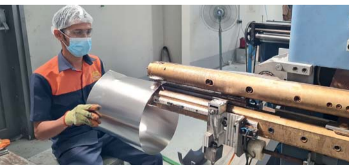
الندوة تناقش أحدث التوجهات والتحديات والفرص في مجال إعادة التدوير