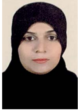
أمل المغبرية كاتبة عمانية

وشوف لك مكان ثاني؛ في ذلك اليوم شعر بوابر حرقة أخذت تغزو جسده، اشتعلت النار في أجزاء كثيرة من بطنه، تفاقمت الحرارة ووصلت إلى صدره، حاول النوم كعادته بعد كل صراع، فشل في تخفيف تلك الحرارة التي انبثقت بشكل واسع ومؤلم، هرب النوم وأصبح يتقلب على فراشه محاولاً إخماد النار التي استعرت دون توقف.