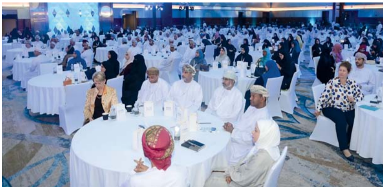
استعراض مستجدات قطاع الموارد البشرية والتجارب المعتمدة والحلول المبتكرة