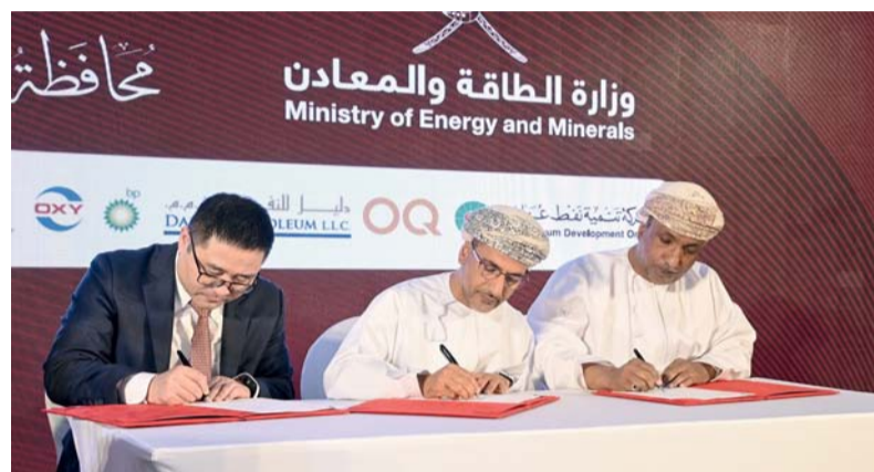
الاتفاقيات تساهم في تحقيق أهداف التنمية المستدامة وتمويل المشاريع ذات الأولوية الوطنية

شملت الاتفاقيات مشروع حديقة عبري العامة الذي يمثل شراء الأجهزة التفاعلية للمدارس ومشروع تمويل توفير طابعات ثلاثية الأبعاد مساجد ماجد بن سعيد البحري وكيل وزارة التربية والتعليم للشؤون الإدارية والمالية، ووقع عن مشروع مركز الابتكار والثقافة عبري سعادة الشيخ الدكتور سعيد بن حميد الحارثي والي عبري، كما تم توقيع اتفاقية إنارة ٦ تقاطعات طرق في ولايتي شليم وجزر الحلانبات وثمرت، وقعا حسين بن علي الشنغري مدير عام المديرية العامة للشؤون الإدارية والمالية ببلدية ظفار، كما وقعت عن مشروع تجهيز مركز التميز في طب الأطفال التطوري في مستشفى جامعة السلطان قابوس المؤسسة الوطنية لدعم