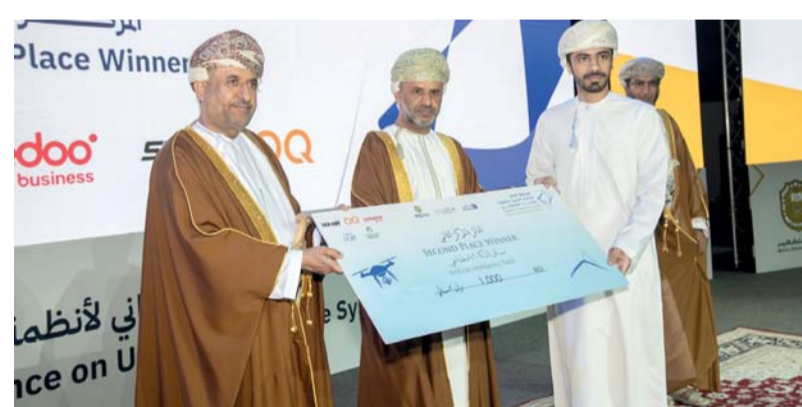
الأمين العام بوزارة الدفاع يسلم الجائزة لأحد الفائزين