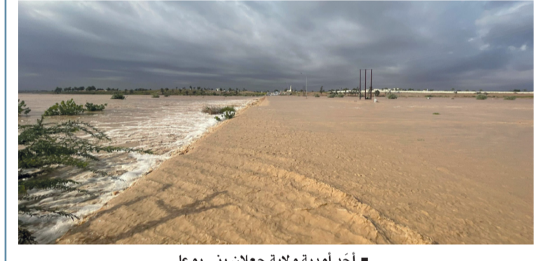
أحد أودية ولاية جعلان بني بو علي

متفاوتة الغزارة بشكل متفرق على محافظتي جنوب وشمال الشرقية، والأجزاء الساحلية من محافظات شمال وجنوب الباطنة ومسقط، وأمطار متفرقة على أجزاء من محافظتي الوسطى وظفار، وتواصل جريان عدد من الأودية. ■ تفاصيل ..... ص ٣