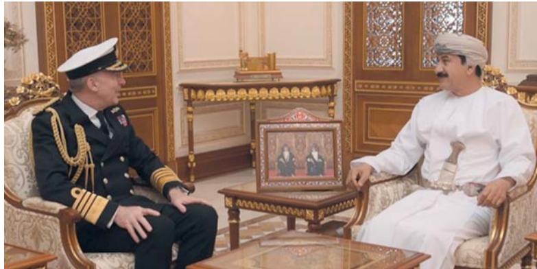
سلطان العُماني أثناء استقباله توني راداكين

قوات السلطان المسلحة بالضيف، وتم خلال المقابلة تبادل وجهات النظر، وبحث عدد من الموضوعات العسكرية ذات الاهتمام المشترك. حضر المقابلة عدد من كبار الضباط برئاسة أركان قوات السلطان المسلحة، وسعادة سفيرة المملكة المتحدة المعتمدة لدى سلطنة عُمان.