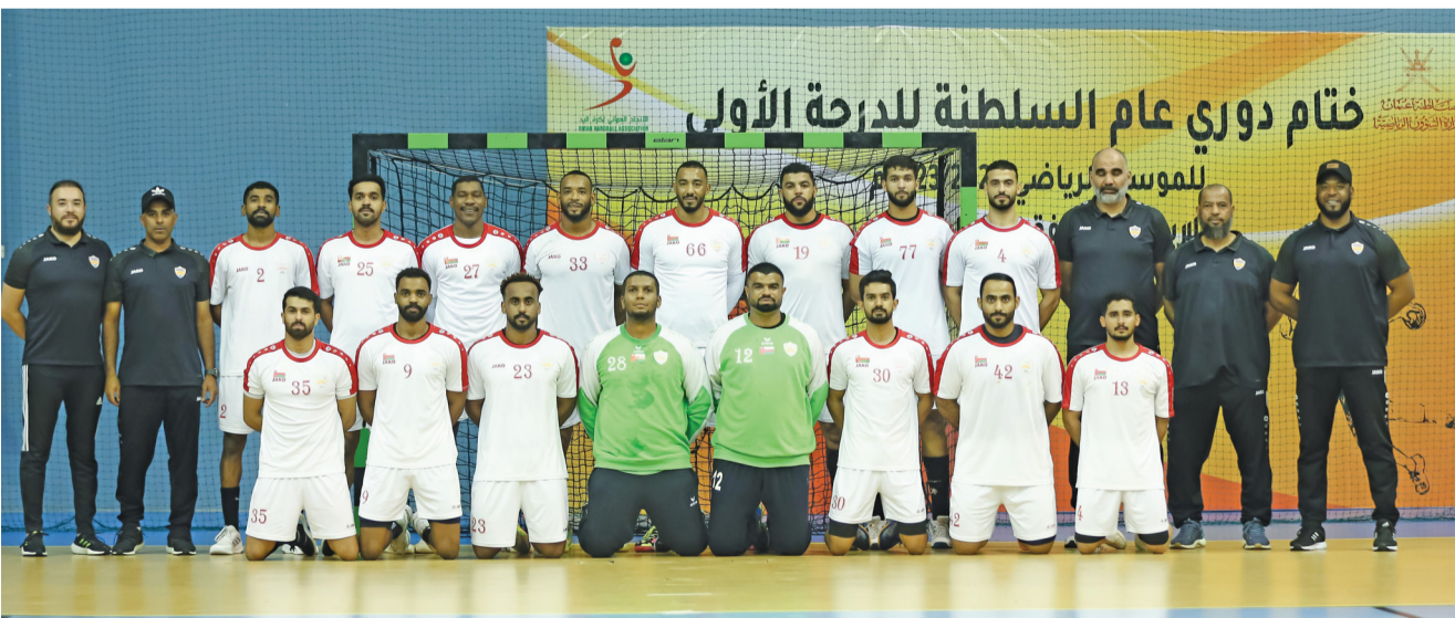
فريق نادي عمان لكرة اليد