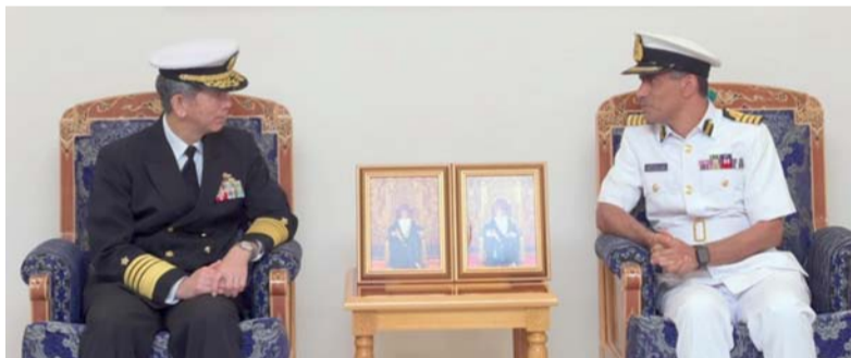
.. ويستقبله جاسم البلوشي

البحرية السلطانية العُماني بمكتبه بمعسكر المرتفعة الفريق أول بحري ريو ساكاي رئيس أركان قوات الدفاع الذاتي للبحرية اليابانية والوفد المرافق له. ولدى وصول الضيف مقرر قيادة البحرية السلطانية العُماني بمعسكر المرتفعة أجريت له مراسم استقبال رسمية، وأدت ثلة من حرس الشرف الحية العسكرية وعزفت مجموعة من فرقة موسيقى البحرية السلطانية العُماني سلام الشرف، ثم استعرض الفريق أول بحري حرس الشرف. وقد رحب اللواء الركن بحري قائد البحرية السلطانية العُماني بالضيف، وتم خلال المقابلة تبادل الأحاديث الودية، وبحث وجهات النظر حول عدد من الموضوعات، ومناقشة مجالات التعاون البحري بين الجانبين.