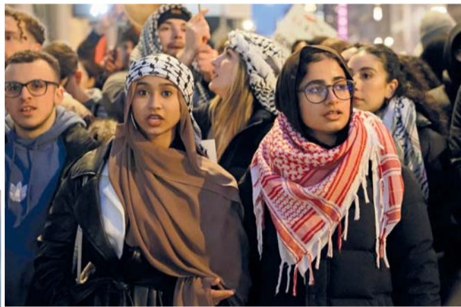
تظاهرة في نيويورك تطالب إسرائيل بوقف عدوانها أمس.

وأفادت مصادر صحية باستشهاد ٥ وإصابة آخرين جراء قصف الطيران الحربي الإسرائيلي منزلاً لعائلة قذوحة في مخيم النصيرات وسط قطاع غزة.