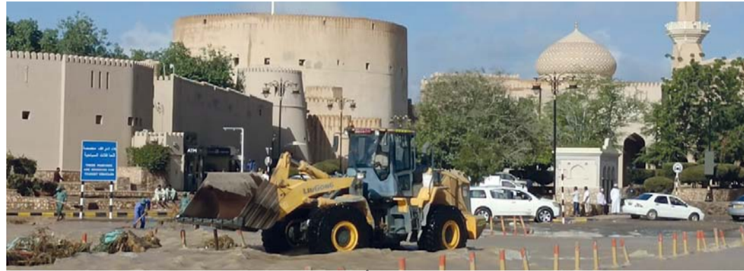
تنظيف وفتح الطرق بولاية نزوى