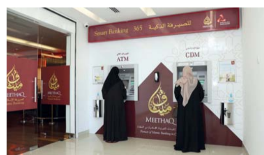
ميثاق مستمراً في إطلاق منتجات تلبي احتياجات الزبائن

الحياة في حال احتفظ الزبون بمتوسط رصيد قدره ٣٠ ألف ريال عماني أو أكثر، كما لا توجد رسوم في حال انخفاض الرصيد دون الحد الأدنى ويبلغ الحد اليومي الأقصى للسحب النقدي للأفراد ٦٠٠ ريال عماني من أجهزة الصرف الآلي. بالإضافة إلى ذلك، يمكن للزبائن إدارة الحساب أينما كانوا مع خدمة مصرفية إلكترونية مجانية على مدار الساعة بما في ذلك الخدمات المصرفية على الإنترنت وأجهزة الصرف الآلي والإيداع النقدي، والاستماع بمرونة عند التسوق عبر ملايين المنافذ المعتمدة من قبل فيزا وجميع أنحاء العالم، وخدمة