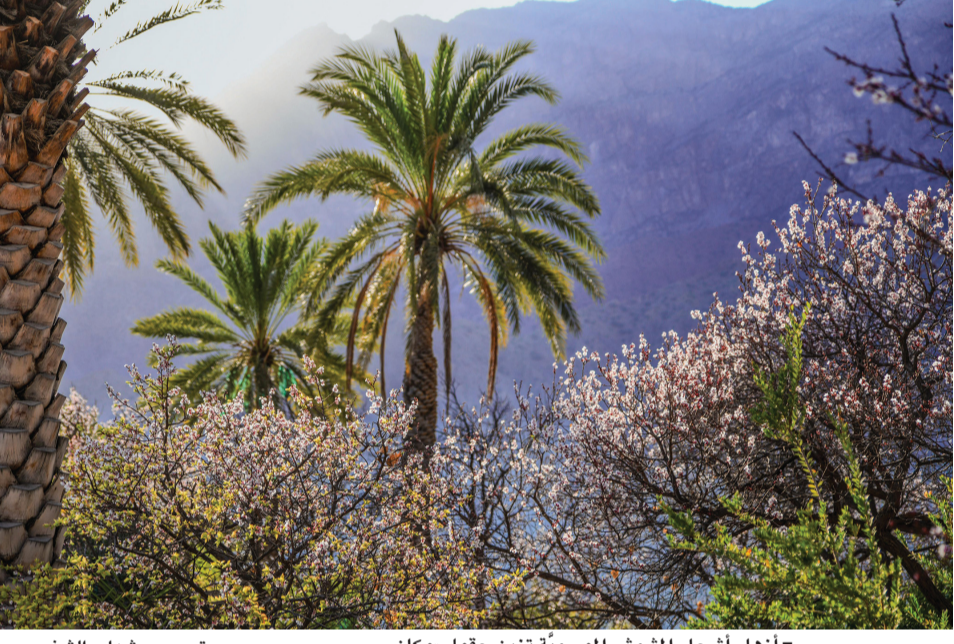
أزهار أشجار المشمش الموسمية تزين حقول «وكان»

«وكان» تتجمل بزهور المشمش كتب: سعيد بن علي الغافري: تتجمل قرية وكان بوادي مستل بولاية نخل هذه الأيام في موسم تزهير أشجار فاكهة المشمش التي تشتهر بها، وجمال طقسها بجانب محاصيل الخوخ والعنب والرمان والكرز والبوت والزعر والجبلي، حيث تجد هذه المزروعات العناية والاهتمام من الأهالي كمصدر غذائي وتسويقي وفير. وتعد قرية وكان من المزارات السياحية الجميلة لموقعها الجغرافي الفريد والذي يجمع بين الطابع الجبلي والسهلي والتنوع الزراعي الخصيب بمدرجاته الزراعية، والمزارات الأثرية التي تغد إليها الأفواج السياحية من جميع أنحاء دول العالم؛ لما تتميز به من تناعم وتنوع في طبيعتها الغناء.