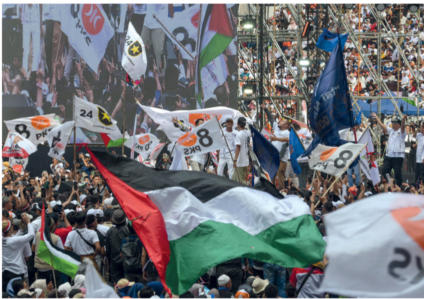
اندونيسيون يلوحون بالعلم الفلسطيني، حيث يحضر عشرات الآلاف تجمعًا انتخابيًا في استاد جاكارتا الدولي