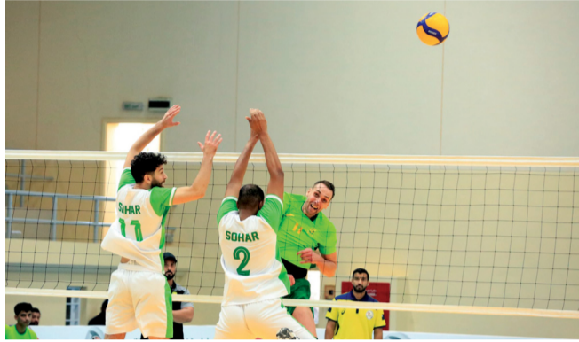
■ من لقاء السيب وصحار

بالوفود المشاركة وعرض بعض الفقرات، وسبق ذلك تبادل الدروع والهدايا التذكارية مساء أمس الأول بين اللجنة المنظمة ورؤساء الوفود المشاركة بحضور سعادة محمد بن سليمان الكندي محافظ شمال الباطنة وداؤد بن سليمان الشيزاوي رئيس نادي صحار.