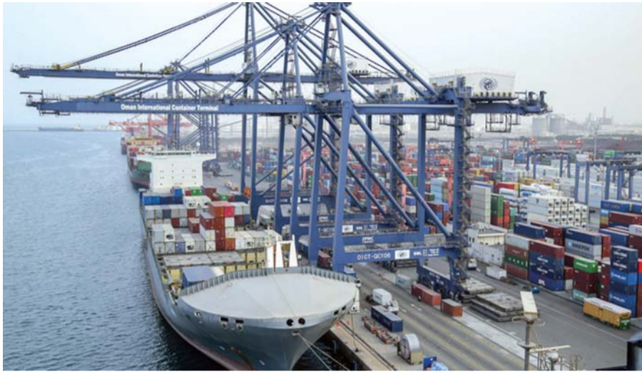
■ قيمة الصادرات السلعية بنهاية نوفمبر الماضي سجلت ٢٠ ملياراً و٦٣٦ مليون ريال عُمانى

بشكل رئيسي إلى تراجع قيمة صادرات سلطنة عُمان من النفط والغاز إلى ١٢ ملياراً و٥٢٥ مليون ريال عُمانى وبنسبة ١٧,٧ بالمائة عن نهاية نوفمبر ٢٠٢٢ والتي بلغت ١٥ ملياراً و٢١٥ مليون ريال عُمانى. في الجانب الأخرى بلغت قيمة صادرات سلطنة عُمان من النفط الخام ٨,٩ مليار ريال عُمانى بنهاية نوفمبر الماضي، مسجلة انخفاضاً بنسبة ١٧,٣ بالمائة عن الفترة ذاتها من العام السابق، وتراجعت قيمة صادرات النفط المصفى إلى ١,٣ مليار ريال عُمانى وبنسبة ٢٣,٥ بالمائة، كما انخفضت قيمة صادرات سلطنة عُمان من الغاز الطبيعي المسال إلى ٢,٣ مليار ريال عُمانى وبنسبة ١٥,٧ بالمائة، مقارنة بنهاية نوفمبر ٢٠٢٢، والتي بلغت ٢,٧ مليار ريال عُمانى. وتكثفت الإحصاءات تراجع قيمة الصادرات السلعية غير النفطية بنسبة ١,٤ بالمائة بنهاية نوفمبر الماضي، لتبلغ ٦ مليارات و٧٦٧ مليون ريال عُمانى، مقارنة بنهاية