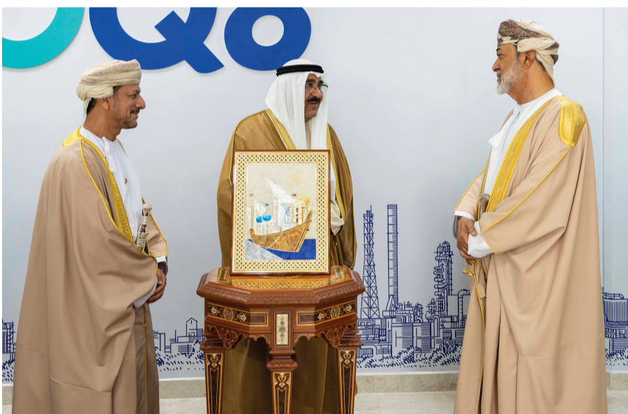
أمير الكويت يتقبّل هدية تذكارية من إدارة شركة مصفاة الدقم والصناعات البتروكيماوية

عقب ذلك، تفضل صاحب السمو الشيخ مشعل الأحمد الجابر الصباح أمير دولة الكويت بتدوين كلمة في السجل (الإرث) الخاص بكبار الزوار، ثمّن فيها لحضرة صاحب الجلالة السلطان هيثم بن طارق المعظم والحكومة والشعب العُماني هذا التعاون الذي يترجم الشراكة الكويتية العُمانية لا سيما في الاستثمار في الصناعات البتروكيماوية ويبلور الرؤى الحالية والمستقبلية المشتركة، مُعرباً سموه عن تطلعه إلى المزيد من التعاون الهادف إلى ترسيخ العلاقات الوطيدة التي تجمع البلدين الشقيقين وتحقق مصالحهما لما فيه خير شعبيهما الكريمين. وفي ختام حفل الافتتاح، التقت صورة تذكارية ضمّت جلالته السلطان المعظم وأخاه سمو الضيف الكريم ومجموعة من كوادر شركة مصفاة الدقم والصناعات البتروكيماوية.