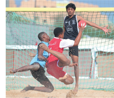
■ من مباراة مصيرة والمصنعة

شارك في دوري كرة اليد الشاطئية ١٣ ناديا في المرحلة الأولى تأهل منها ٨ أندية الى الدور الثاني وزعت على مجموعتين الاولى ضمت أندية السيب ومصيرة وعبري والسلام والمجموعة الثانية أندية مسقط والاتحاد وصحم والمصنعة ولعب مباريات الدور الثاني بنظام الدوري من مرحلة واحدة تأهل من المجموعة الأولى ناديا السيب ومصيرة ومن المجموعة الثانية مسقط والمصنعة وكانت مباريات هذا الدور أسفرت عن فوز السيب على السلام ٢/٠ وصفر وتفوق صحم على الاتحاد ٢/٠ وصفر ومصيرة على عبري ٢/٠ وصفر ومسقط على المصنعة ٢/٠ وفوز مصيرة على السيب ٢/٠ وصفر ومسقط على الاتحاد صحم ١/٢ وفوز مصيرة على السلام ٢/٠ وصفر والسيب على عبري ٢/٠ وصفر ومسقط على صحم ٢/٠ والمصنعة على الاتحاد ١/٢. ورصد الاتحاد العماني لكرة اليد جوائز ومكافآت للأندية الحاصلة على المراكز الثلاثة الأولى، حيث يمنح