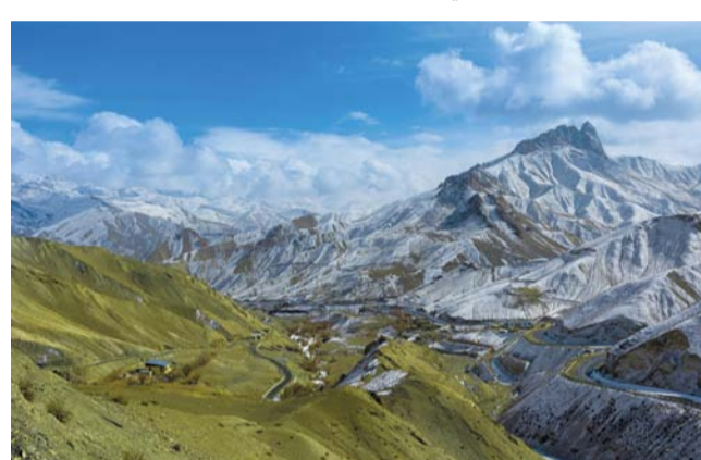
■ بعدسة تركي الجنيبي