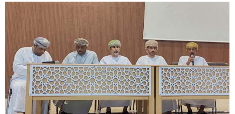
■ تصوير: خليفة بن سالم الغافري

يذكر أن فرقة الدن للثقافة والفن قد أطلقت مهرجانها الأول عام ٢٠١٥ كنسخة محلية، أما النسخة الثانية فكانت في عام ٢٠١٦ على المستوى العربي، وفي العام ٢٠١٨ انطلق المهرجان بنسخته الثالثة عربياً تحت شعار «التسامح والسلام»، وفي العام الماضي ٢٠٢٣ انطلق المهرجان لأول مرة بنسخة دولية تحت شعار «أهلاً بالعالم في سلطنة عمان»، وستتناول الجلسة الحوارية «مقهى المسرح» تجربة فرقة الدن وتطلعاتها المستقبلية المتعلقة في استمرارية المهرجان وأبرز التحديات التي تواجهها. ■■