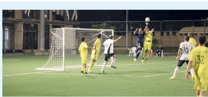
■ من مباريات البطولة السادسة لوحدة ديوان البلاط السلطاني لكرة القدم