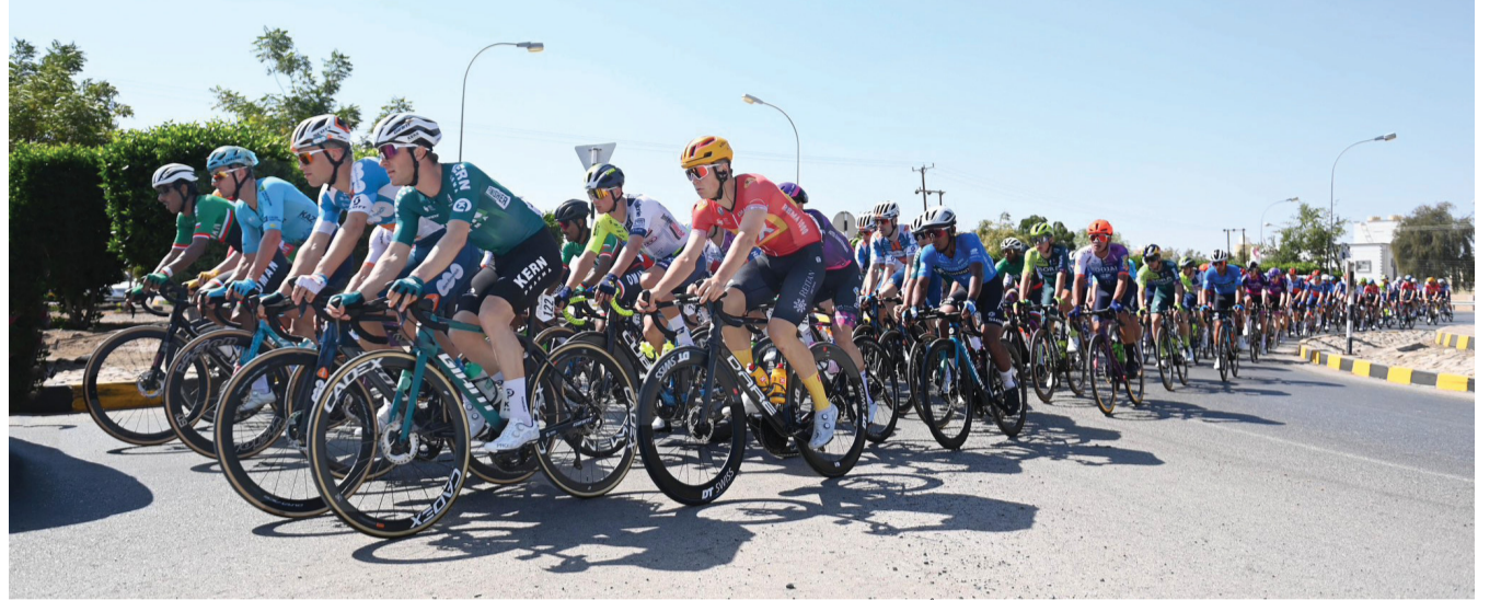
تألق كبير الدراجين في مراحل اليوم الأول من الطواف

١٣ من فبراير الحالي من خلال ٥ مراحل بمشاركة (١٧) فريقاً يمثلون (١١٩) دراجاً بينهم (٦١) دراجاً يشاركون للمرة الأولى في الطواف، فيما يعد الطواف فرصة جيدة لتعريف العالم بالمقومات الطبيعية والتاريخية والثقافية التي تزخر بها سلطنة عُمان.