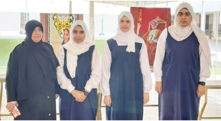
■ الفريق الطلابي الفائز من تعليمية شمال الباطنة

معلومات متعلقة باللغة العربية، حيث صممت جميع اللوحات في المعرض عن طريق برامج التصميم مثل Photoshop و Picasart، واستخدام chatgpt في البحث عن معلومات خاصة باللغة العربية كتاريخها ومصطلحاتها، إضافة إلى التعليق الصوتي بتصميم فيديو باستخدام الذكاء الاصطناعي بالاستعانة بموقع heygen. الجدير بالذكر أن المسابقة لاقت إقبالا واسعا من المشاركين، وقد سعت لجان التحكيم إلى عقد مقابلات مباشرة مع الطلبة المشاركين تضمنت عرض مشروعاتهم الطلابية، ومناقشتها لاختيار الفائزة منها على مستوى الوطن العربي، هذا وسيتم تنظيم الحفل الختامي بجمهورية مصر العربية في السابع عشر من فبراير الجاري. ■■