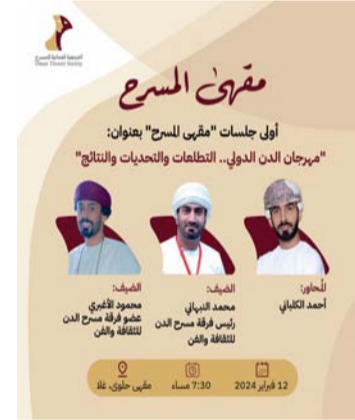
■ ملصق المهرجان