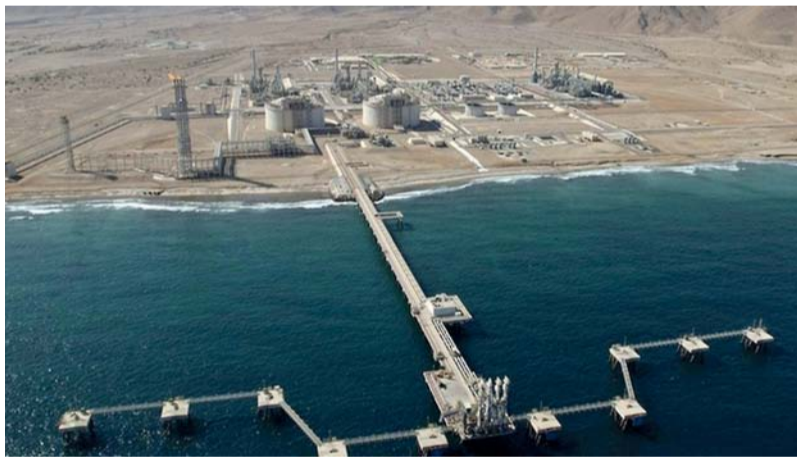
٣٠٦ بالمائة ارتفاعاً بإجمالي الإنتاج المحلي والاستيراد من الغاز الطبيعي

مسقط . العمانية: بلغ إجمالي الإنتاج المحلي والاستيراد من الغاز الطبيعي بسلطنة عُمان حتى نهاية ديسمبر الماضي نحو ٥٣ ملياراً و ٩٢٥ مليون متر مكعب بارتفاع نسبته ٣,٦ بالمائة مقارنة بنفس الفترة من عام ٢٠٢٢م والذي بلغ ٥٢ ملياراً و ٦١١ مليوناً و ٩٠٠ ألف متر مكعب. وبيّنت الإحصاءات الصادرة عن المركز الوطني للإحصاء والمعلومات أنّ المشاريع الصناعية استحوذت على ما نسبته ٥٨,٧ بالمائة من استخدامات الغاز الطبيعي بسلطنة عُمان حتى نهاية شهر ديسمبر الماضي حيث بلغت الاستخدامات للمشاريع الصناعية ٣١ ملياراً و ٦٣٨ مليوناً و ٦٠٠ ألف متر مكعب. وبلغ إجمالي استخدام الغاز الطبيعي لكل من: حقول النفط ١٣ ملياراً و ٢٥٢ مليوناً و ٨٠٠ ألف متر مكعب، ومحطات توليد الطاقة ٨ مليارات و ٧٧٣ مليوناً و ٨٠٠ ألف متر مكعب، والمناطق الصناعية ٢٥٩ مليوناً و ٧٠٠ ألف متر مكعب. يذكر أنّ الإنتاج غير المصاحب للغاز الطبيعي -شاملاً الاستيراد- بلغ ٤٢ ملياراً و ٩٤٢ مليون متر مكعب، فيما بلغ الإنتاج المصاحب ١٠ مليارات و ٩٨٣ مليون متر مكعب.