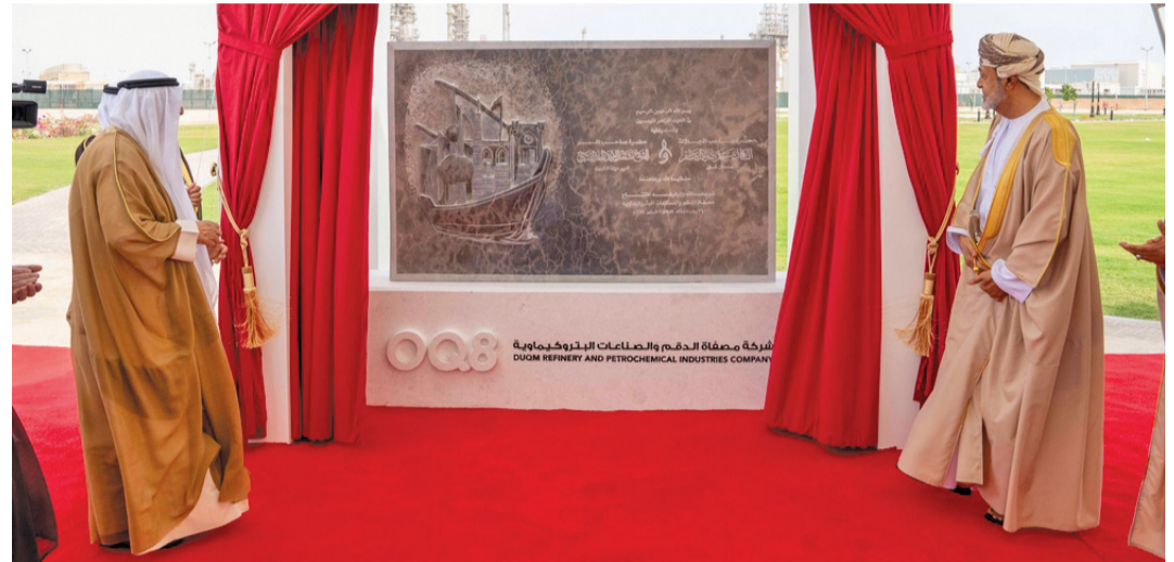
جلالة السلطان وأمير الكويت لدى افتتاح مصفاة الدقم والصناعات البتروكيماوية

هدية تذكارية مقدمة من إدارة شركة مصفاة الدقم والصناعات البتروكيماوية.