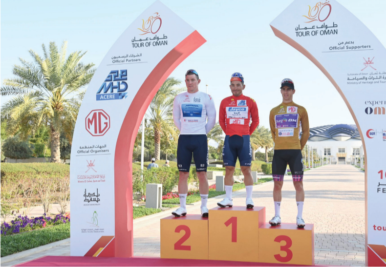
تتويج الدراجين الفائزين بالمرحلة الأولى