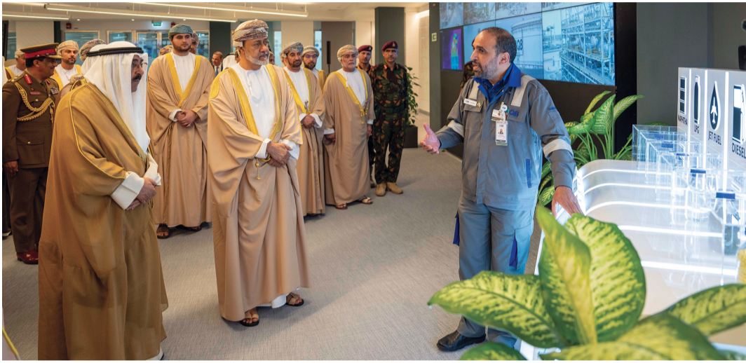
جلالته وأمير الكويت يطلعان على عمليات المصفاة المختلفة