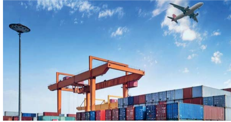
تبني تقنيات الذكاء الاصطناعي لرفع إسهام قطاع الصناعة في الناتج المحلي الإجمالي

ما يعادل مليارين و ٤٥٤ مليون ريال عماني بالأسعار الثابتة. كما بلغ عدد العاملين العمانيين في القطاع والمؤمن عليهم أكثر من ٣٣ ألف عامل، فيما بلغت الاستثمارات الأجنبية المباشرة في القطاع الصناعي أكثر من مليار و ٤٠٠ مليون ريال عماني. وأضاف سعادته أنه أصبح من الضروري على القطاع الصناعي العماني تبني التقنيات الحديثة لتعزيز كفاءته وتنوع منتجاته ورفع جودتها، وتحسين الاستدامة البيئية والاقتصادية، وذلك مع تسارع التحول العالمي نحو الثورة الصناعية الرابعة.