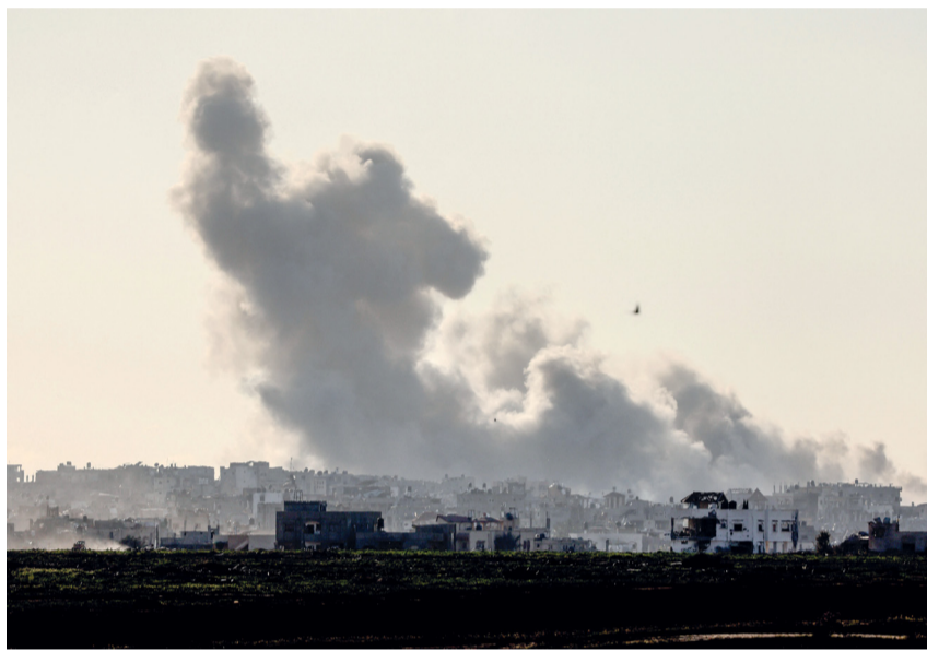
الدخان يتصاعد فوق المباني المدمرة في قطاع غزة، وسط المعارك المستمرة.