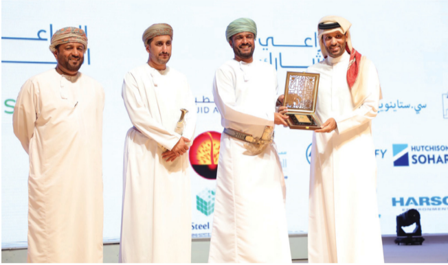
■ أثناء تبادل الدروع والهدايا التذكارية