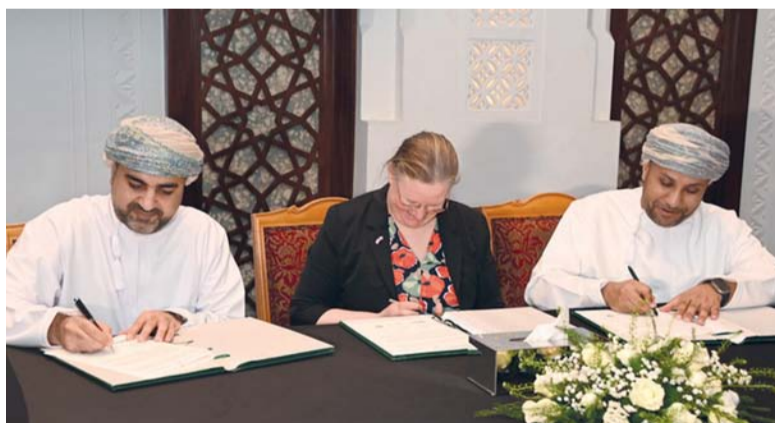
صندوق نمو الأعمال العُماني يهدف إلى دعم تطوير مسار القطاع المالي

■ شهد الأسبوع الماضي العديد من الأحداث الاقتصادية والتي كان أبرزها، توقيع البرنامج الوطني للاستدامة المالية وتطوير القطاع المالي «استدامة» بالشراكة مع سفارة المملكة المتحدة مذكرة تعاون لدراسة فكرة تأسيس صندوق نمو الأعمال العُماني مع عدد من البنوك التجارية العاملة في سلطنة عُمان. ■