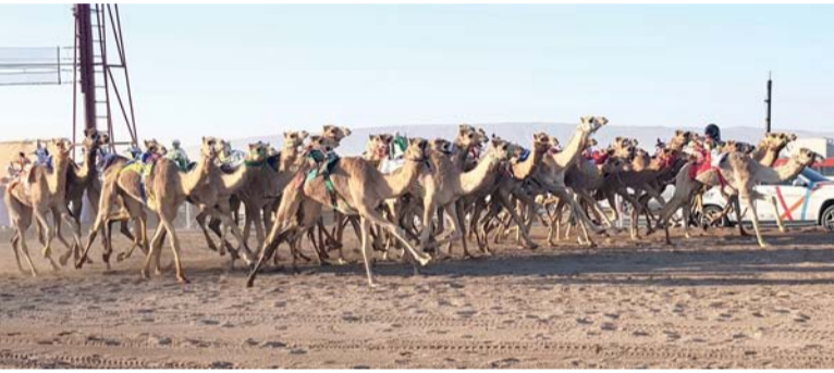
صورة أرشيفية من مهرجان البشائر السنوي

تنطلق غدا الاثنين بميدان البشائر بولاية آدم منافسات النسخة السابعة من مهرجان البشائر السنوي لسباقات الهجن العربية الذي ينظمه مكتب نائب رئيس الوزراء لشؤون العلاقات والتعاون الدولي والممثل الخاص لجلالة السلطان بمشاركة كبيرة من ملاك ومضرمي الهجن من سلطنة عُمان ودول مجلس التعاون لدول الخليج العربية.