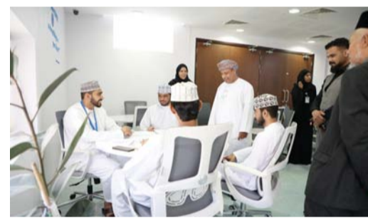
صحار. من إبراهيم الفارسي:

تقديم الدعم الشامل للطلبة لتحقيق التفوق الدراسي