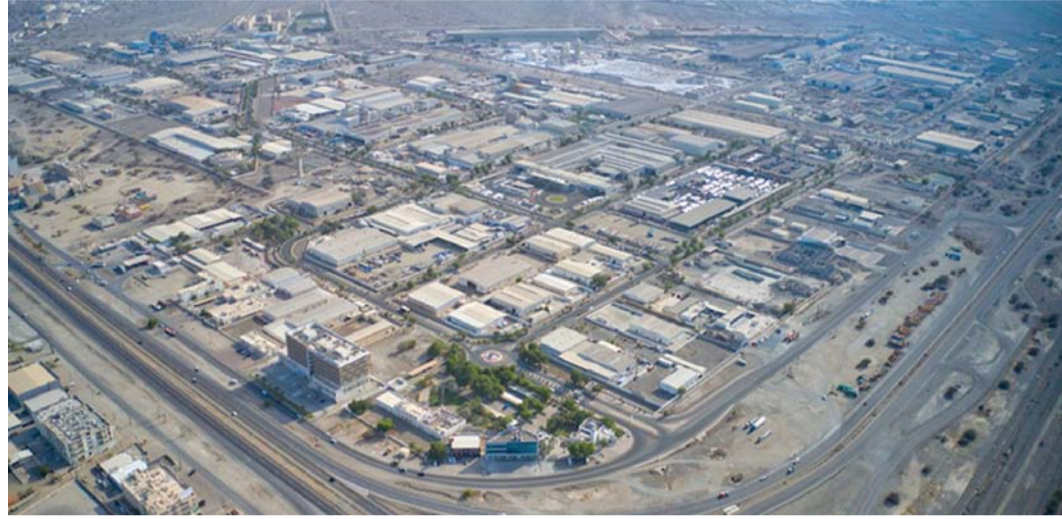
مشروع مجمعات مدائن الريادية أحدث مبادرات القيمة المضافة التي تقدمها «مدائن»

من ٥٥ ألف خدمة متنوعة في أوقات قياسية بلغ متوسط المدة في إحدى المدن ٣ دقائق، ويعمل المختصون في مدائن حاليا على تطوير نظام تقاعلي جديد لتلقي البلاغات وسرعة التجاوب معها بما يتماشى مع التقنيات الحديثة.