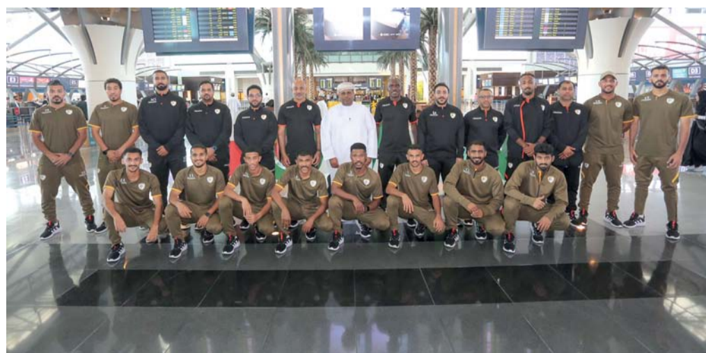
بعثة منتخبنا الوطني لكرة القدم الشاطئية المغادرة إلى دبي

غادرت يوم أمس بعثة منتخبنا الوطني لكرة القدم الشاطئية متوجهة إلى إمارة دبي بدولة الإمارات العربية المتحدة للمشاركة في كأس العالم التي ستقام في دولة الإمارات العربية المتحدة خلال الفترة من ١٥ إلى ٢٥ فبراير الجاري، حيث تعد هذه