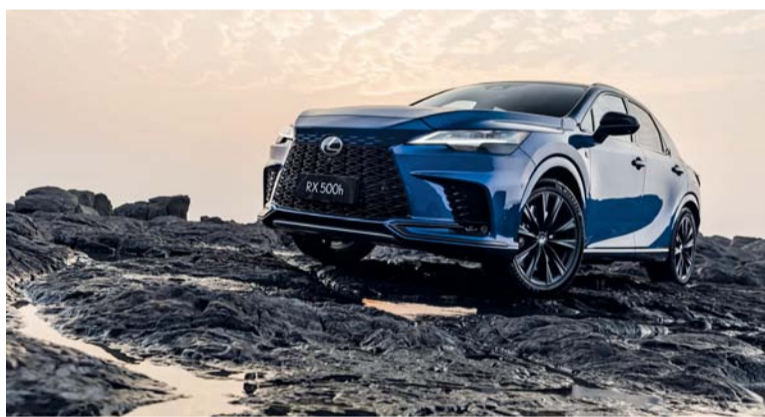
لكزس إي إس هايبرد قوة في الطرق الوعرة

وقال في تصريح وكالة الأنباء العُمانية أن عدد المشاريع الموطنة بلغ ٢٠٦٣ مشروعاً في مختلف مراحلها (القائم، تحت الإنشاء، والذي خصصت له الأرض)، حيث يعمل في هذه المشاريع ٥٥٢٤٢ عاملاً، تشكل الكوادر الوطنية منهم ٣٨ بالمائة بينما