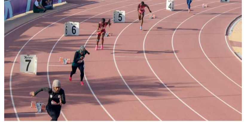
سباقات السرعة في البطولة

ارتفعت حصيلة لاعبات سلطنة عمان من الميداليات الملونة في البطولة العربية السابعة للسيدات والتي تنظمها إمارة الشارقة بدولة الإمارات العربية المتحدة للفترة من ٢ وحتى ١٢ فبراير الحالي لتصل إلى ١١ ميداليات حتى الآن، وكانت البعثة الرياضية المشاركة والتي تترأسها سعادة الإسماعيلية قد أحرزت ذهبيتين فضيتين وبرونزية في المبارزة وفي الرماية برونزيتين في الفردي والفرق وفضية على المستوى العام للفرق