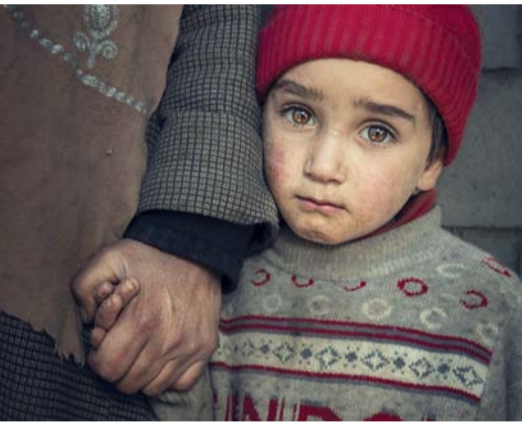
■ بعدسة سلطان العامري