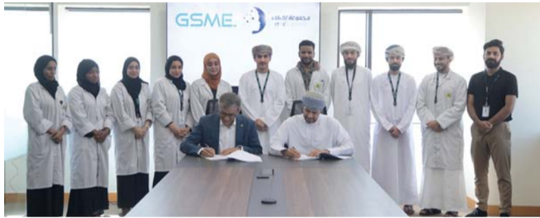
■ الاتفاقية تسهم في تعزيز دور المجموعة في التقدم التكنولوجي