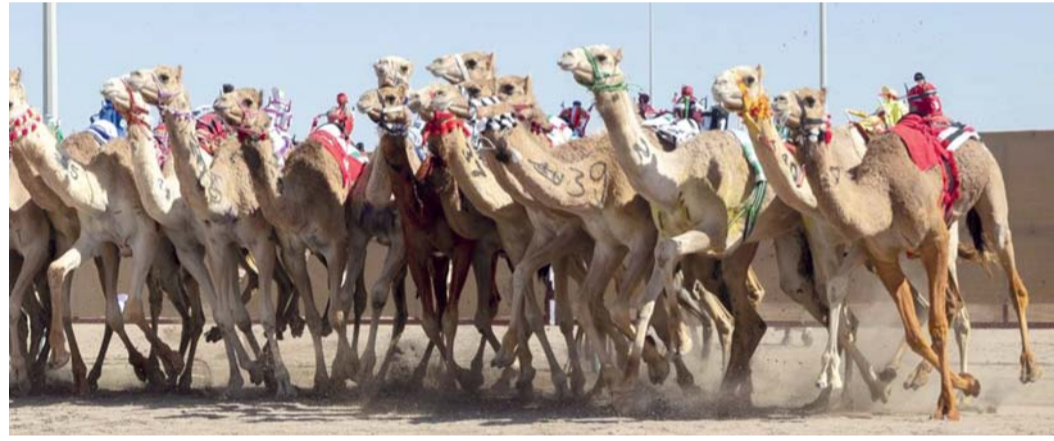
صورة أرشيفية من مهرجان البشائر السنوي لسباقات الهجن العربية

تنطلق يوم الإثنين القادم منافسات مهرجان البشائر السنوي لسباقات الهجن العربية في دورته السابعة في ميدان البشائر لسباقات الهجن بولاية أم بمحافظه الداخلية، بمشاركة ملاك الهجن في سلطنة عمان ودول مجلس التعاون لدول الخليج العربية، ويستمر ٦ أيام. وأكد صاحب السمو السيد أسعد بن طارق آل سعيد نائب رئيس الوزراء لشؤون العلاقات والتعاون الدولي، والممثل الخاص لجلالة السلطان أن مهرجان البشائر السنوي لسباقات الهجن العربية يعد من أبرز المهرجانات في عالم سباقات الهجن في سلطنة عمان ودول مجلس التعاون لدول الخليج العربية والذي يحظى بدعم حكومة صاحب الجلالة السلطان هيثم بن طارق المعظم - حفظه الله ورعاه.