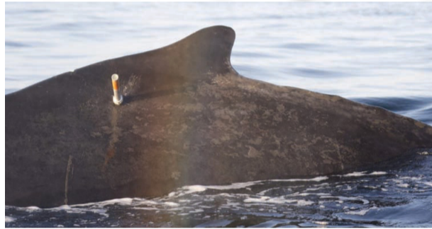
■ الاهتمام بالأحياء البحرية بهدف المحافظة عليها من الانقراض

بهيئة البيئة، أن الهيئة تولى الأحياء والتدييات البحرية اهتماماً كبيراً؛ بهدف المحافظة عليها من الانقراض، ومنها حوت بحر العرب الأحدب.