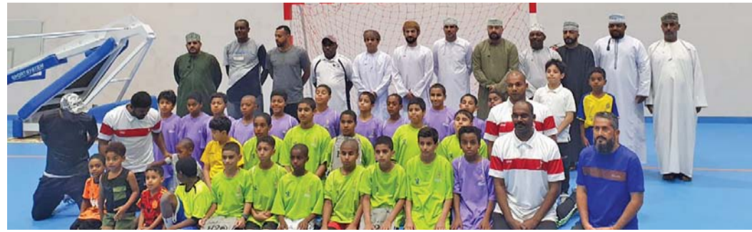
صورة جماعية للاعبين مركز نادي الشباب