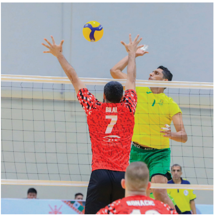
■ من مباراة الريان والسيب