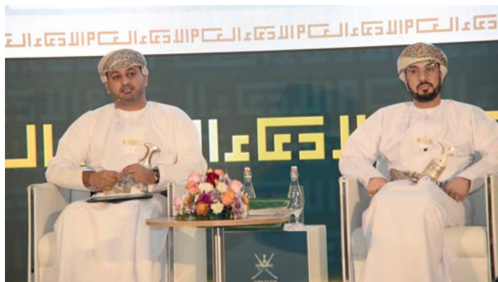
■ المؤتمر استعرض عدداً من المؤشرات المتعلقة بمختلف القضايا

ووضَّح أنه عند مقارنة إجمالي عدد القضايا لكل محافظة بين عامي (٢٠٢٢-٢٠٢٣) نجد أن أبرز الارتفاعات ظهرت في محافظة الظاهرة بنسبة (٥٦) بالمئة ومحافظة الوسطى بنسبة (٥٥) بالمئة. وبين أن جرائم القتل العمد، انخفضت خلال العام ٢٠٢٣م، حيث بلغت (٧) قضايا، في حين كان عددها في العام ٢٠٢٢م (١٣) قضية. أما قضايا الأموال العامة وقضايا غسل الأموال، فقد وردت خلال العام ٢٠٢٣م (٢١٩) قضية، في حين كان عددها عام ٢٠٢٢م (١٥٤) قضية. ولغَّت إلى أن عدد الجنايات الواردة إلى الدعاء العام في عام ٢٠٢٣م ارتفع بـ (٣٩٩) قضية، وبنسبة ارتفاع قدرها (٢٩) بالمئة عن عام ٢٠٢٢م، حيث سجل في عام ٢٠٢٣م (١٧٧٧) جنائية، بينما في عام ٢٠٢٢م بلغ عدد الجنايات الواردة (١٣٧٨) جنائية. أما نسبة الجنايات من إجمالي عدد القضايا الواردة لعام ٢٠٢٣م فبلغت (٤,٧) بالمئة. وذكر أن عدد الجنح الواردة إلى الدعاء العام خلال عام ٢٠٢٣م ارتفعت بنسبة قدرها (١٧,١) بالمئة عن عام ٢٠٢٢م، إذ بلغ عددها في عام