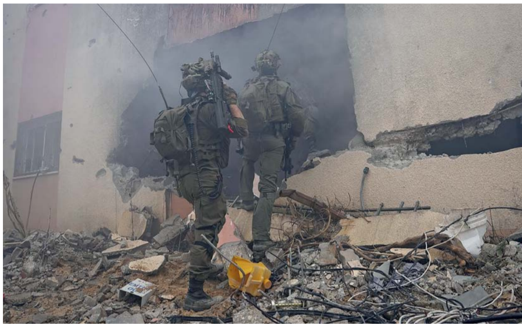
قوات الاحتلال الإسرائيلي تنفذ عملية في خان يونس.

القدس المحتلة. وكالات: تتواصل الجهود الأميركية لتحقيق وقف إطلاق النار على الجبهة اللبنانية، حيث وصل المبعوث الأميركي الخاص عاموس هوكشتين (الأحد) لعقد سلسلة من الاجتماعات في إسرائيل. ولأول مرة منذ اندلاع الحرب هناك إشارات إيجابية، وبحسب مسؤولين كبار في إسرائيل، فإن شعوراً أفضل ينشأ من اللقاءات عما كان عليه في بداية الحرب، مع وجود فرصة حقيقية لنجاح الخطوة بحسب القناة ١٢ العبرية. الإشارات قد تقود إلى إمكانية التوصل إلى تسوية دبلوماسية لم تكن لتأتي لو لم تكن هناك موافقة من حزب الله أيضاً. الصيغة الأميركية التي تطرح في المناقشات، هناك اتفاق عام على بنودها في إسرائيل. ويتضمن الاقتراح الأميركي صيغة من خطوتين. في المرحلة الأولى، سيقوم الطرفان بإعداد اتفاق تفاهم مؤقت، يتضمن انسحاب قوات حزب الله لمسافة تتراوح بين ثمانية وعشرة كيلومترات من الحدود وزيادة انتشار قوات اليونيفيل والجيش اللبناني في المنطقة، والسماح بتحديد الحدود البرية.