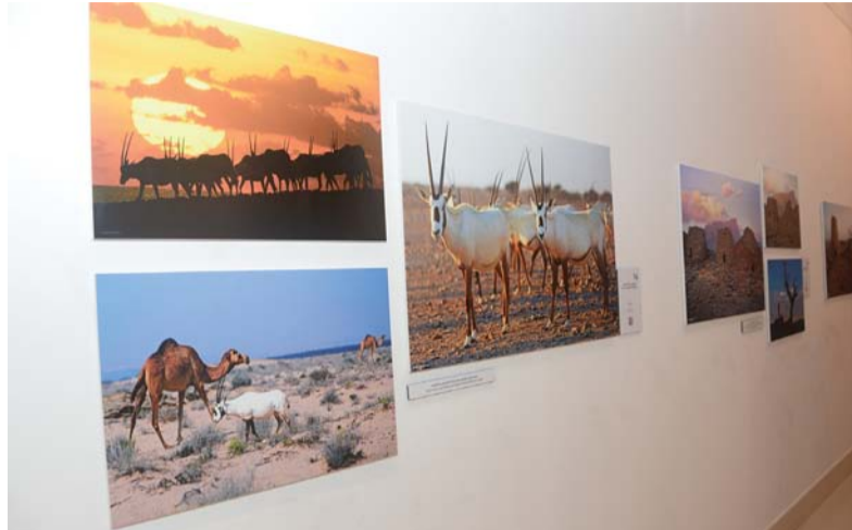
عدسة «المحاربي» وثقت صوراً متنوّعة لمعالم عُمان

تضمنت تصوير الوجوه وتوثيق الفنون العمانية والعادات والتقاليد. يأتي تدشين إصدار (قصّة صورة) كجزء أول استعرض (المحاربي) فيه القصص التي عاشها في مسيرة تصوير أرض سلطنة عمان، خلال المدة الزمنية من عام ١٩٨٦ إلى عام ٢٠٢٣ م وقد سجّلت عدسته معظم هذه الصور باستعمال الأفلام السلبية، والأفلام الموجية (السلايد)، وكذلك بأفلام الأبيض والأسود، إضافة إلى الصور الرقمية الحديثة.