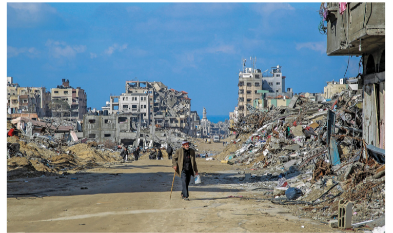
فلسطيني يسير في شارع العيون وسط أنقاض المباني التي دُمّرت خلال القصف الإسرائيلي على مدينة غزة.