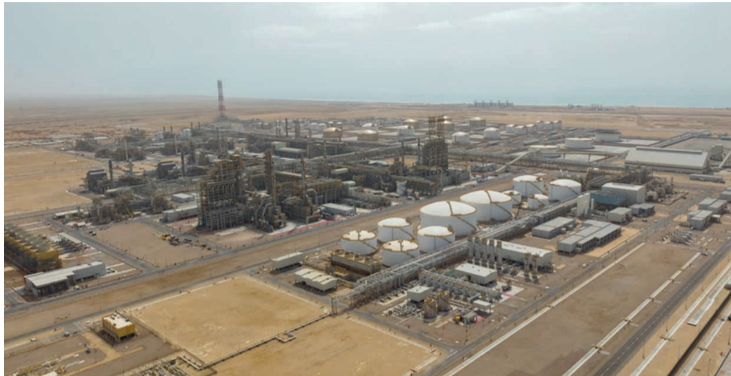
مصفاة الدقم نموذج مثالي على تلاقى المصالح الاقتصادية بين سلطنة عمان والكويت

وأشار معاليه إلى أن مصفاة الدقم رافد للقطاع الصناعي في سلطنة عمان، باعتبارها من الصناعات الثقيلة من حيث القيمة الاستثمارية والطاقة