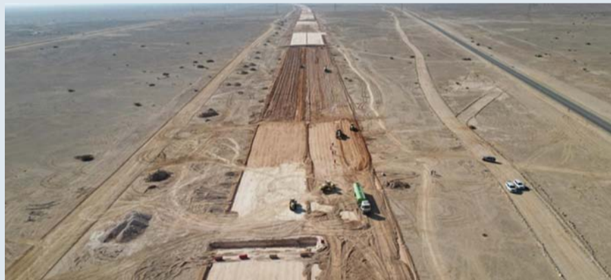
الطريق يساهم في تسهيل الحركة المرورية المتنامية ونقل البضائع بين المشروعات الاستراتيجية في المنطقة