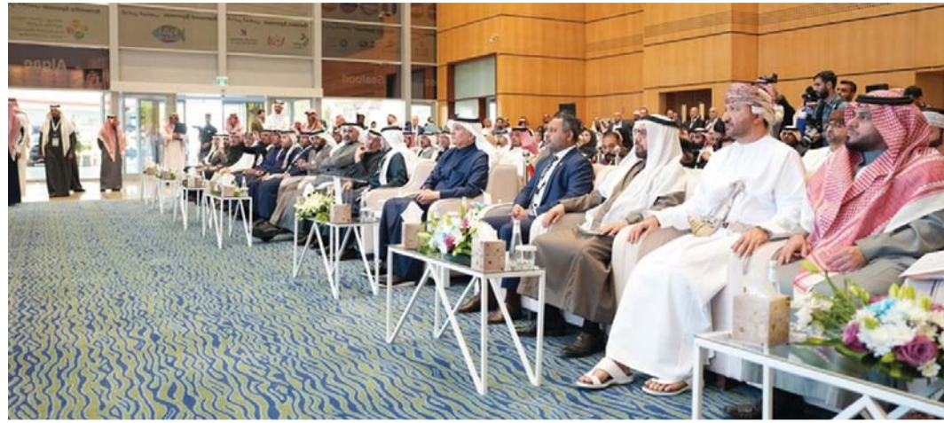
المعرض يناقش الموضوعات والقضايا الرئيسية في مجال الاستزراع السمكي

ويسعى المعرض إلى مناقشة الموضوعات والقضايا الرئيسية في مجال الاستزراع المائي ومصائد الأسماك على الساحة الدولية، ويعد هذا الحدث فرصة لتحقيق تبادل معرفي يسهم في تطوير الصناعة وتعزيز التكنولوجيا المستخدمة في هذا القطاع الحيوي.