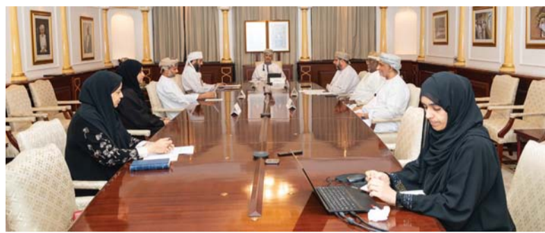
■ اللجنة استعرضت الفعاليات والأنشطة التي نفذتها

كما تم طرح جوانب التعاون بشأن انعقاد المؤتمر العالمي السابع عشر لأخلاقيات البيولوجيا بدولة قطر، حيث سيشترك مجموعة من أعضاء اللجنة في الجلسات والمحاضرات في اللجنة العلمية للمؤتمر. كذلك ناقشت اللجنة الفعاليات والأنشطة التي نفذتها في عام ٢٠٢٣ وخطةها لعام ٢٠٢٤ وطرحت أهم التحديات.