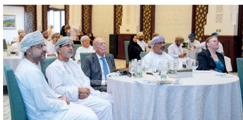
حلقة العمل ببحث تطوير البيئة التشريعية في سلطنة عمان استرشاداً بأفضل الممارسات الإقليمية

الحكومة في منظومة التشريع والقضاء والرقابة بشكل إيجابي على بيئة الأعمال في سلطنة عمان؛ مما سيعزز من ثقة المستثمرين، ويحسن موقع سلطنة عمان في العديد من المؤشرات الدولية ذات الصلة بالبيئة الاستثمارية، كما سيحفز التنمية الاقتصادية، ويسهم في توجيه الاستثمارات الأجنبية إلى مختلف القطاعات الاقتصادية.