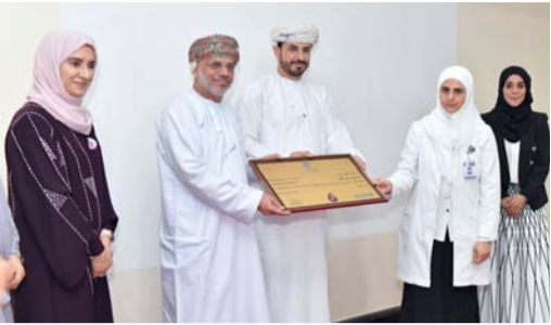
■ أثناء تسليم شهادة الاعتماد الدولية