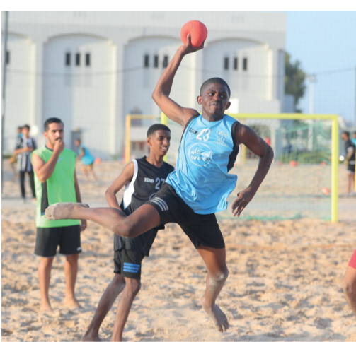
■ من مباريات دوري الشواطئ لكرة اليد

بمجمع السلطان قابوس الرياضي ببوشر، حيث يلتقي في المباراة الأولى السيب مع مصيرة في الساعة التاسعة صباحا تليها المباراة الثانية بين مسقط والاتحاد في الساعة التاسعة وخمسة واربعين دقيقة صباحا ويتبارى في المباراة الثالثة عبري مع السلام في الساعة العاشرة والنصف صباحا والمباراة الرابعة يلتقي فيها صحم مع المصنعة في الساعة الحادية عشرة وخمس عشرة دقيقة صباحا والمباراة الخامسة يلعب يلتقي فيها السلام مع السيب في الساعة الثانية عشرة ظهرا وفي الفترة المسائية تقام ثلاث مباريات يلعب الاتحاد مع صحم في الساعة الرابعة عصرا ويلعب مصيرة مع عبري في الساعة الرابعة وخمسة واربعين دقيقة عصرا وتكون المباراة الختامية بين المصنعة ومسقط في الساعة الخامسة وخمسة وثلاثين مساءً.