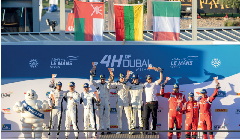
■ الفيصل وفريق المنار على منصة التتويج

ثانية واحدة ومع مرور ما تبقى من الوقت كانت القيادة على شيلر سائق المنار الذي اقترب كثيراً من أجل الحصول على المركز الأول لينتهي السباق بعد أربع ساعات وبفارق ٠.٧٧٥ من الثانية عن سيارة بورشة بعد اجتياز ١١٢ لفة من التناقص.