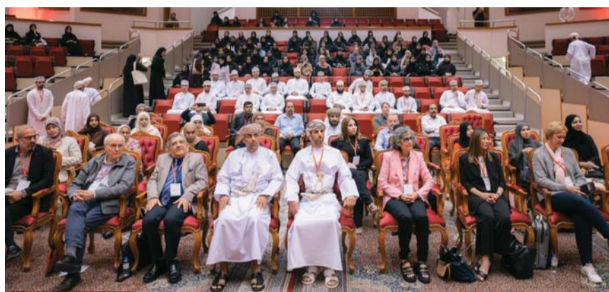
■ التعريف بأهمية التقنيات الطبية والطب الحيوي

وباكستان، إلى جانب مساهمين محليين في شركات الأدوية من القطاع الحكومي والخاص. تتضمن الندوة حوالي ٣٠ ورقة عمل بحثية ويشارك ١١ متحدثًا من خارج الجامعة، وأيضًا ١٠ متحدثين من داخل الجامعة، كما يشارك طلبة الدراسات العليا نتائجهم البحثية على شكل ملصقات جدارية في المعرض المصاحب للندوة.