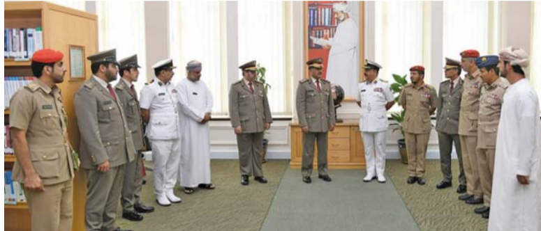
الوفد أثناء زيارته كلية القيادة والأركان المشتركة

شاهدوا عرضاً مرئياً عن الكلية الدفاعية أمس، كلية الدفاع الوطني بأكاديمية الدراسات الاستراتيجية والدفاعية بمعسكر بيت الفلج، وكان في استقبال الوفد لدى وصوله مقر الكلية اللواء الركن بحري علي بن عبدالله الشديدي أمر كلية الدفاع الوطني بأكاديمية الدراسات الاستراتيجية والدفاعية. وقد رحّب اللواء الركن بحري أمر كلية الدفاع الوطني بالوفد الزائر، وتم خلال اللقاء مناقشة عدد من الموضوعات ذات الاهتمام المشترك لاسيما الجوانب الأكاديمية والتدريبية، واستمعوا إلى إيجاز عن كلية الدفاع الوطني وما تتضمنه من مرافق وتجهيزات، كما اطلعوا على أقسام الكلية المختلفة.