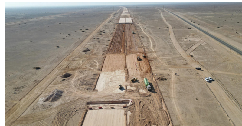
الطريق يسهم في تسهيل الحركة المرورية المتنامية ونقل البضائع بين المشروعات الاستراتيجية في المنطقة

الدقم. العمانية: تجاوزت نسبة الإنجاز في تنفيذ ازدواجية الطريق الرئيسي من دوار مطار الدقم إلى رأس مركز ٢٧ بالمائة، بما يتماشى مع الخطة المرسومة له؛ حيث من المتوقع الانتهاء من تنفيذ المشروع منتصف عام ٢٠٢٥ م. ويبلغ طول الطريق ٥٤ كيلومتراً، حيث يأتي استكمالاً لتنفيذ شبكة الطرق الاستراتيجية ضمن الخطط الشامل للمنطقة الاقتصادية الخاصة بالدقم.