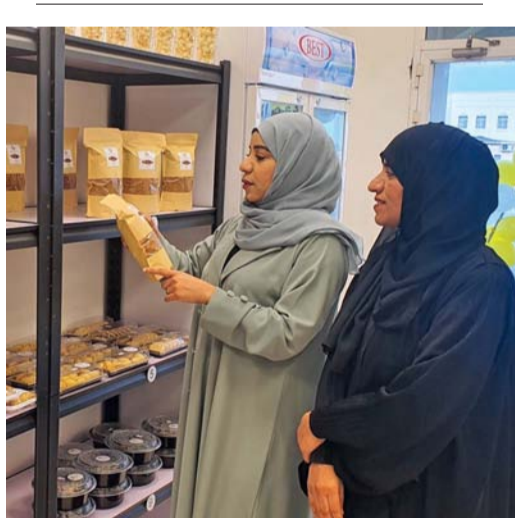
المُنْفَذ تستفيد منه ٢٤ أسرة