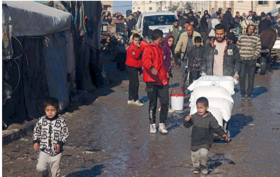
رجل ينقل أكياس الطحين التي وزعتها منظمة إغاثة تابعة للأمم المتحدة في رفح جنوب قطاع غزة.

أدى لارتقاء عدد من الشهداء. ولا تزال قوات الاحتلال تنفذ تدميرا لمربعات سكنية في غرب مدينة غزة.