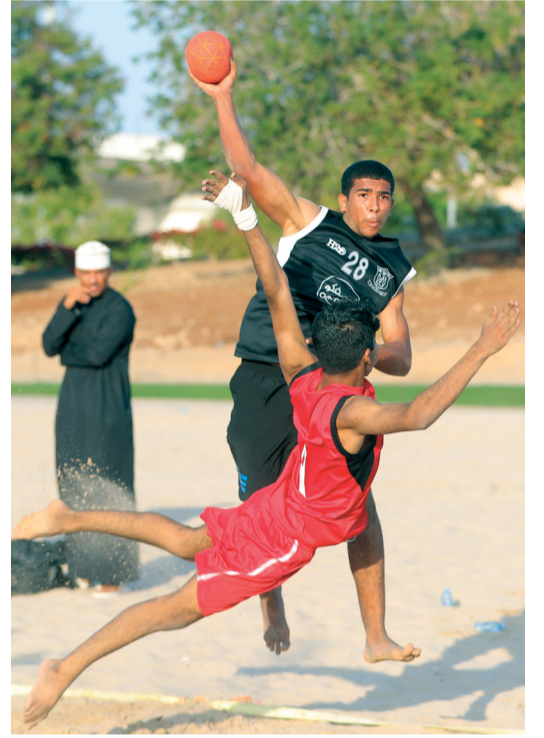
من مباريات دوري الشواطئ لكرة اليد