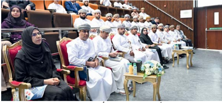
اللقاء أكد توفير الفرص لجيل الشباب لاكتساب المعرفة والمهارات