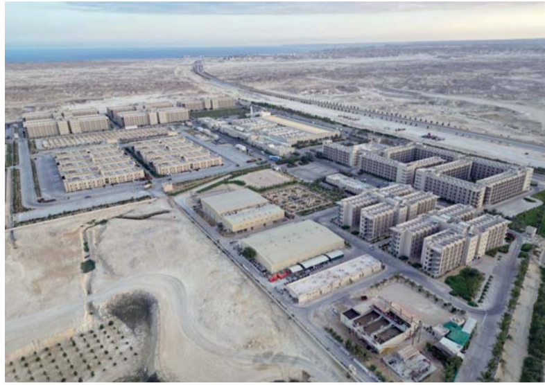
■ المنطقة الاقتصادية الخاصة بالدقم تعد من أكبر المناطق الاقتصادية الخاصة في الشرق الأوسط وشمال إفريقيا

حافزاً أساسياً للمستثمرين الراغبين في الاستثمار بالمنطقة وخصوصاً المشروعات الكبيرة التي يتطلب تشغيلها طاقة كهربائية عالية ومحطة للمياه بسعة ٣٦ ألف متر مكعب يومياً إضافة إلى محطة كهرباء أخرى لإنتاج الكهرباء لمصفاة الدقم ومشروع خزانات رأس مركز بسعة ٣٢٦ ميجاوات، علاوة على وجود محطة للغاز تستوعب ٢٥ مليون متر مكعب من الغاز تم ربطها بمحطة سيح نهيذة عبر أنابيب بطول ٢٢٠ كيلو متراً، والذي بدوره شكّل حافزاً آخر لتشجيع المستثمرين في المشروعات الكبيرة والتي تتطلب الغاز في عمليات التشغيل، نحو اختيار المنطقة الاقتصادية الخاصة بالدقم ضمن أفضل الوجهات للاستثمار. وبين أن المنطقة نفذت العديد من الأعمال المرتبطة بتوسيع الرقعة الخضراء وعمليات التشجير والبنية الأساسية للمشروعات الترفيهية بالإضافة