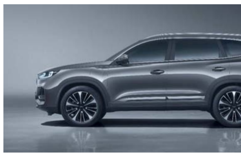
شيري توفر تجربة قيادة مريحة

مبيعات مجموعة شيري ارتفاعاً في مبيعاتها نوفمبر الماضي وبلغ حجم المبيعات ٢١٢,٠٧٦ وحدة، لتكسر حاجز ٢٠٠,٠٠٠ وحدة للمرة الثانية على التوالي وتسجل رقماً قياسياً جديداً للمبيعات الشهرية. كما حققت عائلة تيجو ٨ مبيعات شهرية تجاوزت ٢٠,٠٠٠ وحدة بصفتها الشركة الرائدة في المبيعات ضمن مجموعة شيري وتعد سيارة تيجو برو ٨ طرازاً جديداً في سوق السيارات الهايبرد بسبب براعة منتجاتها وعلامتها التجارية القوية التي تركت على المستخدم لتوفير تجربة قيادة مريحة للمستخدمين في جميع أنحاء العالم. كما تحتوي على نظام التدفئة ثنائي المحرك يعمل بسرعة خلال ١٠ دقائق ويسمح نظام تكييف الهواء الألي ثنائي المنطقة بالتحكم المستقل في درجة الحرارة، كما تحتوي على مقاعد جلدية فاخرة كما تم تجهيزها لتكون ذات القيادة التكنولوجية PURE-COMOD الصديقة للبيئة مع اعتماد عمليات و مواد حماية البيئة الأوروبية كما تتميز بفلتر تكييف الهواء المضاد للبكتيريا (CN95 Medical Grade) ونظام التحكم في