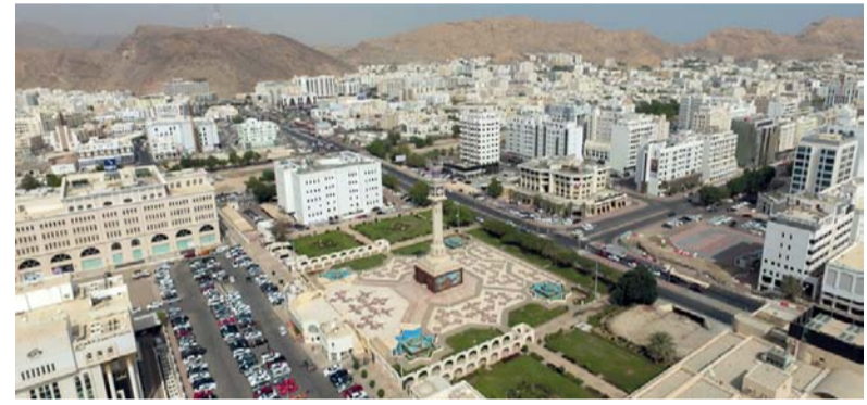
ارتفاع حجم الائتمان المصرفي للبنوك التجارية ٧,٨ بالمائة بنهاية الربع الثالث من عام ٢٠٢٣

ريال عماني بنسبة ٣,٢ بالمائة من إجمالي الائتمان المصرفي. وحصل قطاع الزراعة والأنشطة المرتبطة بها بنهاية شهر سبتمبر من العام الماضي على ٤٤,٣ مليون ريال عماني بنسبة ٠,٢ بالمائة وحصل قطاع التصدير على ٧,٧ مليون ريال عماني. وبيّنت النشرة أن حجم الائتمان المصرفي للبنوك التجارية في سلطنة عُمان للأشهر الثلاثة من العام الماضي بلغ بنهاية الربع الثالث من العام الماضي نحو ٨٠,٣ مليون ريال عماني بنسبة ٣,٣ بالمائة، فيما بلغ حجم الائتمان المصرفي لغير القيمين ٢٥٢ مليون ريال عماني بنسبة واحد بالمائة من إجمالي حجم الائتمان المصرفي.