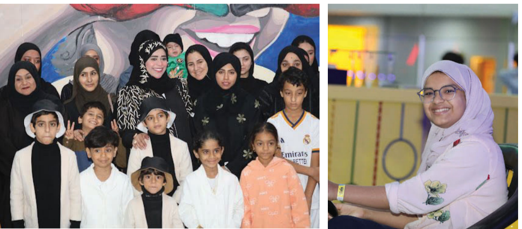
المشاركون في الفعالية الترفيهية

المخزومية رئيسة مجموعة بسملة أمل التطوعية، بتقديم هدايا للأيتام المشاركين، وكلمة تحفيزية من أعضاء مجلس إدارة المجموعة. كما أن هذه الفعالية تُعد الثانية في العام الجديد، حيث سبق للمجموعة وأن نظمت يوماً مفتوحاً للأيتام الأسبوع الماضي على شاطئ السوادي.