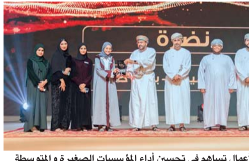
جائزة شمال الباطنة لريادة الأعمال تساهم في تحسين أداء المؤسسات الصغيرة والمتوسطة

خلال عروض ونقاشات؛ لمواكبة أحدث التطورات في مجال الاحتيال والأمان خاصة في الهواتف المحمولة واستعرض التهديدات المتطورة والتغييرات التنظيمية والتقدم التكنولوجي في هذا المجال مع تقديم أفكار رؤى حول الاتجاهات الناشئة وأفضل الممارسات، وتطوير وتنفيذ حلول فعالة لمكافحة تهديدات الاحتيال والأمان في الهواتف المتنقلة والتهديدات الأمنية. دشنت وزارة النقل والاتصالات وتقنية