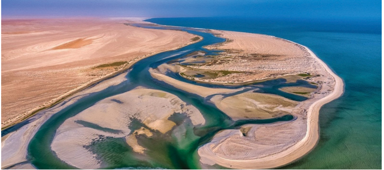
الولاية تزخر بالعديد من المقومات الطبيعية والسياحية

بجامعة صحار. يأتي هذا اللقاء في إطار تنفيذ التوجيهات السامية حول أهمية التواصل المستمر بين الوزراء، مع المحافظين، وأعضاء المجالس البلدية لمساندتهم، ولواءمة تنفيذ مختلف المشاريع التنموية في المحافظات، وربطها مع خطط الوزارة، ومؤسسات التعليم العالي، بالإضافة إلى الاستفادة من الآراء والمقترحات فيما يتصل بالمشاريع التي تنفذها الحكومة في المحافظات. شهد اللقاء تقديم معالي وزيرة التعليم العالي والبحث العلمي والابتكار كلمة تكرت فيها الدور المحوري الذي تلعبه مؤسسات التعليم العالي في تأهيل الكفاءات البشرية وتنشيط وتشجيع البحث العلمي والابتكار وريادة الأعمال وخدمة المجتمع، مستعرضة دور الوزارة في دعم وتشجيع مؤسسات التعليم العالي العمالية للارتقاء بها في سلم الجودة العالمية من خلال توافرها مع أرقى الجامعات العالمية، وتشجيع