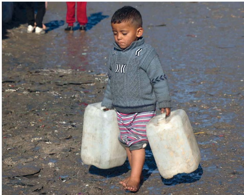
صبي صغير يحمل صفائح فارغة في رفح يسعى للملأ بالمياه بجنوب قطاع غزة.

وقصف جيش الاحتلال مستودع الأدوية التابع لوزارة الصحة ما