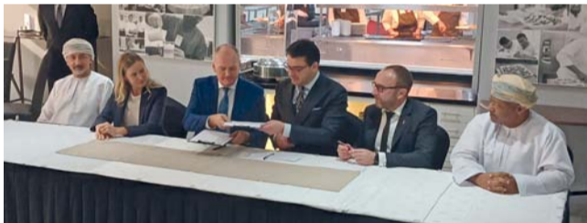
الاتفاقية تساهم في تبادل الخبرات بين المؤسستين