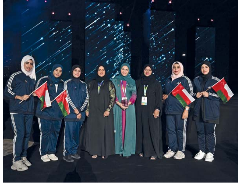
صورة جماعية لبعثة سلطنة عمان المشاركة في الدورة