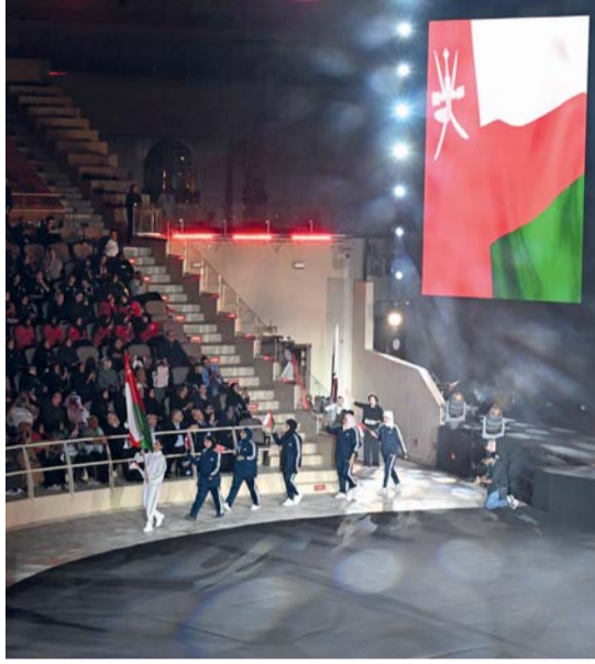
دخول وفد سلطنة عمان المشارك في الدورة