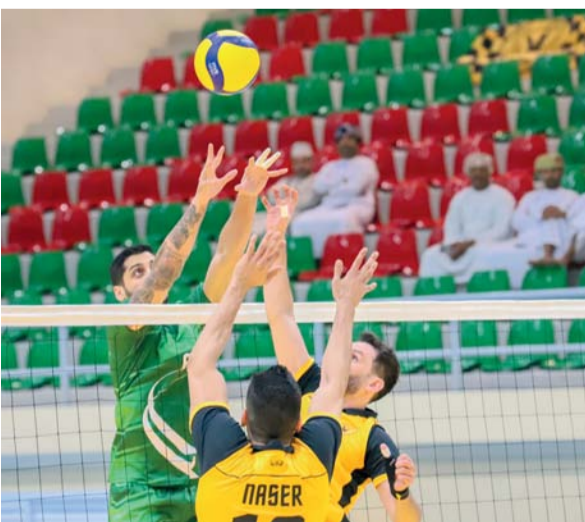
من لقاء القادسية الكويتي والإبتسام السعودي