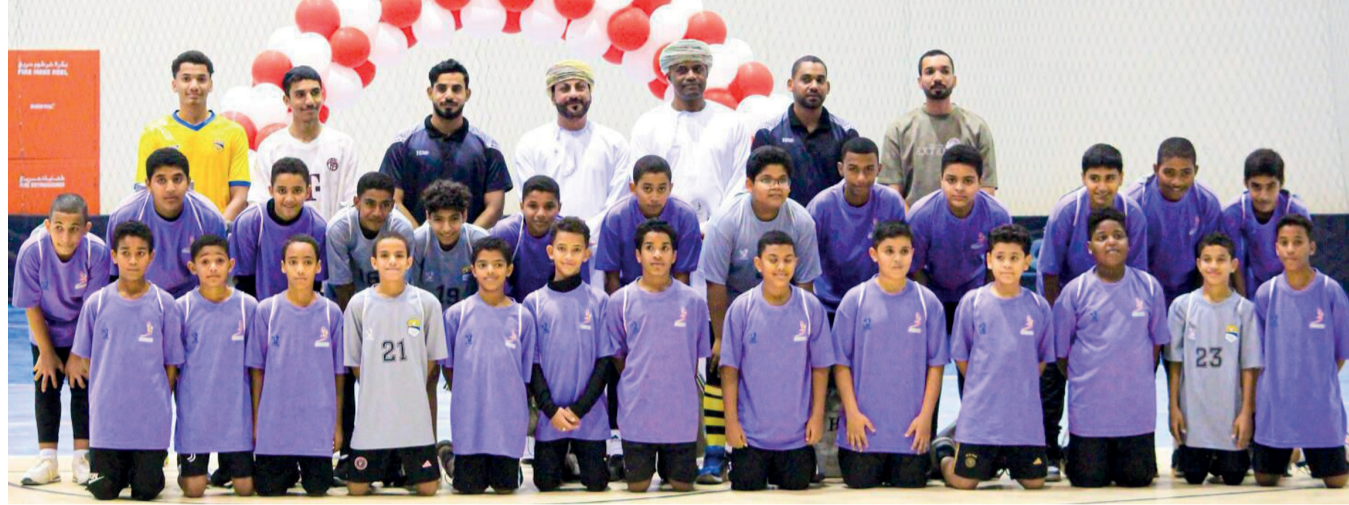
■ صورة جماعية للاعبين مركز إعداد الرياضيين بنادي عبري مع راعي المناسبة والحضور

وقد حرصت اللجنة المشرفة على مراكز إعداد الرياضيين من هذا المهرجان على إيجاد بيئة جاذبة ومشوقة للاعبين والأسرة وتوظيف المهارات المكتسبة خلال المرحلة التدريبية الأولى، وتعزيز الجانب التنافسي من خلال الأنشطة والالعاب المتنوعة بما يساهم في تطوير مستوى اللاعبين وتعزيز ذلك جانب القيم والسمات التربوية الحميدة لدى اللاعبين مثل الثقة بالنفس والتعاون والولاء والانتماء والقيادة، كما يشهد المهرجان مشاركة لاعبي كرة اليد القدامى وعائلات اللاعبين بهدف دعمهم وتحفيزهم على الاستمرارية في التدريبات.