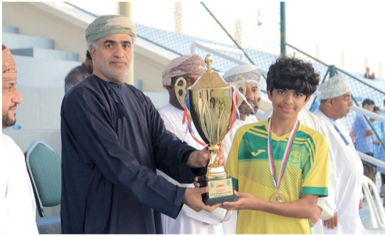
■ راشد السعدي يتوج لاعبي الفرق الفائزة بالمراكز الأولى في البطولة

واشتمل البرنامج على اجراء مسابقات متنوعة للاعبين لقياس مدى تطور مستواهم واستيعابهم للتدريبات السابقة، كما شارك في المهرجان بعض اللاعبين القدامى بالنادي في استعراض بعض فنون اللعبة تشجيعا وتحفيزا للاعبين على الاستمرارية في التدريبات، ثم قام راعي المناسبة ونائب رئيس الاتحاد العماني لكرة اليد بتوزيع الهدايا على اللاعبين وأولياء