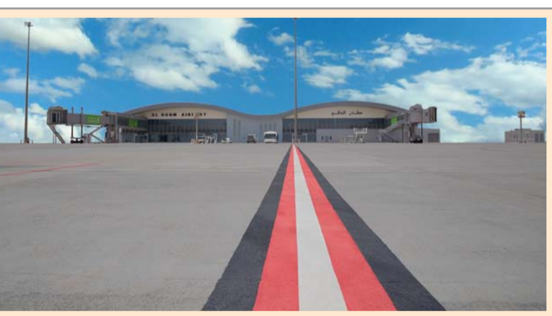
مطارات عُمان ملتزمة بالعمل جنباً إلى جنب مع المنطقة الاقتصادية الخاصة بالدقم

مسقط. العُمانية: سجلت بورصة مسقط في شهر يناير الماضي عدداً من النتائج الإيجابية؛ فقد ارتفعت قيمة التداول بنسبة ٩,٦ بالمائة عن مستواها في ديسمبر ٢٠٢٣م، وسجل المؤشر الرئيسي صعوداً بأكثر من ١ بالمائة، في الوقت الذي ارتفع فيه عدد الصفقات المنفذة والقيمة السوقية لشركات المساهمة العامة المدرجة في البورصة.