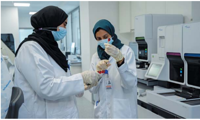
تعزيز الجهود الرامية إلى الحد من انتشار المرض وتحسين فرص الشفاء منه