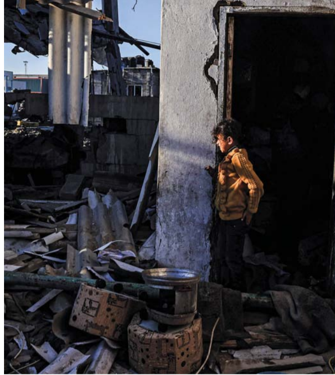
فتاة فلسطينية تنظر إلى أنقاض مبنى بعد القصف الإسرائيلي في رفح.

أعلنت وزارة الصحة الفلسطينية بغزة استشهاد ٢٥ شخصاً في ٢٥ مجزرة ارتكبتها الاحتلال الإسرائيلي منذ الأحد الماضي، فيما تتالت الفجرات الجوية العنيفة على وسط وجنوب القطاع مع بدء الجيش الاحتلال عملياته البرية في مخيم البرج وسط القطاع انطلاقاً من موقع مقبولة العسكري وشارع عبد الخالق. يأتي ذلك في حين استمرت المعارك المحتدمة بين المقاومة والاحتلال على عدة محاور، وأقر الاحتلال بمقتل ضابط وجندي إضافيين لترفع حصيلة قتلاه منذ بدء حربه على غزة إلى ٤٩١ ضابطاً وجندياً وفق إعلانه. واستشهد عدد من الفلسطينيين فجر أمس بعد قصف طيران الاحتلال الحربي لمنزل في خان يونس جنوب قطاع غزة. وأفادت مصادر طبية، باستشهاد عدد من الفلسطينيين وإصابة آخرين، إضافة لعدد من المفقودين جراء قصف الطيران الحربي الإسرائيلي منزلاً يعود لعائلة النجار في قيزان النجار جنوب خان يونس، كما قصف طيران الاحتلال منزلاً لعائلة أبو رزقة في الحي الهولندي غرب المدينة. كما قصف الطيران الحربي الإسرائيلي محيط مستشفى ناصر بخان يونس جنوب قطاع غزة، وتواصل القصف المدفعي واستهداف وسط المدينة. وفي رفح، وصل عدد من الإصابات للمستشفى الكويتي جراء قصف منزل لعائلة العمصي بالقرب من ميدان النجمة وسط المدينة. كما قصف طيران الاحتلال منزلاً في مخيم الشابورة وسط رفح جنوب القطاع. كما استهدف طيران الاحتلال الحربي مدينة دير البلح وسط قطاع غزة. وفي السياق يعمل رئيس الوزراء الإسرائيلي بنيامين نتانياهو على خطة لتهجير الفلسطينيين من غزة.