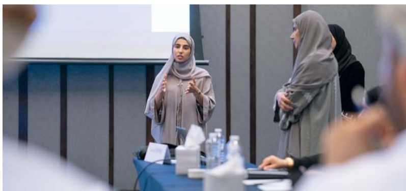
من عرض احد المشاريع المشاركة في المسابقة

تحتفل وزارة الثقافة والرياضة والشباب اليوم بتكريم الفائزين في مسابقة الوزارة للمشاريع الرياضية «شاركنا التغيير» وذلك بمركز الشباب تحت رعاية معالي المهندس سعيد بن حمود المعولي وزير النقل والاتصالات وتقنية المعلومات. وتهدف المسابقة إلى تشجيع جميع أفراد المجتمع أصحاب الأفكار الإبداعية على المساهمة في إيجاد وابتكار مشاريع رياضية وحيوية تساهم في تفعيل النشاط البدني ورفع مستوى ممارسته وجعله أسلوب حياة، بالإضافة إلى إيجاد مشاريع رياضية مستدامة تساهم في دفع عجلة التنمية الاقتصادية. وكانت اللجنة المشرفة على المسابقة أعلنت عن تأهل ٥ أفكار لحفل ختام المسابقة وهي مسار ٤٠.٣ والمدرسة الرياضية النموذجية ورواد wheels و the smart space على أن يتم الإعلان عن المراكز الخمسة الأولى اليوم في الحفل الختامي.