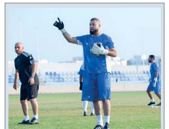
من التدريبات العملية للمدربين المشاركين في الدورة