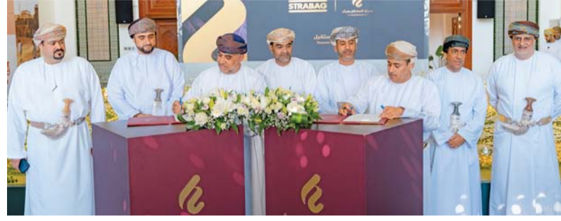
■ أثناء التوقيع على الاتفاقية

وتتمثل رؤية مدينة السلطان هيثم في إرساء نموذج جديد لبناء المدن المستدامة التي تواكب تطورات الحياة العصرية للشباب، وتأكيداً على تبني مفهوم مبتكر في البناء، واستشراف الأساليب المستقبلية، وتسخير الخبرات العالمية والإقليمية والمحلية والمعرفة المتعمقة في هذا المجال لتطوير أيقونة عصرية تحاكي الموروث الثقافي وترتقي بأسلوب الحياة في سلطنة عُمان.