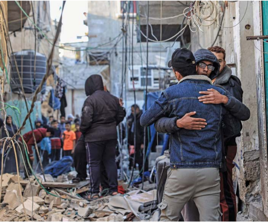
فلسطينيون يتجمعون بالقرب من أنقاض مبنى في أعقاب القصف الإسرائيلي على رفح.