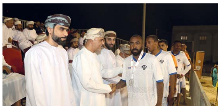
تقليد لاعبي الشباب بميداليات الفضية

عن طريق عبدالله الصويطي والهدف التاسع من ركلة جزاء سددها حارس المرمى العمارات يونس العويسي ثم اختتم اليقظان الهنداسي سلسلة اهداف نادي العمارات بتسجيله الهدف العاشر ثم نجح الشباب بتسجيله الهدف العاشر عن طريق اللاعب سمير آل سعد لتنتهي المباراة بفوز العمارات على الشباب ١٠/٦. وعقب انتهاء المباراة النهائية قام المكرم الدكتور عامر بن ناصر المطاعني راعي الختام بتتويج الفائزين بالمراكز الثلاثة الأولى حيث توج نادي العمارات بدرع الدوري وميداليات الذهبية بينما حصل الشباب بميداليات الفضية لحصوله على المركز الثاني وحصل نادي مصيرة على ميدالية البرونزية بحصوله على المركز الثالث. 🏆