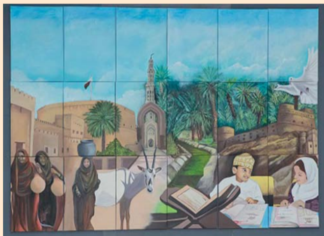
المناسبة تضمنت معرض فني

وكعادة جامعة نزوى في تقدير جهود رواد الأدب واللغة والفكر في عمان، تبني قسم اللغة العربية بكلية العلوم والآداب الاحتفاء بشخصية أبي سرور بوصفه شاعرا ومعلما عمانيا علميا ودينياً وأديباً وفكرياً، إذ إن محوريتها هذه الشخصية الأدبية الراقية ذات نكهة خاصة، إذ لا تتجلى في الدراسات التي يعرضها الباحثون فحسب، ولكنها ستأخذ منحى جمالياً آخر يشترك فيه قسم اللغة العربية مع شعبة الفن بقسم التربية والعلوم الإنسانية بالجامعة، ذلك أن الاهتمامات الشعرية للشيخ أبي سرور ستترجمها إبداعات باللون والريشة وتحول قصائده إلى جدارية فنية، تترجم هذه المبادرة الشعرية التي تبنته اليونيسكو لاحتفاليتها باليوم العالمي للغة العربية لعام ٢٠٢٣ م، هو: (اللغة العربية: لغة الشعر والفنون).