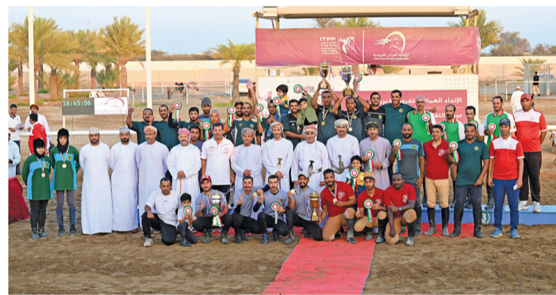
صورة جماعية للمشاركين في البطولة مع راعي الختام

اختتمت بطولة التقاط الأوتاد كأس العيد الوطني لـ ٥٣ المجيد للموسم ٢٠٢٣ / ٢٠٢٤ بميدان التقاط الأوتاد بمزرعة الرحمة وذلك تحت رعاية سعادة السيد طارق بن محمود بن علي البوسعيدي والي بركاء بحضور السيد منذر بن سيف بن حمد البوسعيدي رئيس مجلس إدارة الاتحاد العماني للفروسية والسباق ومحمود بن علي الناصري أمين السر بالاتحاد وعدد من أعضاء مجلس إدارة الاتحاد وممثلي وحدات الخيالة الحكومية.