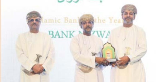
طاهر العمري يسلم الجائزة لسالم المحاربي

توج بنك نزوى مؤخراً بجائزة «أفضل بنك إسلامي للعام ٢٠٢٣»، وذلك خلال حفل جوائز منتدى الصيرفة والتمويل الإسلامي. والذي أقيم تحت رعاية سعادة طاهر بن سالم العمري، الرئيس التنفيذي للبنك المركزي العماني، بحضور عدد من المسؤولين التنفيذيين وصناع القرار وأبرز القادة في قطاع التمويل الإسلامي. وقال سالم المحاربي، الرئيس المالي لبنك نزوى عقب تسلمه الجائزة سعادة بحصولنا على هذه الجائزة المرموقة التي تعكس جهود البنك المستمرة لوضع معايير جديدة للمضي قدماً في قطاع التمويل الإسلامي والتزامه الدائم بتعزيزه. وأضاف: تعد هذه الجائزة بمثابة حافز لنا لمواصلة مسيرتنا نحو تحقيق المزيد من الإنجازات، بما في ذلك ابتكار خدمات ذات جودة عالية، وإعطاء الأولوية للتحول الرقمي، وإيجاد الوعي حول الخدمات المصرفية المتوافقة مع الشريعة الإسلامية، والنمو على الصعيدين الاجتماعي والاقتصادي.