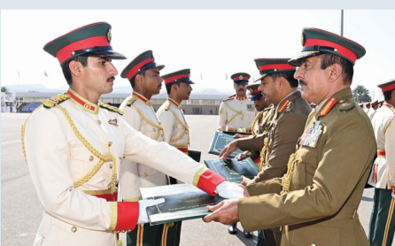
■ مطر البلوشي أثناء تسليم الجوائز لأوائل الضباط الخريجين

مسقط، العمانية: سلم أمس اللواء الركن مطر بن سالم البلوشي قائد الجيش السلطاني العماني بميدان الاستعراض العسكري بمعسكر المرتفعة شهادات الدبلوم في العلوم العسكرية لخريجي كلية السلطان قابوس العسكرية، كما سلم الجوائز التقديرية لأوائل الضباط الخريجين؛ وذلك بمناسبة احتفال الجيش السلطاني العماني بتخريج دورة الضباط المرشحين ودورة الضباط الجامعيين والخدمة المحدودة. وهنا قائد الجيش السلطاني العماني الضباط الخريجين على أدائهم المتميز في حفل تخريجهم