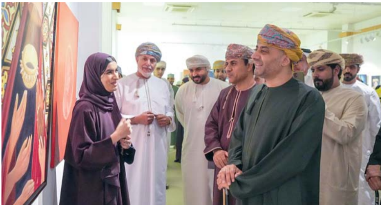
تجسس معرض فني ضم عددا من الأعمال الفنية المتنوعة