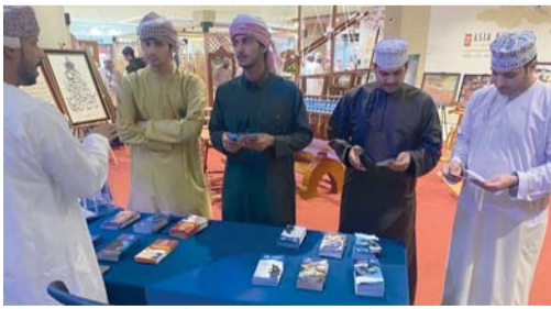
■ المعرض تضمن كتيبات ومشتورات توعوية للوقاية من الجرائم