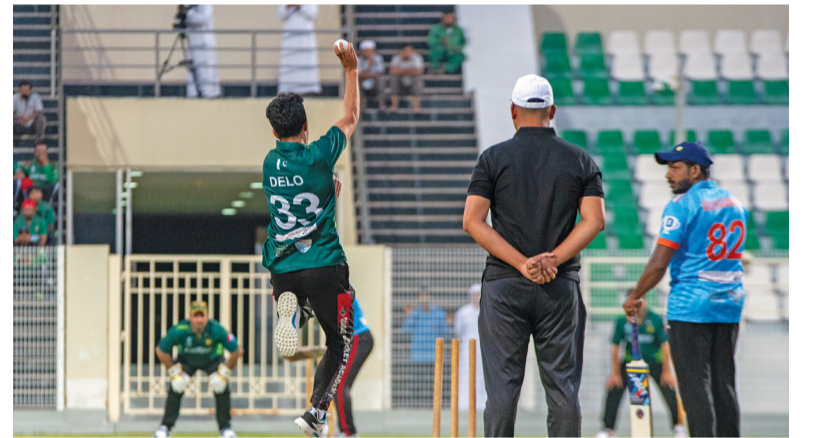
■ من مباريات بطولة كركيت الأولى للجاليات بمحافظة مسندم

أسوسيون. أ.ف.ب: قال مصدر في الاتحاد الأمريكي الجنوبي لكرة القدم (كونمبول) لوكالة فرانس برس إن الأخير والاتحاد الدولي «فيفا» لن يتسامحا مع أي تدخل خارجي في الشؤون الداخلية للاتحاد البرازيلي ولن يترددا في إيقاف البرازيل إذا لم يتم إعادة إنشائها رودريغيش إلى رئاسة الاتحاد. وأوضح المصدر الذي طلب عدم الكشف عن هويته أن «القوانين واضحة وصرحة. ولا يسمح بأي حال من الأحوال بتدخل قوى خارجية في مجال اختصاص (الاتحادات) المعنية، وأقبل رئيس الاتحاد البرازيلي رودريغيش من منصبه في السابع من الشهر الحالي عقب قرار المحكمة الذي أبطأ اتفاقا سمح بانتخابه. وتعتبر اقالة رودريغيش ضربة إضافية لكرة البرازيلية ومنتخب «السيليساو» الذي يمر بفترة صعبة على صعيد النتائج، مع إصابة نجمه نيمار وتعرضه لثلاث هزائم تواليها في التصفيات المؤهلة لمونديال ٢٠٢٦. وأبطلت هذه المحكمة اتفاقا بين الاتحاد البرازيلي ومكتب المدعي العام في ريو، يعود تاريخه إلى مارس ٢٠٢٢، والذي سمح لاحقا بانتخاب رودريغيش على رأس الاتحاد حتى عام ٢٠٢٦.