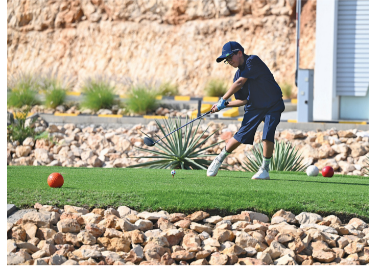
■ تاللق كبير لفئات العمرية في البطولة

الاول من البطولة كان التوتر والارتباك واضحا على اللاعبين ولم يظهروا بالمستوى المتوقع منهم، ولكن في اليوم الثاني استطاعوا التخلص من جو التوتر وتعديل النتائج والدخول إلى أجواء المنافسة الحقيقية، ويكون لعبة الجولف لعبة فريدة، فكل لاعب يعتمد على مجهوده الشخصي، وتألّق المنتخب الإماراتي في منافسات الفئات ولديه لاعبون مجيدون في اللعبة ويتمتعون بخبرة فنية واسعة، كما أن منتخبنا سلطنة عمان والسعودية نافسا بشراسة في اليوم الثاني، ودور الحكم العام في البطولة يتمحور حول استقبال اعتراضات اللاعبين على قرارات الحكم الأساسي والوصول إلى حل يرضي الطرفين، وبشكل عام لا يوجد عدد كبير من المحكمين في لعبة الجولف بسلطنة عمان والوضع الراهن يتطلب تأسيس قاعدة بالمحكمين نظرا للاهتمام الكبير الذي توليه وزارة الثقافة والرياضة والشباب بلعبة الهوكي، وبالطبع أن اللجنة الأساسية للعبة الجولف هي الفئة الناشئة وستمثل المنتخبات الوطنية في المحافل الخارجية مستقبلا. وحول دور نادي غلا للجولف في استضافة مثل هذه البطولات قال الفارسي: لا يخفى على الجميع أن ملعب نادي غلا للجولف يتميز بمواصفات عالمية يعطي تنوعا للاعب الذي عادة ما يرغب في تغيير أجواء الرياضة، كما تساهم هذه الملاعب في استقطاب السياحة لسلطنة عمان، ويسهل ذلك من المهمة التسويقية لهذه الملاعب ولرياضة الجولف خاصة، كما أن البنية الأساسية تساهم بشكل إيجابي على إنجاح وانتشار والاستفادة من رياضة الجولف رياضيا واقتصاديا واجتماعيا.