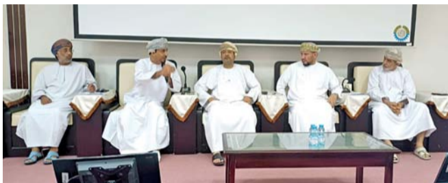
■ الملتقى ناقش أهمية تطوير العمل الصحفي والإعلامي

واختتم الملتقى بزيارة إلى فرع غرفة تجارة وصناعة عُمان في جنوب الشرقية تم خلال الزيارة عمل لقاء تعريفى بجهود فرع غرفة تجارة وصناعة عُمان بجنوب الشرقية في مجال تقديم التسهيلات للمؤسسات الصغيرة والمتوسطة ودعم القطاع الاقتصادي والسياحي والاستثماري من خلال الكثير من الفعاليات والمنديات التي تنظمها الغرفة. كما زار جميع المشاركين أمس مصنع النواخذة واطلعوا على كيفية صناعة السفن والأبواب والمنجيات الخشبية التي تشتهر بها ولاية صور العريقة.