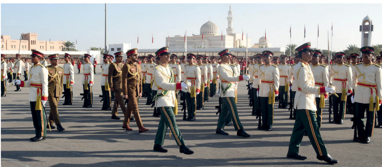
■ راعي المناسبة يفتش الصف الأمامي من طابور الخريجين