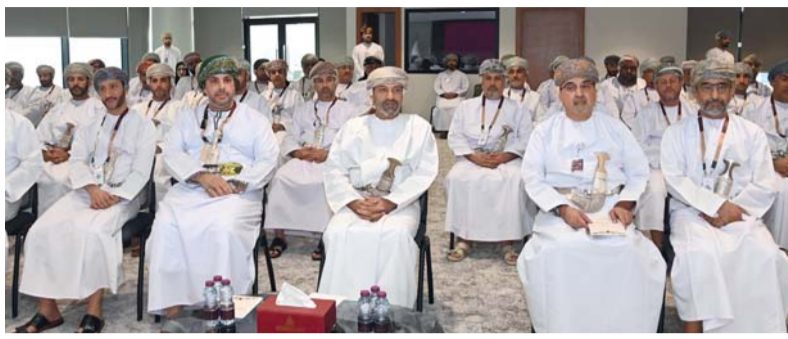
البرنامج يهدف إلى تعزيز قدرات القيادات المحلية في المحافظات

ويأتي أن برنامج الولاية يركز على أهمية مفهوم الإدارة المحلية والشراكة ونظم الإدارة الحديثة والتكامل مع مختلف مؤسسات المجتمع بالإضافة إلى تبادل الخبرات بين المشاركين في البرنامج والخبراء، مشيراً إلى أن الإدارة المحلية في سلطنة عُمان تخطو خطوات ثابتة وتشهد المزيد من التطوير في المرحلة القادمة. وفي السياق ذاته قال سعادة الشيخ الدكتور سلطان بن عبدالله البطاشي والي صحح إن تدشين برنامج الولاية يأتي في إطار حرص الأكاديمية السلطانية للإدارة بالشراكة مع وزارة الداخلية في تطوير قدرات القيادات في الإدارة المحلية في مختلف الجوانب منها القانوني والاقتصادي والإعلامي.