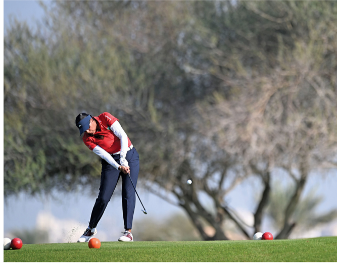
■ لاعبة المنتخب السعودي في المنافسات