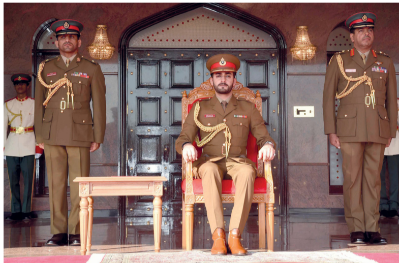
■ ذي يزن آل سعيد أثناء رعايته الإحتفال