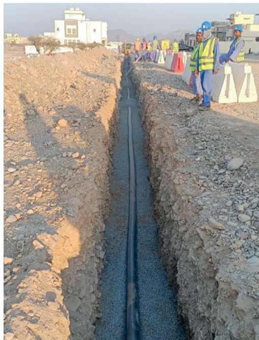
نسبة الإنجاز في المشروع بلغت ١٢٪

لن ينظر في أي عطاء يرد بعد الموعد المحدد أو يكون غير مستوف للشروط.