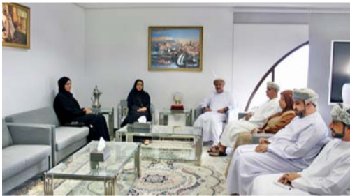
■ اللقاء استعرض الاختصاصات المنوطة باللجنة العمانية لحقوق الإنسان