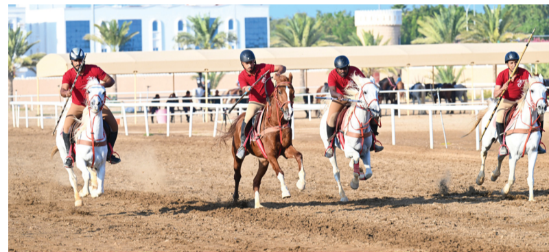
مناقسة قوية شهدتها المسابقة