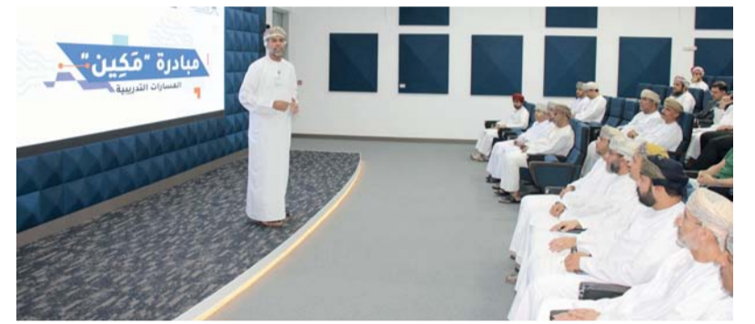
■ اللقاء يهدف إلى تمكين الخريجين والباحثين على التنافس على الفرص الوظيفية

اختتمت صباح أمس فعاليات الملتقى الصحفي الخامس بجنوب الشرقية (جنوب الشرقية .. إعلام وتنمية) والذي أقيم بولاية صور ونظمته جمعية الصحفيين العمانية ممثلة بلجنة الصحفيين بمحافظتي الشرقية بالتعاون مع محافظة جنوب الشرقية. تضمن الملتقى عدداً من الفعاليات، منها ندوة عن التنمية في محافظة جنوب الشرقية والتعريف بفرص الاستثمارية والمشاريع المستقبلية وما تشهده المحافظة من نهضة تنموية