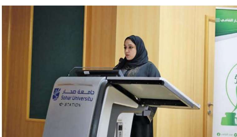
الفعالية تضمنت العديد من الفقرات المتعلقة باللغة العربية