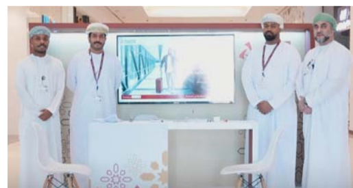
ميثاق يحرص على تقديم أفضل الخدمات وتبني أفضل المبادرات

المبادرات التي تسعى دائماً إلى التميز والريادة في تقديم الخدمات المصرفية الإسلامية في السلطنة، مضيفاً بأن تخصيص هذه المنصات الخاصة في المراكز التجارية تأتي بهدف تقديم خدمات سريعة وسهلة للزبائن من زوار ومرطادي هذه الأماكن، وتعريفهم بالمنتجات الجديدة والعروض والخدمات التي يقدمها ميثاق والتي تستهدف مختلف شرائح المجتمع. ويمكّن ميثاق شبكة واسعة من الفروع تصل إلى ٢٧ فرعاً منتشرة في كافة المحافظات تقدم مختلف الخدمات والتسهيلات المصرفية والتي من خلالها يحرص ميثاق على تقديم مجموعة متكاملة من المنتجات والخدمات المصرفية المتوافقة مع أحكام الشريعة الإسلامية.