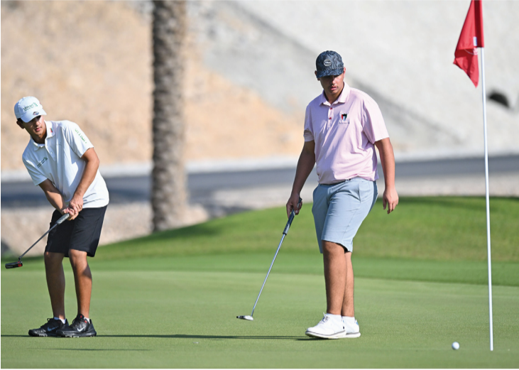
■ لاعب منتخبنا الوطني في منافسات اليوم الثاني