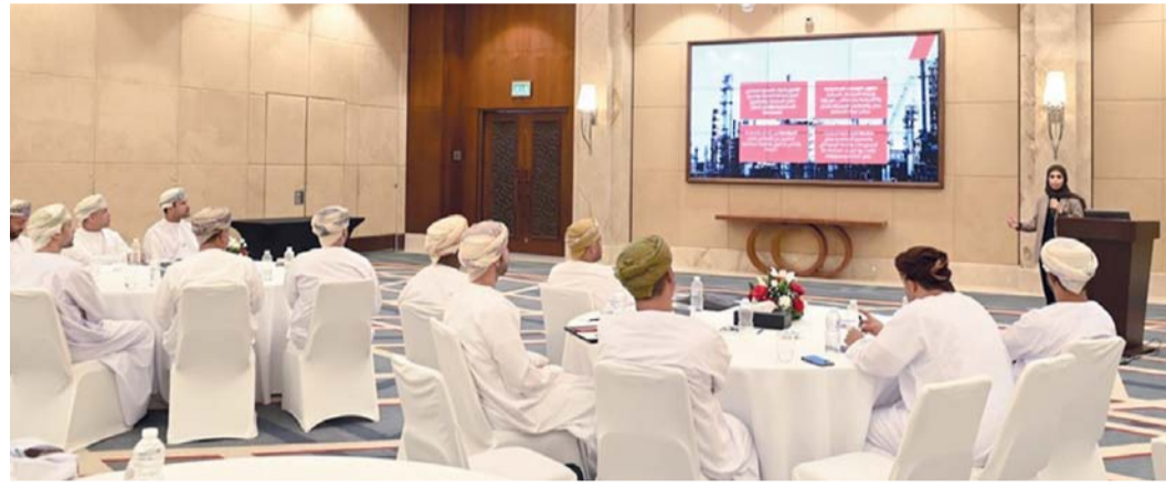
صورة أرشيفية من أعمال مختبر الاستثمار في القطاع الرياضي

السياحة الرياضية ومركز الأحداث والفعاليات الرياضية، كما تم استعراض المكنات والتي تتمثل في الممكن الإعلامي والترويج ويمكن حوكمة القطاع والتشريعات، كما تم عرض مقترح حوكمة التنفيذ والمتابعة. وخلص المختبر إلى أن السوق الرياضي يشمل البنية الأساسية والفعاليات الرياضية والتدريب وتنمية المهارات وبيع المنتجات الرياضية والصناعة والتكنولوجيا الرياضية، ويؤثر اقتصاديا على قطاع العقارات وقطاع الإعلام وقطاع السياحة وقطاع النقل والاتصالات وقطاع الصحة وقطاع التعليم، ومن فوائد الاستثمار الرياضي تغيير أسلوب حياة صحي ونشط وتنمية لقدرات الشباب وإيجاد فرص وظيفية جديدة والمساهمة في التنوع الاقتصادي ورفع معدلات الإنفاق والإستهلاك وزيادة نسبة سلسلة الإمداد والمبيعات وزيادة الإيرادات الضريبية. كما تم استعراض النظام البيئي لقطاع الرياضة ويمثل في عدد من المؤسسات الحكومية والهيئات الرياضية والمساهمين والمستفيدين، والقطاعات الاقتصادية التي تتأثر بالاستثمار في المجال الرياضي، والعائد المباشر وغير المباشر من الاستثمار في القطاع الرياضي، كما تم تحليل الوضع الراهن لقطاع الرياضة وتحديد التحديات التي يواجهها القطاع وتتمثل في القوانين والتشريعات والبنية الأساسية والكوادر المؤهلة ومصادر التمويل، ونسبة الإنفاق الحكومي على الأنشطة الرياضية، وما هو التوجه الاستراتيجي المقترح لتطوير الاستثمار في قطاع الرياضة. 🏆