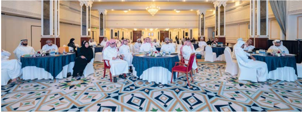
الحلقة في يومها الختامي ناقشت الفرص والتحديات في القطاع الخاص الخليجي

اختتمت وزارة الاقتصاد أمس الحلقة النقاشية السادسة لاستشراف الأفق المستقبلية للتكامل في المجالين الاقتصادي والتنموي الخليجي المشترك والتي تناولت موضوع (دور القطاع الخاص في تنوع الاقتصاد بدول مجلس التعاون الخليجي). وتضمنت محاور الحلقة أليات إيجاد قطاع خاص في المنطقة ذي تنافسية كبيرة وقادر على المنافسة على الصعيد العالمي، ودور القطاع الخاص في تحقيق مبادرات ومشروعات وبرامج التكامل الاقتصادي