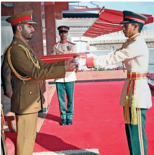
■ أثناء تسليم سيف الشرف للحاصل على المركز الأول