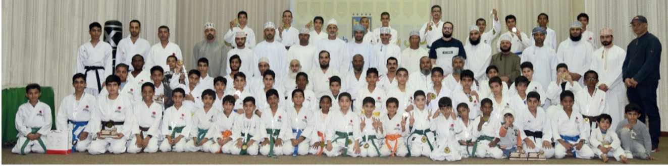
صورة جماعية للمشاركين في احتفالية أكاديمية الكاراتيه بنادي بهلاء

أهلي - د.ب.أ: صعد الأهلي إلى نهائي كأس السوبر المصري في الإمارات العربية المتحدة، عبر فوزه في الوقت القاتل على سيراميكاً كلبوياترا ١ / صفر على استاد محمد بن زايد في أبوظبي، ضمن الدور قبل النهائي. وجاء هدف الحسم للأهلي في الدقيقة الرابعة من الوقت بدل الضائع للمباراة، بنيران صديقة عن طريق جوستيك آرثر لاعب سيراميكاً بالخطأ في مرماه.