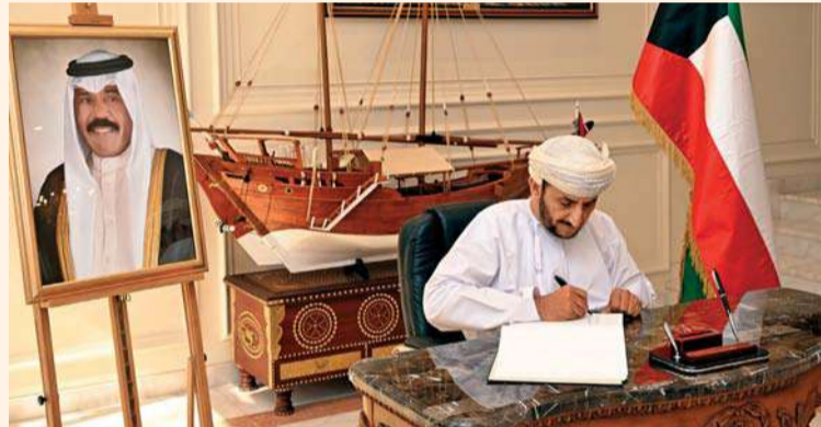
وأثناء تدوين عبارات التعزية والمواساة في سجل التعازي وفي ختام الزيارة دون أصحاب السعادة عبارات التعزية والمواساة في سجل التعازي بالسفارة، سائلين الله العلي العظيم أن يتعمد صاحب السمو الشيخ نواف الأحمد الجابر الصباح بالرحمة والمغفرة، وأن يُعَمَّ على دولة الكويت الشقيقة بدوام الأمن والرخاء.