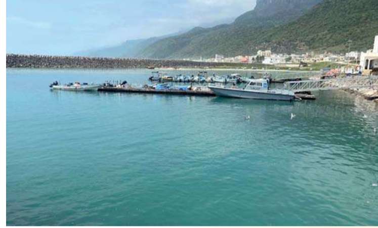
المشروع يهدف لمتابعة الظواهر التي تحدث جراء تأثير السموم البحرية

تنفذ وزارة الثروة الزراعية والسمكية وموارد المياه مشروع رصد ومراقبة السموم الحيوية البحرية في سواحل سلطنة عمان، ذي الأهمية من الجانبين الصحي والاقتصادي، بهدف حماية الأسماك والأحياء المائية من مخاطر السموم الحيوية البحرية والمحافظة على مصائد الأسماك والبيئة البحرية من مخاطر السموم والتلوث، ومتابعة الظواهر الطبيعية التي تحدث في البحر من جراء تأثير السموم الحيوية البحرية، مما له مردود اقتصادي مباشر في زيادة الإنتاج السمكي وإنتاجية الثروات البحرية الأخرى في سواحل سلطنة عمان. وقد قام المختصون في المديرية العامة للبحوث السمكية بالوزارة وفي المديرية العامة للثروة