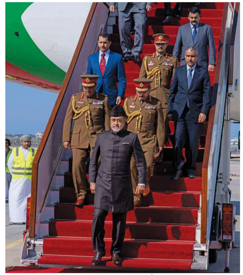
جلالة السلطان لدى عودته أمس إلى أرض الوطن

مسقط . نيودلهي . العُمانية: مكللاً بفضل الله ورعايته، عاد حضرة صاحب الجلالة السلطان هيثم بن طارق المعظم . حفظه الله ورعاه . ظهر أمس إلى أرض الوطن العزيز بعد أن اختتم زيارة «نولة» لجمهورية الهند الصديقة استغرقت ثلاثة أيام. وقد بعث حضرة صاحب الجلالة السلطان هيثم بن طارق المعظم . حفظه الله ورعاه . برفقة شكر وتقدير إلى فخامة الرئيسة دوربادي مورمو رئيسة جمهورية الهند ودولة ناريندرا مودي رئيس وزراء جمهورية الهند