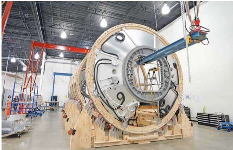
عرض النموذج الأولي لشركة أكسيوم سبيس مركبة أكسيوم هاب في منشأة تطوير محطة الفضاء التابعة لشركة أكسيوم سبيس في هيوستن، تكساس.

وقد لا يعرف الكثيرون شيئاً عن فوائد نبات الحرنكش فهو يحتوي على فيتامينات كثيرة وعناصر غذائية تقوي العظام وتخفض نسبة الكوليسترول في الجسم. كما أنه يساعد من يريدون تقليل الوزن. ويشبه حجم الحرنكش الذي يطلق عليه أيضاً «التوت الذهبي» واسمه العلمي physalis حجم طماطم الشيري أو أكبر قليلاً، وهو