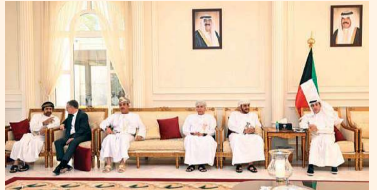
وأثناء تقديم واجب العزاء في وفاة المغفور له بإذن الله أمير الكويت الراحل مسقط. العمانية: قام عدد من أصحاب السعادة المسؤولين بوزارة الخارجية بزيارة مقر سفارة دولة الكويت الشقيقة في مسقط لتقديم واجب العزاء في المغفور له بإذن الله تعالى صاحب السمو الشيخ نواف الأحمد الجابر الصباح طيب الله ثراه.