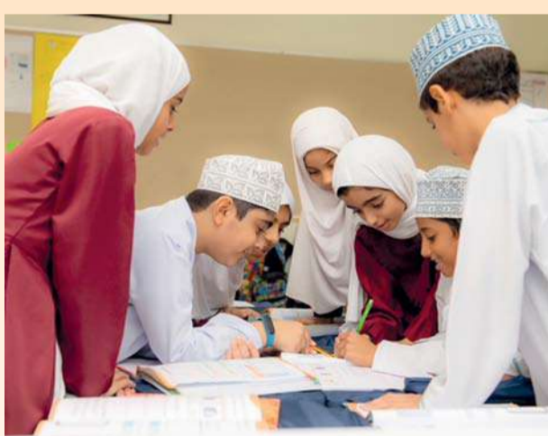
تطوير مهارات الطلبة من خلال مناهج تعليمية مطورة

وتبذل وزارة التربية والتعليم جهوداً جبارة في مجال تعليم اللغة العربية وتعلمها انطلاقاً من تنمية كفايات معلمي اللغة العربية، وترسيخها في نفوس الطلبة كإرث ديني وهوية لغوية وثقافية، كمشراكة سلطنة عمان في الدراسة الدولية لقياس مهارات القراءة (PIRLS26) تأكيداً لاهتمام الوزارة في رفع مستوى أداء طلبة سلطنة عمان في مهارات القراءة، وفهم المقروء، ومهارات التفكير العليا، وذلك من خلال تنفيذ المشاغل والدورات التدريبية والزيارات الميدانية للحقل التربوي. كما أولت الوزارة بالمعهد التخصصي للتدريب المهني للمعلمين اهتماماً خاصاً بمعلمي اللغة العربية، من خلال تنفيذ (٥) برامج تدريبية لهم، منها: برنامج اللغة العربية الموجه، لمعلمات المجال الأول وهو برنامج استراتيجي مدته عامان، وتم اعتماده بناء على نتائج الطلبة في الدراسة الدولية (PIRS2011)، بهدف تنمية الكفايات المهنية لمعلمات اللغة العربية مركزاً على طرق تدريس حديثة مواكبة للعصر المعلوماتي للمهارات اللغوية الأربع ( الاستماع ، التحدث ،