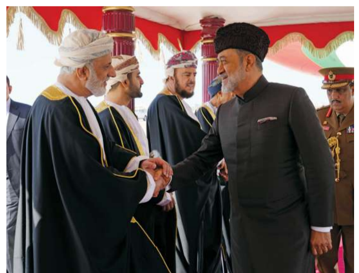
■ جلالة السلطان يصافح مستقبليه بالمطار السلطاني الخاص بعد زيارته دولة قام بهما جلالتُه لكل من جمهورية سنغافورة وجمهورية الهند

حفظه الله ورعاه. برفقة شكر وتقدير إلى فخامة الرئيسة دوربادي مومو رئيسة جمهورية الهند ودولة ناريندرا مودي رئيس وزراء جمهورية الهند لدى مغادرته، أعرب جلالة السلطان المعظم فيهما عن خالص شكره وتقديره لهما على ما استقبل به جلالتُه والوفد الرسمي المرافق له من حفاوة وتكريم كبيرين.