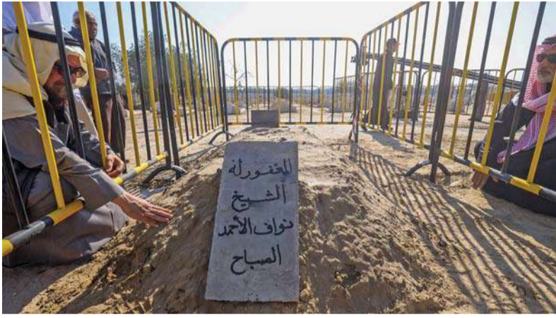
مشيوعون يبتهلون بجوار قبر أمير الكويت الراحل نواف الأحمد الصباح في مقبرة الصليبخات بمدينة الكويت.