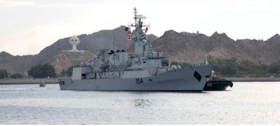
إحدى القطع البحرية المشاركة في المناورات

مسقط. العُمانية: بدأت أمس مجريات التمرين البحري العسكري المشترك (التمر الطيب)، والذي تنفذه البحرية السلطانية العُمانية بمشاركة عدد من سفن القوات البحرية بجمهورية باكستان الإسلامية الصديقة، وبإسناد من سلاح الجو السلطاني العُمانى. يتضمن التمرين الذي يُنفذ بمنطقة التمارين البحرية العديد من التطبيقات وفقاً لخطة التمرين المرسومة، ومنها تنفيذ عدد من التشكيلات والمناورات البحرية والتمارين الخاصة والعمليات البحرية، إلى جانب تبادل المعلومات والخبرات بين أطقم السفن المشاركة. وقد اشتمل انطلاق التمرين على إيجاز عن مراحل التمرين المختلفة، والبيان العملي والأهداف التدريبية المتوخاة من تنفيذه، وفقاً للأهداف التدريبية الموضوعية. يأتي تنفيذ التمرين البحري العسكري المشترك (التمر الطيب) ضمن إطار الخطط التدريبية السنوية التي تنتهجها البحرية السلطانية العُمانية، وخطط تبادل الخبرات مع بحريّات الدول الصديقة في كل ما من شأنه إدامة مستويات الجاهزية لأسطول البحرية السلطانية العُمانية ومنتسبيها في مختلف التخصصات البحرية، وبما يتماشى والمهام الوطنية المنوطة بها.