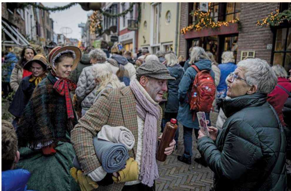
مشهد في الشارع خلال مهرجان ديكنز بمدينة ديفينتر بنيذرلاند، حيث تم تزيين جزء من وسط المدينة التاريخي بأجواء القرن التاسع عشر، مثل تلك الموجودة في كتب الكاتب الإنجليزي تشارلز ديكنز.

بكين. د. ب. أ. أطلقت الصين بنجاح، الصاروخ الحامل التجاري «إس كيو إس-١» إلى الفضاء، من مركز جيونتشوان لإطلاق الأقمار الصناعية في شمال غرب الصين. وأفادت وكالة أنباء الصين الجديدة (شينخوا)، أن الصاروخ انطلق في الساعة الثالثة عصراً (بتوقيت بكين) من موقع الإطلاق، ليرسل القمر الصناعي «ديير-١» إلى المدار المحدد. ويشير إلى أن المهمة تُعد السادسة للصاروخ الحامل التجاري «إس كيو إس-١».