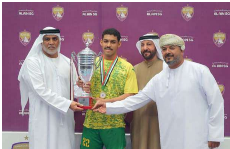
قائد فريق السيب يتسلم كأس البطولة