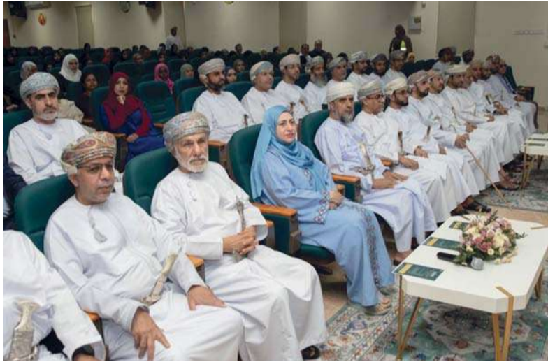
الحضور المشاركون بفعاليات يوم البحث العلمي