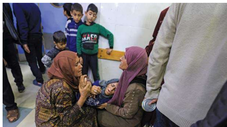
فلسطينيات ينتحن، بينما يتلقى الفلسطينيون المصابون جراء القصف الإسرائيلي العلاج بمستشفى ناصر في خان يونس.

القدس المحتلة. «الوطن». وكالات: استشهد عشرات الفلسطينيين وأصيب المئات بجروح مختلفة، في قصف إسرائيلي برّاً وجوّاً وبحراً، على مختلف مناطق قطاع غزة، فيما تحاصر آليات الاحتلال وتتوغل بعدد من المواقع بالقطاع. واستشهد ٢٠ على الأقل في قصف لطائرات الاحتلال تستهدف عدة منازل في البلدة القديمة من مدينة غزة ومحيط مستشفى المعمداني والجامع العمري الكبير. وتواصل آليات الاحتلال تواصل تمركزها في ميدان فلسطين بمدينة غزة، وتحاصر المستشفى المعمداني والبلدة القديمة من المدينة. وأشار إلى أن تسعة من عائلتي العمارين وحمود، استشهدوا في قصف مدفعي وإطلاق نار من الطائرات المسيّرة في حي الزيتون جنوب شرق مدينة غزة. فيما استشهد ستة جراء استهداف طائرات الاحتلال منزلًا قرب ديوان مشتهى في حي الشجاعية شرق مدينة غزة. وتحاصر آليات الاحتلال منطقة الصحابة واليرموك في حي الدرج، وسط قصف مدفعي مكثف خصوصاً في محيط مجمع الصحابة الطبي، الذي خرج عن الخدمة، وما زال يضم أعداداً من الجرحى والمصابين والمرضى، منهم ٥٠ امرأة على وشك الولادة. وفي حي النصر والشيخ رضوان من مدينة غزة، تواصل دبابات الاحتلال وآلياته عمليات التوغل والاحتكام في الحي وسط إطلاق النار من الطائرات المسيّرة وقصف صاروخي ومدفعي، ما أدى إلى ارتفاع عشرات الشهداء والجرحى، وما زال بعضهم في الطرقات، لعدم تمكن مركبات الإسعاف من الوصول إليهم، نتيجة التوغل المستمر. كما أن بعض الأهالي تمكنوا من دفن عدد من الشهداء في ساحات المنازل أو في