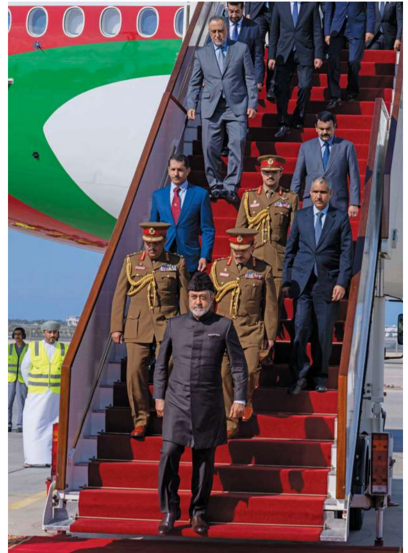
■ جلالة السلطان لدى عودته أمس إلى أرض الوطن

جلالته يشيد بما أتاحتها اللقاءات مع القيادة الهندية من فرصة لبحث العلاقات الثنائية التاريخية وسبل تطويرها والارتقاء بها نحو مراتب جديدة