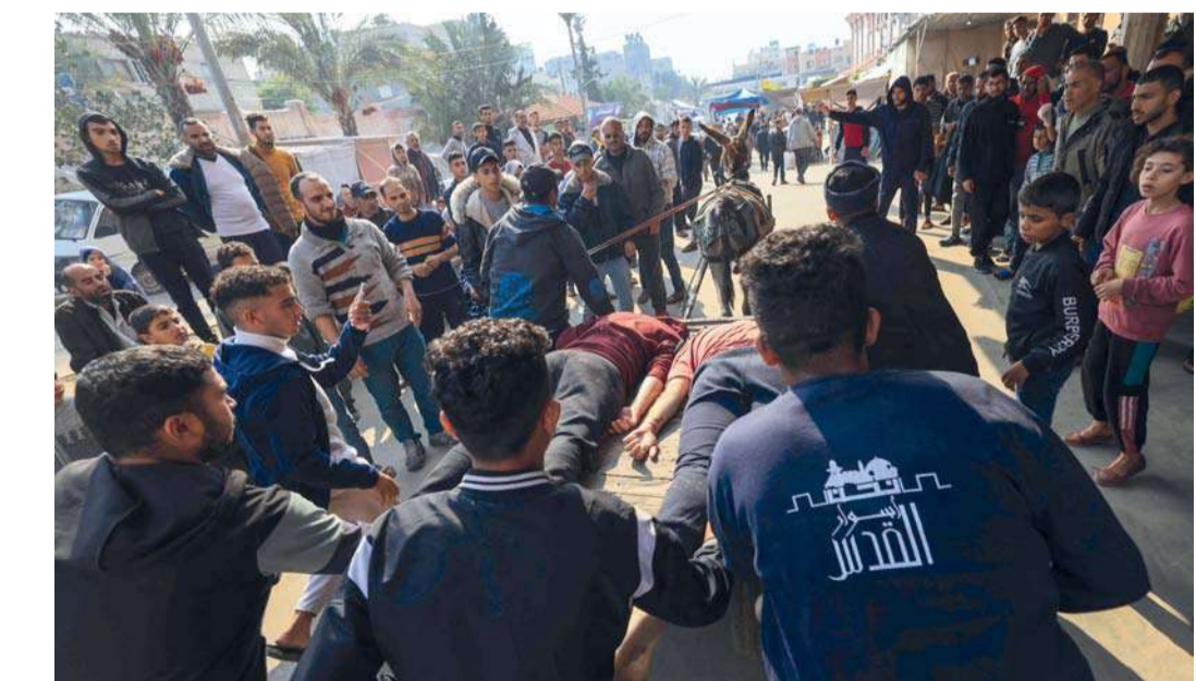
فلسطينيون ينقلون جثث شهداء ارتقوا في القصف الإسرائيلي وذلك على عربة يجرها حمار إلى مستشفى ناصر في خان يونس.

بدء مجريات «الثمر الطيب» مسقط . العُمانية: بدأت أمس مجريات التمرين البحري العسكري المشترك (الثمر الطيب)، والذي تفعّده البحرية السلطانية العُمانية بمشاركة عدد من سفن القوات البحرية بجمهورية باكستان الإسلامية الصديقة، وبإسناد من سلاح الجو السلطاني العُماني. يتضمن التمرين الذي يُنفذ بمنطقة التمارين البحرية العديد من التطبيقات وفقاً لخطة التمرين المرسومة، ومنها تنفيذ عدد من التشكيلات والمناورات البحرية والتمارين الخاصة والعمليات البحرية، إلى جانب تبادل المعلومات والخبرات بين أطقم السفن المشاركة. تفاصيل: ص ٤