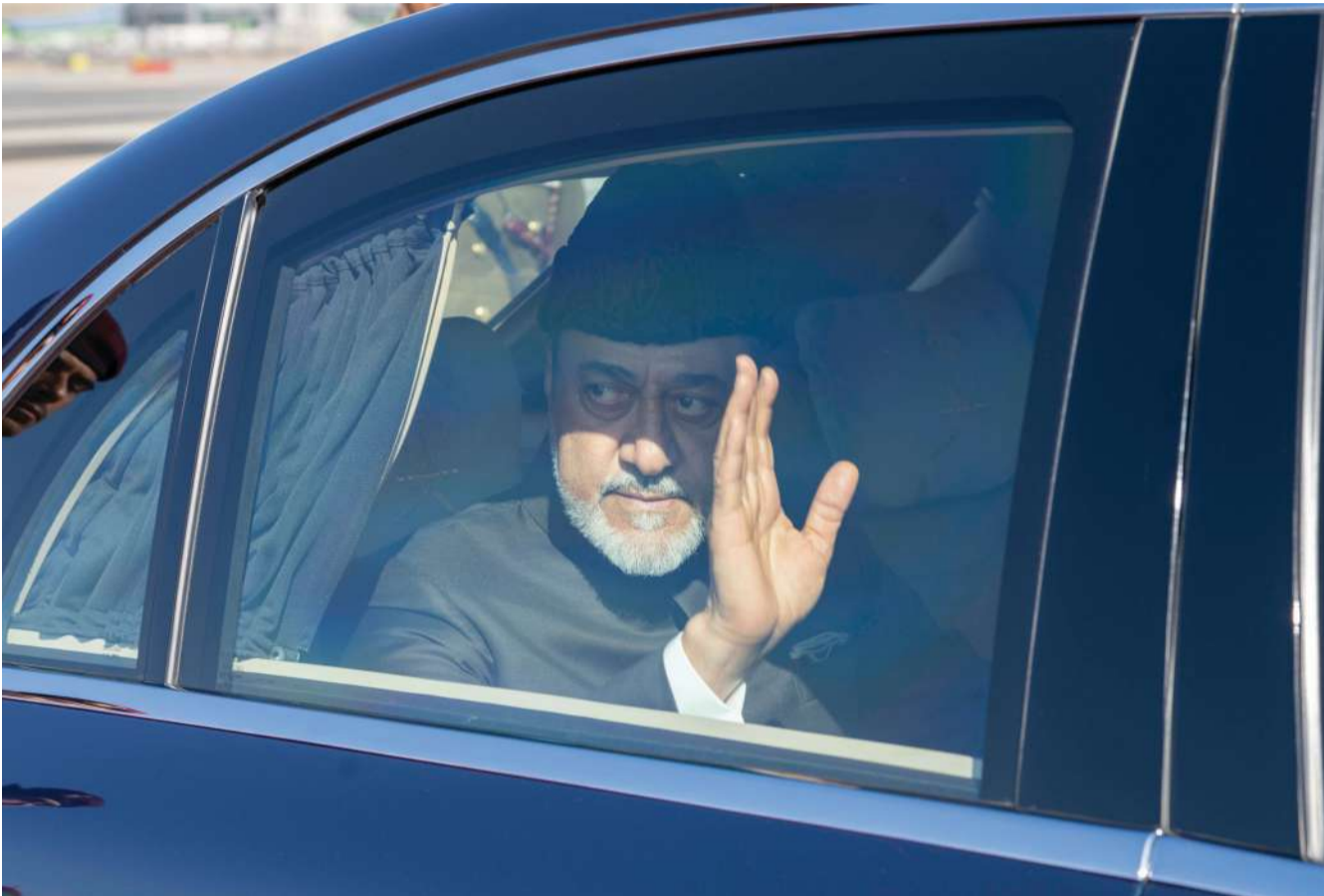
■ جلالتُه يُحيي استقباله بالمطار السلطاني الخاص