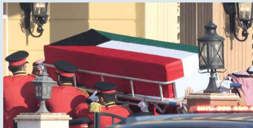
نعش أمير الكويت الراحل نواف الأحمد الصباح يُحمل إلى مسجد بلال بن رباح في مدينة الكويت.

الكويت . وكالات: تشيع الكويت أميرها الراحل الشيخ نواف الأحمد الجابر الصباح، الذي ووري الثرى صباح أمس بعد يوم من وفاته بحضور أفراد الأسرة الحاكمة، يتقدمهم أخوه الشيخ مشعل الذي نودي به أميراً. في مقبرة الصليبيخات بشمال غرب العاصمة، حمل نعش الأمير الذي رحل السبت عن ٨٦ عاماً، على الأكتاف وقد لف بعلم الكويت. ونقل التلفزيون الكويتي وقائع صلاة الجنازة في مسجد بلال بن رباح، حيث وقف أفراد الأسرة بخشوع وفي مقدمتهم الأمير مشعل الأحمد الجابر الصباح (٨٣ عاماً). وشارك رئيس مجلس الأمة في الجنازة، فيما أدت مساجد الكويت صلاة الغائب على الأمير الذي رحل بعد ثلاث سنوات من توليه الحكم. تفاصيل: ص ٥