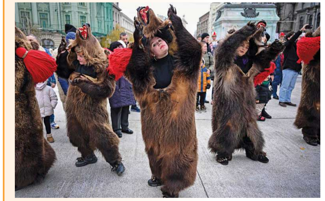
راقصون قادمون من منطقة مولدوفا التاريخية يرتدون جلد دب، ضمن الاحتفال بمهرجان التقاليد الشتوية الدولي في بوخارست برومانيا.

جرايتس (ألمانيا). د. ب. أ. تخيل أن تذهب للتسوق لابتياع مستلزماتك اليومية العادية، فترى امرأة تحمل سيف ساموراي وكأنك داخل فيلم سينمائي! هذا ما واجهه زبائن وبائعون في أحد المتاجر في مدينة جرايتس بشرق ألمانيا. وذكرت الشرطة الألمانية أن امرأة كانت تحمل سيف ساموراي خلال التسوق تسببت في عملية شرطية في تلك المدينة. وأوضحت الشرطة أن الزبائن وكذلك البائعين بالمتجر اتصلوا بالشرطة، عندما رأوا المرأة تحمل السيف الذي يبلغ طوله ٧٠ سنتيمتراً تقريباً داخل المتجر.