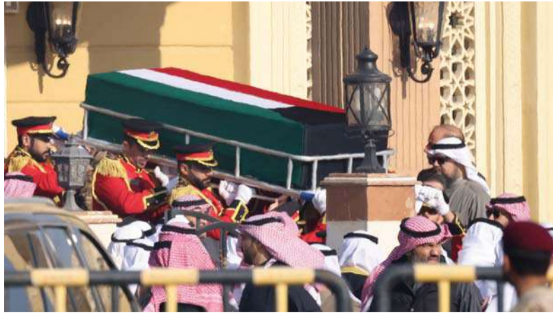
نعش أمير الكويت الراحل نواف الأحمد الصباح يُنقل من مسجد بلال بن رباح في مدينة الكويت قبل دفنه بمقبرة الصليبخات.

الكويت. وكالات: ودعت الكويت أميرها الراحل الشيخ نواف الأحمد الجابر الصباح الذي ووري الثرى صباح أمس بعد يوم من وفاته بحضور أفراد الأسرة الحاكمة، يتقدمهم أخوه الشيخ مشعل الذي نودي به أميراً. في مقبرة الصليبخات بشمال غرب العاصمة، حمل نعش الأمير الذي رحل السبت عن ٨٦ عاماً، على الأكتاف وقد لف بعلم الكويت. ونقل التلفزيون الكويتي وقائع صلاة الجنازة في مسجد بلال بن رباح، حيث وقف خلالها أفراد الأسرة بخشوع على رأسهم الأمير مشعل الأحمد الجابر الصباح (٨٣ عاماً). وشارك رئيس مجلس الأمة في الجنازة، فيما أدت مساجد الكويت صلاة الغائب على الأمير الذي رحل بعد ثلاث سنوات من توليه الحكم. وقال بدر السيف، أستاذ التاريخ في جامعة الكويت، إن حجم المراسم «يعكس شخصية الأمير الراحل الذي لم يكن محباً للأضواء». وأعلنت الكويت الحداد أربعين يوماً ونكست الأعلام، كما أغلقت المؤسسات الحكومية حتى يوم غد. وعمّ الهدوء أرجاء الكويت مع تلاوة آيات من القرآن، وخيم عليها الحزن، فيما علت في الشوارع شاشات أصدت بمنابح الأمير الراحل كتب على بعضها «رحم الله أمير الحكمة والتسامح والسلام».