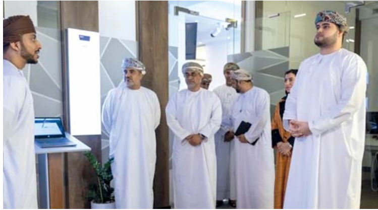
الزيارة تأتي ترجمة لأهداف برنامج الشركات الناشئة العمانية الواعدة

التي يمكن استغلالها لتوسيع نمو هذه الشركات، كما أن الزيارات أيضا تأتي كأحد خطط البرنامج لعام ٢٠٢٣ م، وأحد المحاور التي تكشف