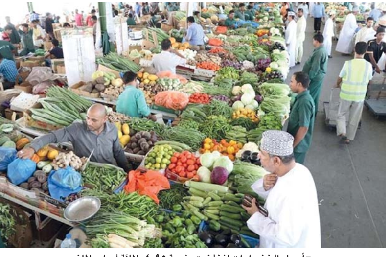
■ أسعار الخضراوات انخفضت بنسبة ٤,٩٥ بالمائة فبراير الماضي

الماضي مقارنة بالشهر المماثل من عام ٢٠٢٢م، كمجموعة المواد الغذائية والمشروبات غير الكحولية، ارتفع مؤشر أسعار الزيوت والدهون بنسبة ١٩,٥٧ بالمائة، وأسعار الأسماك والأغذية البحرية بنسبة ١٢ بالمائة، وأسعار الحليب والجبن والبيض بنسبة ١٠,١١ بالمائة، وأسعار المشروبات غير الكحولية بنسبة ٥,٢٣ بالمائة، وأسعار الخبز والحبوب بنسبة ٥,٠٤ بالمائة، ومؤشر أسعار اللحوم بنسبة ٤,٢٩ بالمائة، وأسعار المواد الغذائية الأخرى بنسبة ٤,٢٥ بالمائة، وأسعار السكر والمربي والعسل والحلويات بنسبة ٣,٢٢ بالمائة، وأسعار الفواكه بنسبة ٢,٧٤ بالمائة، في حين أظهرت مجموعة الخضراوات انخفاضاً بنسبة ٤,٩٥ بالمائة.