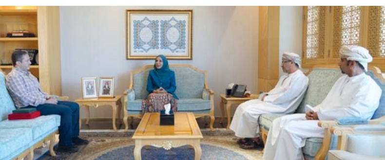
مديحة الشيبانية أثناء استقبالها مازن قببسي

الدكتورة الوزيرة خلال اللقاء على أهمية الرياضة المدرسية ودورها في صقل شخصية الطالب وتنمية مهاراته وقدراته البدنية، مشيدة معاليها بالدور الذي يقوم به الاتحاد العماني للرياضة المدرسية في هذا المجال من خلال الفعاليات التي يقيمها ومشاركاته المتنوعة.