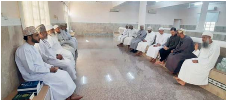
البرنامج تضمن عدداً من الفعاليات التوعوية