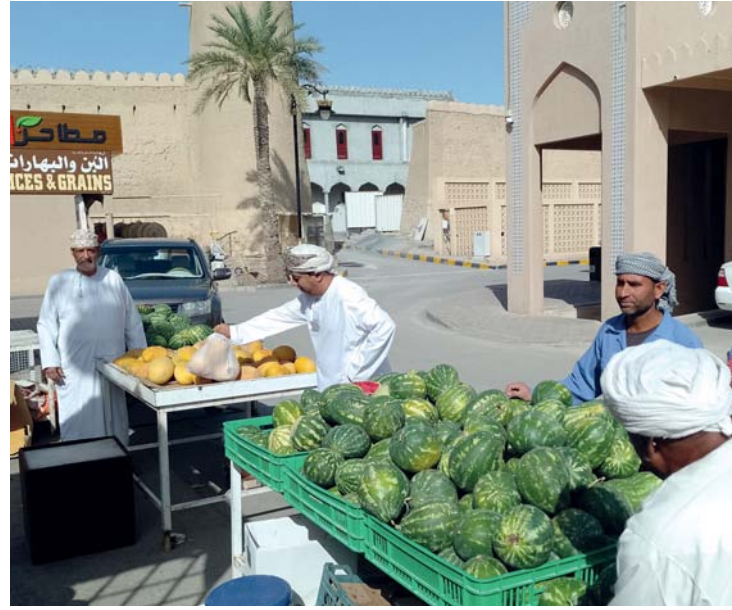
سوق نزوى شهد وفرة من محصول الجح والشمام

نحرص على توفير هذه الفاكهة المفضلة لدى الصائم، ولذلك دائما ما نبحث ونتواصل مع المزارعين بغرض شراء محصول هذه الفاكهة وتوفيرها في سوق نزوى، حيث يتم التنسيق مع المزارعين بغرض العرض والبيع قبل فترة من بداية قطف وطرح محصول الجح والشمام المحلي.