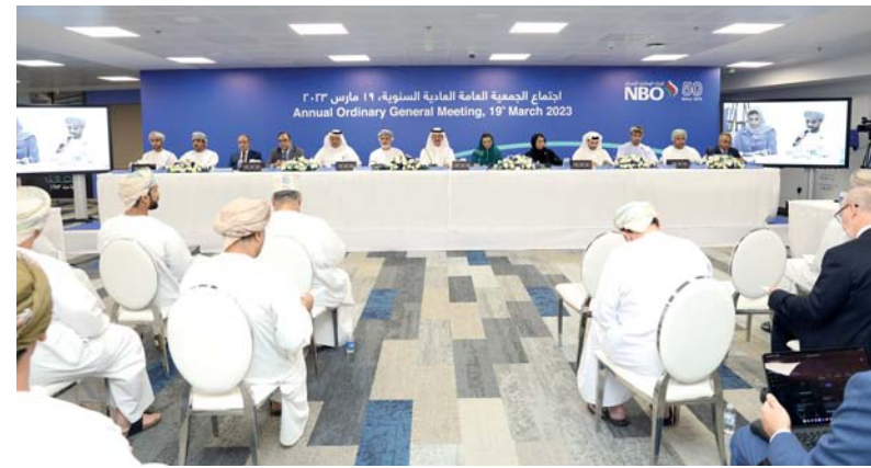
اجتماع الجمعية العامة العادية السنوية للبنك الوطني العماني

وتأكيد مكانتنا كبنك على أتم جاهزية للمستقبل. وأوضحت أنه خلال العام الماضي، سجل البنك الوطني العماني صافي أرباح بلغت ٤٨,٢ مليون ريال عماني بزيادة بنسبة ٥٩,٢ بالمائة عن العام ٢٠٢١م. وبلغ صافي الفوائد ١٠٣,٥ مليون ريال عماني بزيادة بنسبة ١٣,١ بالمائة مقارنة بـ ٢٤,٠ مليون ريال عماني خلال عام ٢٠٢١م. وبلغ إجمالي القروض والسلفيات ٣,٥١ مليار ريال عماني حتى ديسمبر الماضي بارتفاع بنسبة ٨,٤ بالمائة مقارنة بعام ٢٠٢١م. وبلغت ودائع العملاء ٣ مليارات ريال عماني. واستقر رأس المال من المستوى الأول ونسبة كفاية رأس المال حتى ديسمبر الماضي عند ١١,٩ بالمائة و ١٦,٩ بالمائة على التوالي.