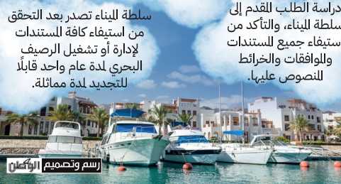
رسم وتصميم الطائي

منح مقدم الطلب الموافقة البديئية من قبل سلطة البناء، وذلك إلى حين استيفاء موافقة الجهات المعنية والخاصة.