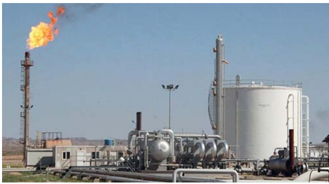
انهيار المؤسسات المالية الكبيرة أثر على أسعار النفط بشكل مباشر

مع السوق النفطية كونها مرتبطة ارتباطاً كبيراً بالبترول، وكل تعاملات التجار ومصدري وموردي النفط مع البنوك العالمية، لذلك أي تأثير في هذه البنوك سوف تتأثر به الأسواق الأخرى من ضمنها سوق النفط. من جانبه أوضح الدكتور أحمد بن خميس الهادي أكاديمي بجامعة السلطان قابوس أن الانخفاض الذي شهدته أسعار النفط أخيراً ليس بسبب أسس الطلب والعرض وإنما بسبب التخوف من أزمة مالية متوقعة ناتجة عن أزمة البنوك الأخيرة في الولايات المتحدة وأوروبا، متوقفاً أن تعاود الأسعار الارتفاع ببطء وتستقر قليلاً حتى يكمل دورة انعاشه. وأشار إلى أن ارتفاع النفط سيكون بتدرج، مدفوعاً ببعض الإجراءات المتخذة في الولايات المتحدة وعودة الثقة لدى المستثمرين بشكل تدريجي وزيادة الطلب من بعض الاقتصاديات مثل الصين، حسب ما أعلنت منظمة أوبك توقعاتها في ٢٠٢٣ م.