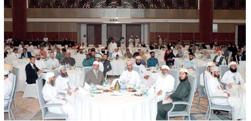
راعي المناسبة والحضور أثناء الفعالية

تفاعلية لغير المسلمين وهي معلومات عامة عن الدين الإسلامي شارك فيها الحضور الذي يزيد عن ثلاثمائة شخص من الرجال والنساء، وعروض مرئية وتفاعلية (عمان في عيونهم) أعرب فيها الحضور عن تجربة العيش في عمان والانسجام في المجتمع العماني.