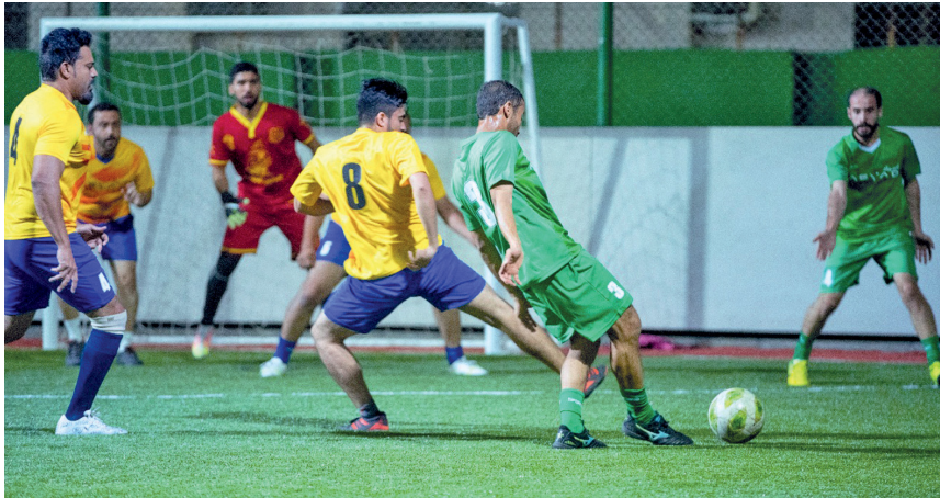
صورة أرشيفية من مباريات البطولة الكروية لمجموعة أسيا

يجري منتخبنا الوطني الأول لكرة القدم آخر تدريباته في الساعة العاشرة مساء اليوم على ساحة الملعب الرئيسي بمجمع السلطان قابوس الرياضي ببوشر بقيادة مدربه الكرواتي برانكو إيفانكو فيتش، وتأتي حصّة مساء اليوم بمثابة الاستعداد الأخير والبروفة النهائية لمواجهة الغد الودية أمام المنتخب اللبناني الشقيق في العاشرة مساء بذات ملعب التدريبات، حيث تعتبر هذه المواجهة الودية بمثابة الكنز الذي يبحث عنه برانكو من أجل الوصول للمستويات الفعلية والقدرات الفنية للاعبين الذين انضموا للقائمة مؤخرا قبل أن نصل إلى المراحل الأخيرة في مشوار استعدادات الأحمر الكبير للاستحقاقات القادمة وأهمها نهائيات آسيا التي ستقام في الدوحة ٢٠٢٤ وتصفيات مونديال كندا .