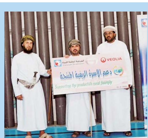
المبادرة تستهدف مساعدة الأسر المتعففة وذوي الدخل المحدود

بالشرقية لتحلية المياه ليست هذه المبادرات وليدة اليوم ولكن الشرقية لتحلية المياه تعكس صورة حديثة عن المسؤولية الاجتماعية حيث قامت بتطوير