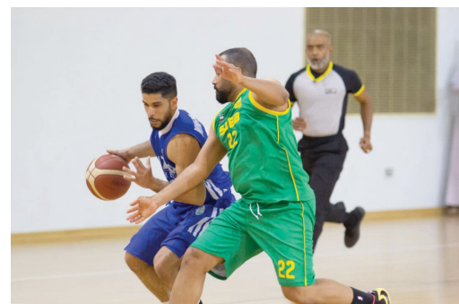
منافسة مثيرة متوقعة للنسخة الثانية عشرة لدرع الوزارة للسلة

ويقام نظام البطولة هذا الموسم في الدور الاول بنظام الدوري من دور واحد وسيلتقي في الدور قبل النهائي صاحب المركز الأول في المجموعة الأولى مع صاحب المركز الثاني في المجموعة الثانية، ويلتقي صاحب المركز الأول في المجموعة الثانية مع صاحب المركز الثاني في المجموعة الأولى والفائزان يصعدان للمباراة النهائية والخاسران سيلعبان على المركز الثالث، بينما ستختتم منافسات المسابقة في الأول من أبريل القادم وتقام جميع منافساتها على الصالة الفرعية في مجمع السلطان قابوس الرياضي ببوشر.