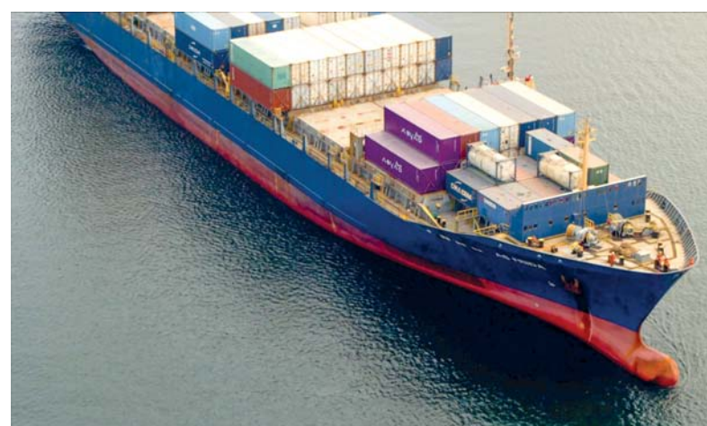
■ ٥٤ مليون ريال عماني صافي أرباح مجموعة «أسياذ» بنهاية العام الماضي

وأشار الرئيس التنفيذي لـ (أسياذ للنقل البحري والحوض الجاف بمجموعة أسياذ) إلى أن إجمالي السفن بأسطول أسياذ للنقل البحري بلغ ٨٤ ناقلة بمختلف الاستخدامات بنهاية العام الماضي، منها ٥٥ ناقلة تمتلكها الشركة، حيث تدير الشركة ٤٨ سفينة من مجمل السفن المملوكة لها. موضحة أن الشركة تمتلك ١٥ سفينة من ناقلات النفط العملاقة، و١٥ سفينة من ناقلات الغاز الطبيعي في حين تمتلك سفينة واحدة للحاويات وتشغل ٥ سفن أخريات