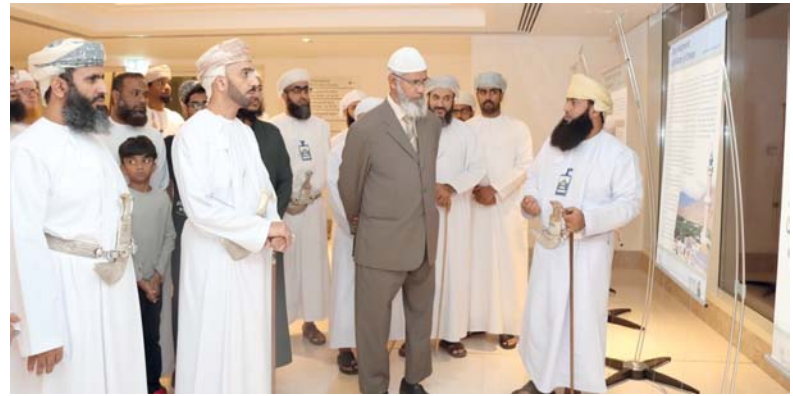
..ويطلع على محتويات المعرض المصاحب

كما صاحبت الفعالية معرض مصاحب احتوى على عدد من الأركان منها: ركن معرض رسالة الإسلام من عمان الذي تضمن عدداً من اللوحات التوعوية بالإسلام وبعض المعالم العمانية التي تحكي تاريخ المساجد والعمارة الإسلامية العمانية. وغيرها من اللوحات التي تعكس الصورة الصحيحة للإسلام، وكذلك ركن خاص للمرأة الذي يبين مكانة المرأة في الإسلام. وفي ختام الفعالية قام راعي المناسبة والحضور بتكريم الرعاية والداعمين للفعالية. يذكر أن دائرة التعريف بالإسلام هدفت أن يكون الإفطار وأداء الصلاة أمام الجميع وعبر الناشطات لكي يرى غير المسلمين كيف يؤدي المسلمون الصلاة في صفوف منتظمة مما يكون له الأثر لغير المسلم.