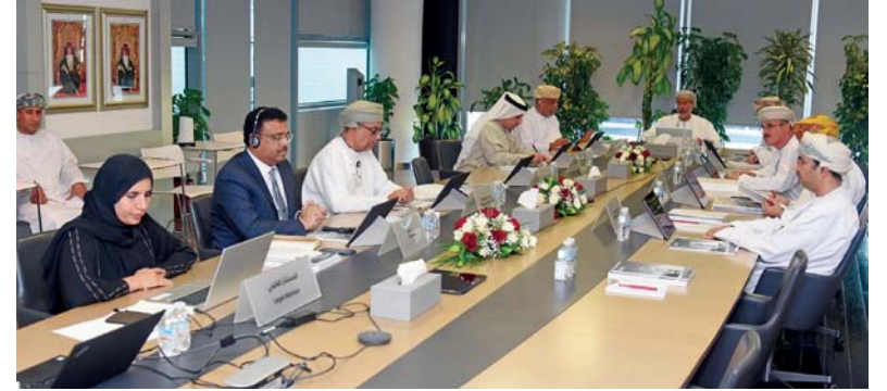
اجتماع الجمعية العامة العادية السنوية لمساهمي بنك مسقط