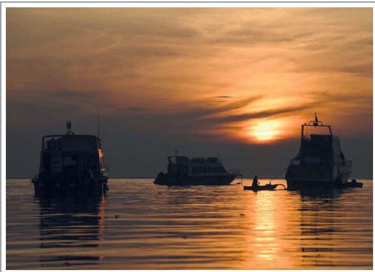
لحظة شروق الشمس في جزيرة سيرانجان عاصمة جزيرة بالي الإندونيسية

قال مسؤولون بمجال الفضاء في موسكو إن كسبولة الفضاء الروسية المعيبة ستعود إلى الأرض بعد غد الثلاثاء، قادمة من محطة الفضاء الدولية بدون أحد على متنها. وذكرت وكالة روسكوزموس الروسية للفضاء أنه من المقرر أن تغادر المركبة «سويوز إم إس٢٢» محطة الفضاء الدولية ظهر الثلاثاء بتوقيت موسكو وتصل إلى الأرض بعدها بالقرب من مدينة جيزركازجان في كازاخستان. وليس هناك رواد فضاء على متن الكسبولة، لكن سيتم شحنها بمعدات علمية ونتائج أبحاث علمية جرت في المدار.