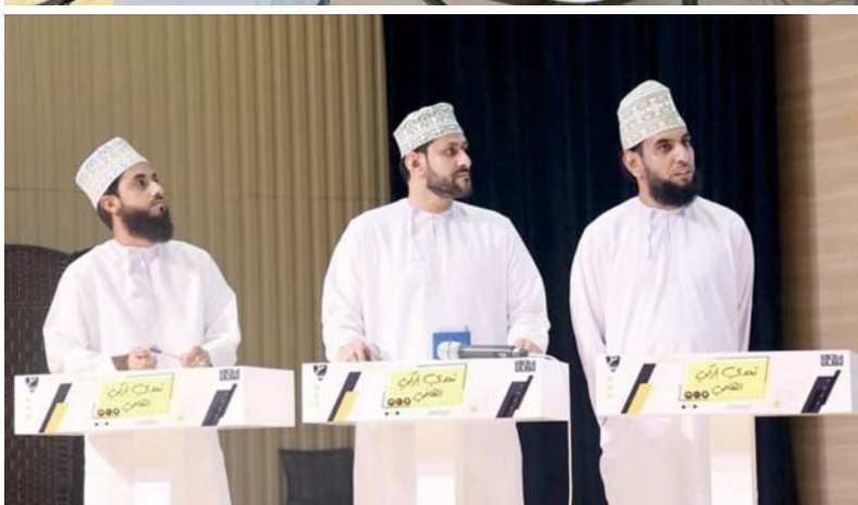
المسابقات تضمنت مجالات ثقافية متنوعة