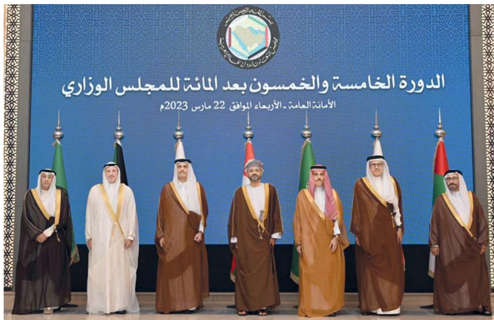
صورة جماعية لأصحاب السمو والمعالى وزراء خارجية دول مجلس التعاون أثناء مشاركتهم في اجتماع المجلس الوزاري بالرياض

■ سلطنة عمان تتراس اجتماع الدورة الـ (١٥٥) للمجلس الوزاري الخليجي