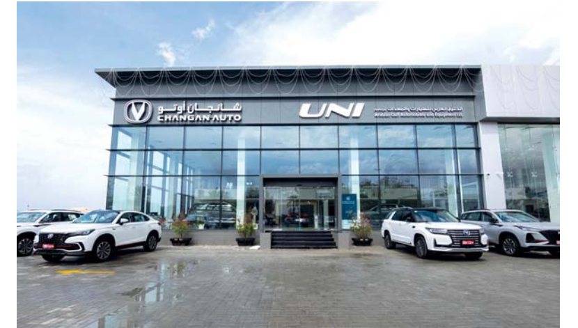
صالة عرض شانجان بصحار تقام على مساحة ١٢٠٠ متر مربع