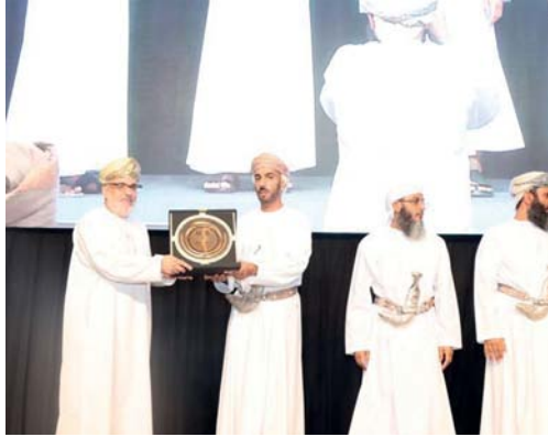
خلال تكريم الوطن