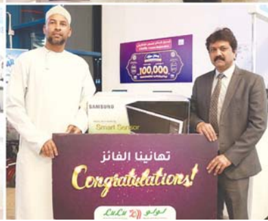
جوائز وقسائم متنوعة للفائزين بحملة لؤلؤ هايبر ماركت.