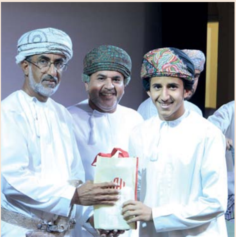
تكريم أحد حفظة القرآن الكريم