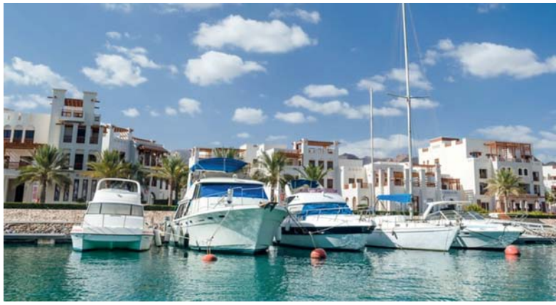
رفع جودة الموانئ والأرصفة البحرية وموائمتها مع متطلبات السلامة البحرية

وقال: تم أيضا إصدار ترخيص لإدارة وتشغيل أرصفة تجارية وهي: الرصيف التجاري المخصص لرسو القوارب الخدمية التابع للشركة العمانية للغاز الطبيعي بولاية صور ويبلغ طول الرصيف (١٥٠ مترا) والرصيف التجاري التابع لشركة الشروق للمناولات والملاحة البحرية ويبلغ طول الرصيف (٣٠٥ أمتار).