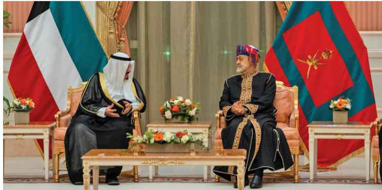
جلالة السلطان لدى استقباله رئيس مجلس الوزراء الكويتي