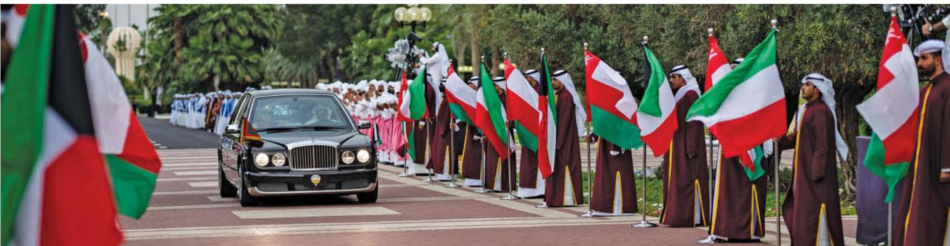
مراسم استقبال رسمية ترحيباً بالمقدم الميمون لجلالة السلطان

كما تمّ خلال الجلسة استعراض العلاقات الأخوية التاريخية الراسخة بين البلدين والشعبين الشقيقين، والتي تحظى بدعم ثابت ورعاية مستمرة من القيادتين الحكيمتين، إضافة إلى بحث سبل الارتقاء بمجالات التعاون والشراكة القائمة في مختلف القطاعات بما يعود على شعبي البلدين الشقيقين بالخير والنماء، كما تبادل الجانبان وجهات النظر والرؤى حيال الملفات والقضايا الإقليمية والدولية. ■