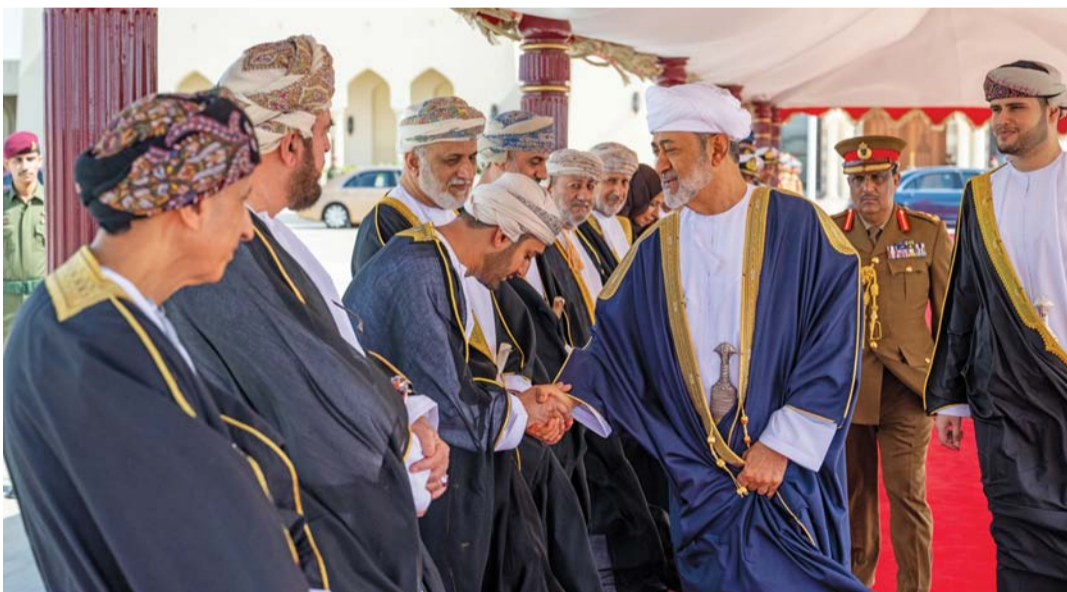
جلالة السلطان يصافح مودعيه بالمطار السلطاني الخاص لدى مغادرة جلالته أمس البلاد متوجَّهاً إلى دولة الكويت

الكويت. مسقط. العُمانيّة: عقد حضرة صاحب الجلالة السلطان هيثم بن طارق المُعظم وأخوه حضرة صاحب السُمُو الشيخ مشعل الأحمد الجابر الصباح أمير دولة الكويت. حفظهما الله ورعاهما. مساء أمس جلسة مباحثات رسمية بقصر بيان في العاصمة الكويت.