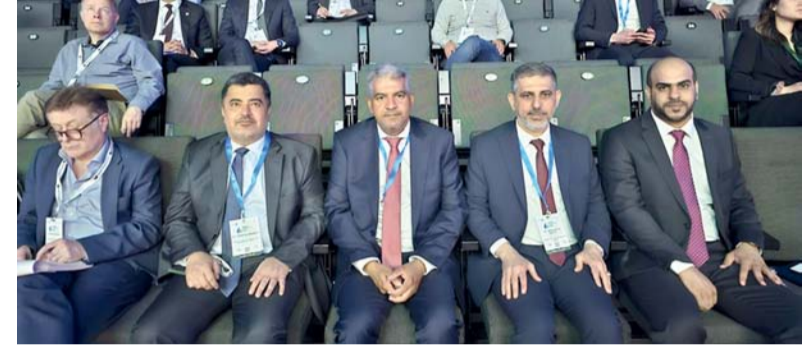
وفد سلطنة عمان خلال مشاركته في القمة

مسقط. العمانية: أشار البنك المركزي العماني إلى أن إجمالي قيمة أذون الخزانة الحكومية المخصصة لهذا الأسبوع بلغ ٣٣ مليون ريال عماني. وأوضح البيان الصادر عن البنك المركزي أمس أن قيمة الأذون المخصصة لمدة استحقاق تبلغ ٢٨ يوماً سجلت مبلغاً وقدره ٨ ملايين ريال عماني، وذلك بمتوسط سعر مقبول بلغ ٩٩٫٦٤٥ ريال عماني، ووصل أقل سعر مقبول إلى ٩٩٫٦٤٥ لكل ١٠٠ ريال عماني، فيما بلغ متوسط سعر الخصم ٢٦٧٦٨٫٤ بالمائة. وفي حين بلغت قيمة الأذون المخصصة لمدة استحقاق