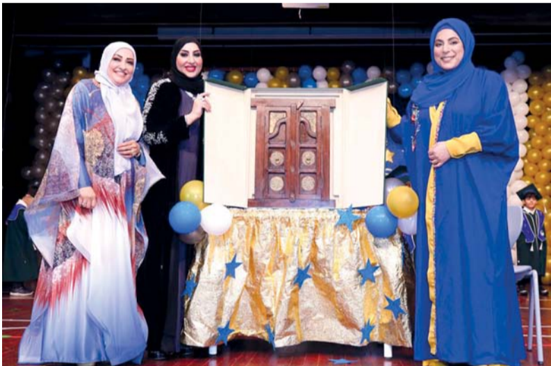
أثناء تقديم هدية تذكارية لراعية الحفل