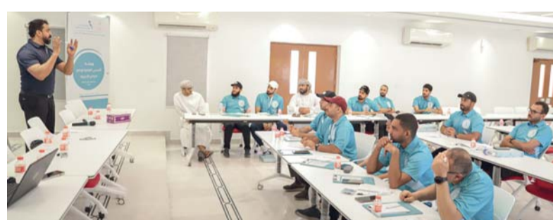
شهاب الرياضي أثناء تقديم محاضراته في اليوم الأول للبرنامج

في اليوم الأول في محاضراته عن الاحماء والتهدئة في الوحدة التدريبية، كتحريف الاحماء وأهميتها، وتناول عن الإطالات العضلية تعريفها وأنواعها وأهميتها، وكذلك تعريف التهدئة الاحماء في الألعاب الرياضية، كما تناول الرياسي في محاضراته عن الألعاب التمهيدية والأسباب الرئيسية لاستخدامها وأهداف هذه الألعاب وكذلك المبادئ الأساسية وقواعدها للتعليم الحكي، كما شهد اليوم الأول محاضرة عن التخطيط في التدريب الرياضي وأهداف ذلك التخطيط وأهميته وكيفية تصميم خطط التدريب.