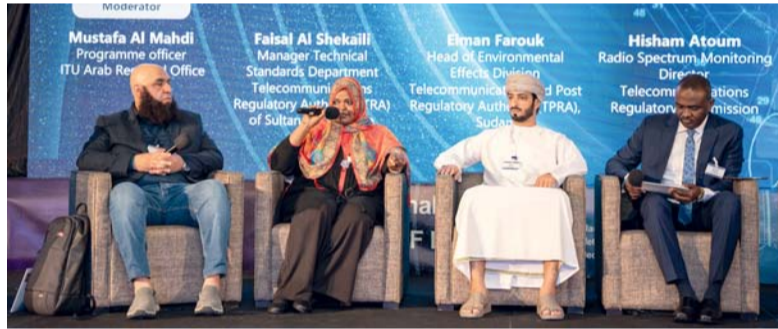
أوراق العمل ناقشت أهمية تقييم وقياس مستويات المجالات الكهرومغناطيسية

المغناطيسي أو كثافة الطاقة. وتضمنت حلقة العمل عدداً من الجلسات وأوراق العمل في قطاع المجالات الكهرومغناطيسية، منها أهمية تقييم وقياس مستويات المجالات الكهرومغناطيسية، والتي تجمع بين الخبراء للتحقق في ضرورة وضع مبادئ توجيهية وبروتوكولات لتقييم مستويات المجالات الكهرومغناطيسية حيث سيختص المشاركون أفكاراً بشأن التحديات والفرص المرتبطة بقياس مستويات المجالات الكهرومغناطيسية. كما تضمنت حلقة العمل استعراض تأثير الخطط الحضرية على قطاع الاتصالات وعمليات تنظيم أبراج الاتصالات وعدد من اللوائح القانونية المتعلقة بإنشاء أبراج الاتصالات، ومعالجة التحديات والصعوبات.