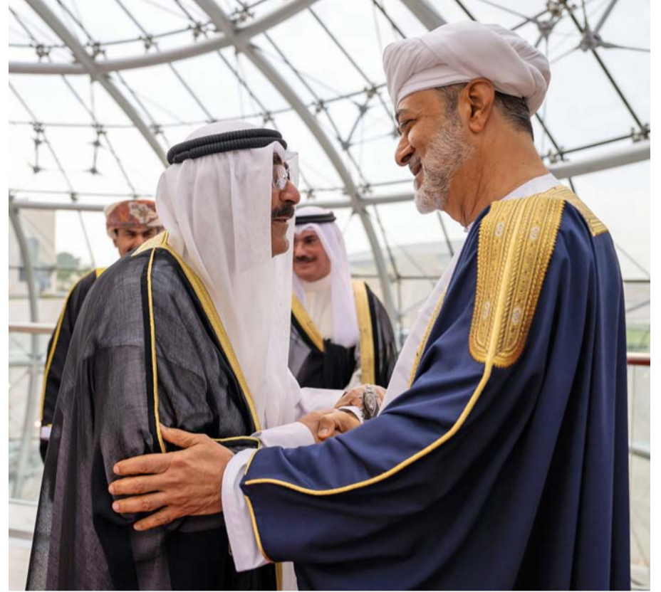
جلالة السلطان لدى وصوله أمس الكويت ومشعل الأحمد في مقدمة المستقبليين والمُرحِّبين بجلالته

في مقدمة المستقبليين والمُرحِّبين بجلالة عاهل البلاد المُفدى.