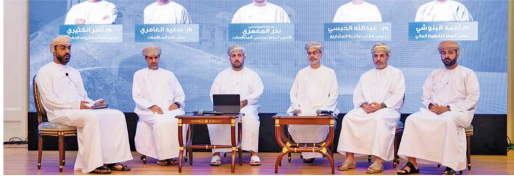
ملتقى المشاريع الإنمائية يعزز من تكافؤ الفرص وشفافية الطرح