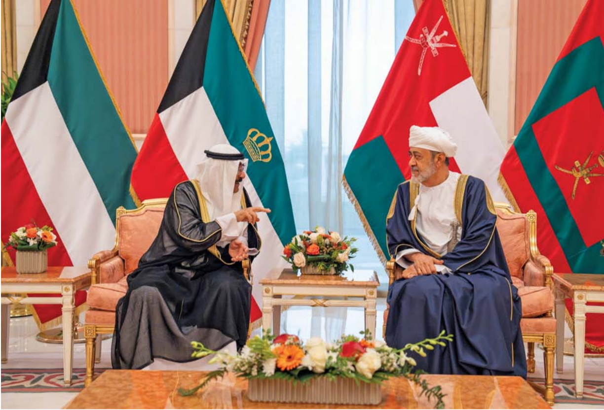
جلالة السلطان وأمير الكويت أثناء جلسة المباحثات الرسمية في قصر بيان أمس