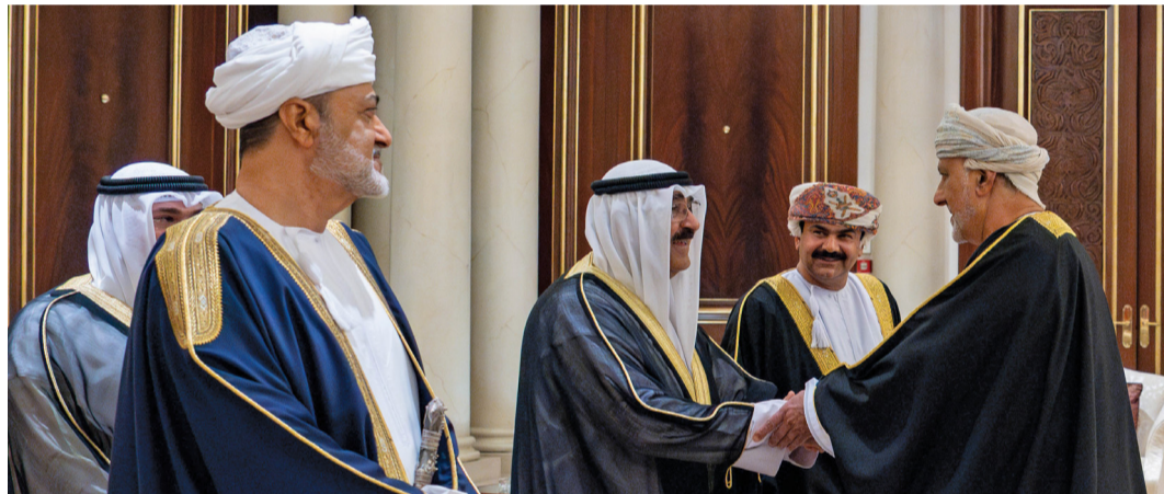
أمير الكويت يصافح شهاب بن طارق