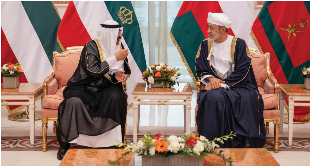
جلالة السلطان وأمير الكويت أثناء جلسة المباحثات الرسمية في قصر بيان بالعاصمة الكويت

مسقط. العمانية: بناء على التكليف السامي لحضرة صاحب الجلالة السلطان هيثم بن طارق المعظم - حفظه الله ورعاه - تسلم صاحب السمو السيد أسعد بن طارق آل سعيد نائب رئيس الوزراء لشؤون العلاقات والتعاون الدولي والممثل الخاص لجلالة السلطان وسام القائد المنوح لجلالته. أباه الله. من البرلمان العربي، وهو أعلى وسام يمنحه البرلمان للقادة العرب؛ تقديراً و عرفاناً لجهود جلالته الخيرة في خدمة قضايا الأمة العربية ومساعدته الحثيثة في دعم العمل العربي المشترك.