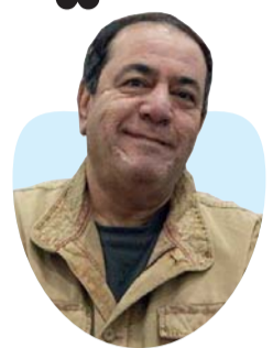
أ.د. محمد الدعيمي كاتب وباحث أكاديمي عراقي

أطلقت الثقافة الأميركية الشائعة على هذا النوع من الرجال والنساء المتزوجين (المعتنين بأبنائهم وأبائهم) تعبيرًا طريفًا يستحق الملاحظة: وهو «جيل الساندويش»..