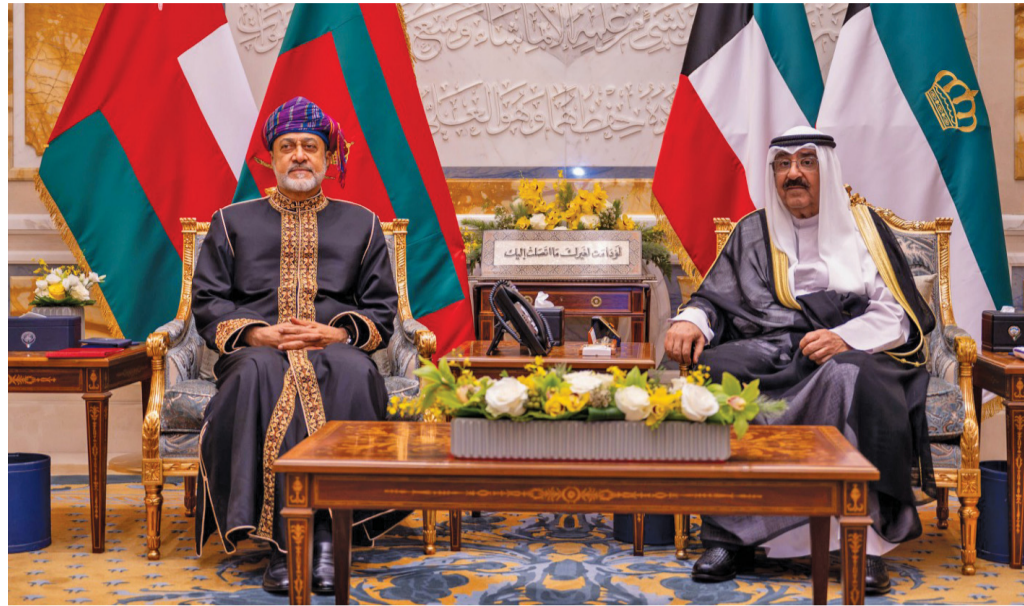
جلالة السلطان وأمير الكويت أثناء مأدبة العشاء بقصر بيان

الكويت. العمانية: استقبل حضرة صاحب الجلالة السلطان هيثم بن طارق المعظم. حفظه الله ورعاه. مساء أمس معالي الشيخ أحمد عبدالله الأحمد الصباح رئيس مجلس الوزراء بدولة الكويت الشقيقة، في مقر إقامته بالعاصمة الكويت؛ وذلك في إطار زيارة «دولة» يقوم بها جلالة إلى دولة الكويت. تم خلال المقابلة تبادل الأحاديث الودية والتأكيد على متانة العلاقات الأخوية التاريخية بين البلدين وسبل تعزيزها في شتى المجالات بما يعود بالنفع والخير على الشعبين العماني والكويتي الشقيقين. حضر المقابلة من الجانب العماني صاحب السمو السيد بلعرب بن هيثم آل سعيد. فيما حضرها من الجانب الكويتي سمو الشيخ صباح خالد حمد الصباح رئيس بعثة الشرف، وسعادة السفير الدكتور محمد ناصر الهاجري سفير دولة الكويت المعتمد لدى سلطنة عُمان.