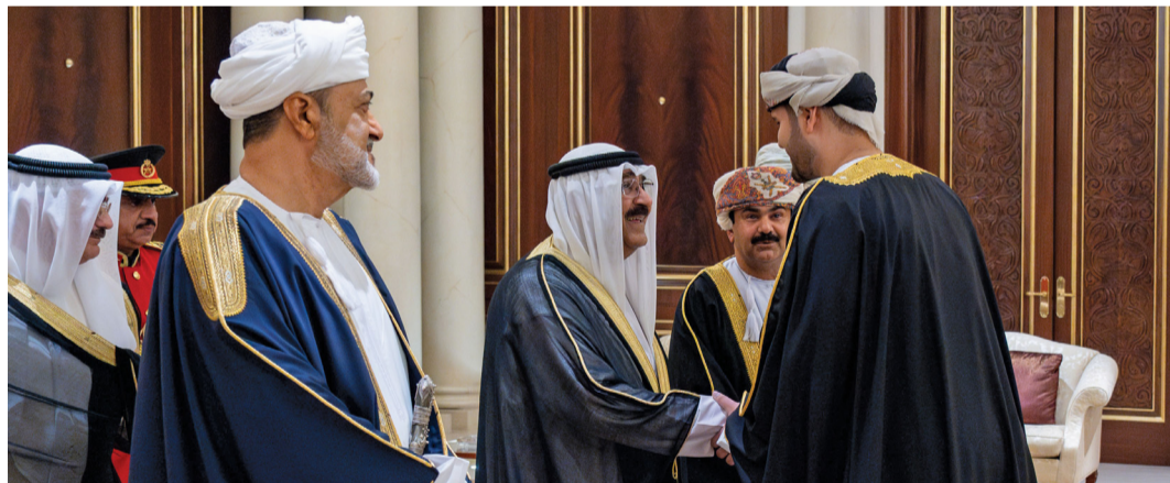
... ويصافح بلعرب بن هيثم

ولدى خروج الموكب المقل للقائدين من بوابة المطار الأميري حُفَّت به مجموعة من الدراجات النارية واصطفّت مجموعة من الأطفال على جانبي الطريق ملوّحين بالأعلام العمانية والكويتية في مشهد يجسد أواصر الأخوة والمحبة المتبادلة بين البلدين والشعبين الشقيقين، كما حلقت في الأجواء طائرتان عموديتان تحمّلان عُلمي البلدين.