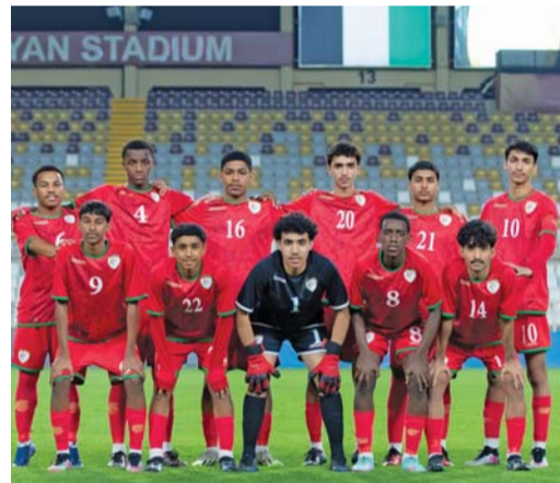
منتخبنا الوطني للناشئين لكرة القدم