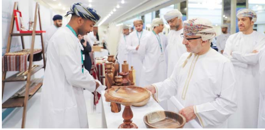
تبنى القيمة المحلية في القطاع السياحي يتماشى مع المعايير التي وضعها المجلس العالمي للسياحة