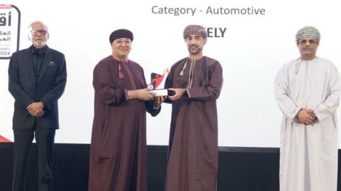
التكريم يعزز من مكانة جيلي في سلطنة عمان

لتلبية الاحتياجات والتفضيلات المتغيرة، وبالتالي تعزيز رضا العملاء ومع هذا الإنجاز الأخير وقاعدة المستهلكين المتنامية في سلطنة عمان تؤكد جيلي من جديد التزامها بفهم وتوقع احتياجات عملائها، مما يضمن بقائها في طليعة صناعة السيارات.