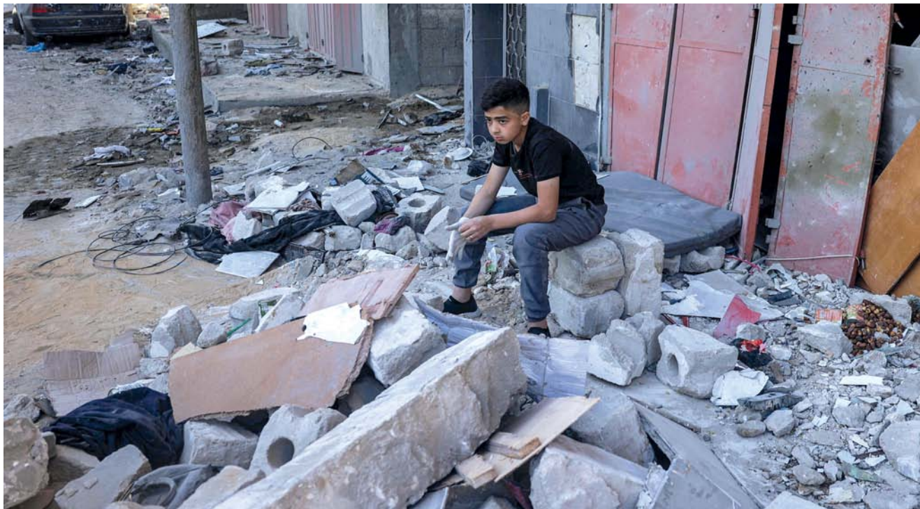
صبي يجلس وسط الأنقاض في موقع مبنى تعرض للقصف الإسرائيلي في رفح بجنوب قطاع غزة.

والتجمع في المنطقة الواقعة على الحدود مع مصر».