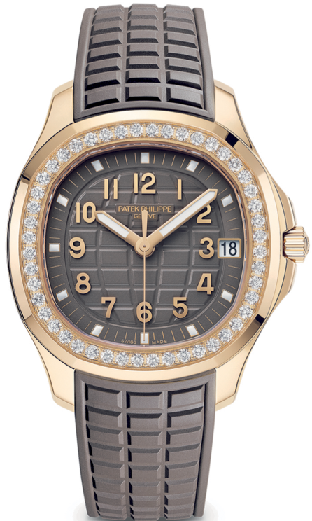
5268/200R LUCE AQUANAUT كود رقم

Patek Philippe Boutique at القرم Al-Qurum MUSCAT · 22009991