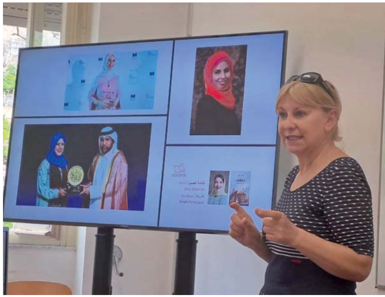
المحاضرة أضاءت روائع إبداعية لكتّاب عمانيين

عمان . العمانية: أكد المؤتمر العلمي الدولي الـ ١٥ الذي حمل عنوان (التراث السياسي عند العمانيين بين التخطيط والتطبيق) ونظمته جامعة آل البيت ممثلة في وحدة الدراسات العمانية بالتعاون مع وزارة الأوقاف والشؤون الدينية ممثلة بمكتب الإفتاء، فيتوصياته على عراقة التجربة السياسية العمانية وأصالتها