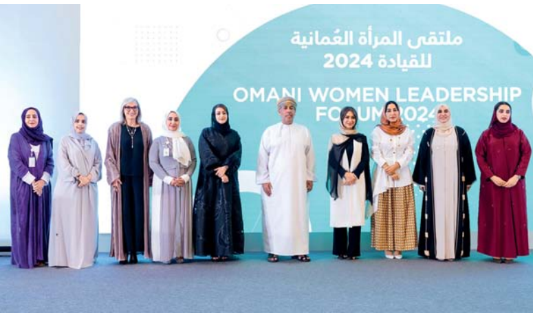
معاني البوسعيدية في صورة جماعية مع عدد من القيادات النسائية

التخطيط في وزارة التراث والسياحة إن تبني القيمة المحلية يتماشى بشكل وثيق مع المعايير التي وضعها المجلس العالمي للسياحة المستدامة ومعايير المعترف بها دولياً لممارسات السياحة المستدامة لا سيما في مجالات المشاركة المجتمعية والحفاظ على الثقافة والفوائد الاقتصادية لأصحاب المصلحة المحليين. من خلال دمج القيمة داخل البلد في عملياتهم، يظهر أصحاب الفنادق التزامهم بالاستدامة وممارسات السياحة المسؤولة، مما يعزز جاذبيتها للمسافرين المهتمين بالبيئة والمجتمع. وأضاف: إن القيمة المحلية تثير إلى المنافع الاقتصادية المتولدة محلياً من خلال الأنشطة السياحية، بما في ذلك فرص العمل والمشتريات المحلية والإحتفاظ بالإيرادات داخل البلد. بالنسبة لأصحاب الفنادق، فإن تبني وتعزيز القيمة داخل البلد ليس مجرد قرار استراتيجي للأعمال التجارية فحسب، بل هو أيضا التزام بممارسات السياحة المستدامة التي تتماشى مع معايير الاستدامة العالمية. وبين أن تبني القيمة المحلية المضافة يوفر العديد من الفوائد لأصحاب الصناعة خاصة صناعة الفنادق والضيافة وذلك من خلال حصولهم على السلع والخدمات محلياً، والتي يمكن