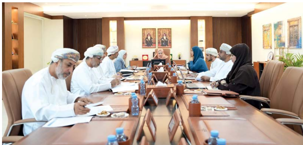
■ مجلس إدارة الهيئة أثناء اجتماعه أمس

الإنشاءات قطاع معزز للنمو الاقتصادي مع الإسهام الملموس لنشاط الإنشاءات في النمو الإجمالي للناجح المحلي، حيث شهد النشاط خلال عام ٢٠٢٣ نمواً بنسبة (٢) بالمائة مقارنة بعام ٢٠٢٢م، ليصل إسهامه في الناتج المحلي الإجمالي إلى (٣,٥) مليار ريال عُمانى. يكرس هذا القطاع الحيوي من دوره كمعزز للنمو مستفيداً من التطورات الاقتصادية الإيجابية التي شهدتها الاقتصاد العُماني. فقد جاءت عودة نشاط الإنشاءات للنمو معززة بالتطورات الاقتصادية والمالية الإيجابية في سلطنة عُمان، ومن خلال تقدم تنفيذ خطط التنويع الاقتصادي في الخطة الخمسية العاشرة، ونهج التوسع المنضبط في الإنفاق العام وما أتاحتها الاستقرار المالي من تعزيز للإنفاق التنموي وفق أولوية الاقتصاد والتنمية خلال المرحلة الأولى من تنفيذ «رؤية عُمان ٢٠٤٠». كما يستفيد نشاط الإنشاءات من التوجّه نحو اللامركزية وتنمية المحافظات، ودعم البنية الأساسية والخدمات في كل المحافظات. ويزيد قطاع الإنشاءات من دوره في تعزيز النمو من خلال الإجراءات والمبادرات التي تتبناها الحكومة مثل الاستفادة من المحتوى المحلي، وتطوير منظومة العقود الحكومية الموحدة، ومشروع تمويل سلاسل الإمداد، حيث عملت هذه المبادرات على دعم وتمكين القطاع الخاص، وتوسيع نطاق التعاون والشراكة بين القطاع العام والخاص. المحرر