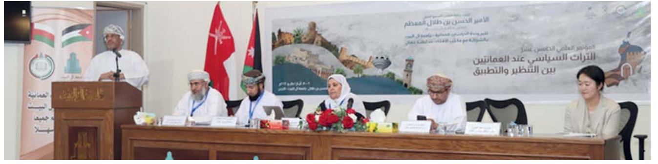
المؤتمر تضمن تسع جلسات على مدار يومين