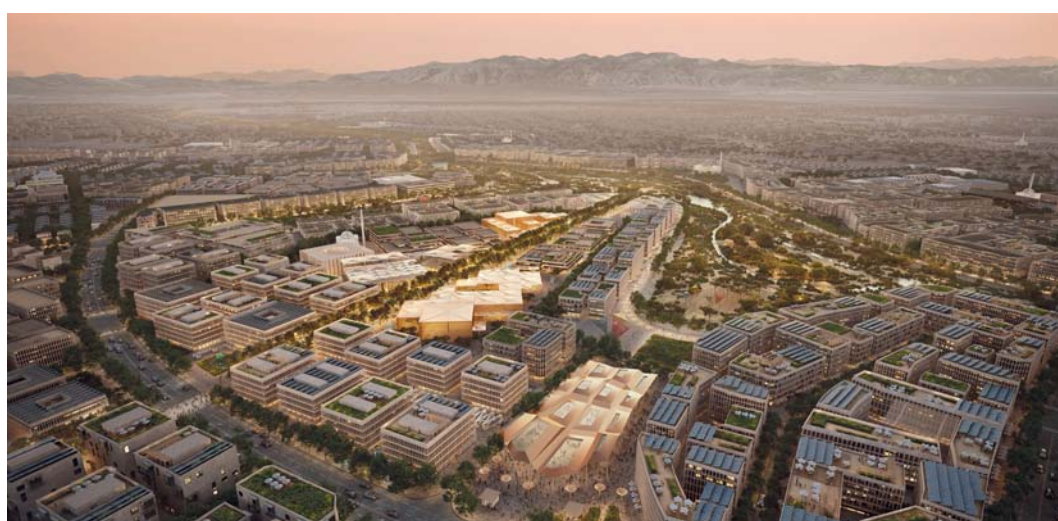
مشروعات التطوير العقاري فرصة واعدة للمستثمرين في ظل الحوافز والتسهيلات الحكومية المقدمة

وتبين الإحصاءات الصادرة عن المركز الوطني للإحصاء والمعلومات أن إجمالي قيمة التداول العقاري بسلطنة عُمان بلغ في الربع الأول من عام ٢٠٢٤م نحو ٥٨٧ مليوناً و٥٠٠ ألف ريال عُمان. وجاءت دولة الكويت الأعلى استثماراً في سلطنة عُمان من حيث الصفقات العقارية في العام الماضي ٢٠٢٣م، باستثمارات بلغت نحو ٢٦,٧ مليون ريال عُمان بعدد ٣١٩ تصرفاً عقارياً، ثم جمهورية الهند بنحو ١٢,٢ مليون ريال عُمان بعدد ٧٠ تصرفاً عقارياً، ثم دولة الإمارات العربية المتحدة بقيمة ٥,٣ مليون ريال عُمان بـ ٣١٩ تصرفاً عقارياً.