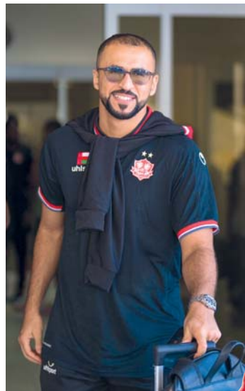
■ من وصول بعثة ظفار إلى خصب

كشف الاتحاد العماني لكرة القدم عن فعاليات مصاحبة للمباراة النهائية لل كأس الغالية ستقام في مشى خصب بدءا من اليوم وحتى نهاية المباراة، وستشمل مسابقات وجوائز للحضور، ألعاب ترفيهية للأطفال، ألعاب تفاعل إفتراضي، فرق فنون شعبية، كما منح الاتحاد فرصة للجماهير بالتصوير مع كأس البطولة، كما ستكون هناك ألعاب حركية، وتواجد عربات وأكشك طعام، إضافة إلى تواجد رابطتي تشجيع النادي وستؤديان عددا من الفقرات هناك، وستكون لعبة الزمن الجميل (لعبة القبة) بالحي الإداري الساعة الخامسة مساء اليوم. ■