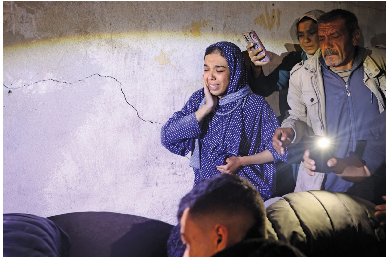
أفراد عائلة فلسطينية يطالعون فرق الدفاع المدني وهي تعمل على إنقاذ الضحايا من منزل عائلة قادري الذي تعرّض للقصف الإسرائيلي في رفح بجنوب قطاع غزة.

كثف جيش الاحتلال الإسرائيلي غاراته على رفح جنوب قطاع غزة، ما أدى لاستشهاد وجرح عدد من الفلسطينيين، في وقت تخوض فيه المقاومة اشتباكات ضارية مع جنود وأليات الاحتلال المتوغلة شرق المدينة. وقالت مصادر طبية فلسطينية إن جنامين (٣٥) شهيداً، و(١٢٩) مُصاباً وصلوا إلى المستشفى الكويتي في