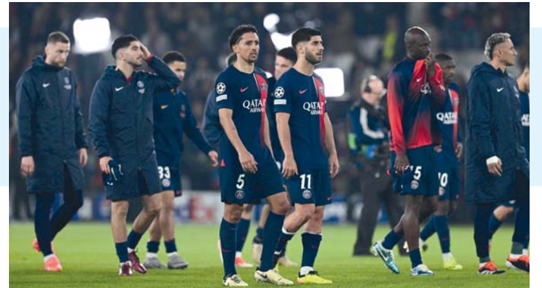
خروج حزين للاعبين باريس سان جيرمان أ.ف.ب

الرياض . د.ب.أ: يتطلع فريق الهلال لحسم لقب الدوري السعودي لكرة القدم (دوري روشن للمحترفين) حينما يستضيف الحزم يوم السبت المقبل، في الجولة الحادية والثلاثين من المسابقة. ويحتاج الهلال لنقطة واحدة من المباراة من أجل التتويج بلقب الدوري للمرة التاسعة عشرة في تاريخه، وقد يتوج الهلال بلقب الدوري قبل خوض اللقاء في حال خسارة النصر أمام الأخدود في المباراة التي تقام غدا الخميس. ويتواجد الهلال على قمة جدول الترتيب برصيد ٨٦ نقطة بفارق ١٢ نقطة أمام النصر. وسواء دخل الهلال مباراته أمام الحزم متوجا باللقب أو سيكون بحاجة لحصد نقطة للتتويج باللقب فإن الهلال لا يرغب في إفساد احتفالات جماهيره باللقب في هذه المباراة وسيسعى بكل قوته للفوز بها لكي يتم الاحتفال باللقب في سعادة.