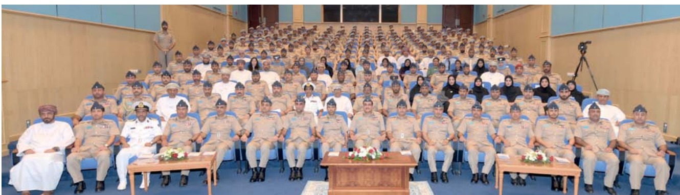
■ الحضور أثناء حفل التخريج

مسقط. العُمانيّة: احتفل أمس سلاح الجو السلطاني العُماني بتخريج طلبة المركز الجوي للتدريب التخصصي بقاعدة السيب الجوية برعاية اللواء الركن طيار خميس بن حماد الغافري قائد سلاح الجو مهنية ومدربة في تخصصات مختلفة، حاشا الخريجين على الاستفادة من المهارات والخبرات التي اكتسبوها، عقب ذلك تم تقديم عرض مرئي حول المركز وما يقوم به من مهام وأدوار تدريبية مختلفة. كما ألقى أحد الخريجين كلمة عبر فيها عن اعتزازه وزملائه الخريجين بتخرجهم من هذا الصرح التدريبي التخصصي، موضحاً الأدوار والجهود وما يتمتع به المركز الجوي للتدريب التخصصي