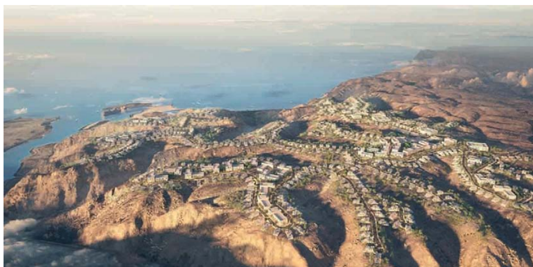
إسناد مخططات سكنية متكاملة بقيمة استثمارية بلغت ٥,٧ مليون ريال عُمان

التي يستطيع المستثمر الأجنبي العمل فيها وإمكانية الحصول على تسهيلات مالية وغيرها من المزايا الأخرى، للحصول على سنوات الإقامة تراوح بين ٥ و١٠ سنوات ضمن برنامج إقامة مستثمر. وأوضح أن القطاع العقاري في سلطنة عُمان يشهد نمواً ملحوظاً؛ حيث حقق حجم التداول في عام ٢٠٢٣م نمواً بنسبة ٦ بالمائة مقارنة بعام ٢٠٢٢م، متوقعاً أن يحافظ هذا النمو على معدلاته خلال المرحلة المقبلة نتيجة لحجم المشروعات الكبيرة التي تم الإعلان عنها والبدء الفعلي في مشروع مدينة السلطان هيثم التي تتيح فرصاً عديدة للمستثمرين والمطورين العقاريين.