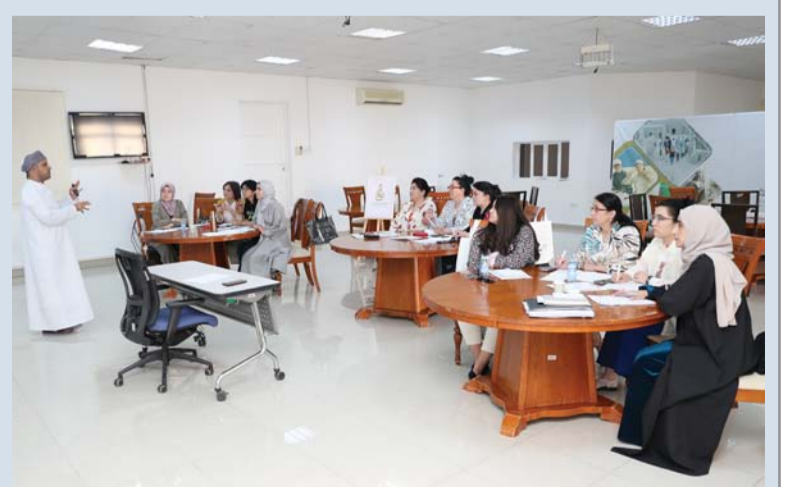
■ الدورة تستمر حتى ٣٠ من مايو الجاري

انطلقت بمعهد السلطان قابوس لتعليم اللغة العربية للناطقين بغيرها بولاية منح الدورة الثانية من برنامج (تدريب معلمي اللغة العربية للناطقين بغيرها) التي يشارك فيها عشرة من أوزبكستان، بالتعاون مع عدد من الجامعات الأوزبكية منها جامعة طشقند الحكومية للدراسات الشرقية، وأكاديمية أوزبكستان الإسلامية الدولية، وجامعة الصحافة ووسائل الإعلام، وجامعة أوريينتل الخاصة بطشقند والتي تستمر حتى ٣٠ من مايو الجاري. ويهدف البرنامج التدريبي إلى تطوير مهارات معلمي اللغة العربية للناطقين بغيرها، وتمكينهم من تدريسيهم وفق الأسس العلمية، وخدمة اللغة العربية عالمياً. إضافة إلى تطوير المهارات التطبيقية لدى معلمي اللغة العربية لغير ناطقيها في استعمال الأدوات والتقنيات المناسبة لتعليمها. يقدم خلال الدورة عدداً من الموضوعات منها نظريات وطرق تعلم وتعليم اللغات الأجنبية، والأطر المرجعية في تعليم اللغة العربية للناطقين بغيرها، وكذلك تدريس مهارات واستراتيجيات وأساليب ومناهج اللغة العربية. كما سيتعرف المشاركون خلال هذا البرنامج التدريبي على كيفية إعداد الامتحانات واستبانات التقويم بالإضافة إلى الجلسات النقاشية والحوارية والأنشطة التطبيقية والتدريس المسبق، وحضور حصص في المعهد، وزيارات للمدارس في محافظة الداخلية للاطلاع على النظام التعليمي وتعليم اللغة العربية بشكل خاص.