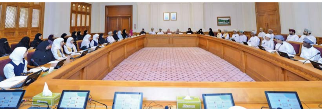
الاجتماع يناقش قضايا الطفل وطرق الاستماع إليها

العربي خلال اجتماع اللجنة عرضاً حول تجربة أطفال عُمان في برلمان الطفل العربي، وأهمية وجود برلمان الطفل المختلفة لتمكين القطاعات المعنية لتحقيقه.