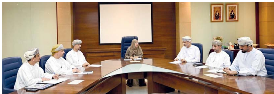
لجنة التدريب الخاص أثناء اجتماعها السُداس أمس

مسقط . العُمانية: عقدت لجنة التدريب الخاص أمس اجتماعها السادس برئاسة سعادة الدكتورة منى بنت سالم الجرذانية وكيلة وزارة التعليم العالي والبحث العلمي والابتكار للتدريب المهني. ونقاش الاجتماع الموقف التنفيذي لأعمال اللجنة منها التشريعات والدبلوم المهني والابتعاث في المؤسسات التدريبية الخاصة والمنح والفرص التدريبية المقدمة من الشركات والجهات المانحة.