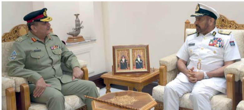
عبدالله الرئيسي أثناء لقائه منير الدين غلام الدين

كبار الضباط بسلاح الجو السلطاني العُماني، والملحق العسكري بسفارة جمهورية باكستان الإسلامية بمسقط. من جانب آخر، استقبل الفريق الركن بحري عبدالله بن خميس الرئيسي رئيس أركان قوات السلطان المسلحة أمس بمركز الأمن البحري بمعسكر المرتفعة وفد كتيبة الدفاع الوطني بجمهورية بنجلاديش الشعبية برئاسة الفريق محمد سيف العلم أمير كتيبة الدفاع الوطني بجمهورية بنجلاديش الشعبية. وقد رُحِبَ الفريق الركن بحري رئيس أركان قوات السلطان المسلحة بالضيف الزائر، وتم خلال المقابلة تبادل وجهات النظر، إلى جانب مناقشة عدد من الموضوعات المختلفة. حضر المقابلة العميد الركن حامد بن عبدالله البلوشي مساعد رئيس الأركان للعمليات والتخطيط.