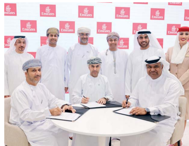
«اكتشف عُمان» ومطارات عُمان يوقعان مذكرة تفاهم مع «طيران الإمارات»