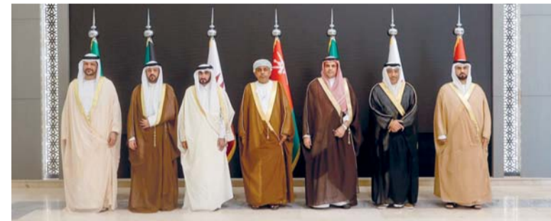
صورة جماعية للمشاركين في اجتماع لجنة المؤسسات العقابية والإصلاحية

التعاون لدول الخليج العربية بمدينة الرياض في المملكة العربية السعودية. جرى خلال الاجتماع استعراض عدد من الموضوعات ذات الصلة بتعزيز التعاون المشترك في مجال المؤسسات العقابية والإصلاحية وتأهيل النزلاء ورعايتهم.