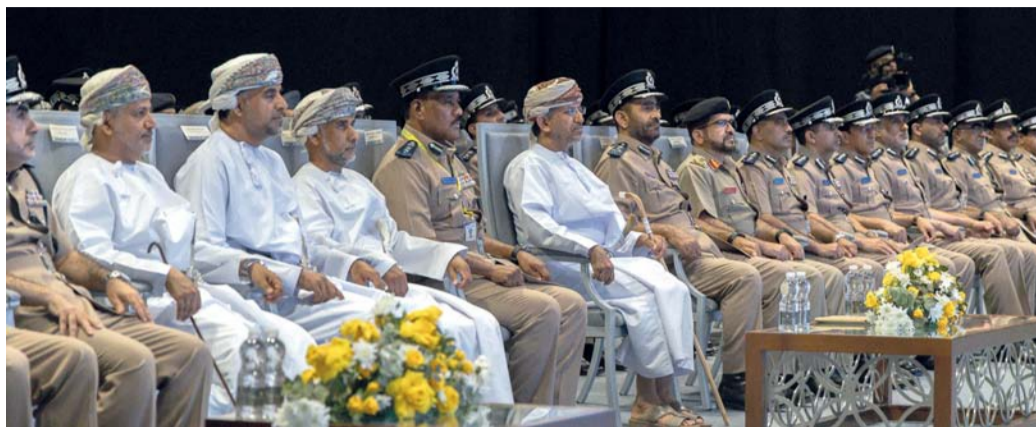
الحضور أثناء ختام المؤتمر

وقد انبثق عن المؤتمر العديد من التوصيات التي من شأنها حماية الأرواح والممتلكات أهمها تعزيز موارد هيئة الدفاع المدني والإسعاف