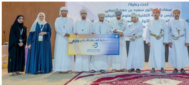
■ وفرع جامعة صحار يحصد المركز الثاني