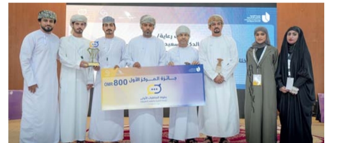
■ فرع جامعة شحار يتوج بالمركز الأول