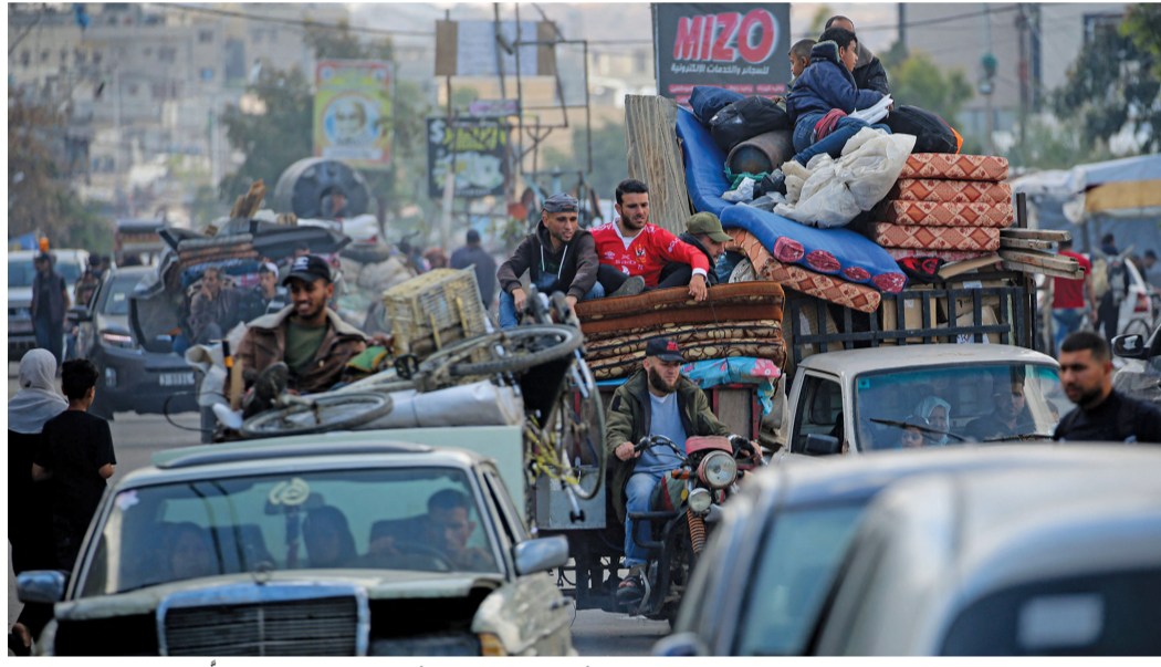
نازحون فلسطينيون يتكئون رفح حاملين أمتعتهم إلى مناطق أخرى في جنوب قطاع غزة.