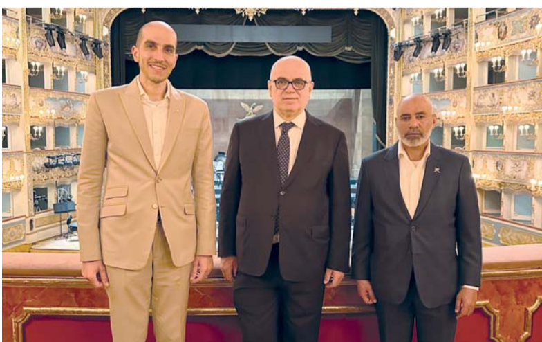
■ الزيارة تضمنت رسم استراتيجيات مستقبلية وعقد اتفاقيات لمزيد من التعاون بين الدارين