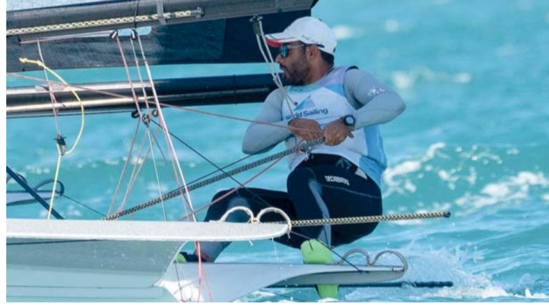
بطولات عالمية استضافتها سلطنة عمان

وأشار إلى أهم الفعاليات التي نظمتها عُمان للإبحار، والتي تمثلت في دعم استضافة سلطنة عُمان لكأس العالم لخماسيات الهوكي ٢٠٢٤ بالتعاون مع الاتحاد العماني للهوكي ووزارة الثقافة والرياضة والشباب، ودعم تنفيذ النسخة الثالثة عشرة من طواف عُمان ٢٠٢٤ بالتعاون مع الاتحاد العماني للدرجات الهوائية ووزارة الثقافة والرياضة والشباب، والنسخة الثانية من كأس عُمان للجولف ٢٠٢٤ في تنظيم المؤتمر الصحفي بالتعاون مع وزارة الخارجية.