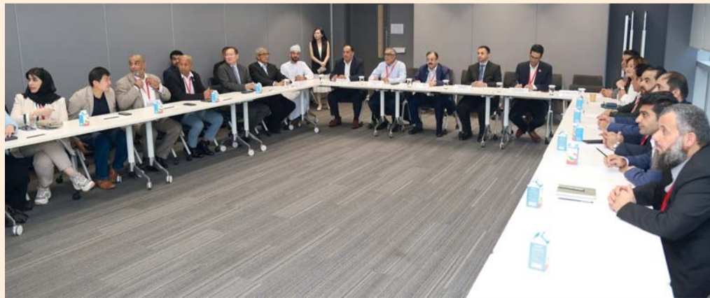
الجانبان العماني والسنغافوري خلال أحد اللقاءات

دبي. العماني: أعلنت وزارة التراث والسياحة أمس ضمن مشاركتها في معرض سوق السفر العربي ٢٠٢٤، عن الباقات والحزم السياحية لولاية صور عاصمة السياحة العربية ٢٠٢٤. وأعرب الدكتور وليد علي الحناوي الأمين العام المساعد للعمليات والإعلام في المنظمة العربية للسياحة عن أمله في أن تحقق ولاية صور نجاحات في العام ٢٠٢٤، وتكون محطة رئيسية للسياحة العربية والعالمية، متمنياً إلى أن ولاية صور تتميز بالسياحة البحرية والبيئية. وقال إن مجال السياحة في سلطنة عُمان يشهد تطوراً كبيراً بفضل الجهود المبذولة من قبل المعنيين بهذا المجال، والتي يتوقع أن تحقق عوائد كبيرة في أعداد السياح خلال المرحلة المقبلة. وأوضح أن المدينة الفائزة بلقب عاصمة السياحة العربية تحقق عادة زيادة في أعداد السياح مقارنة بالأعوام الماضية تتعدى الـ ٥٠ بالمائة، مضيفاً أن هناك برنامج تعاون بين المنظمة ووزارة التراث والسياحة وسيتم تنفيذ عدة فعاليات في الفترة القادمة تتضمن دورات وحلقات عمل تدريبية ومجموعة متنوعة من الأنشطة السياحية.