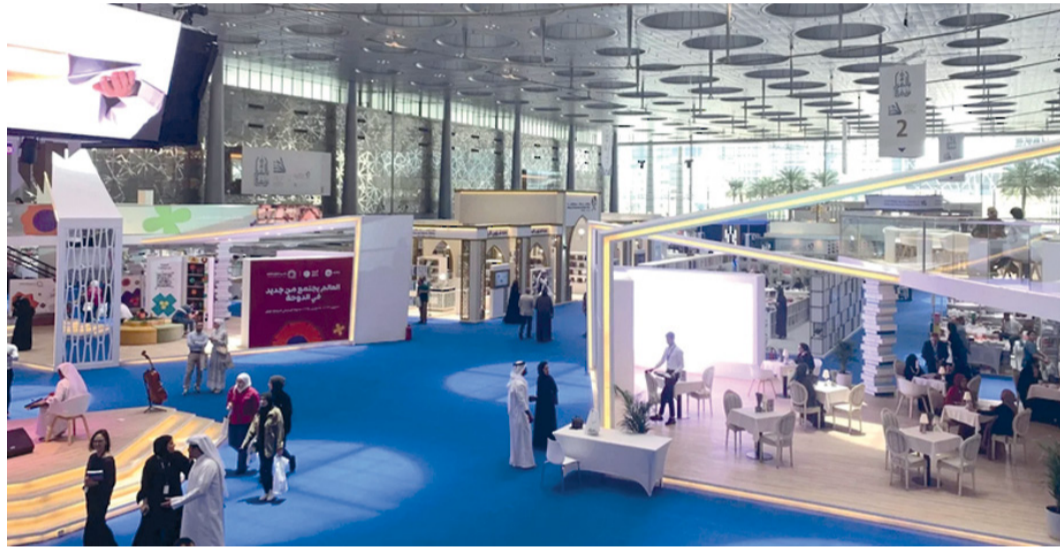
■ الجناح العماني استوحى تصاميمه من قصر العلم العام

الدولي للكتاب لعام ٢٠٢٣، والتي بكل تأكيد فتحت أفقاً أخرى نحو استضافات أخرى، وتعاونات مُتمرة تمثلت في توقيع اتفاقيات مختلفة بما يحقق الفائدة للمشهد الثقافي في سلطنة عُمان وتبادل الخبرات الثقافية والزيارات في دول العالم المختلفة. وتشارك الأوركسترا السيمفونية السلطانية العمانية بمقطوعات موسيقية مصاحبة بمركز الدوحة للمعارض والمؤتمرات، وتأتي مشاركتها تأكيداً على الثراء الثقافي والحضاري لسلطنة عُمان، وترسيخاً للتعاون والروابط الثقافية بين البلدين الشقيقين، وستقدم الأوركسترا السيمفونية السلطانية العمانية خلال مشاركتها العديد من المقطوعات الموسيقية الوطنية، وتصاحب جناح سلطنة عُمان في معرض المعارض الدولية للكتاب معارض مختلفة، أهمها معرض للترويج السياحي الذي يمكن من خلاله التوعية والتعريف بالمقومات السياحية والثقافية والتاريخية لسلطنة عُمان، ومعرض لـ مخطوطات عمانية نادرة طبق الأصل، ومعرض للتصوير الضوئي مشترك مع جمعية التصوير القطرية، إضافة إلى عروض مرئية متنوعة للمؤسسات الحكومية المشاركة، وتقنية الفار (VR)، وسيحتوي على عروض مجموعة من العناصر الثقافية المسجلة في القائمة العالمية للتراث الثقافي غير المادي.