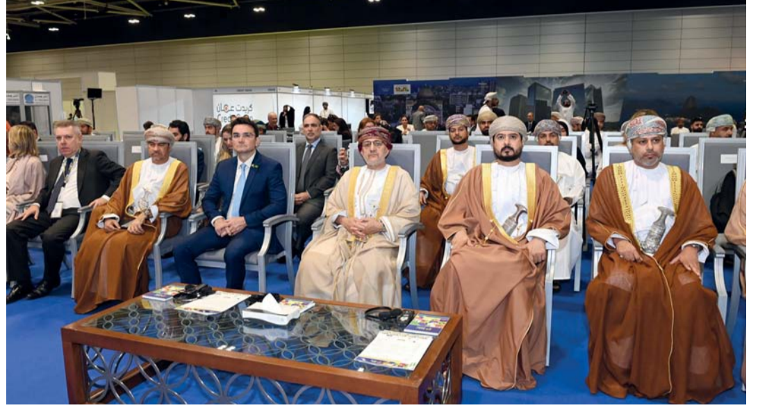
المنتدى أكد على ضرورة تعزيز الشركات الحقيقية في مختلف الجوانب الاستثمارية والاقتصادية.

مجموعة الأهداف الواسعة التي يسعى المنتدى لتحقيقها، فإنه يمثل فرصة مهمة لجذب الاستثمارات الأجنبية لكلا البلدين، وتحقيق التعاون ونقل المعرفة في مختلف القطاعات، وإقامة شراكات بين الشركات العمانية والبرازيلية. وتضمن المنتدى معرض متعدد القطاعات ومخصص للمنتجات والخدمات البرازيلية (صنع في البرازيل) بمشاركة عدد من الشركات البرازيلية والمصانع البرازيلية لعرض وبيع منتجاتها بالإضافة إلى إستكشاف الفرص المتاحة بالسوق العماني وكيفية الاستفادة من المناطق الحرة الموجودة في سلطنة عُمان في عملية إعادة التصدير لدول آسيا وشرق وشمال أفريقيا، كما يصاحب المنتدى عقد لقاءات ثنائية بين أصحاب الأعمال العمانيين ونظرائهم من البرازيل.