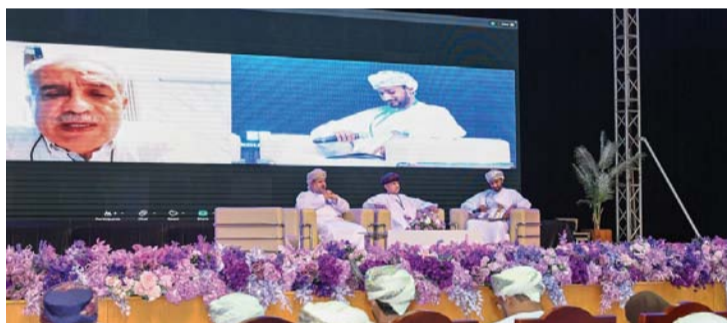
الملقى أكد على أهمية قضايا الاتصال والإعلام

صلالة العُمانية: نظمت جامعة التقنية والعلوم التطبيقية بصلالة ممثلة بقسم الاتصال الجماهيري بكلية الصناعات الإبداعية أمس بجمع السُلطان قابوس الشبابي للثقافة والترفيه بصلالة منتدى «مستقبل الاتصال والإعلام في عصر التكنولوجيا والذكاء الاصطناعي»: (الاتجاهات والتحديات) برعاية المكرّم سالم بن مسلم قطن نائب رئيس مجلس الدولة.