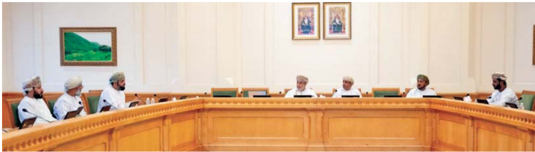
اللجنة الصحية والاجتماعية بمجلس الشورى أثناء لقائها بالخبراء أمس

والتعدين لصخور الأفيولايت، كما تطرقوا إلى الأضرار البيئية والجوفيزيائية الناجمة عن عملية التعدين في صخور الأفيولايت. واستعرضت اللجنة في إطار دراستها لذات الموضوع، المذكرة الواردة من مكتب المجلس حول طلب الإحاطة المقدم بشأن تعدين الكربون في سلطنة عمان. جدير بالذكر أن رئيس اللجنة كان قد التقى بياناً عاجلاً خلال الجلسة الاعتيادية السابعة تطرق خلاله لموضوع «مشروع حفر وحقق