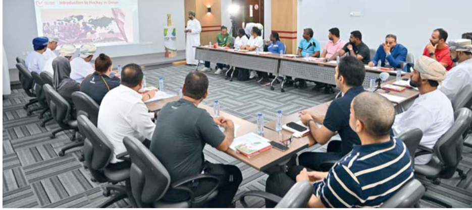
المقاء بين المدارس واتحاد الهوكي