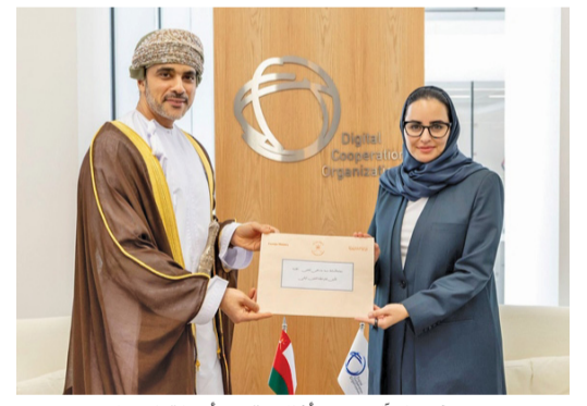
فيصل آل سعيد أثناء تقديم أوراق اعتماده