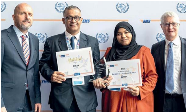
خدمات البريد السريع في سلطنة عُمان شهدت تطوراً ملحوظاً لتصبح خدمة عالمية المستوى

استعرضت صباح يوم أمس بمقر وزارة الثروة الزراعية والسمكية وموارد المياه بالخوير أوجه التعاون القائمة في قطاعات الثروة الزراعية والسمكية وموارد المياه، وفي مجالات الثروة السمكية والاستزراع السمكي والأمن الغذائي والتعاون العلمي والبحثي، وتبادل الخبرات بين سلطنة عمان ودولة قطر وأفاق تطويرها وسبل تعزيز التعاون خلال الفترة القادمة، وذلك خلال لقاء عقد بين معالي الدكتور سعود بن حمود بن أحمد الحبيسي وزير الثروة الزراعية والسمكية وموارد المياه مع سعادة المهندس عبد الله بن حمد بن عبد الله العطية وزير البلدية في دولة قطر والوفد المرافق له والذي يزور سلطنة عمان خلال الفترة الحالية. وقد حضر