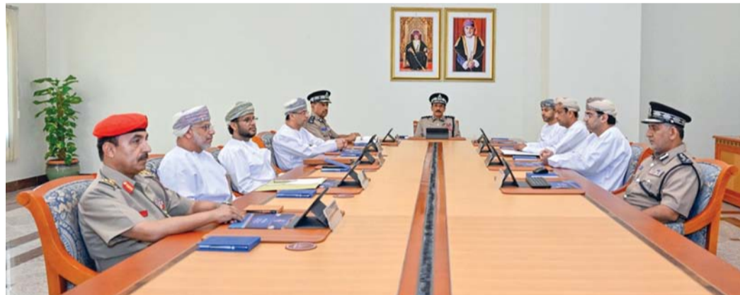
■ اللجنة الوطنية للسلامة على الطريق أثناء اجتماعها أمس

مسقط . العُمانية: عقدت اللجنة الوطنية للسلامة على الطريق أمس اجتماعاً لها برئاسة معالي الفريق المفتش العام للشرطة والجمارك بمبنى الإدارة العامة للمرور في ولاية السيب. جرى خلال الاجتماع استعراض الإحصاءات السنوية للوضع المروري في سلطنة عُمان وجهود معاهد السلامة المرورية بالمحافظات في توعية مختلف فئات المجتمع، وإطلعت اللجنة على المؤشرات ونتائج الدراسات المتعلقة بالسلامة المرورية مثنئة دور الجهات المعنية في هذا الجانب. وأشادت اللجنة بوعي المجتمع وتعاون المواطنين والمقيمين وحرصهم على التقيد بالاشتراطات وقواعد المرور التي أسهمت في تحقيق مستوى عالٍ من السلامة على الطريق.