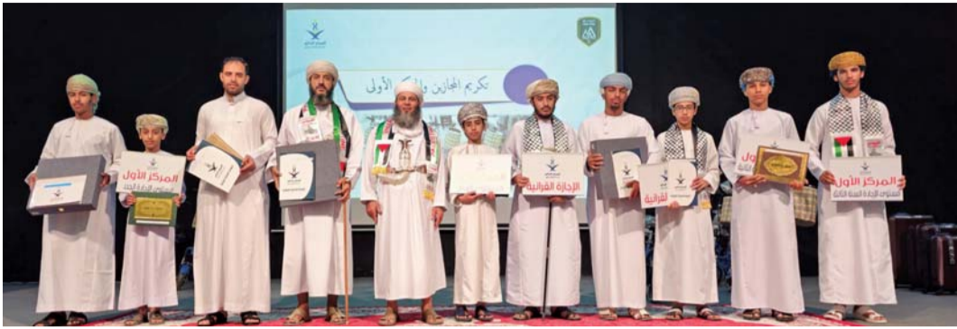
الطلبة المكرمون بمركز فرق للقرآن الكريم