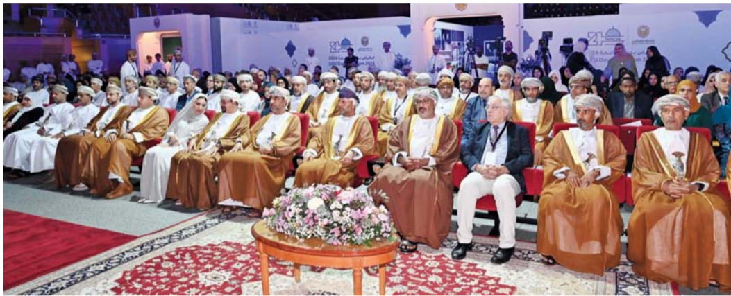
الحضور أثناء الاحتفال

وتخلل الحفل إقامة معرض تضمن عرض نتاجات البحوث العلمية التي يقوم بها باحثو الجامعة من مختلف وسائل الدعم المتاحة، كما تضمن المكتبة العلمية للكتب والمجلات ومصادر التمويل المختلفة وركن المشاريع البحثية (ركن خاص بالمشاريع الاستراتيجية، الدعم السامي) بجوي ٩ مشاريع بحثية وركن الابتكار ونقل التكنولوجيا ومحطة التجارب الزراعية (VR) بالإضافة إلى الحديقة النباتية (VR). ويشتمل المؤتمر الذي يستمر ثلاثة أيام على عدد من الجلسات، منها: (دعم رؤية عمان ٢٠٤٠) وتحليل النمو الاقتصادي من خلال البحث العلمي والابتكار) و(ديناميكيات التطور التكنولوجي والتحول الرقمي).