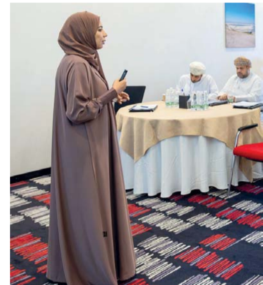
الحلقة تطرقت إلى مفهوم الفعاليات والمؤتمرات وأنواعها

نظم مكتب محافظ شمال الباطنة بولاية صحار حلقة تدريبية بعنوان: (كيفية إدارة وتنظيم خطط التغيير المؤسسي). أقيمت الحلقة بفندق راديسون بلو صحار، حيث استهدفت الحلقة موظفي المكتب بمختلف التخصصات الإدارية والفنية وتهدف إلى تزويد المشاركين بالمهارات والأدوات اللازمة لتخطيط وتنفيذ عمليات التغيير في المؤسسات بشكل فعال، والتعرف على كيفية التخطيط للفعاليات والمؤتمرات وتكنولوجيا التحول الرقمي المستخدمة في إدارتها. وتضمنت الحلقة التدريبية عدداً من المحاور منها مفهوم الفعاليات والمؤتمرات وأنواعها والهدف من الفعالية أو المؤتمر والذي يتلخص في تعزيز التواصل وبناء العلاقات المهنية بين المشاركين وتوفير منصة تبادل المعلومات والخبرات في مجالات معينة، كما تطرقت الحلقة إلى خطوات تنظيم المؤتمر أو الفعالية، وأهمية التخطيط لضمان نجاح الفعالية أو المؤتمر وتحقيق الأهداف المرجوة، بالإضافة إلى التعرف على مفهوم التحول الرقمي والهدف من استخدام التكنولوجيا الرقمية لتغيير ثقافة وهيكلة العمل وتحقيق تجارب أفضل للعملاء، كذلك تم التطرق إلى تقنيات التحول الرقمي في إدارة الفعاليات والمؤتمرات بنجاح مثل تقنية الذكاء الاصطناعي المتمثلة في (CHAT GPT) من خلال التخطيط للفعالية وصياغة المحتوى وكتابة ومراجعة البريد الإلكتروني وإعداد مادة للبرنامج، كذلك لفهم احتياجات الجمهور وإدارة المشاركين وجمع المعلومات واستطلاع الرأي وقياس الأداء وتحليل البيانات واستخراج تقارير فورية، واستخدام Zoom وتنظيم اجتماعات افتراضية ومشاركة المحتوى والعروض التقديمية وتسجيل وإدارة الفعاليات. وتطرقت الحلقة أيضاً إلى التسويق الرقمي في إدارة المشاركين وأدوات التسويق الرقمية للفعاليات والمؤتمرات وتقنية الواقع المعزز.