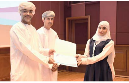
تكريم إحدى الطالبات