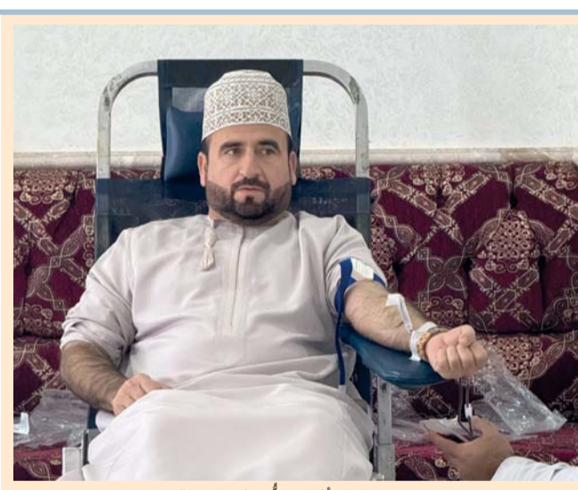
مواطن أثناء تبرعه في الحملة