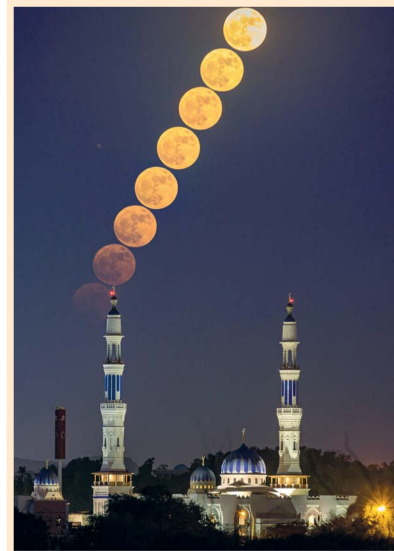
أروقة المعرض احتضنت أعمال متنوعة في الشكل والمضمون