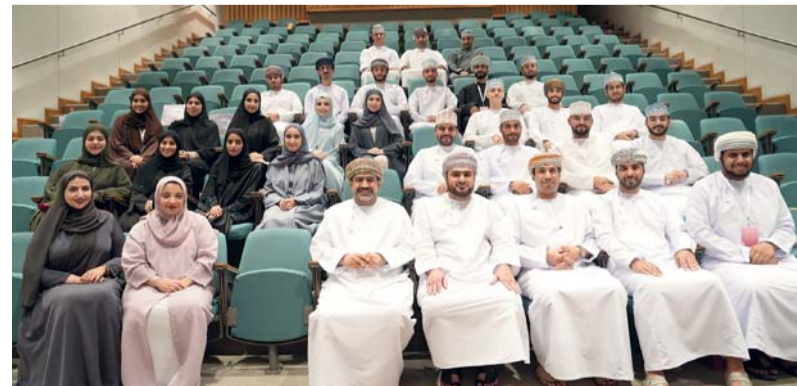
■ دوري المحاسبة فرصة مثيرة للمحترفين الطموحين في مجال الشؤون المالية