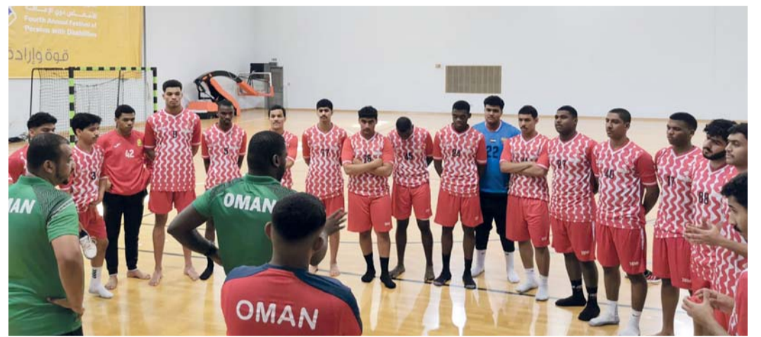
من تدريبات منتخبنا الوطني للشباب لكرة اليد

أوقعت قرعة البطولة الآسيوية الـ ١٨ لمنتخبات الشباب لكرة اليد التي تستضيفها المملكة الأردنية خلال الفترة من ١٦ إلى ٢٧ يوليو القادم تصفيات المؤهلة إلى كأس العالم التي ستقام في بولندا عام ٢٠٢٥ منتخبنا الوطني للشباب في المجموعة الثالثة بجوار منتخبات الأردن المستضيف والهند وضمت المجموعة الأولى البحرين والسعودية وهونغ كونغ والمجموعة الثانية الكويت وإيران والصين والمجموعة الرابعة اليابان وكوريا الجنوبية والصين تايبيه وقطر وسلطع