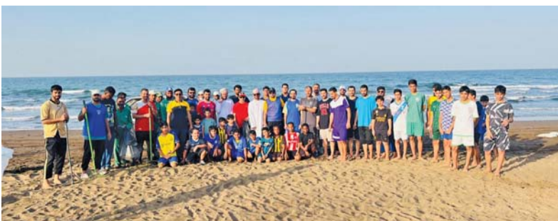
المشاركون في الحملة

نظمت في قرية أسرار بني سعد في ولاية شناص بمحافظة شمال الباطنة حملة تطوعية لتنظيف الشواطئ والقرى المجاورة لها بمشاركة أكثر من ١٠٠ متطوع من فريق الساحل وأهالي المنطقة بالتعاون مع دائرة البلدية بشناص والفرق التطوعية وفريق البحر التطوعي. تم خلال الحملة إزالة المخلفات التي سببها منخفض المطير وجريان الأودية. وقد أشاد المنظمون بالتفاعل المميز من قبل المجتمع والمتسبين للفريق، حيث أكد سيف السعدي