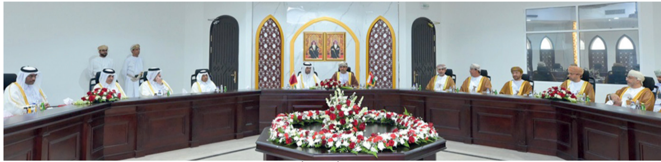
من جلسة المباحثات بين الجانبين العماني والقطري