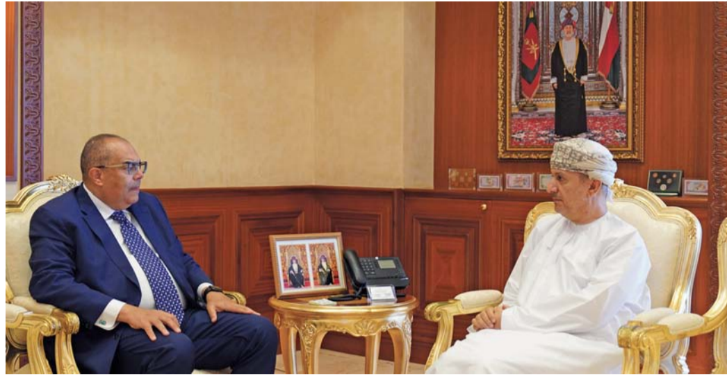
■ اللقاء بحث جهود سلطنة عُمان في التمويل الأخضر المستدام

مسقط - العمانية : استقبل معالي سلطان بن سالم الحبسي وزير المالية أسس بمكتبه، الدكتور محمود محيي الدين المدير التنفيذي بصندوق النقد الدولي؛ لمناقشة الموضوعات ذات الاهتمام المشترك. واستعرض الجانبان خلال المقابلة مستجدات توقعات النمو العالمي