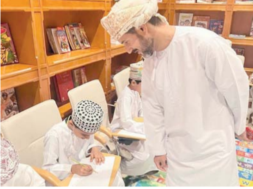
الفعالية أقيمت بمكتبة جامع السلطان قابوس بصحار