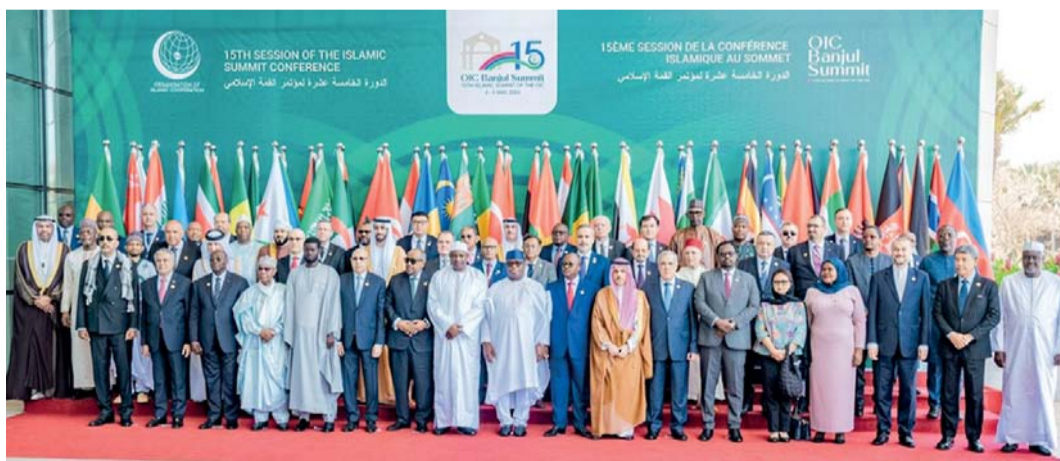
■ الوفود المشاركة في أعمال الدورة

المستمرة للقانون الدولي، وازدواجية المواقف لدى بعض الدول، وعجز مجلس الأمن التابع للأمم المتحدة عن تبني قرارات الاعتراف بدولة فلسطين، رغم الإجماع العالمي بحق الشعب الفلسطيني في تقرير المصير وإقامة دولته المستقلة. كما أكد معاليه على أن سلطنة عُمان تؤكد دوماً على موقفها الثابت في دعم القضية خلال اللقاءات الدولية والإقليمية وعلى جميع المستويات، وقد