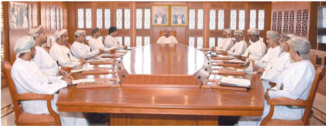
■ حمود البوسعيدي أثناء لقائه بالمحافظين

تعرضت له البلاد من المنخفض الجوي الأخير «المطير» كما ناقش الاجتماع الموضوعات المدرجة في جدول الأعمال والمتعلقة بعدد من الجوانب التنموية في المحافظات، وحثّ معالي المحافظين على ضرورة توظيف التقنية نهج اللامركزية تبسيطا للإجراءات، والأخذ بالمشاركة المجتمعية في تطوير العمل المؤسسي.