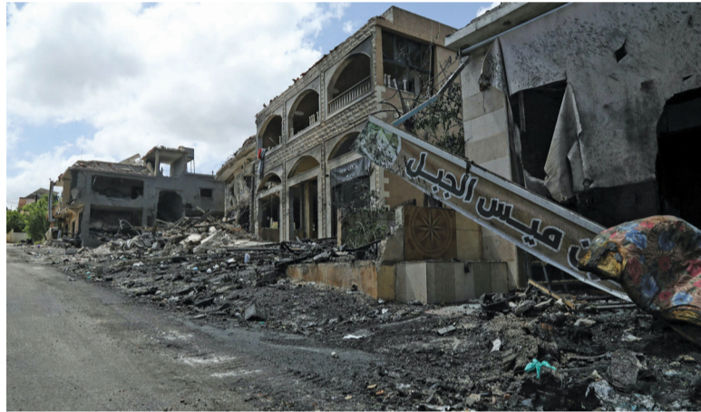
حطام حوّل المباني المتضررة من غارة إسرائيلية استهدفت قرية ميس الجبل الحدودية بجنوب لبنان.

مسقط - العُمانية: أعلنت جامعة السلطان قابوس عن البحوث (٧) الفائزة بالمنحة السامية للمشاريع البحثية الاستراتيجية لعام ٢٠٢٤، وذلك بمناسبة احتفال الجامعة بالذكرى الرابعة والعشرين لريوم الجامعة. تفاصيل: ص ٣