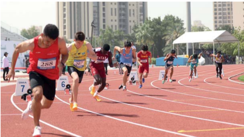
من مشاركة لاعبي منتخبنا في البطولة الآسيوية بدبي