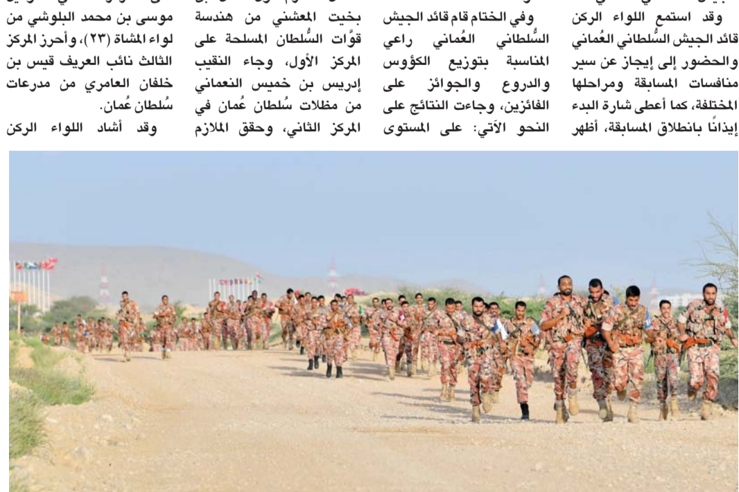
■ المتسابقون خلال المشاركة في المسابقة

مسقط. العمانية: ختم الجيش السلطاني العماني أسس مسابقة اختراق الضاحية بمشاركة (15) فريقاً يمثلون مختلف أويته وتشكيلاته ووحداته برعاية اللواء الركن مطر بن سالم البلوشي قائد الجيش السلطاني العماني. وقد استمع اللواء الركن قائد الجيش السلطاني العماني والحضور إلى إيجاز عن سير منافسات المسابقة ومراحلها المختلفة، كما أعطى إشارة البدء إيداناً بانطلاق المسابقة، أظهر