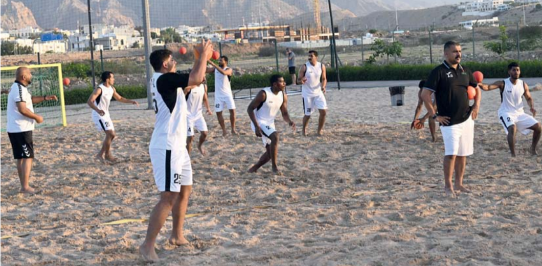
من تدريبات منتخبنا الوطني لكرة اليد الشاطئية