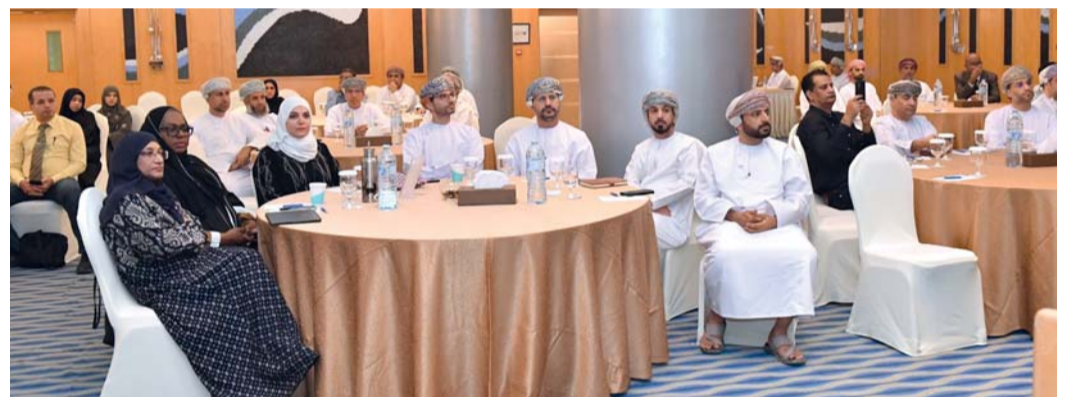
الحلقة هدفت إلى تحديث برنامج فحص اللياقة الطبية للوافدين