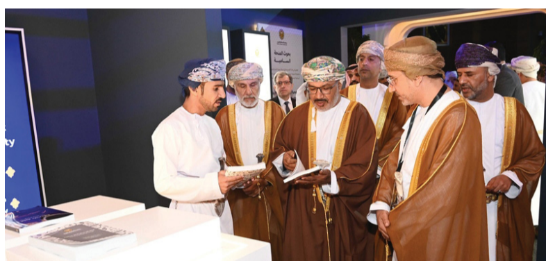
وأثناء الإطلاع على معرض البحوث العلمية

وتعزيز الرفاه المجتمعي. وأضاف أن المؤتمر يسعى إلى الارتقاء بمكانة الجامعة في الأوساط العلمية العالمية، في ظل الاهتمام البالغ من المقام السامي لحضرة صاحب الجلالة السلطان هيثم بن طارق المعظم - حفظه الله ورعاه - ودعمه المستمر للتعليم والبحث العلمي والابتكار. وأكد أن جامعة السلطان قابوس ماضية بخطى واثقة وعجزم لا يثنى للنهوض بالبحث العلمي، إيماناً منها بكونه استعماراً رابحاً، يقود إلى تنمية مستدامة مبنية على قواعد راسخة ومليئة لحاجات المجتمع وتطلعاته ورافدة له بأجيال من الشباب المسلحين بالعلم والمهارات المكنة في بناء مجتمع المعرفة، والمنافسة في أسواق العمل المحلية والعالمية. وأفاد أن المؤتمر يحظى بمشاركة من محدثين علماء ومفكرين وباحثين من داخل